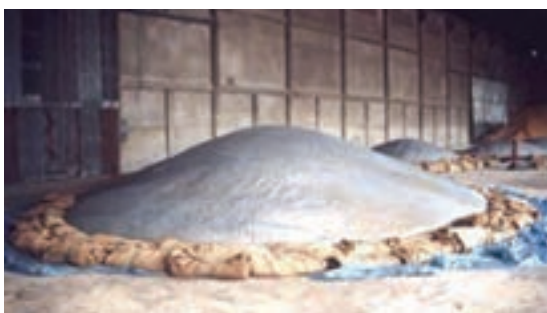
شکل ۲-۴- نحوه نگه‌داری مواد در انبار