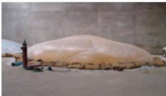
شکل ۳-۴- هوادهی مواد خوراکی

تا آلوده نبودن آن به حشرات، کنه‌ها و آفات محرز گردد. علاوه بر این حداقل هر هفته یک بار محتوی انبار را از نظر وجود احتمالی آفات و امراض بازرسی کنید و در صورت لزوم نمونه‌هایی از آن را برای آزمایش به آزمایشگاه بفرستید.