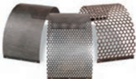
شکل ۳-۳ انواع غربال (توری)