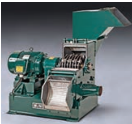
شکل ۲-۳ آسیاب چکشی