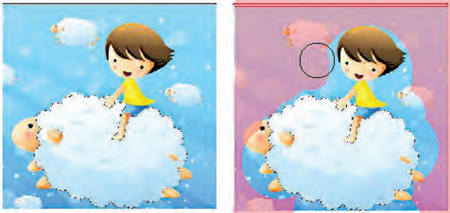
شکل ۴-۲۳ افزایش و کاهش ناحیه انتخاب با استفاده از Quick Mask

۶. گزینه Select | Deselect را برای خارج کردن ناحیه انتخاب شده از حالت انتخاب، کلیک کنید یا این‌که ناحیه انتخاب شده را ذخیره کنید.