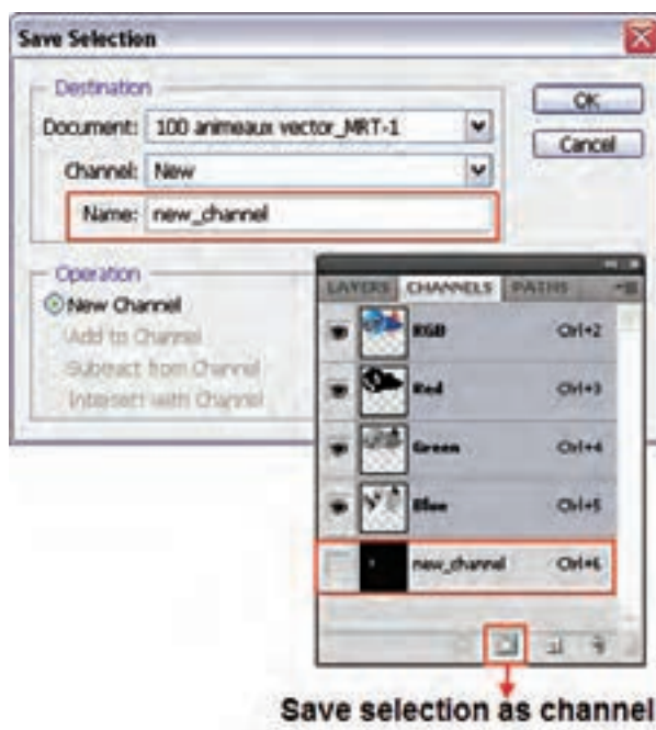
شکل ۲-۲۳ - نحوه ذخیره‌ی یک کانال

البته این عمل را می‌توان از دکمه Save selection as channel در پایین پالت کانال نیز انجام داد. توجه داشته باشید برای بارگذاری مجدد ناحیه انتخاب شده که در قالب کانال ذخیره شده است یا تمامی کانالهای آلفا می‌توان از منوی select و دستور Load selection استفاده کرد. (شکل ۲-۲۲)