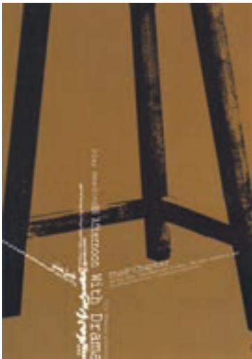
نمونه‌ی استفاده از ترکیب‌بندی مثلثی در یک پوستر (راس مثلث خارج از کادر واقع شده است.)

آثاری که دارای ترکیب‌بندی مثلثی هستند، عموماً از استحکامی استثنایی برخوردارند. هنرمندان رشته‌های مختلف هنری در بسیاری از موارد از استحکام و ساختار منسجم مثلث، برای ترکیب‌بندی سود برده و کیفیت آن‌را با نیاز تصویر مورد نظر خود منطبق کرده‌اند.