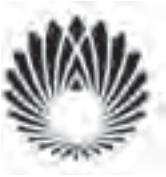
نشانه‌ی مجتمع همایش‌های بین‌المللی جمهوری اسلامی ایران طراح: علی خورشیدپور

در اثر، فقط نسبت به یک محور، تقارن وجود داشته باشد.