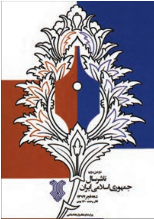
تعادل متقارن در اثر آقای مصطفی اسداللهی