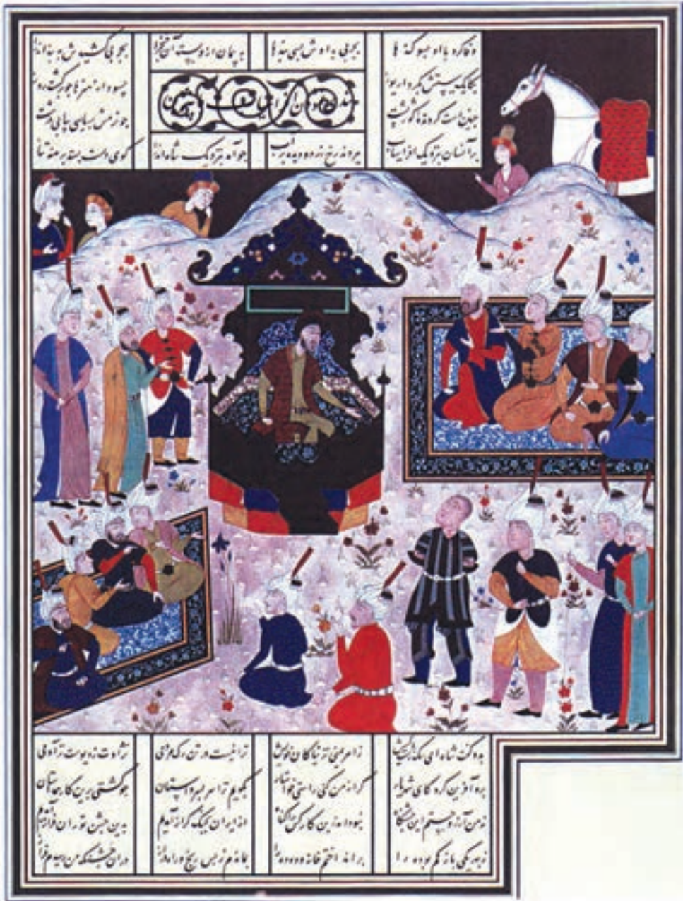
تعادل متقارن در نگاره شاهنامه بایسنغری

در تعادل متقارن، همه‌ی عناصر نسبت به محورهای عمودی، افقی و مورب کادر سنجیده می‌شوند. این نوع تعادل ایستا و نشان دهنده‌ی فضای بی تحرک و آرام است.