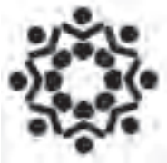
طراح: علی دوراندیش

در نشانه‌ی مقابل، نسبت به همه‌ی محورهایی که هنرمند در اثر خود در نظر گرفته است تقارن وجود دارد. این نوع تقارن را تقارن شعاعی می‌نامند.