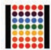
نشانه‌ی انجمن نقاشان ایران طراح: مرتضی ممیز

در اثر، نسبت به دو محور، تقارن وجود داشته باشد.