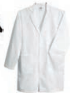
۱. روپوش سفید