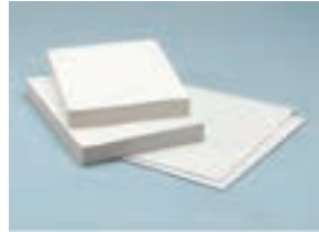
۳. کاغذ A۳ و A۴