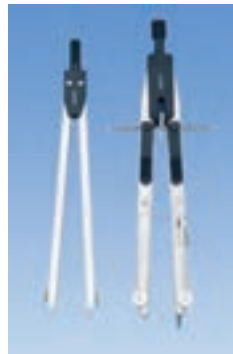
۱۱. پرگار معمولی و پرگار انتقال اندازه