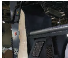
روش عبور با زنجیر