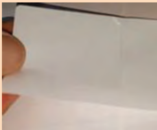
چسب نگهدارنده لبه رول

در این مکانیزم‌ها (بدون توقف): از انواع چسب‌ها استفاده می‌شود بعضی از این چسب‌ها که لیبیل می‌باشند در وسط دارای شکافی می‌باشند که این شکاف باید روی لبه کاغذ قرار گیرد. در نتیجه لبه کاغذ در چرخش رول با سرعت بالا باز نمی‌شود. ضمن اینکه برش چسب باعث می‌شود، لبه رول با کوچک‌ترین مقاومتی جدا و چسبیده شود.