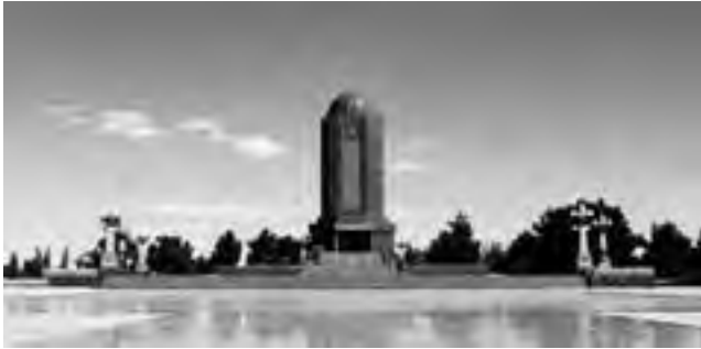
آرامگاه نظامی گنجوی

جمال‌الدین ابو محمد الیاس بن یوسف بن زکی بن مؤید، متخلص به نظامی و ملقب به حکیم نظامی (زاده ۵۳۵ هـ. ق در گنجه، درگذشته ۶۱۲-۶۰۷ هـ. ق) شاعر و داستان‌سرای ایرانی و پارسی‌گوی حوزه تمدن ایرانی در قرن ششم هجری (دوازدهم میلادی)، که به‌عنوان پیشوای داستان‌سرایی در ادب فارسی شناخته شده است. آرامگاه نظامی گنجوی در شهر گنجه در جمهوری آذربایجان فعلی قرار دارد.