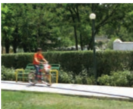
سرعت \frac{1}{8} ثانیه