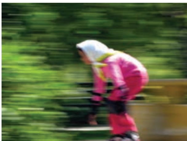
تصویر ۱۸-۵- اغراق در سرعت موضوع با انتخاب سرعت‌های پایین‌تر دوربین