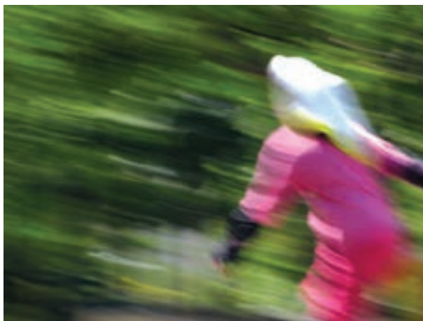
تصویر ۱۰-۵- کشیدگی تصویر

وقتی از اشیاء و اجسام متحرک که سرعت زیادی دارند عکس می‌گیریم باید متناسب با سرعت آنها، سرعت مسدودکننده را نیز بالا ببریم. مثلاً اگر قرار است از یک مسابقه اسب دوانی عکس بگیریم باید بدانیم که سرعت دوربین ما باید بالا و در حدود \frac{1}{1000} ثانیه باشد تا بتوانیم آنها را ثابت و دقیق نشان دهیم، به این کار منجمد کردن تصویر می‌گویند.