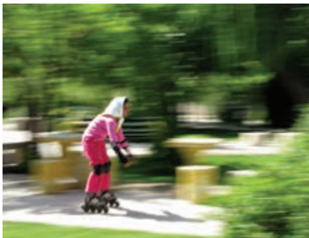
تصویر ۱۷-۵- روش پانینگ