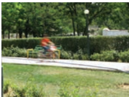
سرعت \frac{1}{4} ثانیه