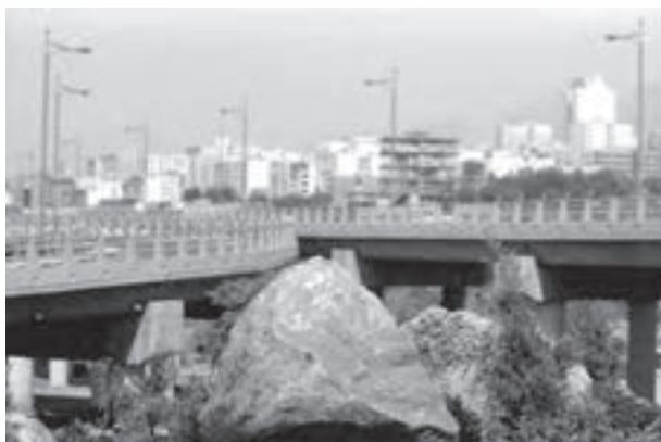
تصویر ۶-۵- لنز نرمال