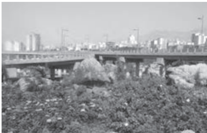
تصویر ۵-۵- لنز واید

سومین عاملی که در افزایش یا کاهش عمق میدان مؤثر است، فاصله کانونی لنزها است به این معنی که هر چه فاصله کانونی لنز کمتر باشد، عمق میدان وضوح بیشتر و هر چه فاصله کانونی بیشتر باشد عمق میدان وضوح کمتر خواهد شد، به عبارت ساده‌تر لنزهای واید دارای عمق میدان بیشتری نسبت به لنزهای تله هستند. (تصاویر ۵-۵ تا ۵-۷)