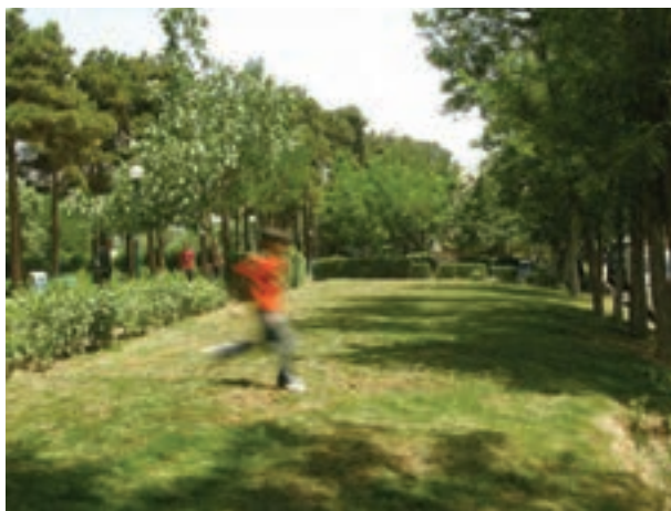
تصویر ۱۱-۵- حرکت موازی با دوربین