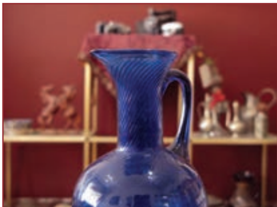
تصویر ۵-۲ — عکسی که با f.16 گرفته شده است.