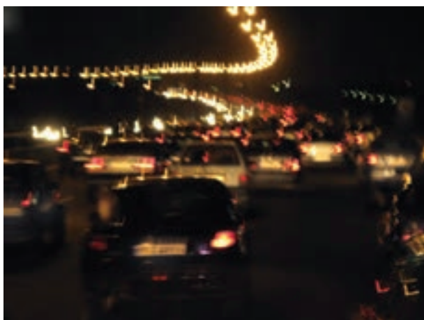
تصویر ۱۹-۵- تأثیر لرزش دست بر تصویر