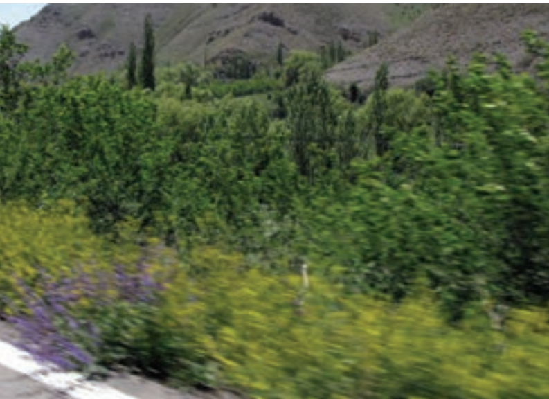
تصویر ۱۴-۵- موضوعات نزدیک کشیده شده‌اند اما موضوعات دور دست کاملاً واضح هستند.

گاهی اوقات ممکن است دوربین در حال حرکت و موضوع ساکن باشد. مثلاً تصور کنید که درون یک اتومبیل نشسته اید و از پنجره اتومبیل در حال عکسبرداری هستید، در این حالت هم کلیه قوانین ذکر شده در حالت اول صادق هستند و چه بسا شدیدتر. سعی کنید در چنین مواردی تا آن جا که ممکن است از لنزهای واید استفاده کنید و موضوعاتی را انتخاب کنید که فاصله بیشتری با شما دارند. (تصویر ۱۴-۵)