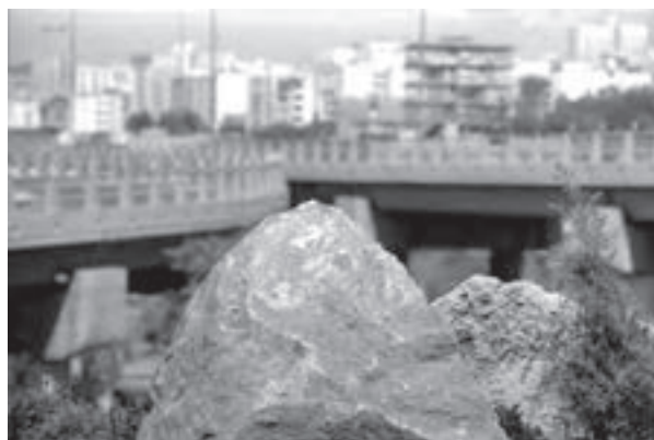
تصویر ۷-۵- لنز تله