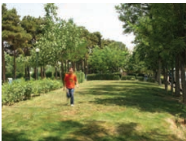
تصویر ۱۳-۵- حرکت عمود بر دوربین