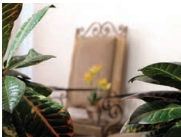
تصویر ۵-۳ — فاصله از اولین موضوع 5^\circ سانتی متر

برای استفاده از این خاصیت بعضی از اوقات به جای اینکه تنظیم فاصله را روی نقطه دورتری انجام بدهیم، فاصله خودمان را تا موضوع بیشتر می کنیم.