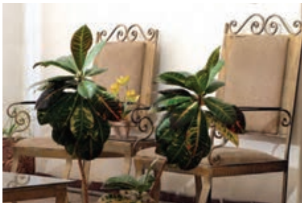
تصویر ۴-۵- فاصله از اولین موضوع ۱۵۰ سانتی متر