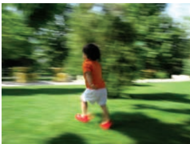
تصویر ۵-۱۵ — استفاده از کشیدگی باید کنترل شده باشد

مثلاً در عکاسی از مسابقات ورزشی گاهی اوقات اندکی کشیدگی هیجان محیط را بهتر منتقل می‌کند. مشروط بر آنکه حد درستی انتخاب شده باشد. کشیدگی بیش از حد تصویر نه تنها زیبا نیست بلکه باعث عدم شناسایی مکان و موضوع خواهد شد. (تصویر ۵-۱۶)