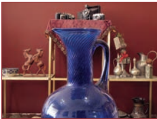
تصویر ۵-۱ — عکسی که با f.2.8 گرفته شده است.

مثلاً اگر با یک دیافراگم ثابت مثل f.8 یک بار روی موضوعی در 5^\circ سانتی متری دوربین واضح سازی کنیم و بار دیگر روی فاصله 15^\circ سانتی متری، خواهیم دید که عمق میدان وضوح در عکس دوم بسیار بیشتر از عکس اول است با این که دیافراگم در هر دو عکس یکی بوده است (تصاویر ۵-۳ و ۵-۴).