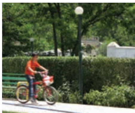
سرعت \frac{1}{15} ثانیه