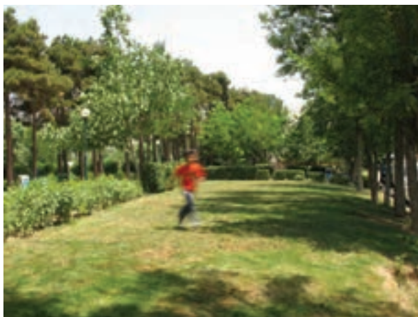
تصویر ۱۲-۵- حرکت مایل نسبت به دوربین