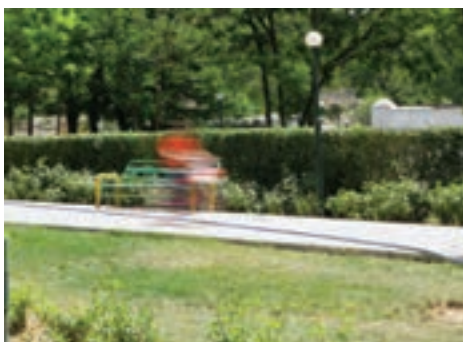
سرعت \frac{1}{3} ثانیه