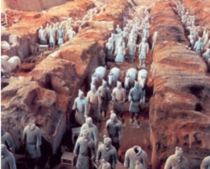
مقبره‌ی امپراتور شی‌هان‌دی - منطقه‌ی زیان‌شان‌زی - چین

نظر به این‌که تقسیم دوران‌های تاریخی به سه بخش قرون قدیم، قرون میانه و قرون جدید، ابتدا از سوی مورخان اروپایی به میان آمده، طبیعی است که در مورد سرزمین‌ها و ملت‌های اروپایی به کار رفته باشد.