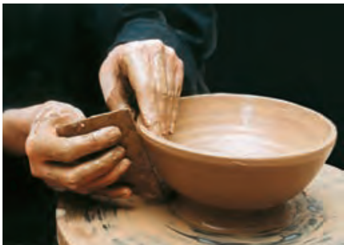
تصویر ۲۹- یکنواخت کردن سطح بیرون کاسه