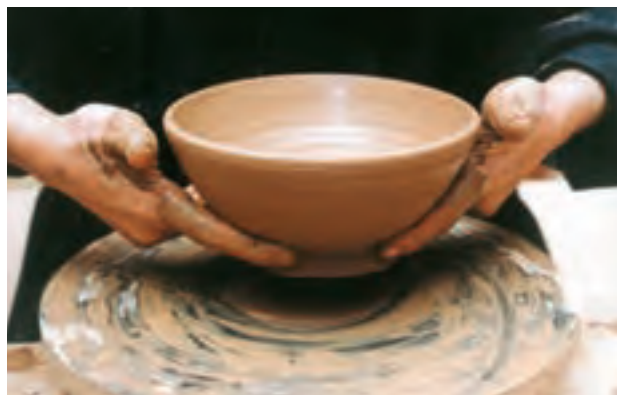
تصویر ۳۳- بلند کردن کاسه از روی سرچرخ