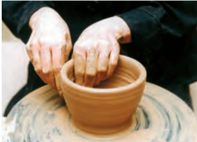
تصویر ۳۴ - قلاج کردن دیواره

۲-۱ - قلاج کردن دیواره: این مرحله مانند قلاج کردن دیواره ظرف دهانه گشاد است. با این تفاوت که دیواره استوانه توخالی بیشتر به طرف بالا کشیده می‌شود. قلاج کردن دیواره از