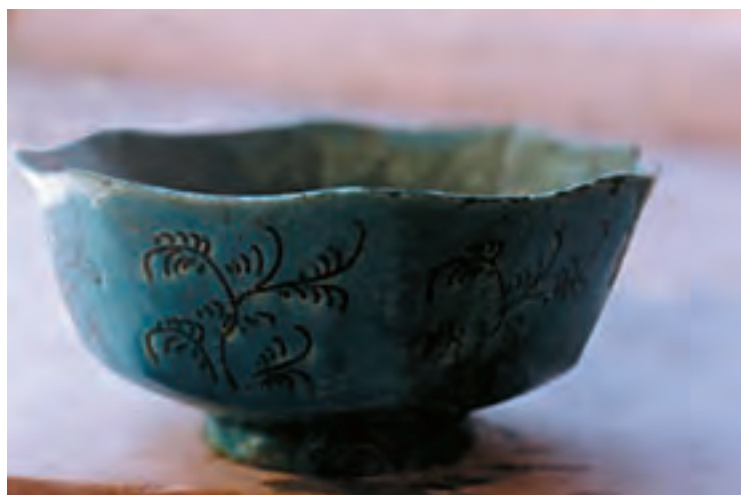
تصویر ۷- کاسه هشت‌ترک با لبه هلالی که با روش قالبی تزیین شده - کارگاه سفالگری عبادی در نطنز

در این روش، قالب مورد استفاده، دارای فضایی به شکل ظرفی است که در سطح داخلی آن نقوش به صورت منفی کنده شده است. این قالب‌ها در گذشته از جنس سفال، سنگ و چوب ساخته می‌شد، ولی امروزه شکل گچی آن رواج بیشتری دارد. بدنه خام داخل این قالب قرار گرفته و قالب بسته می‌شود. با بسته شدن قالب، فشار ملایمی بر بدنه وارد می‌آید که منجر به انتقال نقش بر سطح خارجی بدنه خام می‌شود. در گذشته برای ساخت ظروف