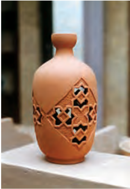
تصویر ۴- تزیین بدنه به روش نقش بریده (مشبک)

طرح، ساخت و تزیین بدنه: عذرا جوادی، کارگاه سفالگری مدیریت پژوهش‌های هنرهای سنتی سازمان میراث فرهنگی کشور