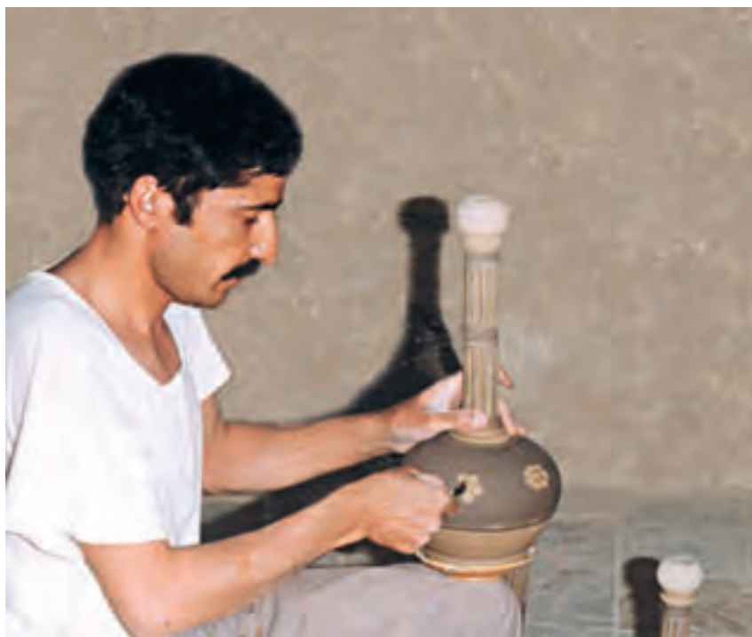
تصویر ۲- مراحل تزیین ظروف به روش نقش کنده - کارگاه سهیلی - شهرضا

در بعضی از مراکز سفالگری سنتی ایران، وقتی بدنه خام به حالت چرمینگی رسید، ابتدا تمام سطح بدنه را با لایه‌ای از دوغاب رنگی پوشانده و هنگامی که آب اضافی خود را از دست داد، با