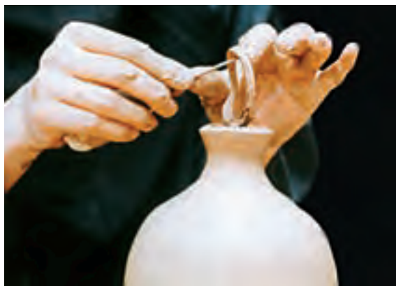
تصویر ۴۷- جدا کردن قسمت بریده شده

باید توجه داشت که ضخامت خمیر گل در قسمت دهانه، باید به اندازه‌ای باشد که بتوان گردن را با شکل دادن آن ساخت. اگر ظرف با گردن بلند مورد نظر باشد، گردن باید به طور جداگانه روی چرخ سفالگری ساخته و سپس با دوغاب غلیظ روی بدنه