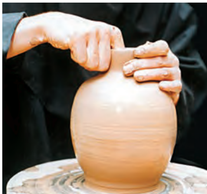
تصویرهای ۴۴ و ۴۵- جمع کردن و شکل دادن گردن کوزه