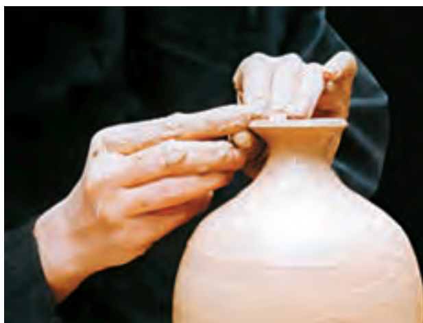
تصویر ۴۹- صاف کردن لبه کوزه