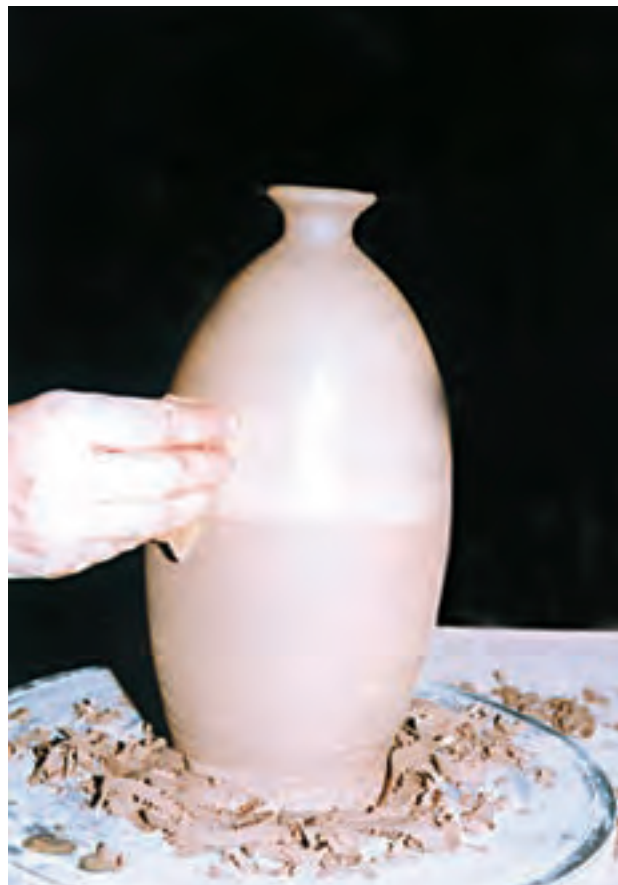
تصویر ۶۰ - صاف کردن سطح بدنه با اسفنج