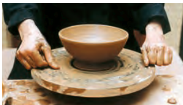
تصویر ۳۲- جدا کردن کاسه از سرچرخ به وسیله مفتول سیمی