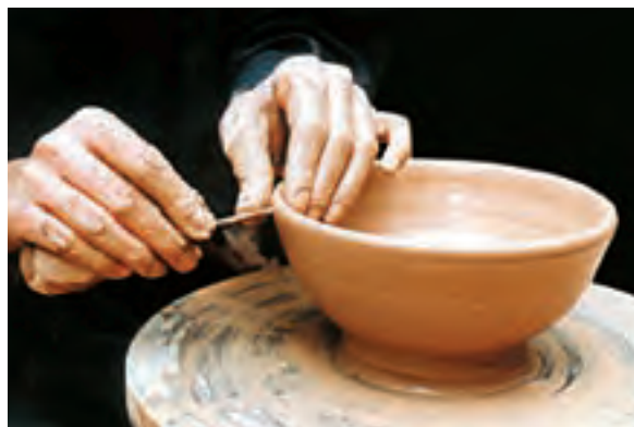
تصویر ۲۲- بریدن لبه کاسه با ابزار برش