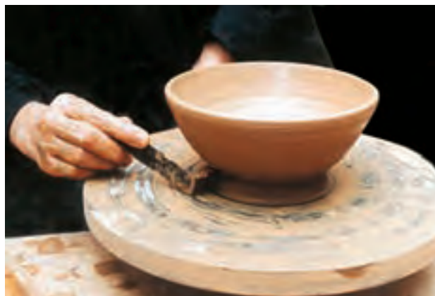
تصویر ۳۱- کم کردن ضخامت پایه کاسه

۴-۱- جدا کردن ظرف از روی سرچرخ: بعد از شکل‌دهی کاسه، برای جداسازی آن از سرچرخ باید دور چرخ را کندتر کرد. سپس با ابزار تراش‌دهنده از قسمت ضخیم پایه کاسته و سپس دوسر مفتول سیمی یا نخ برش، را با دو دست گرفته و در حالت موازی با سطح سرچرخ، از کمی پایین‌تر از قسمت تحتانی