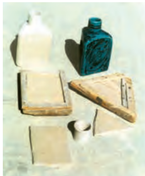
تصویر ۶ - شکل‌دهی به وسیله قالب چوبی - کارگاه بهاری - شهرضا

۳-۲ - شکل‌دهی به وسیله قالب: بسیاری از باستان‌شناسان معتقدند که سفالینه‌های اولیه از اندود کردن سبدهای بافته شده با خمیر گل پدید آمده است. به عبارت دیگر می‌توان گفت که سبد اولین قالبی است که انسان برای ساخت ظروف از آن یاری گرفته است. در این روش، قالب نقش مهمی در شکل‌دهی ظروف دارد. به طوری که با قراردادن ورقهٔ خمیر گل درون قالب و فشار ملایم در تمام سطح، خمیر شکل قالب را به خود گرفته و بدنه‌های زیادی را می‌توان به این ترتیب تکثیر کرد. این قالب‌ها می‌تواند از گچ یا چوب باشد (تصویر ۶). قالب گاهی محدب و گاهی مقعر است و توسط یک تیغهٔ شکل دهنده می‌توان به خمیر روی قالب شکل داد. (مانند آنچه در دستگاه جیگرو جولی اتفاق می‌افتد.)