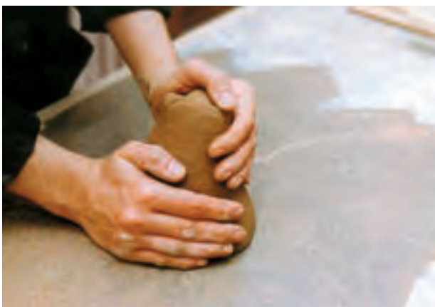
تصویر ۹ - چونه یا چانه گل آماده شده

۳-۲ - شکل‌دهی به وسیله قالب: بسیاری از باستان‌شناسان معتقدند که سفالینه‌های اولیه از اندود کردن سبدهای بافته شده با خمیر گل پدید آمده است. به عبارت دیگر می‌توان گفت که سبد اولین قالبی است که انسان برای ساخت ظروف از آن یاری گرفته است. در این روش، قالب نقش مهمی در شکل‌دهی ظروف دارد. به طوری که با قراردادن ورقهٔ خمیر گل درون قالب و فشار ملایم در تمام سطح، خمیر شکل قالب را به خود گرفته و بدنه‌های زیادی را می‌توان به این ترتیب تکثیر کرد. این قالب‌ها می‌تواند از گچ یا چوب باشد (تصویر ۶). قالب گاهی محدب و گاهی مقعر است و توسط یک تیغهٔ شکل دهنده می‌توان به خمیر روی قالب شکل داد. (مانند آنچه در دستگاه جیگرو جولی اتفاق می‌افتد.)