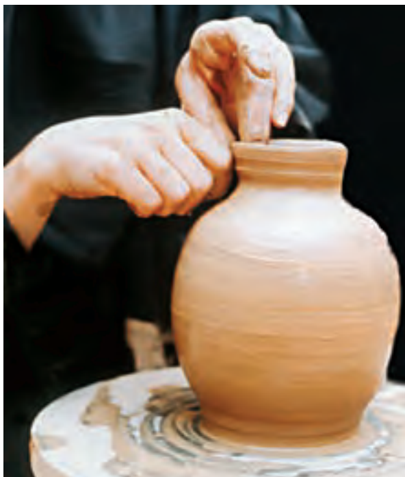
تصویر ۴۳- ساخت گردن ظرف

۲-۴ ساخت گردن: روش ساخت گردن ظرف با توجه به ارتفاع آن، متفاوت است. برای کوزه‌هایی با گردن کوتاه، بعد از اینکه دهانه ظرف به اندازه کافی جمع شد، دو انگشت را داخل دهانه ظرف قرار داده و دست دیگر را در حالی که انگشت اشاره