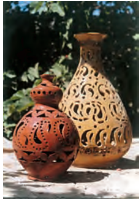
تصویر ۵- تزیین به روش مشبک یا نقش بریده