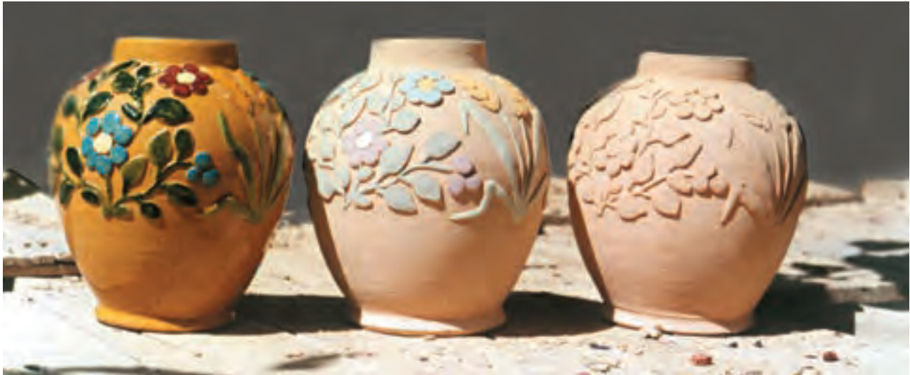
تصویر ۳- مراحل تزئین بدنه به روش نقش افزوده - کارگاه سفالگری سهیلی در شهرضا

است. در روش خمیری، نقش به صورت تکه‌هایی از خمیر و مطابق طرح شکل داده شده و روی بدنه خام چسبانده می‌شود. برای اتصال نقوش، محل موردنظر را خراش داده و با مقداری دوغاب بدنه، دو تکه را با کمی فشار به هم می‌چسبانند. با اطمینان از اتصال نقوش، می‌توان با اسفنج مرطوب لبه‌ها و محل اتصال نقوش را یکنواخت کرد (تصویر ۳).