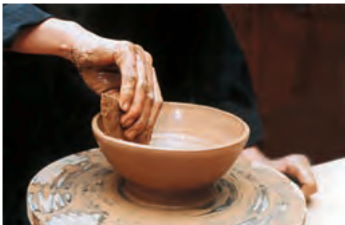
تصویر ۲۸- شکل دادن و یکنواخت کردن دیواره کاسه

۳-۱- محذب کردن و یکنواخت کردن شکل دیواره: در این مرحله با ابزار شکل‌دهنده، علاوه بر تحدب شکل دیواره کاسه، زواید و ناهمواری‌های سطح آن نیز گرفته می‌شود. برای شکل دادن درون کاسه از قسمت منحنی ابزار شکل‌دهنده و برای