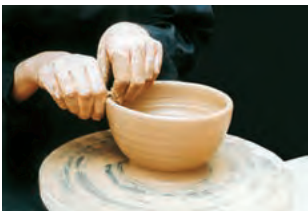
تصویر ۲۷- یکنواخت کردن لبه کاسه