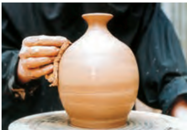
تصویر ۵۱- صاف کردن سطح کوزه با اسفنج