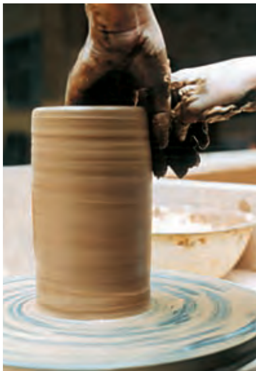
تصویر ۳۵ - ساخت استوانه