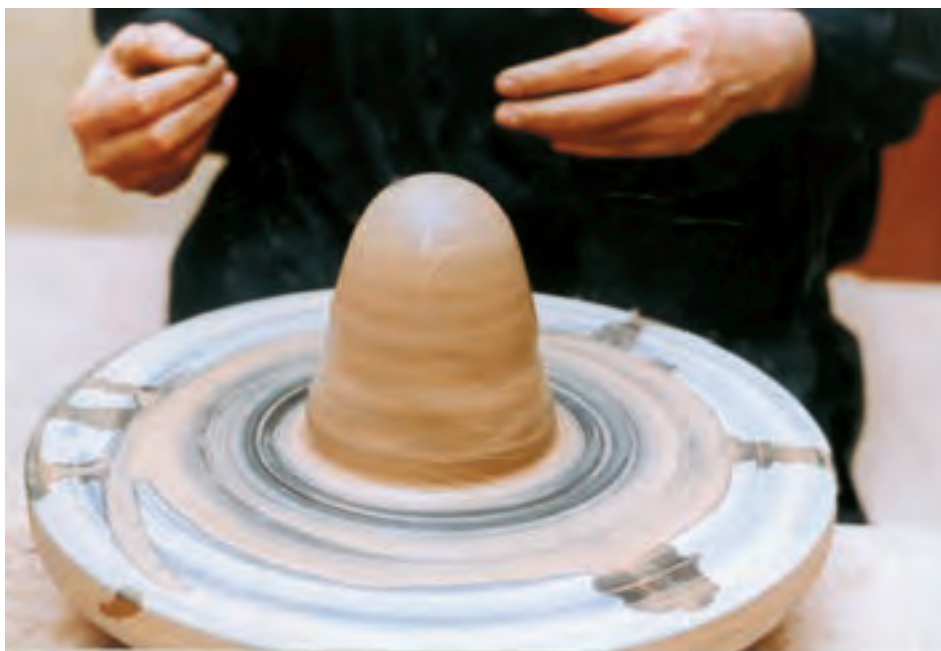
تصویر ۱۱- استوانه توپُر

افزایش فشار انگشت شست و سایر انگشتان بر دیواره، حفره گشادتر می‌شود. از این پس خمیر، شکل ظرف را به خود می‌گیرد (تصویرهای ۱۲ تا ۱۶).