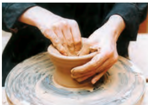
تصویر ۱۶- گشاد کردن دیواره ظرف