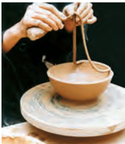
تصویر ۲۳- جدا کردن لبه بریده شده