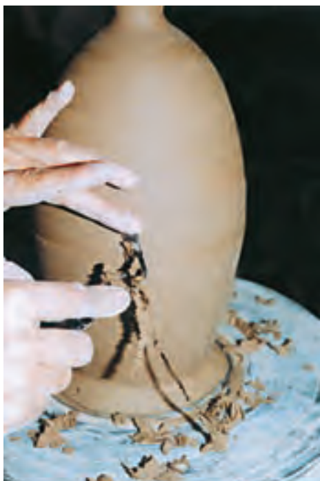
تصویر ۵۹ - تراشیدن قسمت‌های ضخیم بدنه

به هنگام تراش بدنه، از افزودن رطوبت به بدنه خودداری می‌شود و سرعت دوران سرچرخ باید کاملاً کنترل شده و یکنواخت باشد. به هنگام تراش گاهی باید کارد تراش را کنار گذاشت و با