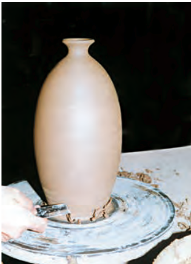
تصویر ۶۱ - تراشیدن محل تماس ظرف و سرچرخ برای برداشتن آن

بعد از تراش، بدنه با اسفنج مرطوب یکنواخت و صاف می‌شود (تصویرهای ۶۰ و ۶۱). در پایان ظرف را برای خشک شدن در خشک‌کن، گرمخانه ۱ یا محل مناسب دیگری قرار می‌دهند