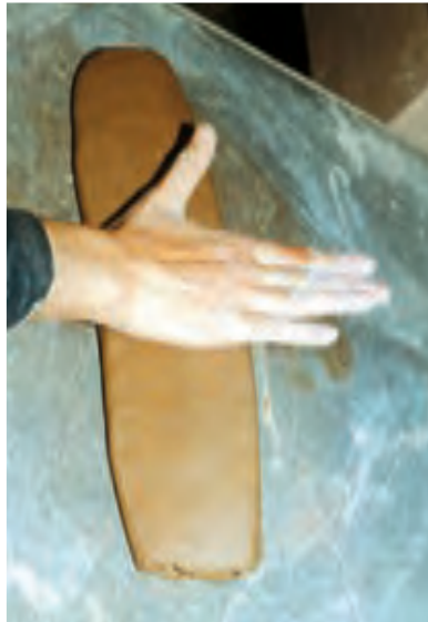
تصویر ۵۷ - آماده کردن کالی

گاهی نیز برای حفاظت لبه‌های ظروف از «کالی» استفاده می‌شود. «کالی» استوانه‌ای سفالی به اندازه متناسب با سری یا ته بدنه یا داخل و خارج ظرف است (تصویرهای ۵۷ و ۵۸). با حصول اطمینان از در مرکز بودن و همچنین محکم بودن کالی و ظرف، در