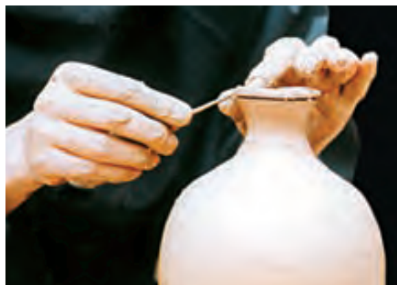
تصویر ۴۶- بریدن لبه کوزه با ابزار برش