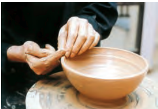
تصویر ۲۵- صاف کردن لبه بریده شده