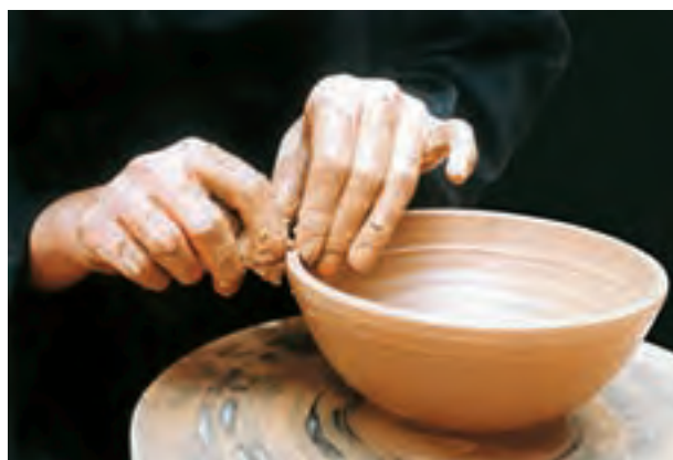
تصویر ۲۴- از بین بردن زوایای لبه کاسه