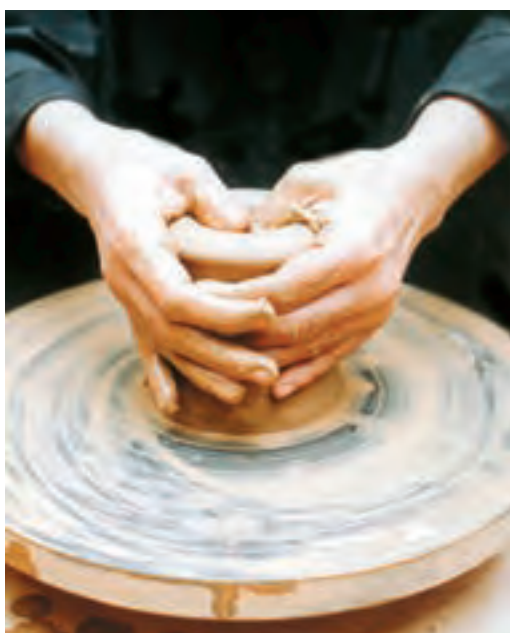
تصویر ۱۳- مراحل بازکردن استوانه توپر