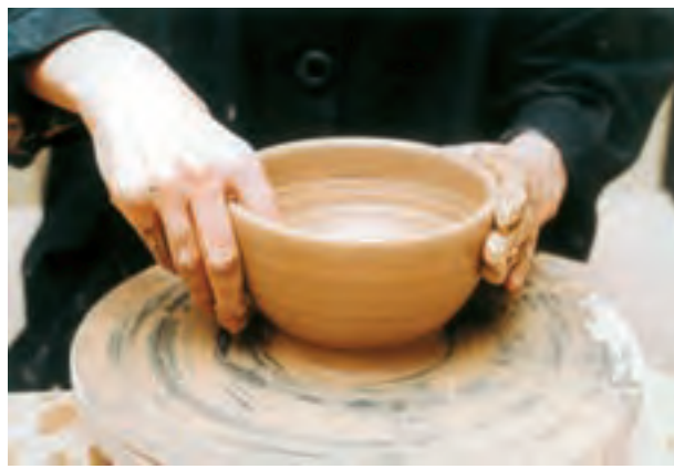
تصویر ۲۶- صاف کردن لبه کاسه با دو انگشت