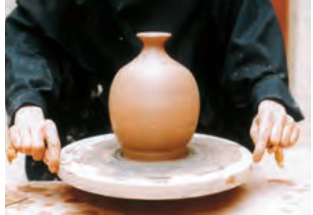
تصویر ۵۲ - جدا کردن کوزه از سرچرخ به وسیله مفتول سیمی

یک حجم توپر شنیده می‌شود. در این حالت می‌توان بدنه یا خمیر را تراشید یا برش داد. برای پرداخت ظرف، ابتدا باید آن را روی سرچرخ محکم کرد. گاهی ظرف را به طور مستقیم روی سرچرخ گذاشته، با قرار دادن گل در محل اتصال آن را به سرچرخ محکم می‌کنند (تصویرهای ۵۴ تا ۵۶).