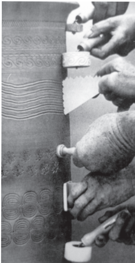
تصویر ۶- تزیین بدنه خام به روش مُهری

مُهر وسیله‌ای است که از یک جسم سخت با قابلیت حکاکی و کنده‌کاری، ساخته می‌شود. مُهر می‌تواند از فلزات، سنگ، چوب، سفال یا لاستیک باشد که نقش به صورت منفی یا وارونه روی آن حک می‌شود. از مهر برای تکثیر یک نقش استفاده می‌شود. مهرها می‌توانند به شکل مکعب، مخروط، استوانه یا نیم‌کره بوده ولی باید یک سطح تخت و صاف برای حک نقوش داشته باشند. برای استفاده از مهر روی بدنه خام، ابتدا قسمت موردنظر را که باید نقش روی آن ایجاد شود، علامت‌گذاری کرده، سپس طرف نقش‌دار مهر را روی آن قرار داد و با اعمال فشار بر پشت مهر، نقش را روی بدنه خام منتقل کرد. با تکرار این کار، نقش به صورت واگیره در سطح بدنه تکثیر می‌شود (تصویر ۶).