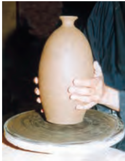
تصویر ۵۴ - قراردادن ظرف روی مرکز سرچرخ

۶- پرداخت: پرداخت مرحله‌ای است که در آن سفالگر اصلاحات لازم را روی بدنه انجام می‌دهد. برای پرداخت، بدنه باید در حالت «نیمه خشک»، «دووم» یا «چرمینه» باشد. در حالت چرمینگی، بدنه رطوبت خود را تا حد زیادی از دست داده و قابلیت شکل‌پذیری چندانی ندارد ولی از استحکام نسبی خوبی برخوردار است، به طوری که با زدن ضربه‌های آرام به بدنه، صدای