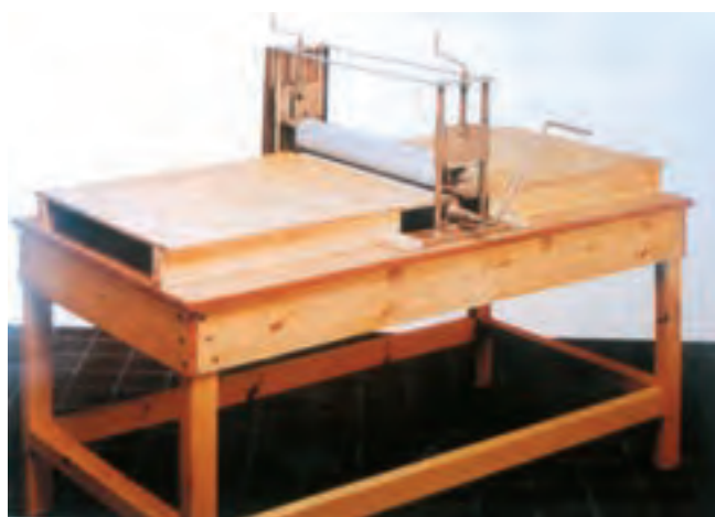
تصویر ۴- دستگاه غلتکی لوحه‌سازی قابل حمل و نقل Slab Roller دستگاهی برای تخت کردن خمیر برای استفاده در شکل‌دهی به روش مسطح