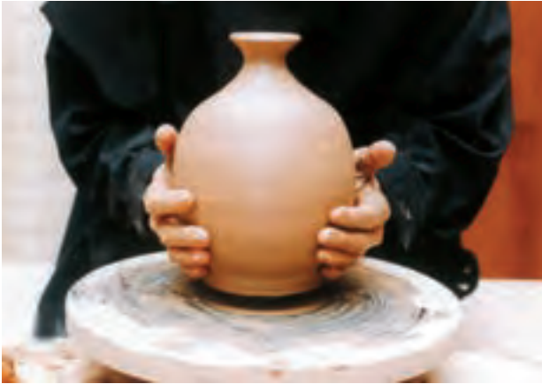
تصویر ۵۳ - بلند کردن کوزه از صفحه سرچرخ

یک حجم توپر شنیده می‌شود. در این حالت می‌توان بدنه یا خمیر را تراشید یا برش داد. برای پرداخت ظرف، ابتدا باید آن را روی سرچرخ محکم کرد. گاهی ظرف را به طور مستقیم روی سرچرخ گذاشته، با قرار دادن گل در محل اتصال آن را به سرچرخ محکم می‌کنند (تصویرهای ۵۴ تا ۵۶).