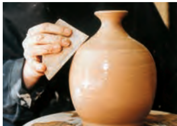
تصویر ۵۰- بریدن ناهمواری‌های سطح بدنه