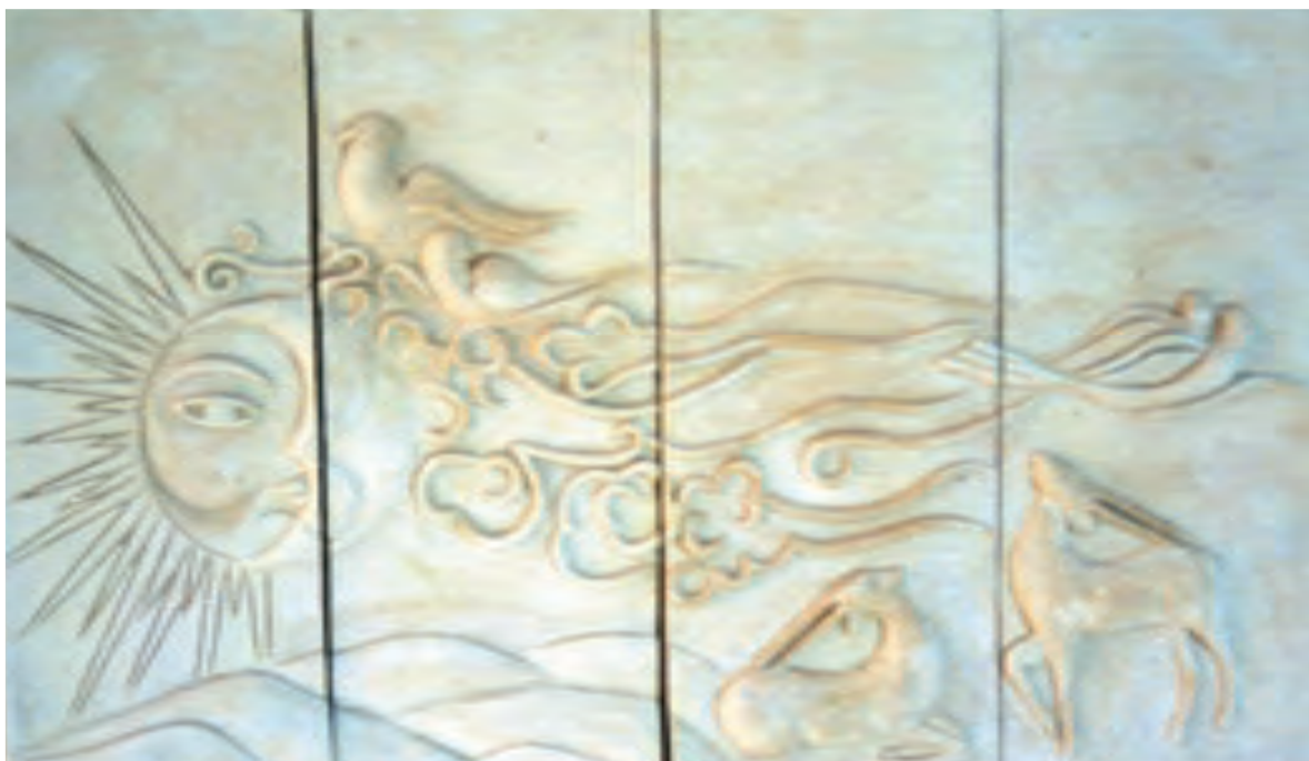
تصویر ۱- کتیبهٔ برجسته به روش نقش کنده لایه‌ای - طرح و تزیین: معصومه تهرانی، مدیریت پژوهش‌های هنرهای سنتی - سازمان میراث فرهنگی کشور

توجه به طرح موردنظر، قسمت‌هایی از آن به وسیله کارد تراش، برداشته می‌شود. با این روش، رنگ بدنه از زیر این پوشش آشکار شده و در نتیجه بدنه به دو رنگ دیده خواهد شد (تصویر ۲).