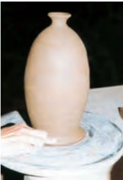
تصویر ۵۶ - محکم کردن محل تماس ظرف و سرچرخ