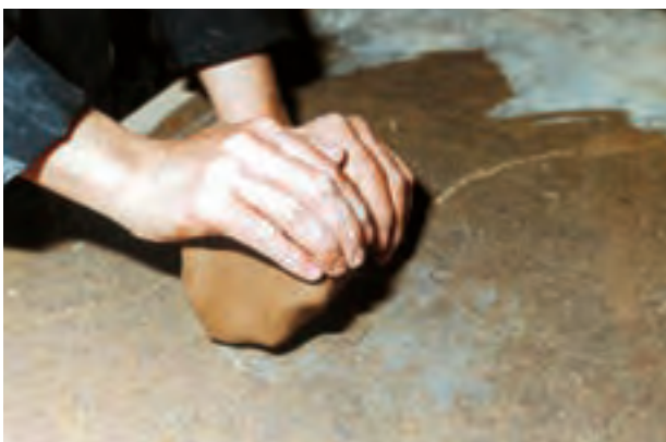
تصویرهای ۷ و ۸ - ورز دادن گل