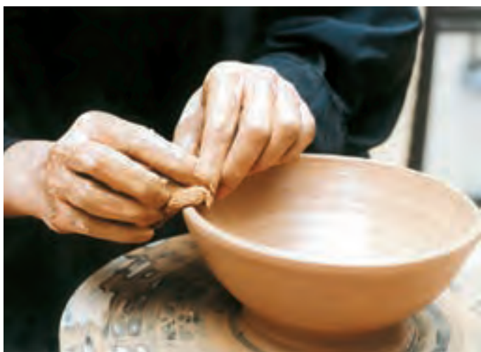
تصویر ۳۰- گرفتن دوغاب اضافه از سطح کاسه و یکنواخت کردن آن