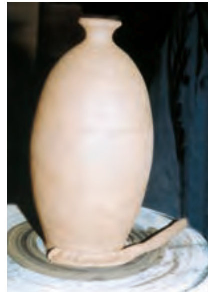
تصویر ۵۵ - قراردادن فتیله گل در محل تماس ظرف و سرچرخ