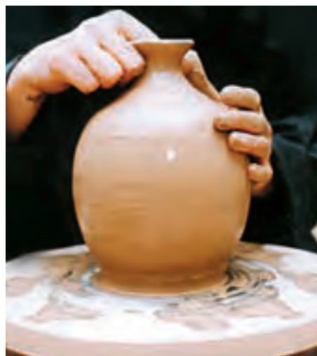
تصویر ۴۸- صاف کردن لبه با انگشتان