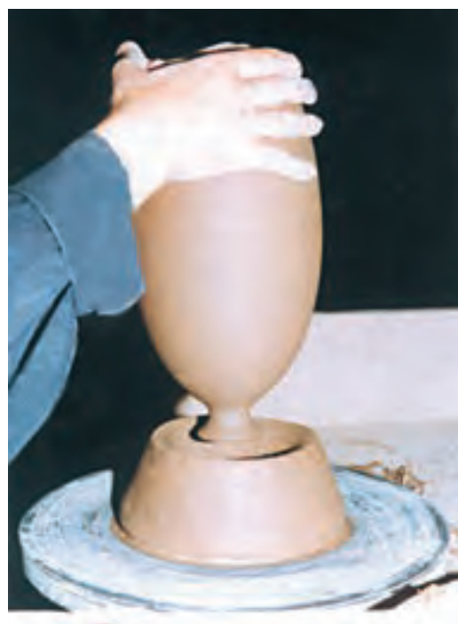
تصویر ۵۸ - قرار دادن ظرف درون کالی