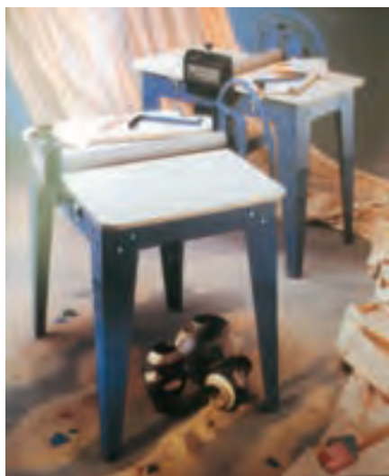
تصویر ۵- نوع دیگری از دستگاه غلتکی لوحه‌سازی ثابت

ساده‌ترین وسیله برای تخت کردن خمیر وردنه است ولی دستگاه مکانیکی لوحه سازی غلتکی نیز وجود دارد که خمیر تخت شده یکنواختی را به وجود می‌آورد. برای بریدن قسمت‌های مختلف بدنه از ابزار برش استفاده می‌شود و بعد از اینکه خمیر،