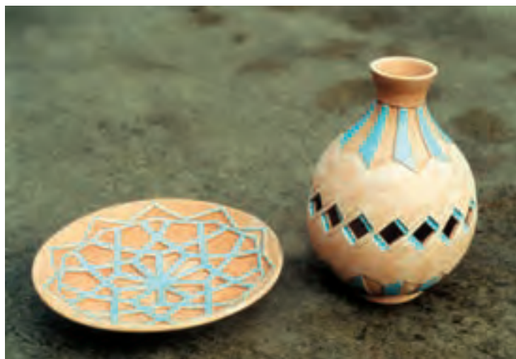
تصویر ۹- تزیین بدنه با ترکیب روش نقش بریده و نقش کنده — ساخت و تزیین: عذرا جوادی، هنرمند کارگاه سفالگری مدیریت پژوهش‌های هنرهای سنتی سازمان میراث فرهنگی کشور