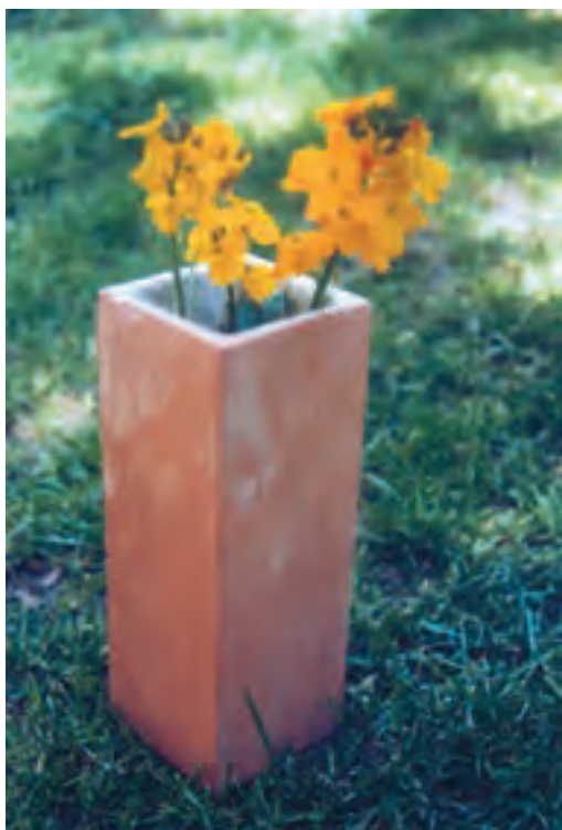
تصویر ۲- بدنه سفالی که به روش مسطح ساخته شده است. سازنده بدنه: موسوی