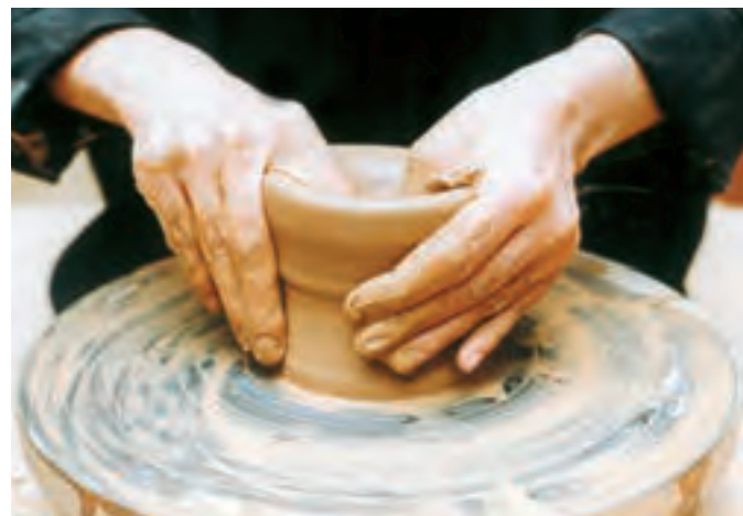
تصویرهای ۱۴ و ۱۵- گشاد کردن دهانه استوانه