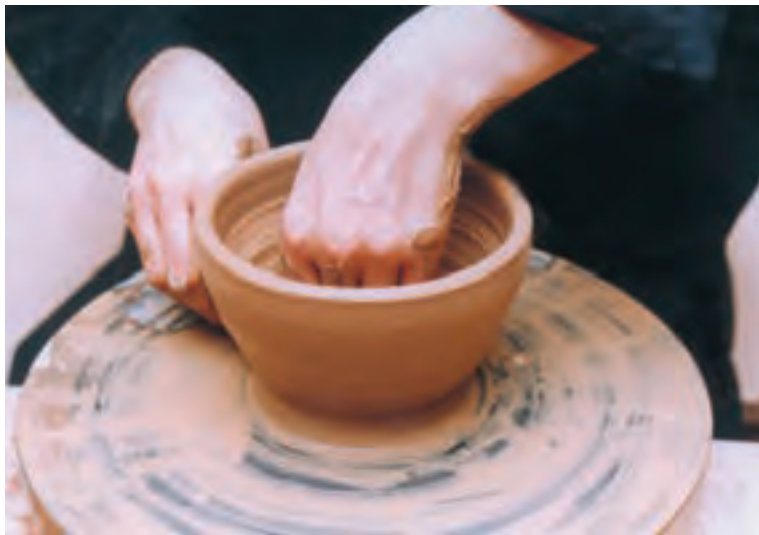
تصویر ۱۷- باز کردن کف ظرف

استوانه طوری قرار می‌دهند که دیواره را حمایت کند و با دست دیگر در حالی که انگشت شست به صورت قائمه (چهار انگشت دیگر جمع شده) و عمود بر دیواره روی کف استوانه قرار گرفته، می‌فشارند تا قاعده ظرف به اندازه لازم گشاد و یکنواخت شود (تصویر ۱۷).