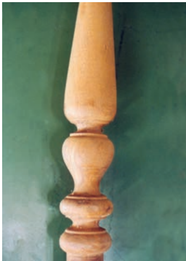
تصویر ۱۰-۱-۱- یک نمونه حجم که با روش خراطی بوجود آمده است.

خراطی نیز نوعی کنده کاری است که به صورت قرینه محوری انجام می گیرد (تصویر ۱۰-۱-۱).