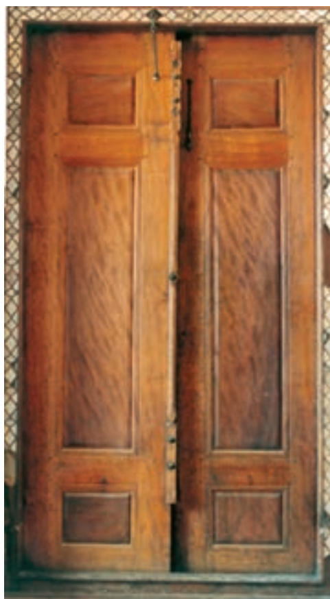
تصویر ۷-۱-۱- یک در قاب تنگه

تصویر ۶-۱-۱- گره چینی آلت و لقط در پایین یک در از جمله رشته‌های زیرمجموعه این فن می‌توان به «قاب تنگه» اشاره نمود که چیزی بین گره چینی آلت و لقط و درودگری است و در آن یک وسیله کاربردی به قابهایی تقسیم می‌شود و سپس درون این قابها با صفحات چوبی پُر می‌شود (تصویر ۷-۱-۱).