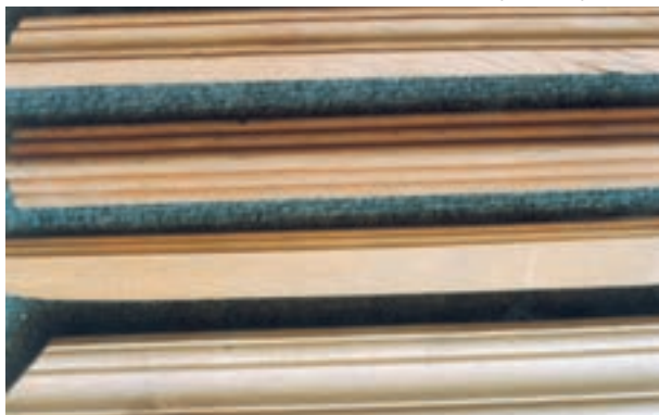
تصویر ۱۱-۱-۱- چند نمونه زهوار که به روی آنها ابزارزنی شده است.

از جمله فنون زیر مجموعه این بخش می توان به ابزارزنی اشاره نمود که عبارت است از تراش یکنواخت شکل یا شبیه به صورت مورد نظر (تصویر ۱۱-۱-۱).