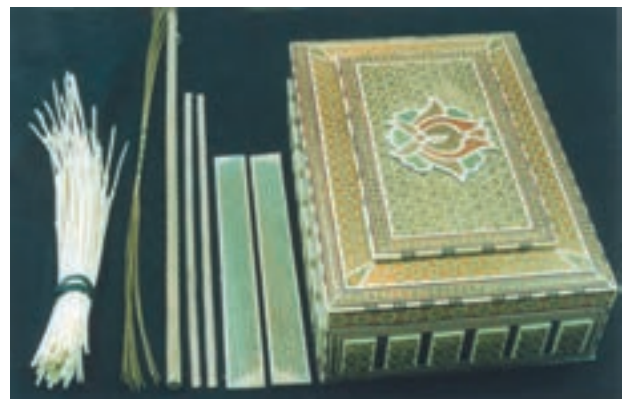
تصویر ۱۹-۱-۱ یک محصول خاتم کاری جدید به همراه مصالح اولیه و نمونه‌های گل پیچیده شده و چند نمونه لایه خاتم.

مشابه بدست آورد. خاتم مثلث که امروزه متداول‌تر است به شیوه‌ای به نام (گل‌بندی) اجرا می‌شود به این نحو که در مرحله اول منشورهایی مثلث‌القاعده از جنس چوب، فلز و استخوان آماده می‌شود. در مرحله دوم، این منشورها براساس طرح هندسی مورد نظر از پهلوی کنار هم چسبانده می‌شوند تا شش ضلعیها و مثلثهای بزرگ‌تری موسوم به «گل» و «توگلو» پدید آید (به این کار گل‌بندی گویند)، بر اثر کنار هم چسباندن گلها و توگلوها از پهلوی به هم، مکعب مستطیل بزرگی پدید می‌آید که نقش هندسی در رأس آن پیداست و به آن «قامه» می‌گویند. حال با برش مقطعی قامه، لایه خاتم بدست می‌آید که در مرحله سوم خاتم کاری می‌توان این لایه‌ها را به‌روی زیرساخت مورد نظر چسباند (تصویر ۱۹-۱-۱).