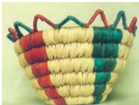
تصویر ۱۴-۱-۱- یک ظرف ساده حصیری

۵- بافتهای چوبی: این فن عبارت است از بافت اجزای انعطاف پذیر چوبی. حصیربافی از زیر مجموعه های این بخش می باشد و عبارت است از بافت الیاف چوبی (تصویر ۱۴-۱-۱).