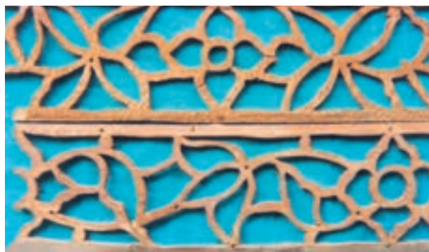
تصویر ۱-۱-۲- شبکه‌بری با نقش ختایی

از رشته‌های زیرمجموعهٔ شبکه‌بری می‌توان به پارچه‌بری اشاره نمود در این فن دو لایه چوب به‌طور مشابه شبکه‌بری می‌شوند و در بین آنها قطعاتی از شیشه رنگی نصب می‌گردد (تصویر ۱-۱-۳).