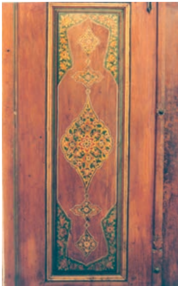
تصویر ۲۰-۱-۱ نقاشی و تذهیب در روی یک در چوبی

است. براساس همین اصل رشته‌های هنری چوبی به دو گروه کلی «الحاقی» و «غیرالحاقی» تقسیم می‌شوند، در رشته‌های غیرالحاقی قسمت تزینی، خود بخشی از زیرساخت است (مثل منبت کاری) ولی در رشته‌های الحاقی قسمت تزینی به‌روی زیرساخت اضافه می‌شود (مثل خاتم کاری). رشته‌های صنایع دستی چوبی غیرالحاقی عبارتند از: مشبک بری، پارچه‌بری، گره چینی مشبک، گره چینی شیشه‌دار، گره چینی آلت و لقط، قاب تنکه، قواره‌بری، منبت کاری، خراطی، ابزارزنی، مجسمه‌سازی، مهرسازی، سبدهافی، حصیربافی، سازسازی.