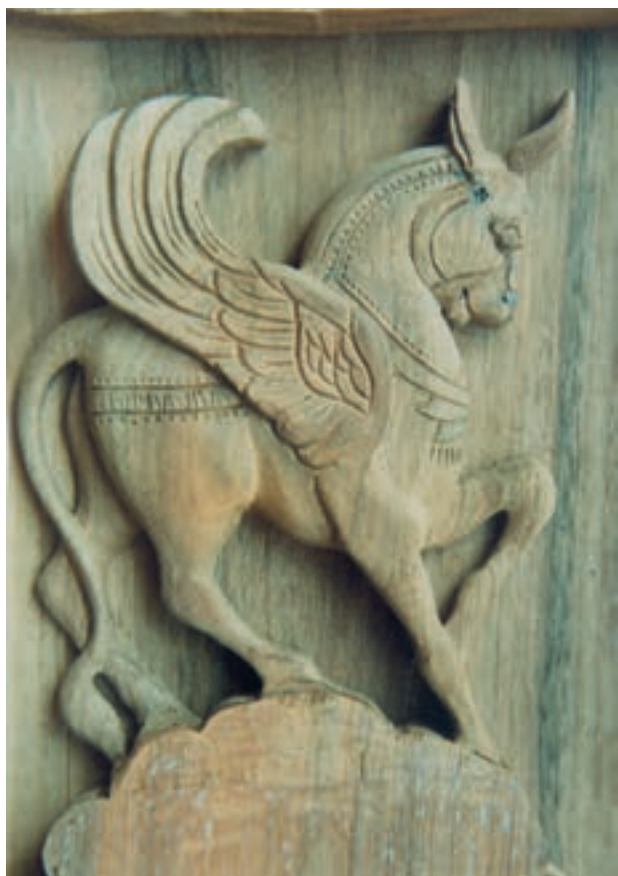
تصویر ۹-۱-۱- قسمتی از یک منبت کاری جدید

۴- کنده کاری: عبارت است از تراش قسمتهایی از چوب براساس طرح مورد نظر و به حجم مورد نظر: منبت کاری که زیرمجموعه این بخش است عبارت است از نوعی کنده کاری غیرهمگن براساس طرح برای رسیدن به نقش برجسته مورد نظر (تصویر ۹-۱-۱).