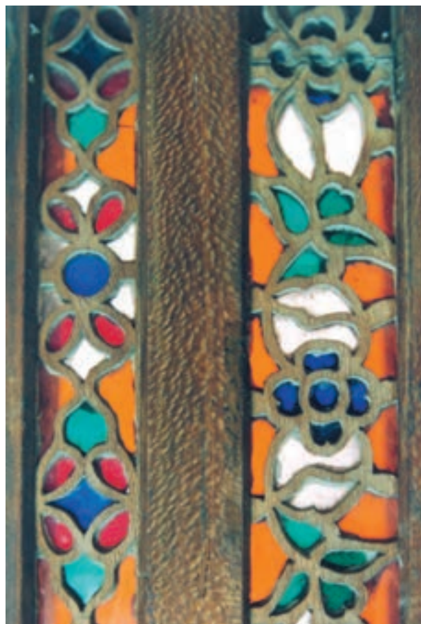
تصویر ۱-۱-۳- پارچه‌بری نصب شده در کنارهٔ یک در

از رشته‌های زیرمجموعهٔ شبکه‌بری می‌توان به پارچه‌بری اشاره نمود در این فن دو لایه چوب به‌طور مشابه شبکه‌بری می‌شوند و در بین آنها قطعاتی از شیشه رنگی نصب می‌گردد (تصویر ۱-۱-۳).