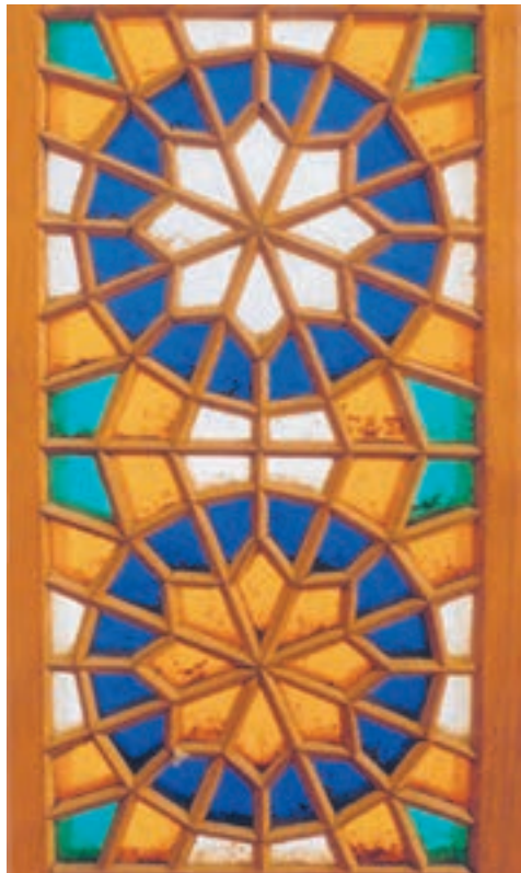
تصویر ۱-۱-۵- گره چینی شیشه‌دار که در حاشیه یک پنجره نصب شده است.

از رشته‌های زیرمجموعهٔ گره چینی می‌توان به گره چینی شیشه‌دار اشاره نمود که در آن بین آلتها شیشه رنگی نصب می‌گردد (تصویر ۱-۱-۵).