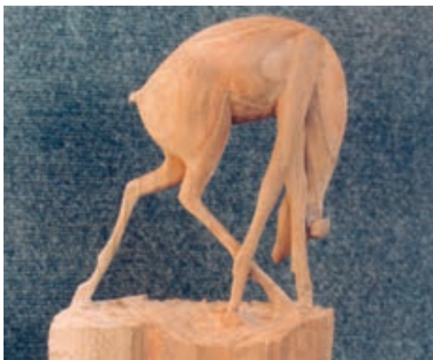
تصویر ۱۲-۱-۱- یک نمونه مجسمه چوبی

ساخت مُهر یا قالب چاپ قلمکار نیز زیر مجموعه این بخش است (تصویر ۱۳-۱-۱).