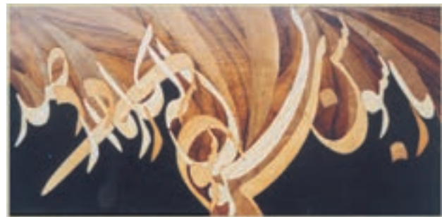
تصویر ۱۶-۱-۱ یک تابلو معرق معاصر

۶- قطعه‌کاری چوبی: به گروهی از رشته‌های صنایع دستی چوبی گفته می‌شود که براساس طرح اولیه قطعات بخش‌تزیینی که عمدتاً چوبی هستند آماده و سپس این قطعات براساس همان طرح به وسیله روشهایی مثل چسبانیدن و میخ‌کوبی به روی زیرساخت الحاق می‌شوند. معرق چوب از زیرمجموعه‌های این گروه است و گرچه شیوه‌های مختلفی دارد ولی در یک تعریف کلی و کوتاه می‌توان گفت: عبارت است از برش قطعاتی از لایه‌های نازک عمدتاً چوبی هم ضخامت براساس طرح و سپس چسباندن یا تعبیه آنها به روی زیرساخت در جای خود براساس همان طرح (تصویر ۱۶-۱-۱).