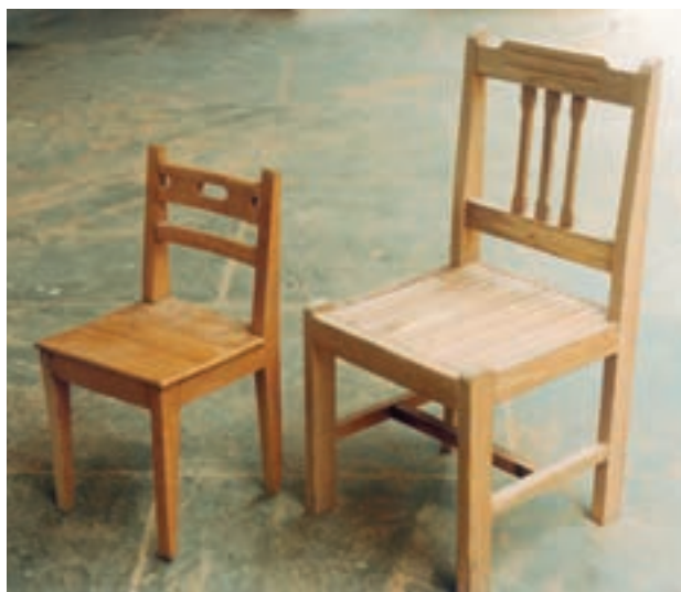
تصویر ۱-۱-۱- محصولات درودگری - دو نمونه صندلی با تزیینات جزئی

۱- درودگری: فن ساخت وسایل یا زیر ساختهای کاربردی یا کاربردی تزئینی است. وسایل چوبی از قبیل میز، صندلی، کمد، جعبه، در و ... محصولات درودگری هستند (تصویر ۱-۱-۱).