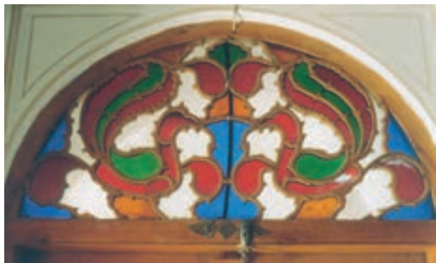
تصویر ۸-۱-۱- قواره‌بری یا اسلیمی بُری در بالای یک در

قواره‌بری که گاهی به آن اسلیمی بُری نیز می‌گویند نوعی گره چینی است که براساس طرح غیرهندسی انجام می‌گیرد (تصویر ۸-۱-۱).