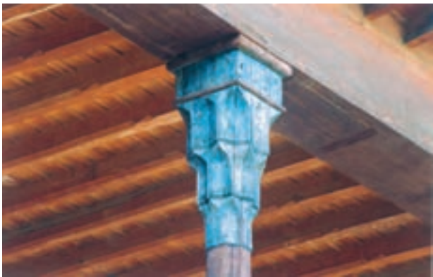
تصویر ۱۸-۱-۱ مقرنس چوبی اجرا شده در یک سرستون دوره صفوی

مقرنس‌سازی چوبی را می‌توان حد واسط قطعه کاری و درودگری و کنده کاری دانست در این هنر، قطعات چوبی به شکل منشور آماده می‌شود به نحوی که یک سر این منشورها به شکل هندسی خاص تراش می‌خورد سپس این منشورها به نحوی منظم در کنار هم چسبانیده یا میخ‌کوبی می‌شوند تا احجام منظم و تکراری و هندسی پدید آید (تصویر ۱۸-۱-۱).