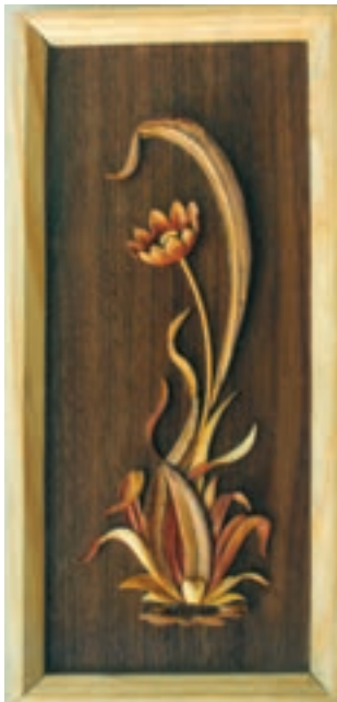
تصویر ۱۷-۱-۱ یک تابلو معرق منبت

مقرنس‌سازی چوبی را می‌توان حد واسط قطعه کاری و درودگری و کنده کاری دانست در این هنر، قطعات چوبی به شکل منشور آماده می‌شود به نحوی که یک سر این منشورها به شکل هندسی خاص تراش می‌خورد سپس این منشورها به نحوی منظم در کنار هم چسبانیده یا میخ‌کوبی می‌شوند تا احجام منظم و تکراری و هندسی پدید آید (تصویر ۱۸-۱-۱).