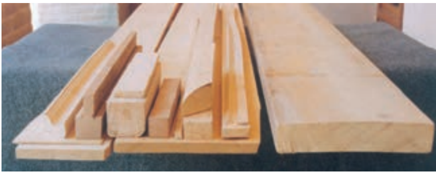
تصویر ۲۱-۱-۱ یک تخته و نمونه‌هایی از پروفیل‌های آن

پروفیل‌ها ممکن است برای ساخت زیرساخت و یا برای اجرای بخش تزئینی بکار روند.