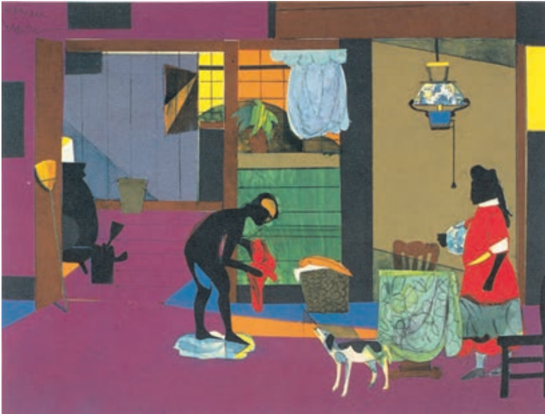
تصویر ۱۴-۳- اثر ژمار بردن ۱ ، کلاژ و ترکیب مواد، (۳۴/۹×۴۵/۱ سانتی متر)