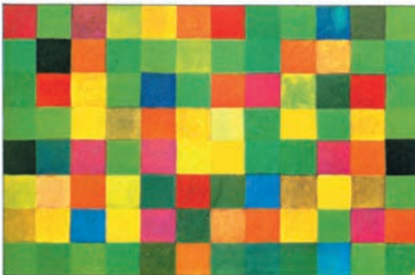
تصویر ۱۹-۲- تابستان