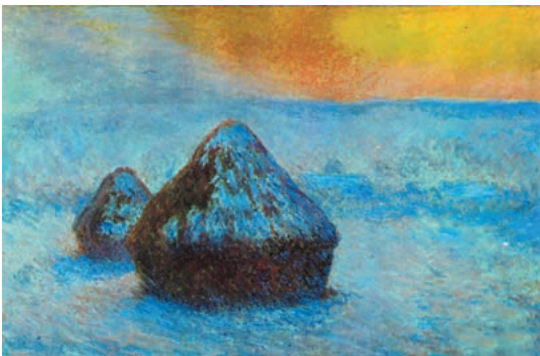
تصویر ۲-۲۳- اثر کلود مُنه، رنگ روغن روی بوم، (۶۳/۵×۱۰۰ سانتی‌متر)