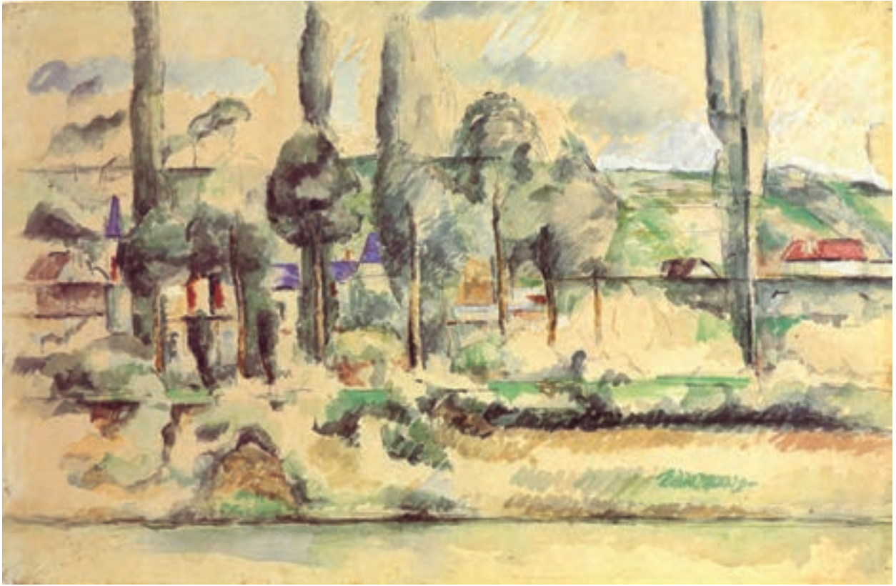
تصویر ۱۱-۲- اثر پل سزان، آبرنگ روی مقوا