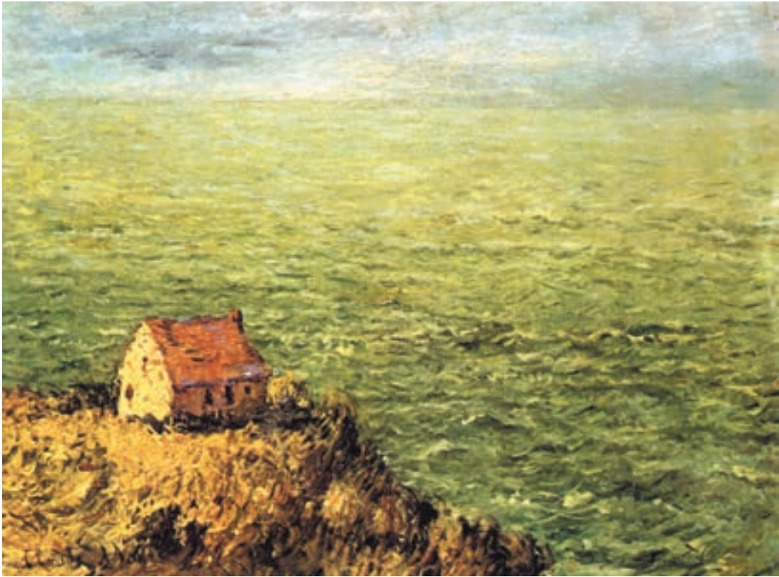
تصویر ۲-۵- اثر کلود مُنه، رنگ روغن روی بوم، (۵۹ × ۹۰ سانتی‌متر)