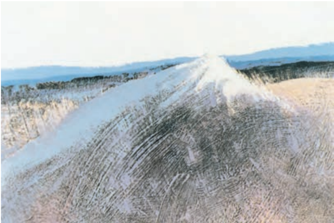
تصویر ۲-۶- اثر حسین کاظمی، رنگ روغن روی بوم، (۱۰۰ × ۱۵۰ سانتی‌متر)