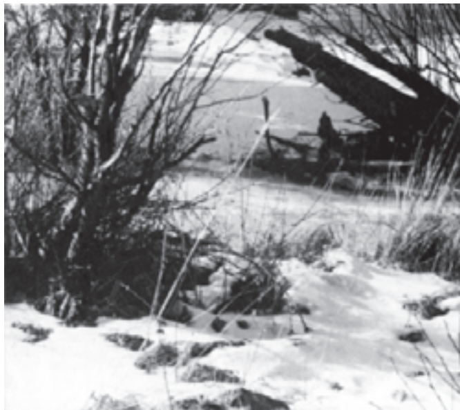
تصویر ۲-۷- عکس از منظره، اثر زابو ۱

تقسیم کادر به این ترتیب، از کل به جزء صورت می‌گیرد و شما در سطح زمین، عناصر دیگر تابلو را قرار خواهید داد که به تدریج به چشم بیننده نزدیک می‌شوند. از جمله کوهها و در جلو آن احتمالاً، درختان و عناصر دیگر را می‌توانید تعیین وضعیّت کنید. توجه به دوری و نزدیکی، پرسپکتیو خطی، وضوح و عدم وضوح عناصر تابلوی شما را به تدریج کامل و کاملتر می‌کند. در این مرحله، همیشه از کلیات شروع کنید و از تأکید بر یک جزء، جداً پرهیزید. در تصاویر (۲-۷) عکس از منظره و (۲-۸) پیش طرح از همان منظره، ملاحظه می‌کنید که در پیش طرح هنرمند چگونه از نمایش جزئیات صرف‌نظر کرده است.