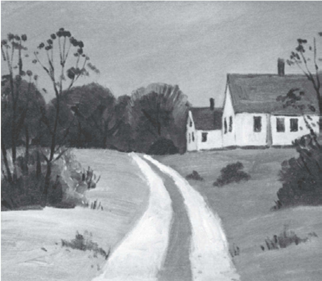
تصویر ۱۲-۲- اثر کادل، رنگ روغن، (۶۱×۷۶ سانتی متر)