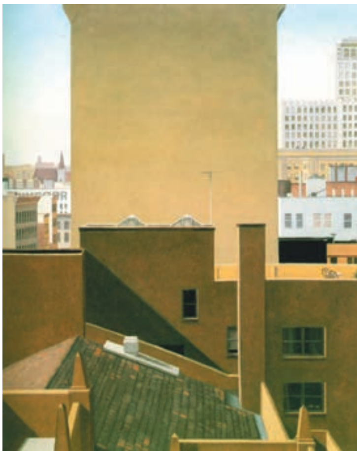
تصویر ۱-۲ اثر جان مور، رنگ روغن روی بوم، (۶۱×۷۲/۲ سانتی متر)