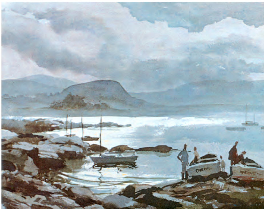
تصویر ۱۳-۲- اثر پایک ۱ ، ابرنگ، (۵۶×۷۶ سانتی متر)