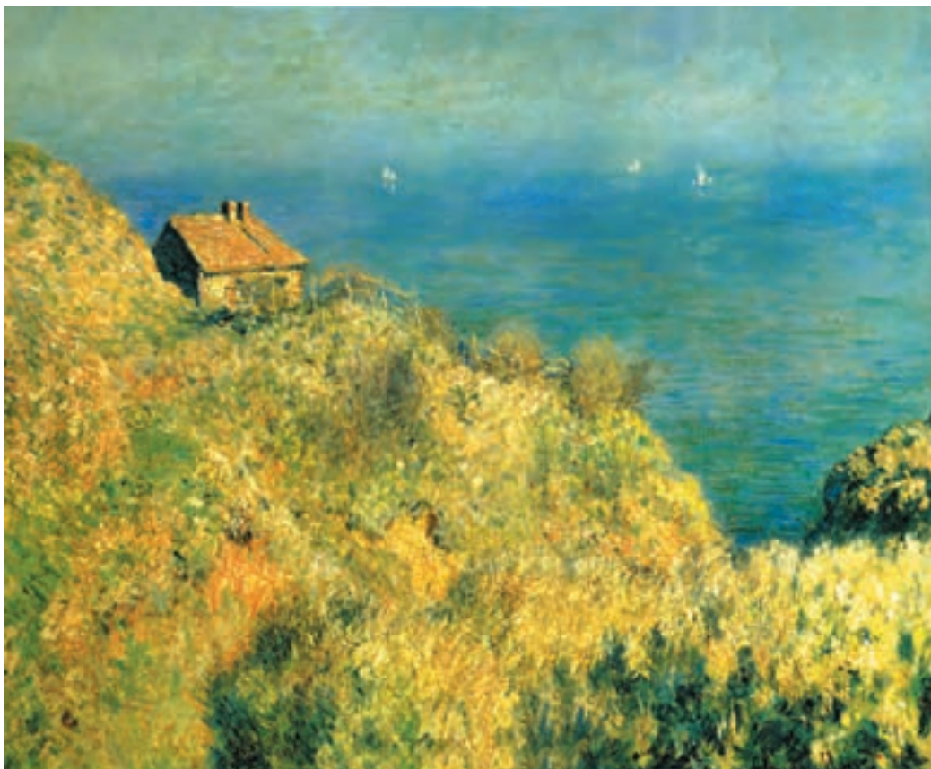
تصویر ۴-۲- اثر کلود مَنه، رنگ روغن روی بوم، (۵۹×۷۶ سانتی‌متر)