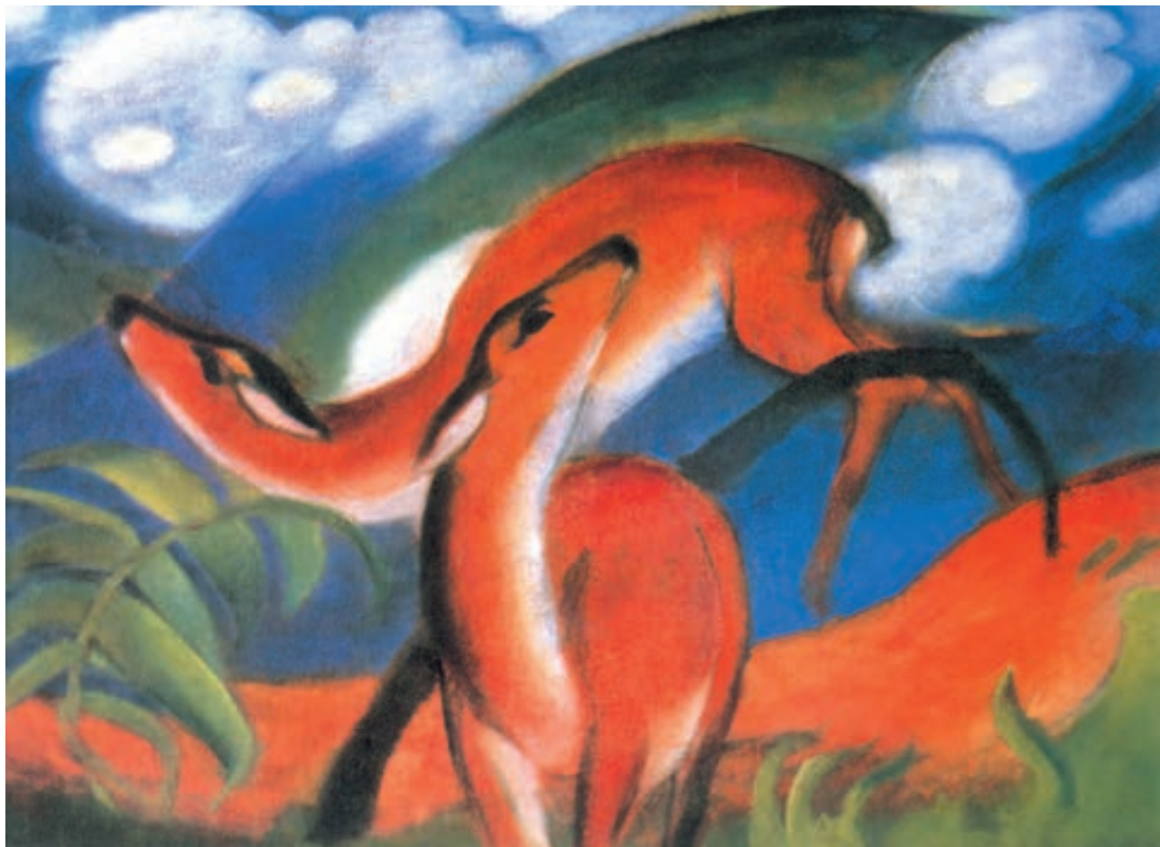
تصویر ۲۲-۳- فرانس مارک ۱۹۱۲- گوزن‌های قرمز

هنر «فیگوراتیو»، با تجدید حیاتی دوباره، بر بسیاری از جریانات هنر معاصر تأثیر نهاده است. چنان‌که بسیاری از شیوه‌های قبلی نمایش اندام، با فضایی جدیدتر در نقاشی معاصر احیا می‌شود.