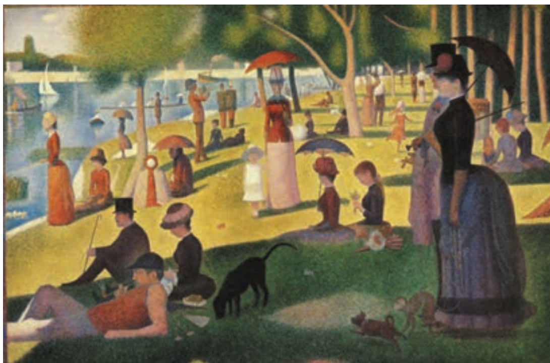
تصویر ۱۵-۳- ژرژسورا- جزیره ژات بزرگ- رنگ و روغن روی بوم