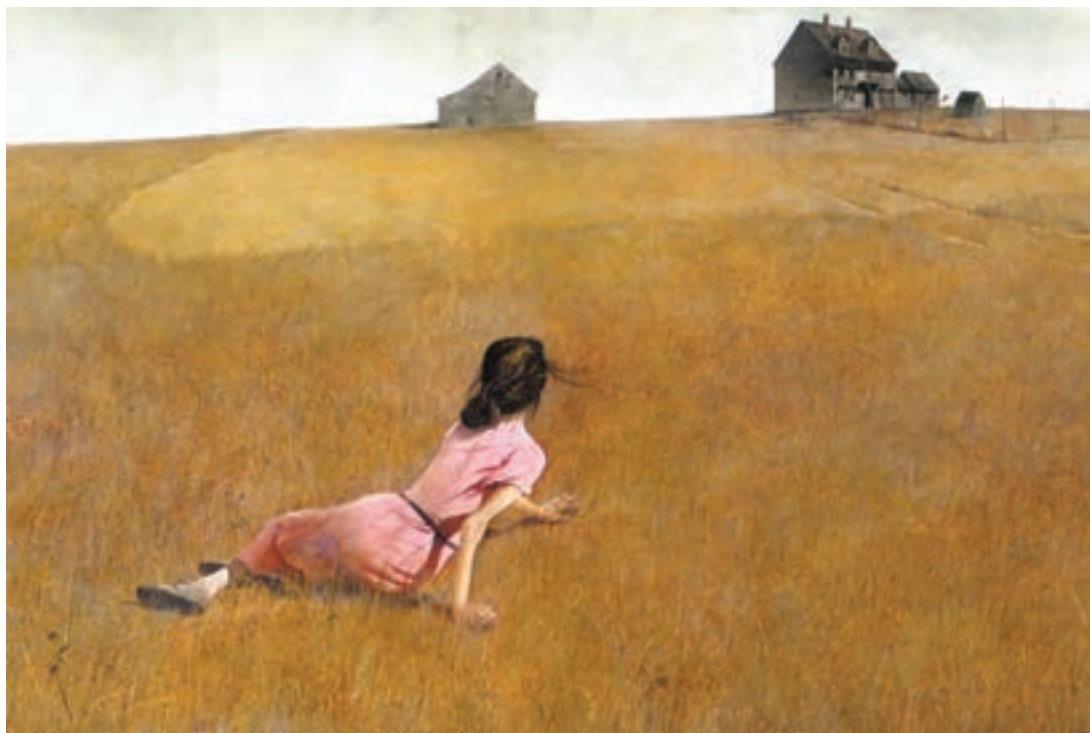
تصویر ۲۵-۳- اندرو وایت - دنیای کریستینا - تمپرا - ۱۹۴۸ - ۱۲۰×۸۰ سانتی متر