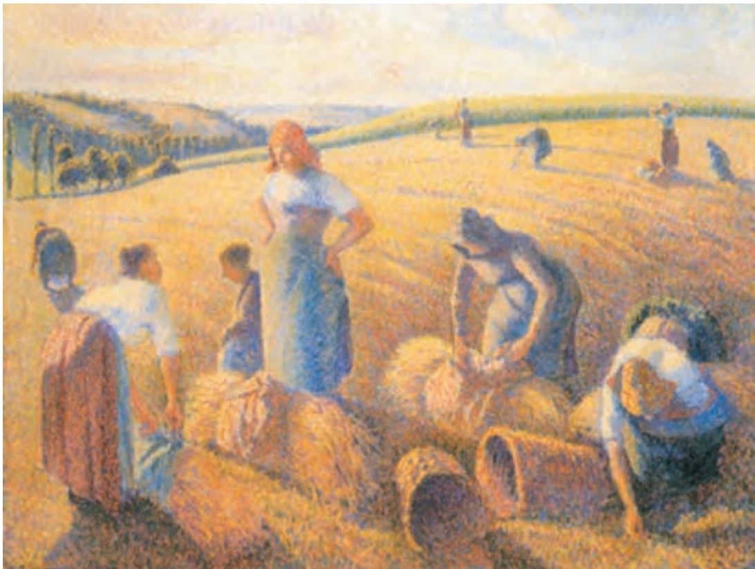
تصویر ۱۳-۳- کامیل پیسارو - منظره روستایی ۱۸۸۹