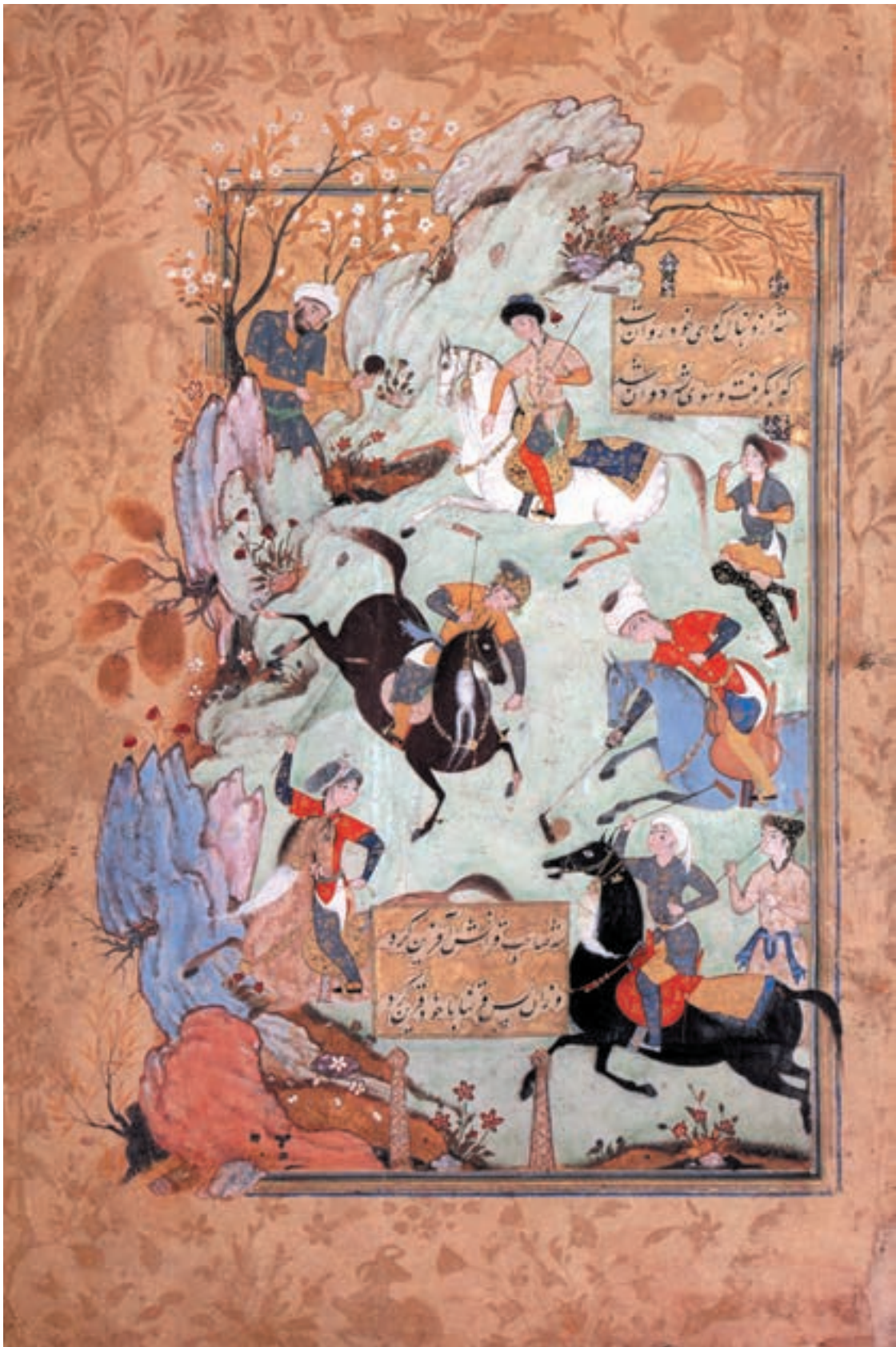
تصویر ۳-۳- نقاشی ایرانی آبرنگ روی کاغذ - احتمالاً مکتب قزوین