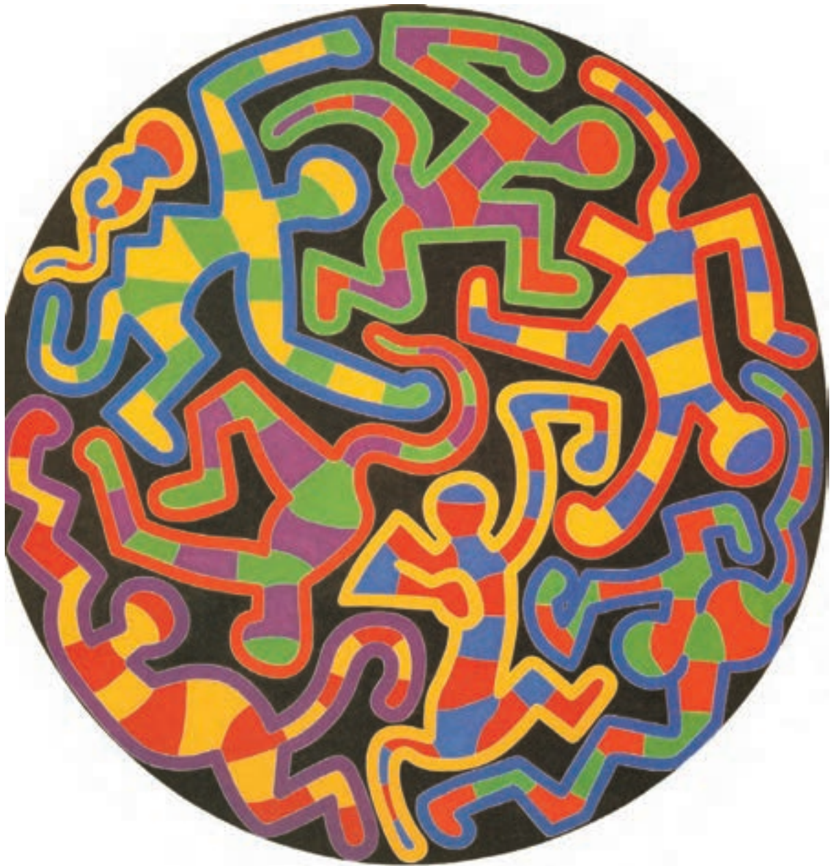
تصویر ۲۷-۳- کیت هارینگ - پازل میمون - ۱۹۸۸