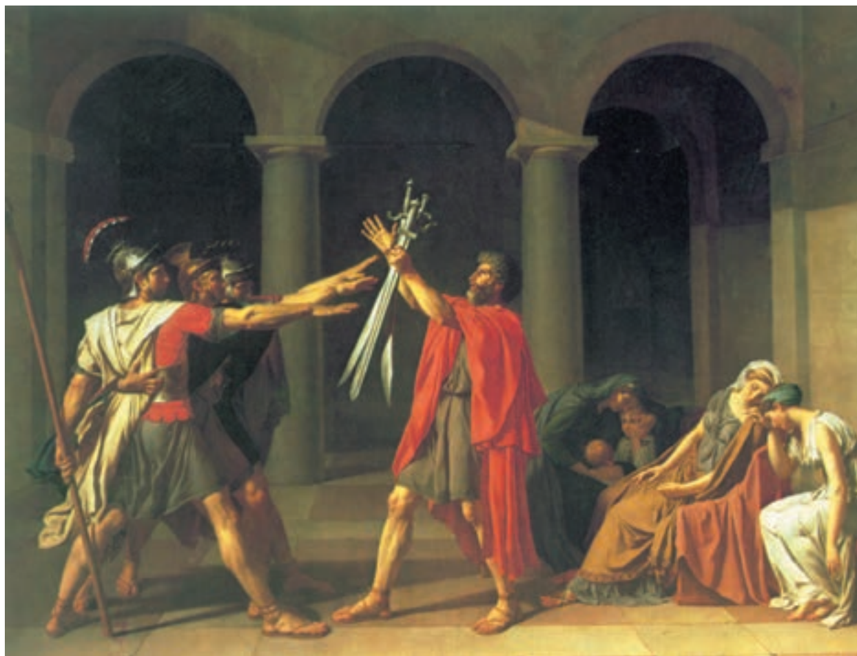
تصویر ۱-۳ - ژاک لویی داوید - سوگند هوراتیوس‌ها - ۱۷۸۴ - رنگ و روغن روی بوم ۳۳۰×۴۲۰ سانتی متر

شکوه و عظمت در نورپردازی باروک، پیکره‌ها را حجیم‌تر و حالات چهره را دقیق‌تر می‌نمایاند. در این عصر، چهره پردازی در آثار رامبراند، با نوعی موشکافی روان‌شناسانه و استفاده‌ی آزادانه از قشر رنگ همراه است. همین خصوصیات، به‌علاوهٔ تنوع در کاراکترسازی و موقعیت‌های فیگور در آثار گویا ۱ نیز به شکلی دیگر دیده می‌شود. گویا، روحیات رمانتی‌سیسم، رئالیسم و اکسپرسیونیسم را در دوره‌های مختلف آثارش به نمایش می‌گذارد. تجدید میثاق‌های رنسانس و یونان باستان در دوره‌ی «نتوکلاسیک» ۲ و ظهور موضوعات شاعرانه (تصویر ۱-۳ ) و افسانه‌ای در دوران رمانتی‌سیسم، پیکره‌نگاری را با تلقی‌ات این شیوه‌ها، توأم نمود.