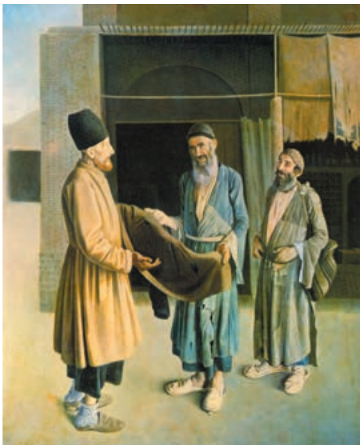
تصویر ۶-۳- کمال الملک شبیه عمو صادق شیرازی با کهنه فروشها - رنگ و روغن روی بوم - ۱۳۰۸ هـ.ق - ۶۹/۵×۵۳ سانتی متر