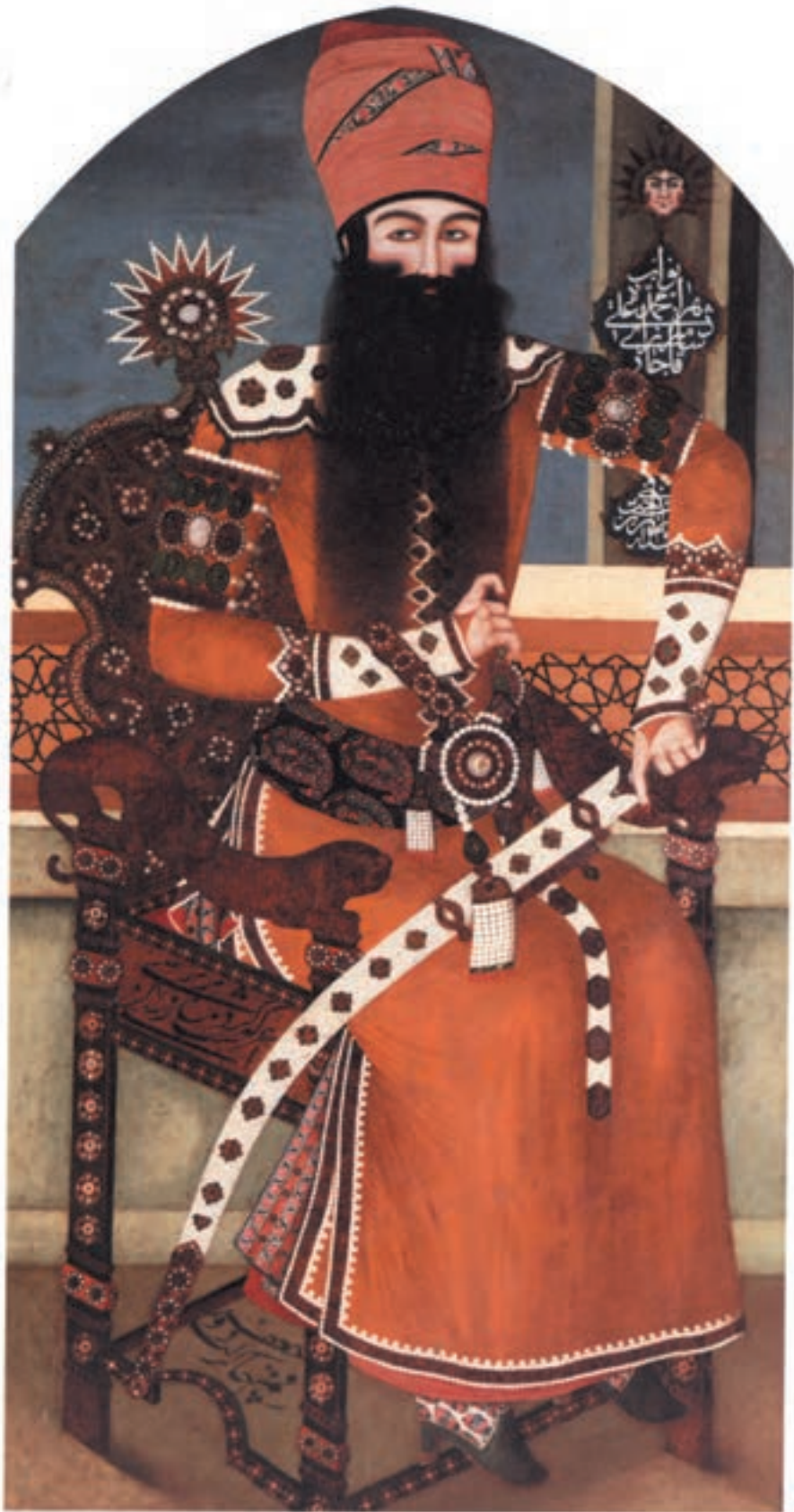
تصویر ۵-۳- محمدعلی میرزا - ۱۲۳۶ - (۱۸۲۰) رنگ و روغن روی بوم ۲۰۸×۱۰۷