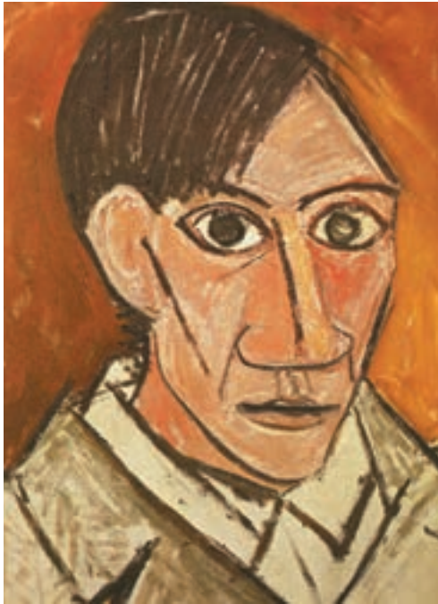
تصویر ۱۷-۳- پابلو پیکاسو - پرتره از خود - رنگ و روغن روی بوم