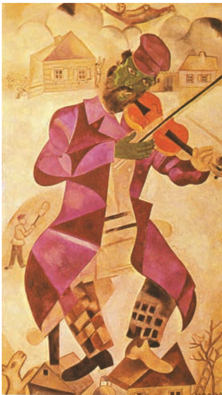
تصویر ۱۹-۳- مارک شاگال- ویولونزن- رنگ و روغن روی بوم