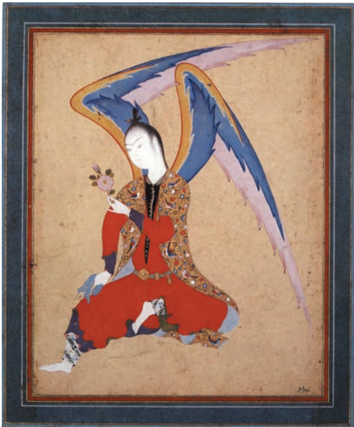
تصویر ۴-۳- فرشته نشسته - مکتب تبریز - آبرنگ و طلا روی کاغذ ۱۱×۱۳ سانتی متر