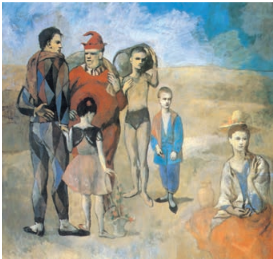
تصویر ۳-۱۶- پابلو پیکاسو - خانواده سالیمن بانک - رنگ و روغن روی بوم ۱۹۰۵

در نئو امپرسیونیسم، اندام‌ها به اشکال بسیار متنوع نقاشی می‌شوند. پیکره‌های مجسمه‌گون سورا ۱ (تصویر ۳-۱۵) و سزان ۲ ، حالت‌های نمادین و شبه باستانی گوگن ۳ و اغراق‌های وان گوگ ۴ و لوترک، این تفاوت‌ها را بهتر آشکار می‌سازد. تناقضات، تنش‌ها و اتفاقات اجتماعی و سیاسی، تأثیرات ژرفی بر شیوه‌های متأخرتر نهاد. اکسپرسیونیست‌ها با کژتابی‌ها و اغراق‌ها، «فوسیت‌ها» با رنگ‌های تابان و ضربات قلم‌مو، «کویست‌ها» با شکل‌های هندسی و برش‌هایی از سطوح مختلف پیکره، (تصاویر ۳-۱۶ و ۳-۱۷) «فوتوریست‌ها» ۵ با اضافه کردن حرکت به بینش کویستی (تصویر ۳-۱۸)، «سوررئالیست‌ها» ۶ با نامتعارف کردن وضعیت و شکل اندام، به صورت‌های گوناگون امکان نمایش اندام را توسعه دادند (تصاویر ۳-۱۹، ۳-۲۰ و ۳-۲۱). در این جریان‌ها هنرمندانی را می‌توان یافت که علاوه بر دستاوردهای شیوه خویس، از نقاشی‌ها و پیکره‌های شرقی، بدوی و باستانی سود جستند. به‌عنوان مثال، گوگن ۷ ، ماتیس ۸ و مودیلیانی ۹ ، از منحنی‌ها و ریتم زیبای نقاشی‌های ایرانی (تصاویر ۳-۲۲ و ۳-۲۳)، پیکاسو ۱۰ و براک ۱۱ از ماسک‌ها و پیکره‌های افریقایی (تصویر ۳-۱۷)، ویلیام بلیک ۱۱ و گوستاو کلیمت ۱۲ ، از پیکره‌های هخامنشی، آشوری و مصری بهره جستند.