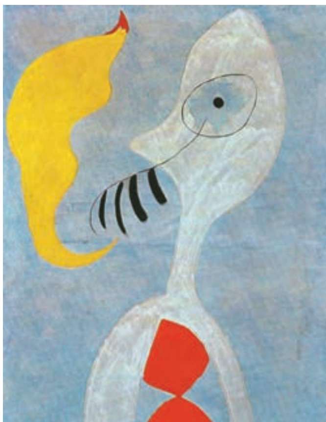
تصویر ۲۱-۳- سر کسی که پیپ می‌کشد- رنگ و روغن روی بوم ۱۹۲۵