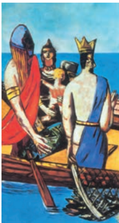
تصویر ۲۳-۳- ماکس بکمان - عزیمت - بخشی از قاب سه لوحی - ۳۲ - ۱۹۳۰ - رنگ و روغن روی بوم ۲/۲×۱۱۵ سانتی‌متر