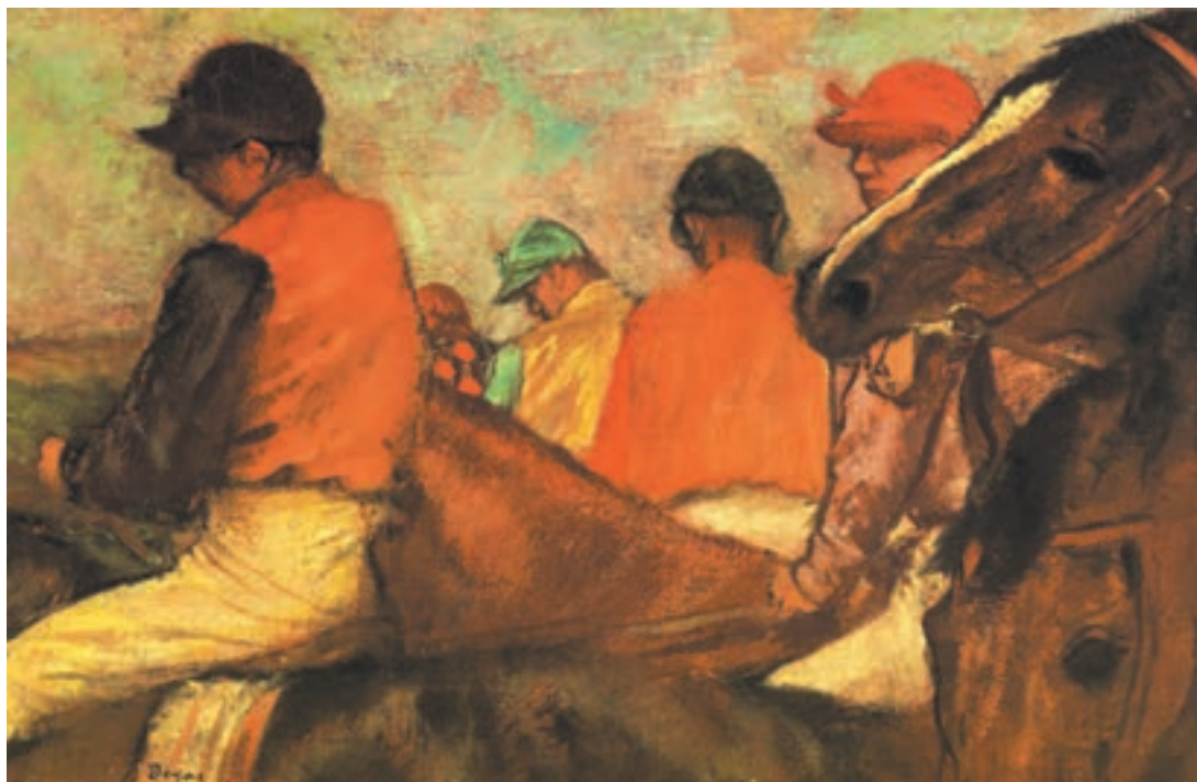
تصویر ۱۴-۳- ادگار دگا- سوارکاران- رنگ و روغن روی بوم

بسیاری از نقاشان امپرسیونیسم همچون دگا ۱ و لوترک ۲ ، موضوعاتی چون بالرین‌ها، بندبازان و سوارکاران را دستمایه کار خود قرار می‌دهند. این موضوعات، اندام‌ها را در حال حرکت و تغییر موقعیت نشان می‌دهند (تصویر ۱۴-۳).