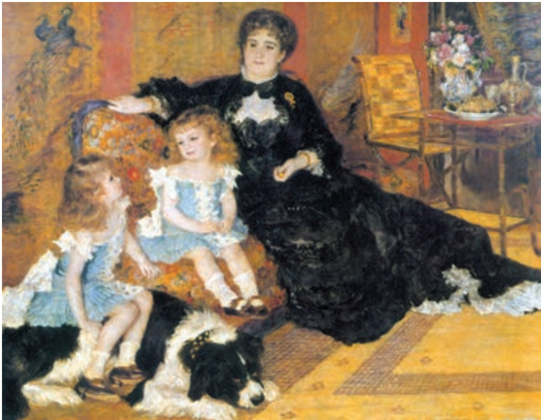
تصویر ۱۲-۳- اگوست رنوار- مادام شادنیپتر و بچه‌هایش- ۱۸۷۸م. رنگ و روغن روی بوم