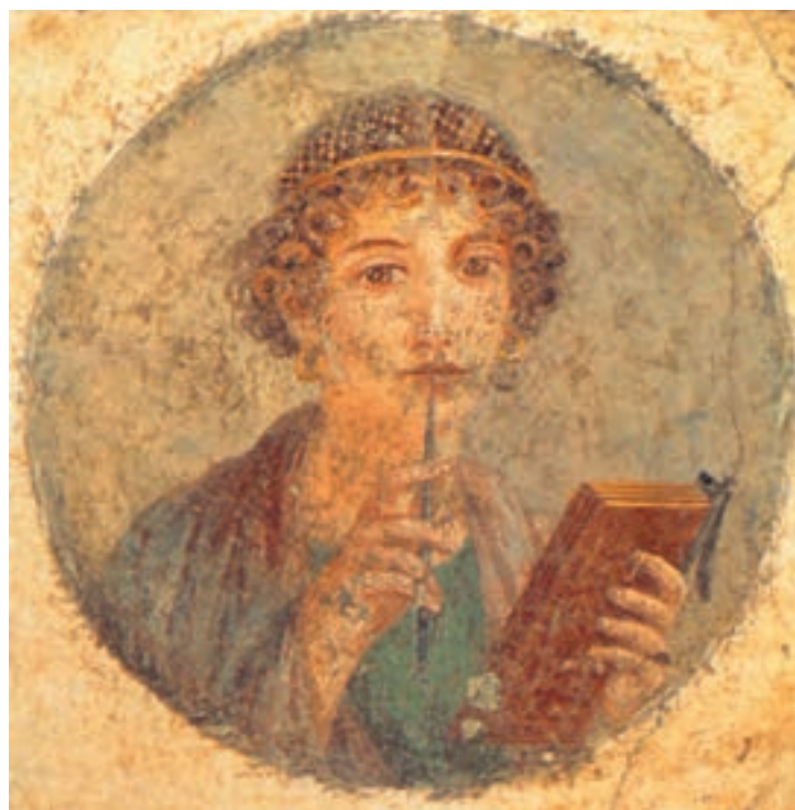
تصویر ۳-۲ - نقاشی دیواری - روم باستان