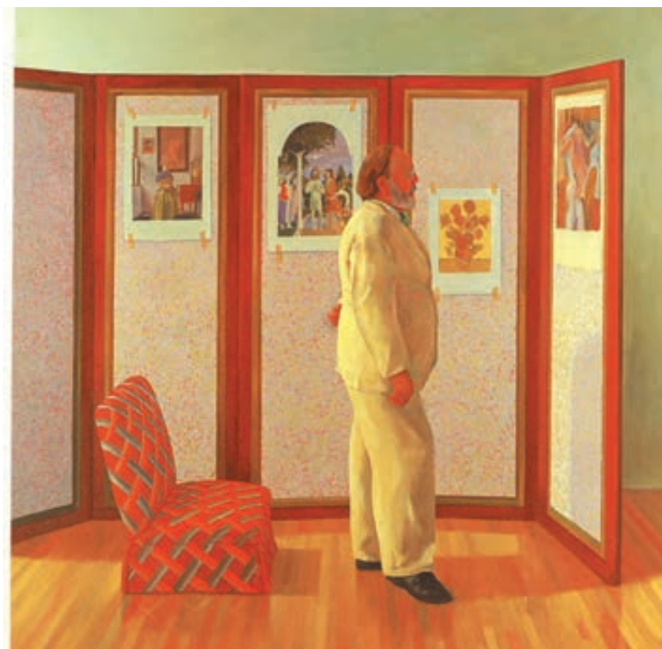
تصویر ۲۶-۳- دیوید هاکنی - نگاه کردن تصاویر روی پاراوان - ۱۹۷۷ - رنگ و روغن روی بوم - ۷۲×۷۲ سانتی متر