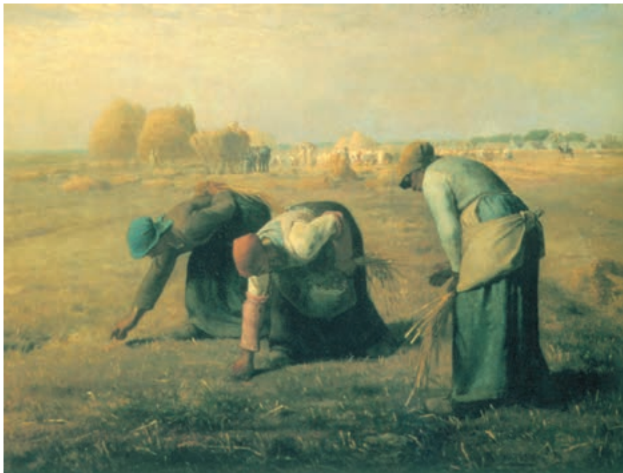
تصویر ۱۱-۳- ژان فرانسوا امیله - خوشه‌چینان ۱۸۵۷ - ۸۴×۱۱۰ سانتی‌متر

ظهور عکاسی، مهاجرت روستاییان به شهر و زندگی صنعتی، پیکره نگاری را از حالت آرمانی و رسمی خارج ساخت. نقاشان رئالیسم چون کوربه و دومیه ۱ ، بر زندگی مردم عادی در فضاهای معمولی تأکید ورزیدند. از این پس، فیگورهای افراد عادی نیز در پرده‌های نقاشی راه یافت (تصویر ۱۱-۳). آنچه در دگرگونی نگرش نسبت به پیکره در امپرسیونیست‌ها مشهور است، توجه به لحظات آنی و کشفیاتی در نور و رنگ است (تصاویر ۱۲-۳ و ۱۳-۳).