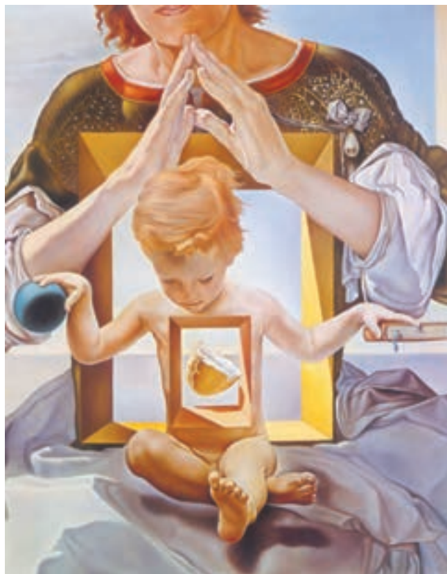
تصویر ۲۰-۳- سالوادور دالی- بخشی از مادونای پورت لیگا ۱۹۵۰- رنگ و روغن روی بوم- در این تصویر مناسبات اشیا و اندام‌ها به هم خورده و حالتی رؤیگونه و غیرواقعی گرفته است.