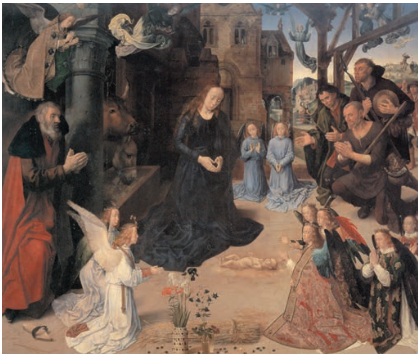
تصویر ۸-۳- هوگو وان درگوز- نقاشی رنگ و روغن روی بوم- ۱۴۷۶ م. ۲۵۳×۳۰۵ سانتی‌متر

نسبت‌های اندام، اجزای بدن و طرز قرار گرفتن آن‌ها، تحلیل ویژگی‌های هنری هر منطقه را آسانتر می‌سازد. عصر رنسانس با احیای پیش‌کلاسیک یونان، نقاشی پیکره را وارد مرحله جدید می‌کند. کشف پرسپکتیو و برجسته‌نمایی و تنوع حرکات اندام و همچنین، توجه به آناتومی و تشریح بدن، امکانات تازه‌تری را در اختیار هنرمند قرار می‌دهند (تصویر ۸-۳).