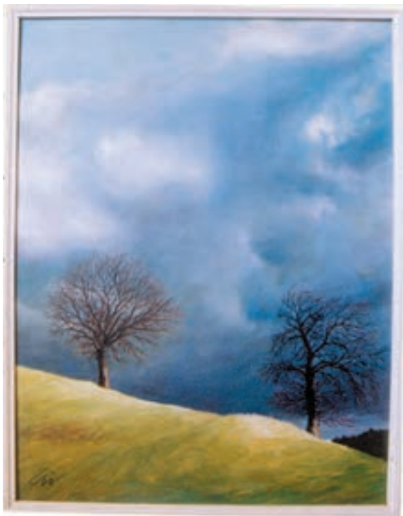
تصویر ۶۶-۲- نقاشی منظره به شیوه ساخت و ساز (نویسندگان)