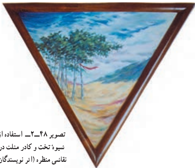
تصویر ۴۸-۲ استفاده از شیوه تخت و کادر مثلث در نقاشی منظره (اثر نویسندگان)

شیوه تخت یا هندسی: در این شیوه، ترکیب‌بندی مناسبی را از طبیعت انتخاب کرده، اشکال آن را ساده می‌کنیم. باید سعی شود، سایه‌روشن‌ها و رنگ‌مایه‌ها به صورتی تفکیک شده، کنار هم قرار گیرند.