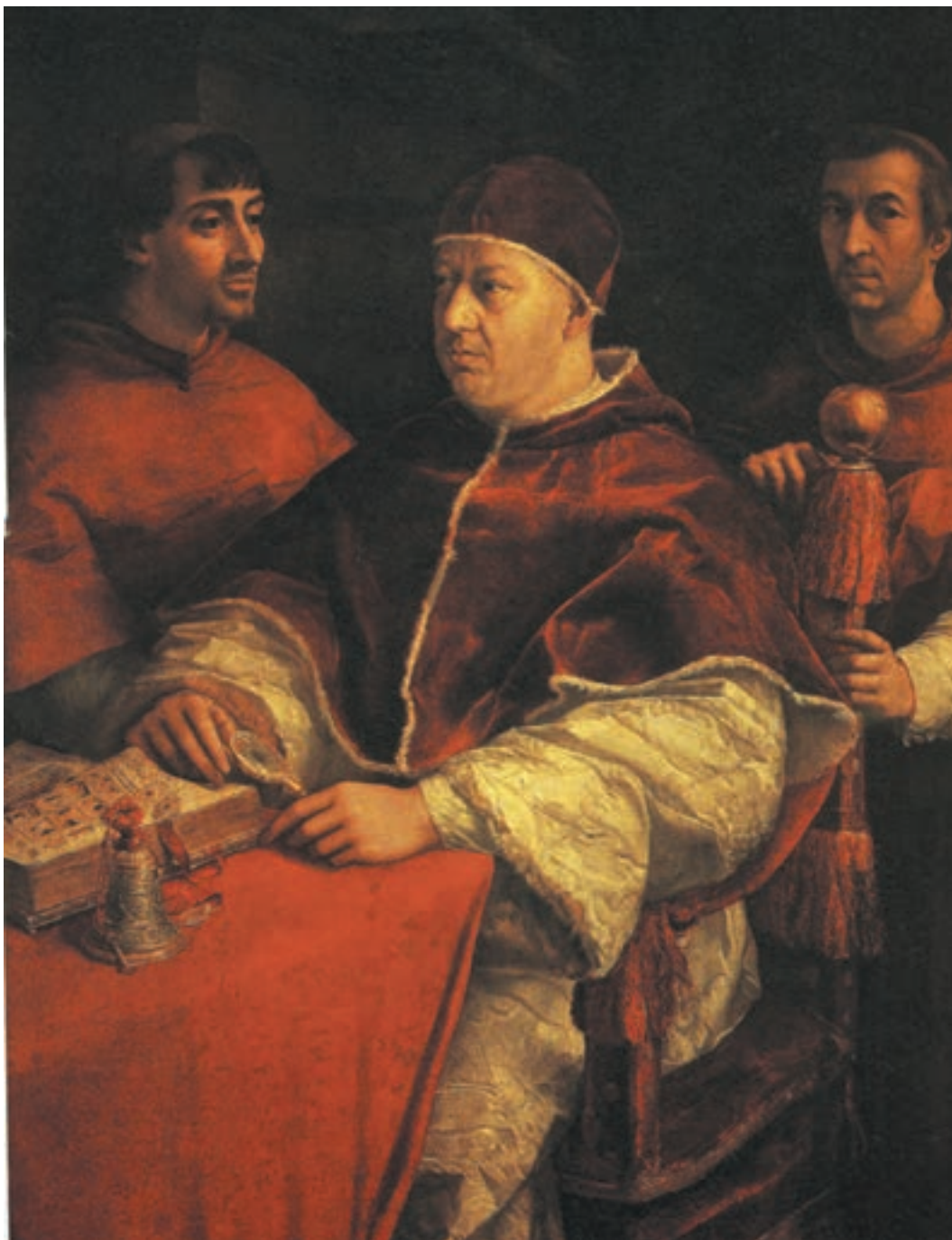
تصویر ۹-۳- رافائل سانتسیو - پاپ و کاردینال‌ها - رنگ و روغن روی بوم

اندام‌های عضلانی و متنوع در آثار میکل آنژ ۱ ، سایه‌پردازی‌های ملایم و شاعرانه در پیکره‌های لئوناردو داوینچی ۲ و حس معصومانه مریم و کودک‌های رافائل ۳ ، از دستاوردهای همین دوران به‌شمار می‌روند (تصویر ۹-۳). ال گرکو و پوترمو ۴ در شیوه‌ی «منریسم» ۵ ، آموزه‌های رنسانس را با اغراق در حالات بدن توأم می‌کنند.