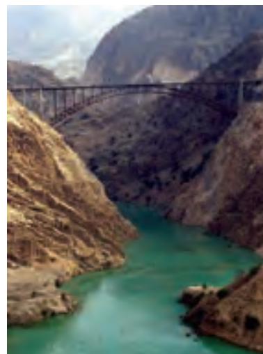
بزرگ‌ترین پل قوسی فولادی در ایران بر روی رودخانه کارون