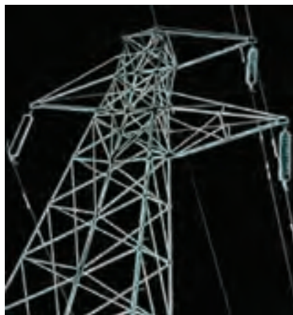
دکل انتقال برق