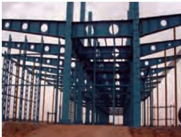
شکل ۲-۵- سازه‌های قابی صنعتی