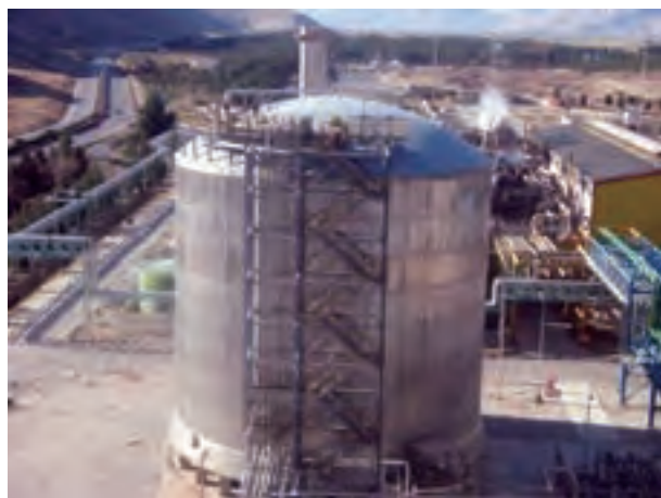
شکل ۲-۷- سازه پوسته‌ای- مخزن آمونیاک واقع در مجتمع پتروشیمی

سازه‌های پوسته‌ای به صورت گوناگون از قبیل مخازن نگهداری مایعات و گازهای تحت فشار، سیلوها، سقف‌های گنبدی و موارد مشابه در عمل مورد استفاده قرار می‌گیرند و در شکل ۲-۷ مثالی از کاربرد آن‌ها نشان داده شده است.