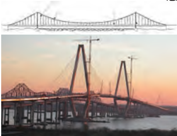
شکل ۲-۸- پل معلق

سازه‌های معلق اغلب در طرح پوشش‌ها (سقف‌ها) و پل‌های با دهانه بلند مورد استفاده قرار می‌گیرند (شکل ۲-۸ و ۲-۹). در چنین سازه‌هایی یک اسکلت قاب‌بندی شده وجود دارد (مثلاً در پل‌سازی، عبورگاه یا عرشه پل و در پوشش‌ها، اسکلت سقف) که توسط آویزهایی از کابل‌های کششی اصلی آویزان است. استفاده از سازه‌های معلق در پل‌سازی بسیار متداول است.