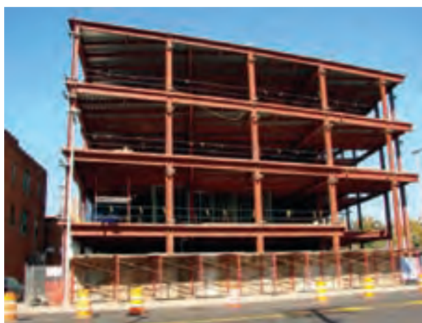
شکل ۲-۴- سازه‌های قابی سافتمانی