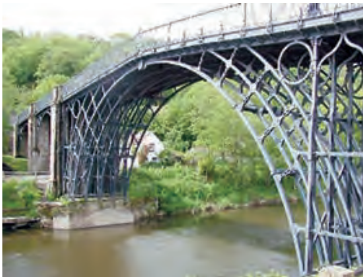
شکل ۲-۲- اولین پل فلزی جهان