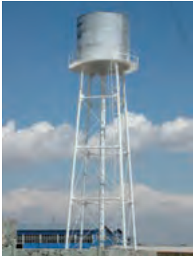
ب- سازه‌ی مصنوعی (منبع آب)

در شکل ۱-۲ دو نوع سازه‌ی طبیعی و مصنوعی نشان داده شده است.