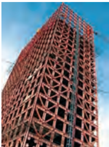
نمونه‌ی سازه‌ای سافتمانی در تهران