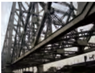
شکل ۲-۶- قسمت‌هایی از پل‌های فولادی