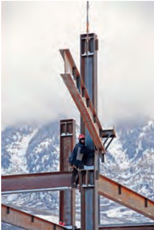
اجرای اسکلت فولادی در ارتفاع

از دیگر مزایای اسکلت فولادی می‌توان به امکان توسعه‌ی سازه، اتصال چند قطعه به یکدیگر توسط جوش یا پیچ، امکان پیش‌ساخته کردن قطعات، سرعت نصب، اشغال فضای کمتر، و قابلیت کاربرد در ارتفاع زیاد اشاره کرد.