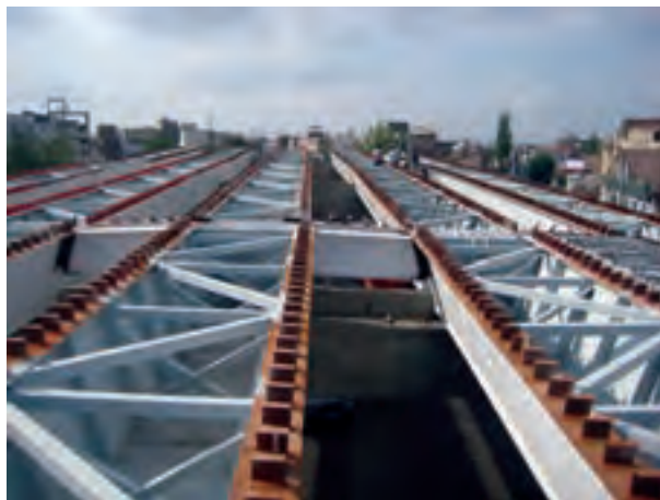
شکل ۲-۶- سازه یک پل در حال سافت