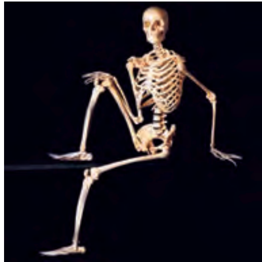
الف- سازه‌ی طبیعی (اسکلت انسان)