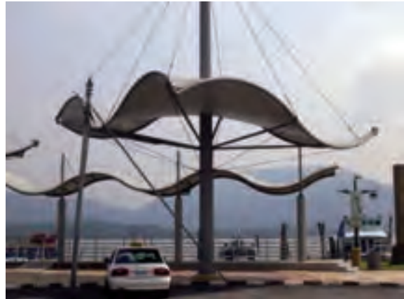
شکل ۲-۹- سازه‌ی معلق