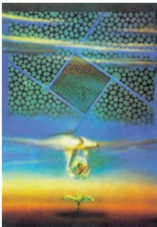
طراح ابوالفضل عالی

صبح، دو مرغ رها بی صدا صحن دو پشمان تو را ترک کرد شب، دو صف از یاکریم بال ببال نیم از لب دیوار دلت پرکشید ۲ آفتاب، خار و خش مزرعه چشم تو آبشار، موج فروخته ای از خشم تو می شود از باغ نگاهت، هنوز یک سبد از میوه خورشید،