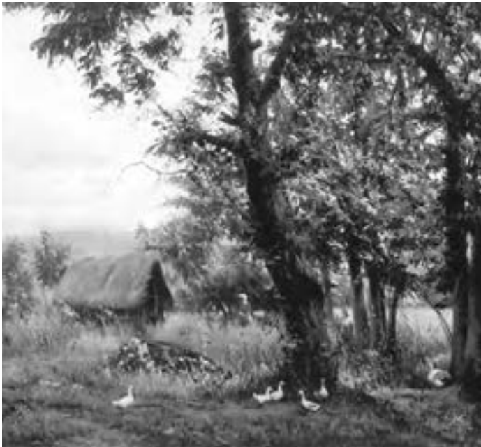
نقاشی آبرنگ اثر: رحیم نوده‌سی