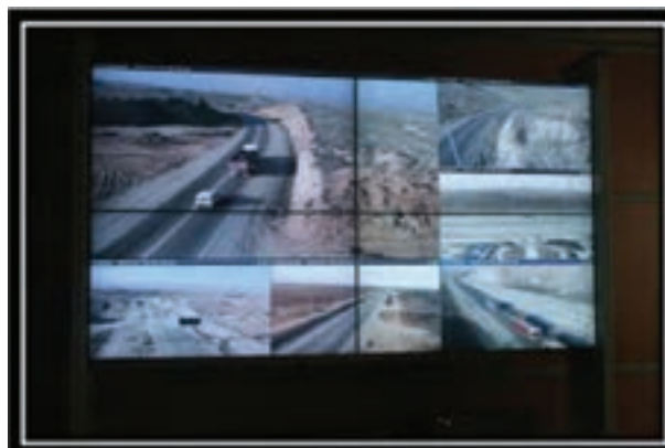
شکل ۶-۷- بخشی از فعالیت‌های انجام گرفته پس از انقلاب اسلامی در بخش راه و ترابری استان