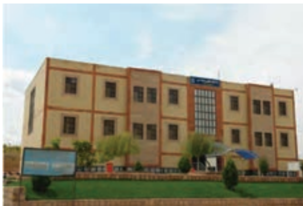
شکل ۶-۸- نمایی از پروژه‌های آموزشی استان بعد از پیروزی انقلاب اسلامی