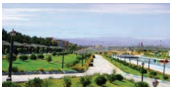
شکل ۵-۶- نمایی از پروژه‌های مهم عمران شهری در استان بعد از پیروزی انقلاب اسلامی