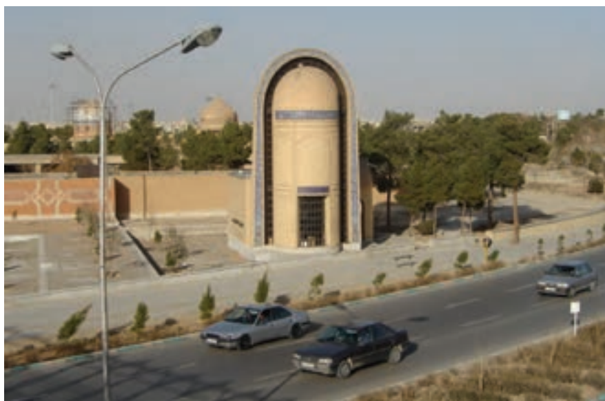
شکل ۱۴-۶- مقبره دانشمند بزرگ بانو مجتهده امین - تخت فولاد اصفهان

علاوه بر مردان نام‌آور در تاریخ این استان بزرگ، بانوانی در صحنه علم، هنر و اخلاق در دامن این استان پرورش یافته‌اند که می‌توان به بزرگانی چون ام‌الفارسیه (اولین ایرانی مسلمان)، فاطمه جوزدانی، آمنه بیگم مجلسی، مریم بانو نائینی، هما امامزاده (اولین پزشک زن ایرانی از شهرضا)، بی‌بی‌جان کاشانی و بانو مجتهده امین اشاره کرد.