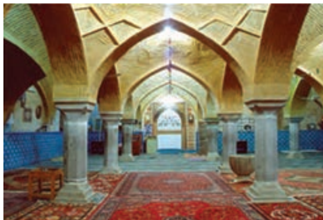
شکل ۷-۶- مسجد جامع شهرضا باقی‌مانده از زمان سلجوقیان

کوشش کردند. بناهای بسیاری ساخته شد که هنوز بسیاری از آن‌ها پابرجاست. همچنین احداث چهارباغ ملکشاهی، آثار بسیار ارزشمند معماری و هنر اسلامی به‌ویژه در مسجد جامع اصفهان مانند گنبد نظام‌الملک و گنبد تاج‌الملک که به نظر باستان‌شناسان جهانی از آثار اعجاب‌انگیز محسوب می‌شوند، مسجد جامع اردستان، مسجد جامع زواره، مسجد جامع شهرضا، مسجد جامع گلپایگان نیز از جمله آثار ارزشمند معماری این دوره است.