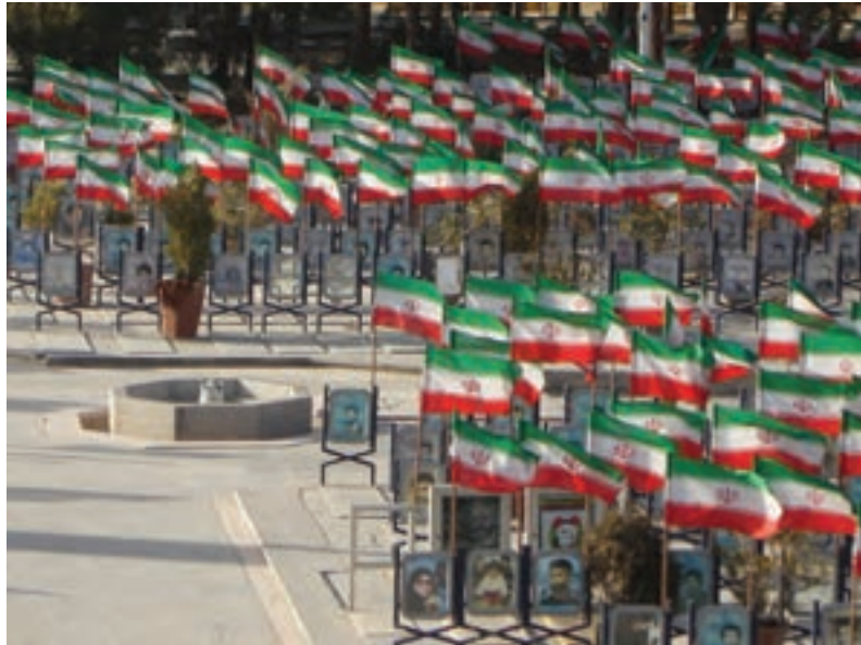
شکل ۱۷-۶- نمایی از گلستان شهدای اصفهان

مجموعهٔ چنین ارزش‌های کم‌نظیر تاریخی، فرهنگی و اجتماعی اصفهان باعث شد تا این شهر در سال ۱۳۸۵ از سوی سازمان کنفرانس اسلامی، به عنوان پایتخت فرهنگی جهان اسلام انتخاب شود. هم‌چنین در حال حاضر به عنوان پایتخت فرهنگ و تمدن ایران اسلامی نامگذاری شده است. جهت حفظ و گسترش این میراث ارزشمند چه باید کرد؟