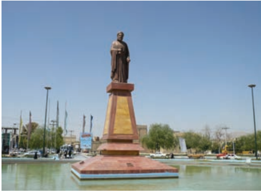
شکل ۱۰-۶ تندیس شیخ بهایی (ورودی شهر نجف آباد)

به غیر از شهر اصفهان در سایر شهرها و حتی روستاهای استان نیز آثاری از دوره صفویه به چشم می خورد؛ مثلاً کاشان، خوانسار، نجف آباد (ایجاد شهر در زمان صفویه)، کوهپایه و نائین.