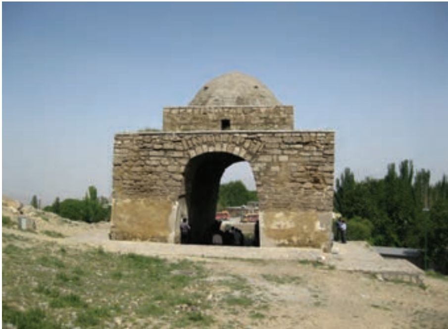
شکل ۵-۶- چهارطاقی نیاسر، مرکز انجام مراسم آیینی و اندازه‌گیری نجومی و تقویم‌نگاری در گذشته

در زمان فرمانروایی مادها، ایران دارای سه ایالت بزرگ بود که یکی از این ایالت‌ها بخش بزرگی از غرب استان اصفهان امروزی ایالتی به نام پارتاکن یا پارتیکان فریدن، فریدون‌شهر و چادگان امروزی به مرکزیت گابای (گی، جی) بود. اصفهان در زمان امپراتوری هخامنشیان به نام گابای یا گی شناخته می‌شده است. در عهد اشکانیان، حکومت ایران ملوک الطوائفی بود و بر هر یک از قسمت‌های مهم و وسیع آن، حکمرانی که لقب شاه داشت، فرمانروایی می‌کرد. در آن زمان، اصفهان یک ساتراپ (استان) به شمار می‌آمد. در دوره امپراتوری ساسانیان، آبادی‌های فراوانی در سطح استان اصفهان وجود داشته که آثاری از آنها باقی مانده است؛ مانند قلعه‌های متعدد ساسانی در آران و بیدگل (قلعه شرقی)، در سمیرم (تل نقاره و تل دهنه و گور دخمه طاقچه بت)، در فریدن (تپه خویگان)، در نائین (چهارطاقی شیرکوه، قلعه شیرکوه و چهارطاقی نخلک)، در نیاسر کاشان (چهارطاقی نیاسر)، در اصفهان (بنای آتشگاه و پل شهرستان) و بسیاری آثار دیگر. در این زمان، شهر اصفهان را سپاهان یا محل تجمع سپاه می‌نامیدند که واژه اصفهان از آن گرفته شده است. سپاهان محل سکونت و قلمرو خاندان‌های مهم حاکم و فرمانروایان و دژ مستحکمی برای ساسانیان بود.