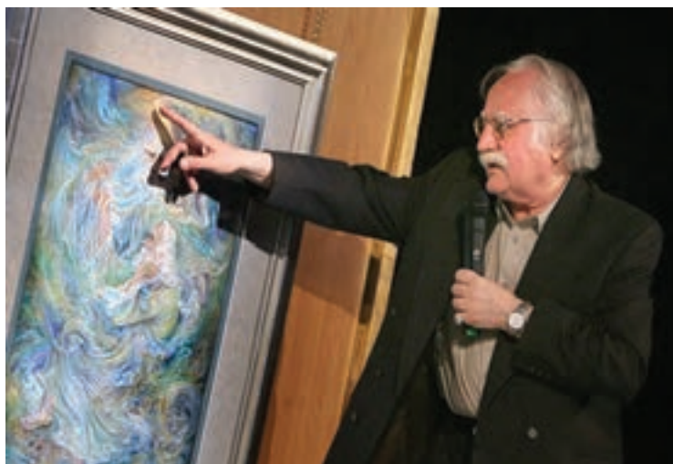
شکل ۱۵-۶- استاد محمود فرشچیان نقاش و طراح معروف معاصر