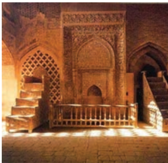
شکل ۸-۶- محراب الجایتو - جامع اصفهان

میدان عتیق (در محل فعلی میدان قیام اصفهان) نیز از میادین بزرگ عصر خود محسوب می‌شد که از آثار دوره سلجوقیان بود. این میدان به مرور زمان به دست فراموشی سپرده شده بود ولی به همت مسئولان شهر اصفهان در حال بازسازی است. ۳- دوره حکومت صفویه : اصفهان پایتخت دولت صفوی بود.