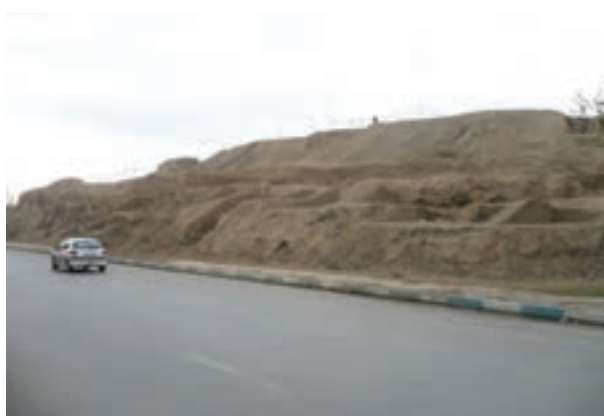
شکل ۴-۶- تپه اشرف باقی مانده بنای کهن سارویه (نزدیک پل شهرستان اصفهان)

از اصفهان پیش از اسلام؛ یعنی زمان هخامنشیان، اشکانیان و ساسانیان اطلاعات زیادی در دست نیست و آثار چندانی برجای نمانده است ولی آنچه مسلم است، از آنجا که استان اصفهان از لحاظ جغرافیایی در مرکز ایران واقع شده است، وجود دشت‌های وسیع و حاصل خیز و در برخی از مناطق، منابع آب فراوان - مانند زاینده رود - جاذبه‌هایی در آن ایجاد کرده است؛ از این رو، تمامی حاکمان در طول تاریخ نسبت به آن توجه ویژه داشته‌اند و تلاش همه‌جانبه آنها این بوده است که تسلط خود را بر این منطقه حفظ کنند. در دوران اساطیری، وجود داستان‌هایی مانند ماجرای کاوه آهنگر همان چهره آزاده که علیه ستم ضحاک قیام کرد و به کمک فریدون ملت ایران را از بند اسارت آزاد کرد و هم اکنون نیز در منطقه فریدن در روستایی به نام مشهد کاوه، آرامگاهی منسوب به این قهرمان ملی دیده می‌شود، نشان از مرکزیت قدرت سیاسی در این قسمت کشور دارد. وجود دژی بسیار بزرگ همانند اهرام مصر به نام کهن‌دژ سارویه در حاشیه اصفهان امروزی که آثار آن تا هزار سال قبل هنوز برجای بوده و امروزه بخشی از آن در کنار پل شهرستان به نام تپه اشرف باقی مانده است و نیز بقایای آتشکده منسوب به عصر ساسانیان در ماربین اصفهان (کوه آتشگاه)، نمونه‌ای از آثار برجای مانده از پیش از اسلام است.