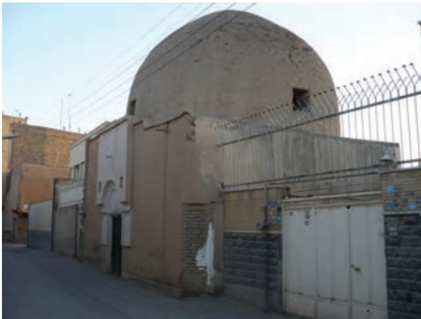
شکل ۱۳-۶- محل تدریس بوعلی سینا در اصفهان — خیابان ابن سینا

سلمان فارسی، یار صدیق پیامبر بزرگوار اسلام، از مردم این سامان بوده است و کاوه آهنگر، مبارز راه عدالت و آزادی، از مردم پرتیکان بود. در اوج درخشش تمدن اسلامی که ایرانیان از پیشگامان علوم و فنون اسلامی بودند، بسیاری از دانشمندان رشته‌های مختلف از این استان برخاسته یا زندگی علمی خود را در این سامان گذرانده‌اند. در قرن چهارم هجری قمری، شخصیت‌های برجسته‌ای چون حمزه اصفهانی، صاحب بن عباد، حافظ ابونعیم، ابن مسکویه، ابوالفرج اصفهانی، ابن سینا (گرچه در اصفهان متولد نشد ولی بیشتر آثار علمی او در این شهر شکل گرفت و شاگردان معروفی را در این شهر تربیت کرد) مدت زیادی به تألیف، پژوهش و تربیت شاگردان در این شهر پرداختند. از دوره سلجوقیان تا شروع دوره صفویه استان اصفهان علما و شعرای بسیاری را به خود دید که از آن جمله می‌توان به خواجه نظام‌الملک (مؤسس مدارس نظامیه)، راغب اصفهانی، عمادالدین کاتب، غیاث‌الدین جمشید کاشانی، جمال‌الدین عبدالرزاق و کمال‌الدین اسماعیل که هر کدام از مشاهیر عصر خود بوده‌اند، اشاره کرد.