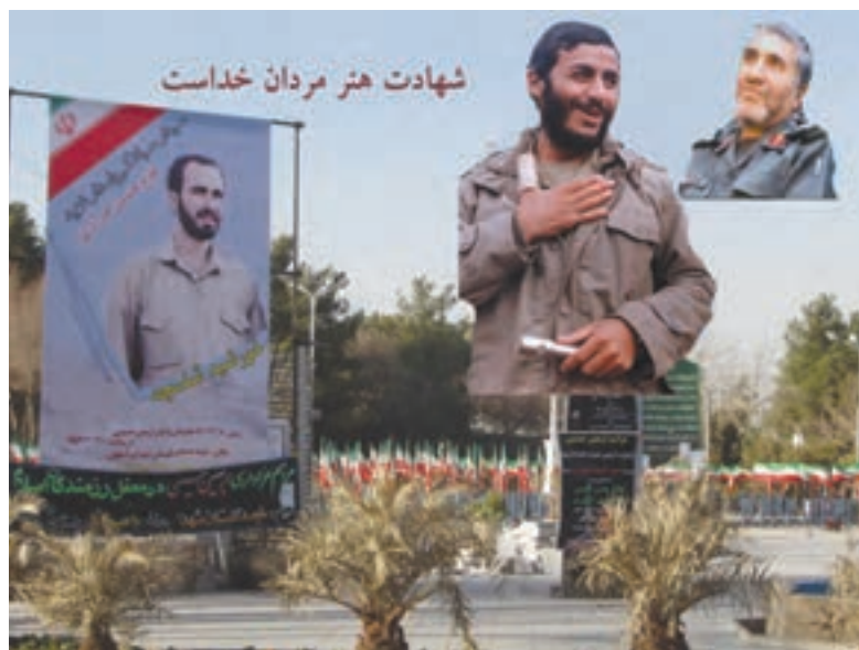
شکل ۱۶-۶- تصویر برخی از سرداران شهید استان اصفهان

مردم استان در سال‌های دفاع مقدس ضمن حضور فعال و مؤثر در بسیاری از عملیات‌ها (فرماندهی لشکر امام حسین، تیپ نجف اشرف، تیپ کربلا) در پشتیبانی از جبهه‌ها و رزمندگان اسلام (در قالب کاروان‌های وحدت و شهید بهشتی) نقش تعیین‌کننده داشته‌اند. امام درباره مردم این استان می‌فرماید: در کجای دنیا می‌توانید جایی را مانند اصفهان پیدا کنید. تقدیم ۲۳ هزار شهید و ۴۱ هزار جانباز و ۳۴۶۰ آزاده سرافراز بخشی از ایثارگری‌ها و افتخارات مردم این استان محسوب می‌شود. وجود سرداران افتخارآفرین و حماسه‌ساز همانند شهید حاج حسین خرازی (فرمانده لشکر امام حسین «ع»)، شهید ابراهیم همت (فرمانده لشکر محمد رسول‌الله تهران)، شهید مصطفی ردانی‌پور، شهید عبدالله میثمی، شهید آقابابایی، شهید احمد کاظمی و بزرگان دیگری در عرصه دفاع مقدس همگی نشان از حضور افتخارآمیز مردم استان در میدان‌های تعیین سرنوشت ملت ایران دارد.