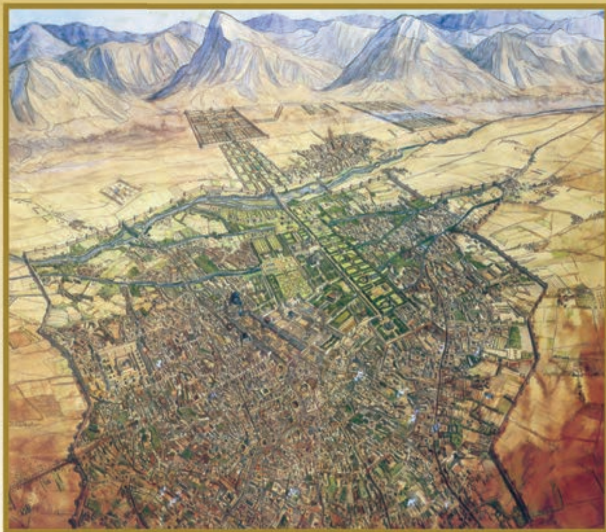
شهر اصفهان — صفویه