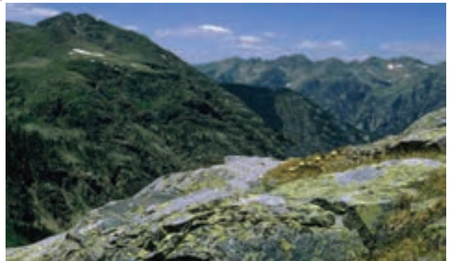
شکل ۲۳-۱۲- قلّه میلاد شناسکوه شهرستان زیرکوه