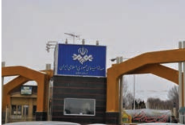
شکل ۵-۶- صدا و سیمای استان مرکزی

– صدا و سیمای استان امکان استفاده از ۸ شبکه تلویزیونی را با پوشش مناسبی برای تمام شهرها و روستاهای استان فراهم کرده است و شبکه استانی «آفتاب» ۸۲ درصد از جمعیت استان را پوشش می‌دهد.