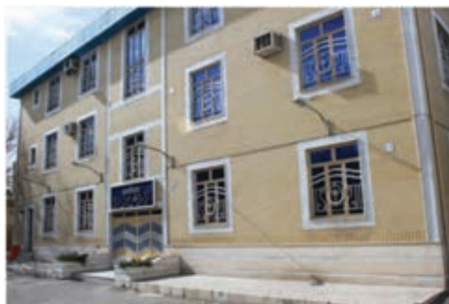
شکل ۶-۶- مرکز آموزش نیروی انسانی

۶- آموزش عالی: استان مرکزی به دلیل پیشینه تاریخی، دینی، فرهنگی، سیاسی و علمی؛ و موقعیت مناسب جغرافیایی، همچنین مجاورت با مراکز علمی و برخورداری از جوانان مستعد و فراهم بودن زیرساخت‌های صنعتی و کشاورزی، زمینه توسعه مراکز دانشگاهی را داراست. در این استان برای تربیت نیروی انسانی متخصص در مقاطع کاردانی، کارشناسی، کارشناسی ارشد و دکترای حرفه‌ای؛ مراکز دانشگاهی از یک مرکز به ۶۵ مرکز (دولتی، آزاد اسلامی، پیام نور، جامع علمی - کاربردی و غیرانتفاعی) افزایش یافته است. رشته‌های دانشگاهی در استان مرکزی به ۷۶۲ رشته و اعضای هیئت علمی و غیرهیأت علمی به ۴۹۶۱ نفر رسیده است.