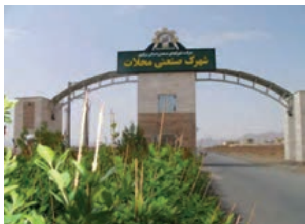
شکل ۱۹-۶- شهرک صنعتی محلات

در سرمایه‌گذاری معادن، تبدیل روش‌های انفجاری به روش‌های برش الماسه، افزایش راندمان بهره‌برداری.