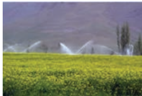
شکل ۱۲-۶- آبیاری بارانی در محلات