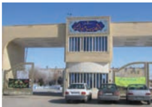
شکل ۸-۶- دانشگاه‌های استان مرکزی