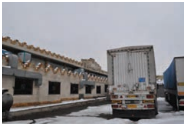
شکل ۲۰-۶- گمرک اراک