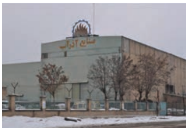
شکل ۱۸-۶- شرکت آذراب اراک

۱۲- بازرگانی : استان مرکزی چهارمین قطب صنعتی کشور است و محصولات تولیدی آن به داخل و خارج کشور صادر