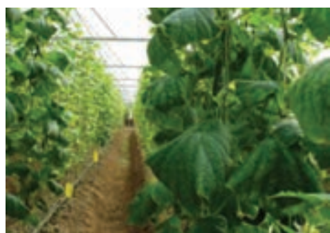
شکل ۱۶-۶- مجتمع گلخانه‌ای صیفی‌جات در امان آباد