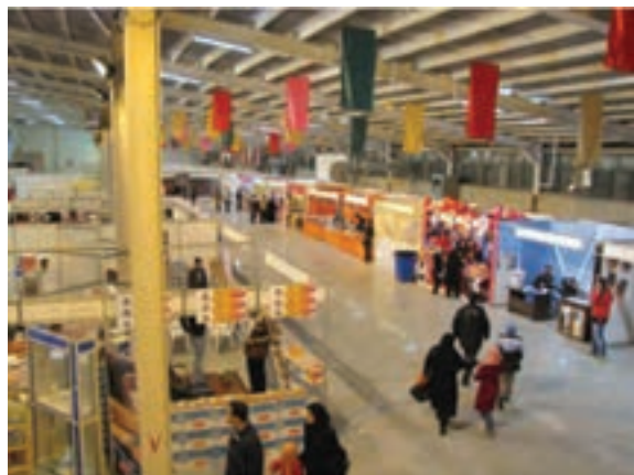
شکل ۲۱-۶- نمایشگاه فصلی فروش کالا در اراک

– محصولات تولیدی پتروشیمی، معدن، شمش، پروفیل آلومینیوم، سازه فلزی، تجهیزات نیروگاهی و پالایشگاهی، مخازن، دیگ بخار، جرثقیل، واگن قطار، ماشین آلات راه سازی، کمباین، ادوات کشاورزی، مصالح ساختمانی، لاستیک، سیمان، بلور، چینی، انواع رنگ، محصولات کشاورزی، دامداری و ... .