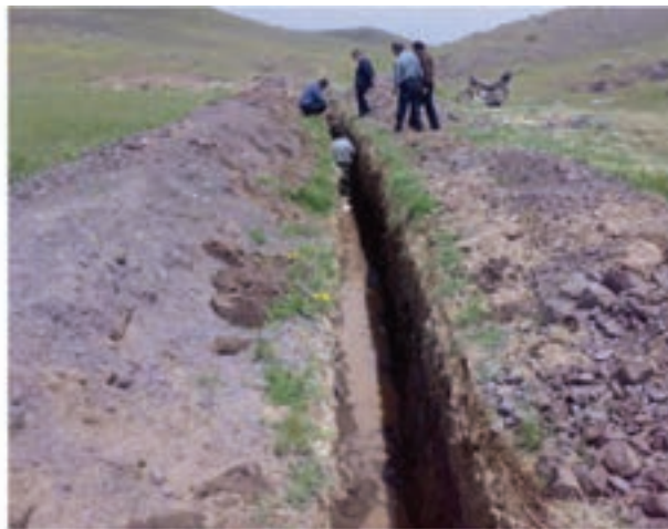
شکل ۳-۶- آبرسانی در ساوه

— خدمات گاز رسانی: در حال حاضر ۲۲ مرکز شهری و ۱۶۴ روستای استان تحت پوشش گاز طبیعی قرار گرفته و سایر مراکز شهری و روستایی در آینده تحت پوشش گاز طبیعی قرار می‌گیرند.