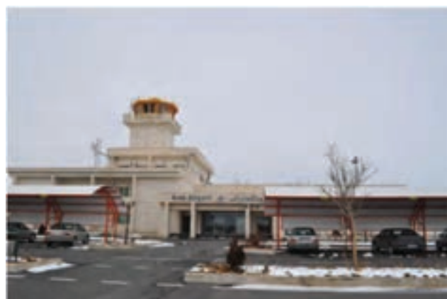
شکل ۱-۶- فرودگاه شهر اراک

۲- پست و مخابرات : گسترش زیرساخت‌های مخابراتی در مراکز شهری و روستایی، زمینه‌توسعه را در استان با دیگر بخش‌ها همگن کرده است. به طوری که در سال ۱۳۵۷ تعداد تلفن‌های ثابت ۱۹۲۵۰ شماره بوده و در سال ۱۳۸۸ به ۴۹۵۲۹۲ شماره افزایش یافته است. همچنین با افزایش تلفن‌های همراه و ایجاد فیبر نوری، زمینه تقویت ارتباطات گسترش یافته است. بیش از ۶۶