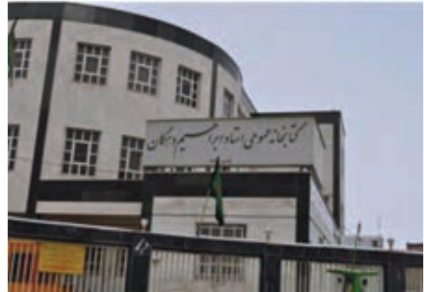
شکل ۴-۶- کتابخانه عمومی در اراک