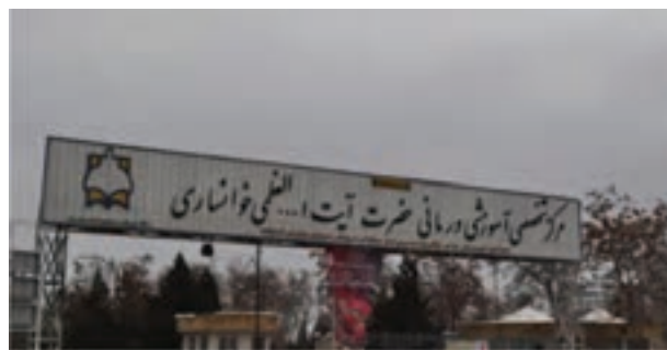
شکل ۹-۶- بیمارستان آیت الله خوانساری اراک