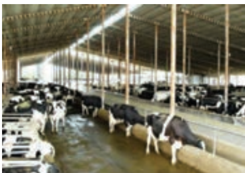
شکل ۱۷-۶- پرورش دام به صورت مکانیزه در مجتمع زرین خوشه