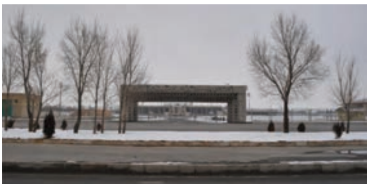
شکل ۱۱-۶- استادیوم ۱۵ هزار نفری امام خمینی(ره) اراک