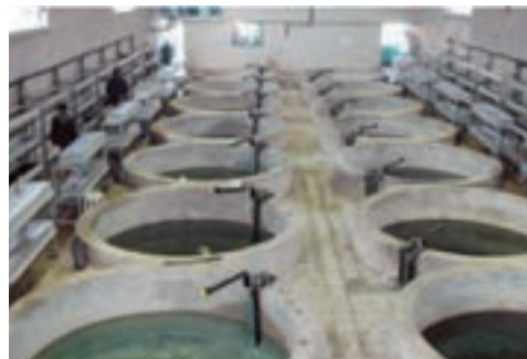
شکل ۱۴-۶- پرورش ماهی به سبک مکانیزه در گارخانه