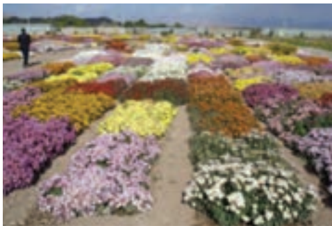
شکل ۱۵-۶- پرورش گل در محلات