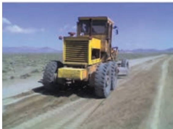
شکل ۲-۶- راه سازی روستایی

۱- راه و ترابری : در سال ۱۳۵۷ طول راه‌های استان (آزاد راه، راه اصلی، فرعی و روستایی) ۱۶۵۱ کیلومتر بوده است که در سال ۱۳۸۸ به ۶۲۹۳ کیلومتر افزایش یافته است. این موضوع بیانگر میزان رشد متوسط سالیانه ۴/۷ درصد بوده است. همچنین با راه‌اندازی فرودگاه اراک، گام مهمی در توسعه حمل و نقل و جا به جایی مسافر و کالا انجام گرفته است.