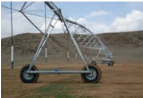
شکل ۱۳-۶- آبیاری به سبک سنتریپد در امان آباد

۱۰- کشاورزی و دامداری : استان ما با برخورداری از آب هوای مناسب و موقعیت ترابری و اراضی حاصل خیز، ظرفیت مناسبی در دامداری و کشاورزی داراست.