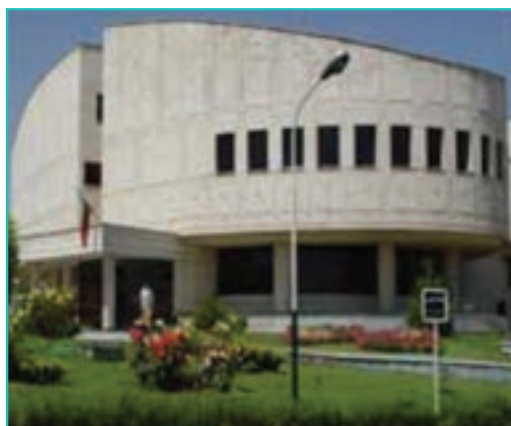
شکل ۸-۶- بیمارستان امام خمینی (ره) - ارومیه