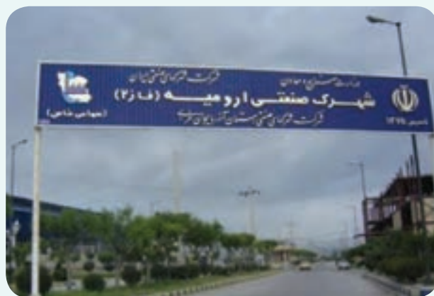
شکل ۲-۶- شهرک صنعتی شماره ۲ ارومیه

۱- شهرک صنعتی شماره ۲ ارومیه : شهرک صنعتی شماره ۲ ارومیه بزرگ‌ترین شهرک صنعتی از نظر میزان اشتغال ایجاد شده در واحدهای بهره‌برداری رسیده استان است که در کیلومتر ۷ جاده ارومیه - ریحان‌آباد قرار دارد. مساحت آن ۱۵۴/۰۳ هکتار و تعداد واحدهای بهره‌برداری رسیده آن ۱۸۵ واحد با ۴۴۹۴ نفر اشتغال است. نزدیکی به مرکز استان، وجود مواد اولیه و راه‌های ارتباطی و زمین هموار و مناسب، از مزایای مهم این شهرک به‌شمار می‌رود.