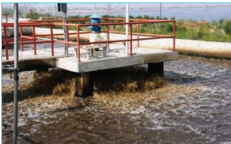
شکل ۵-۶- تصفیه‌خانه فاضلاب ارومیه