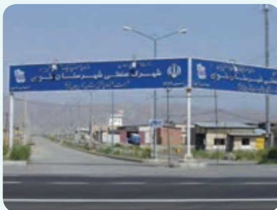
شکل ۴-۶- شهرک صنعتی خوی