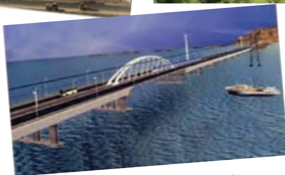
شکل ۱-۶- بخشی از دستاوردهای انقلاب اسلامی