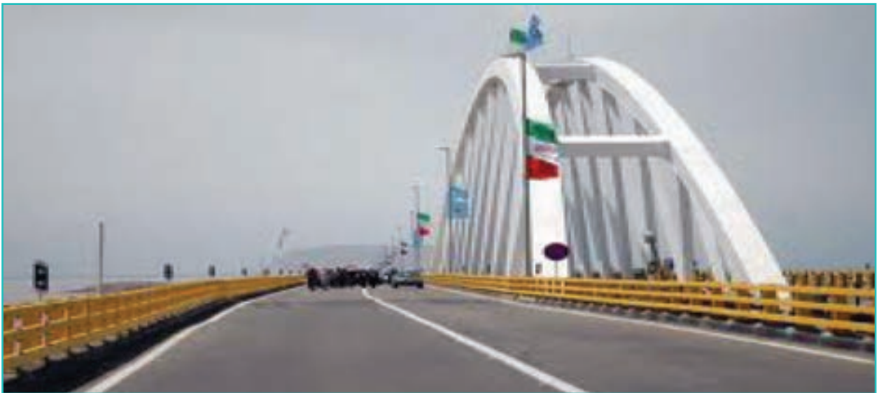
شکل ۶-۶- پل میان گذر دریاچه ارومیه