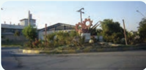
شکل ۳-۶- شهرک صنعتی شماره یک ارومیه