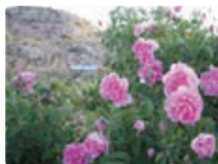
شکل ۱۰-۶- گل محمدی (اول)