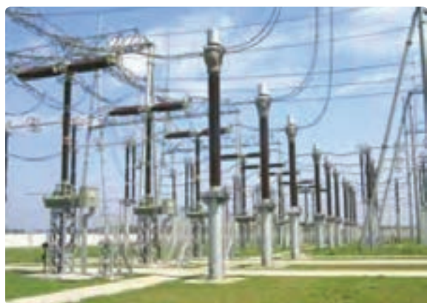
شکل ۳۰- صنایع الکترونیک