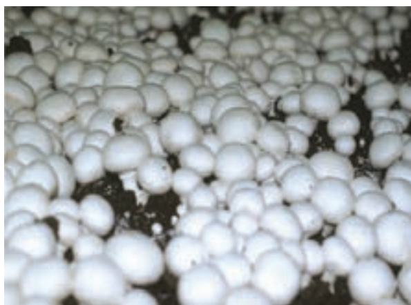
شکل ۲۹- صنایع غذایی بیضا