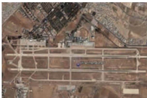
شکل ۲۶-۶- فرودگاه شیراز