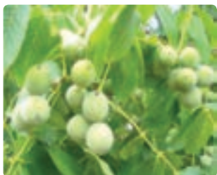
شکل ۱۴-۶- گردو (دوم)