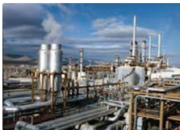
شکل ۳۲- پتروشیمی فارس