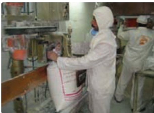
شکل ۳۴- صنایع غذایی بیضا