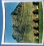
۱- بل شکست