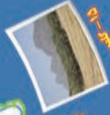
۱۴- کوه کوری