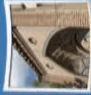
۷- مسجد جامع یزد