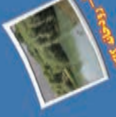
۱۶- کوه کوری