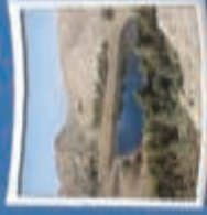
۱۰- کوری نمکی