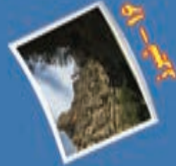
۱۳- کوه کوری