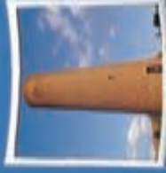
۲- منار آزادی