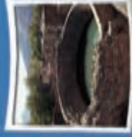
۶- گرداب سنگی