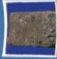
۸- سنگ نوبت