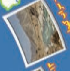
۱۵- کوه کوری