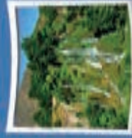
۹- آبشار شک