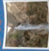
۱۲- آبشار نورزان