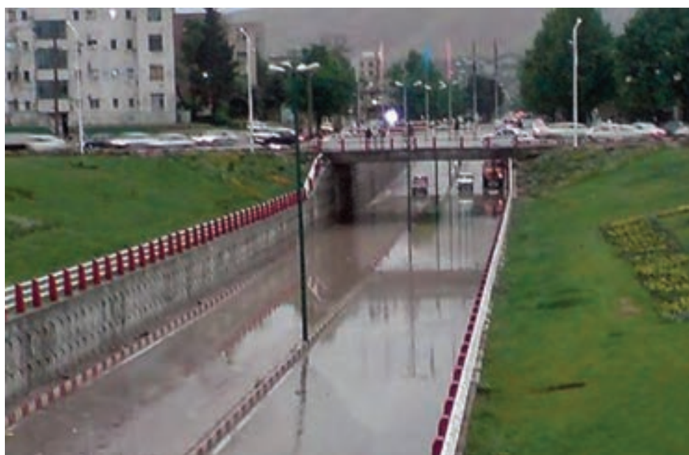
شکل ۱۰-۱۴- یکی از زیرگذرهای شهر خرم آباد

۳- حمل و نقل: استان لرستان به دلیل واقع شدن در مسیر راه های اصلی کشور و همجواری با استان های مرزی و صنعتی به عنوان پل ارتباطی، میان شمال و جنوب کشور از موقعیت خاصی برخوردار است. از مهم ترین طرح های عمرانی در سال ۱۳۸۹ می توان به افتتاح آزاد راه خرم آباد - پل زال و چهارخطه کردن محورهای اصلی استان اشاره کرد. همچنین، آغاز عملیات پروژه های مهم آزاد راه خرم آباد - اراک، احداث خطوط ریلی دورود - بروجرد - غرب کشور و شبکه ریلی دورود - خرم آباد - اندیمشک و