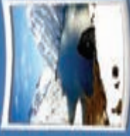
۱۱- دریاجه کوری