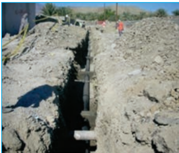
شکل ۱۱-۱۴- اجرای طرح فاضلاب روستایی در بلوچستان