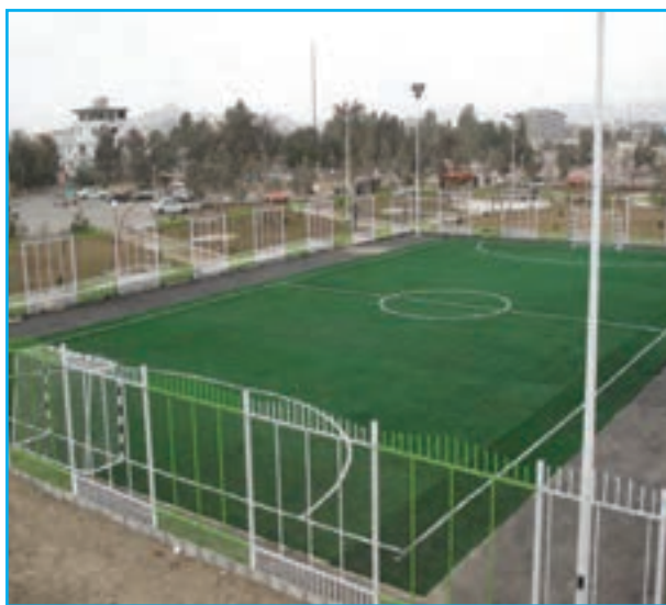
شکل ۱۲-۱۴- بعضی از دستاوردها (عمران شهری)