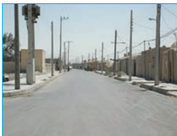
شکل ۸-۱۴- اجرای طرح‌های روستای قائم آباد زابل