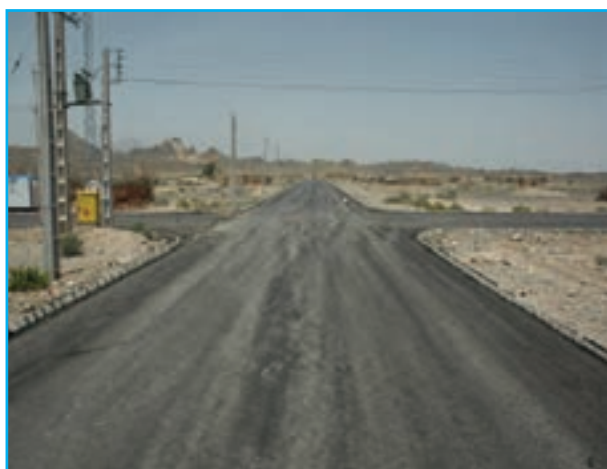
شکل ۹-۱۴- اجرای طرح‌های روستای چگرد خاش

۱- عمران روستایی : روستاهای استان از نظر عمران در سال‌های قبل از انقلاب اسلامی وضعیت مناسبی نداشته‌اند. بعد از انقلاب اسلامی اقدامات مهمی مانند ایجاد شبکه‌های برق‌رسانی، آب‌رسانی، فاضلاب روستایی، آسفالت خیابان‌ها، ایجاد مراکز