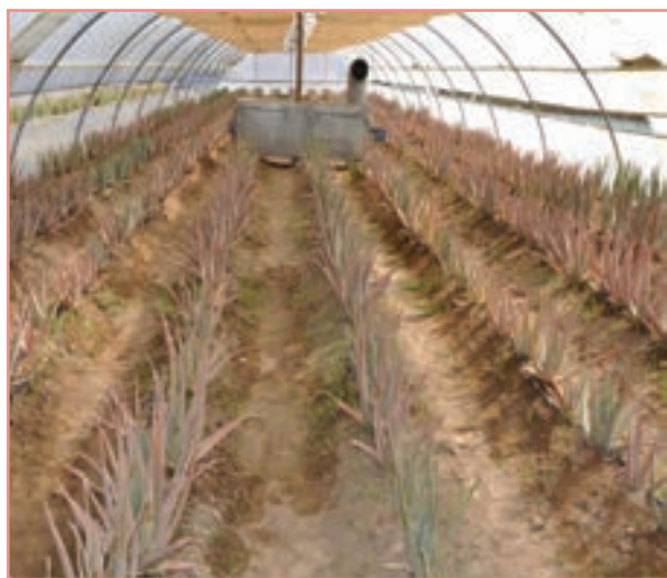
شکل ۷-۱۴- کشت گلخانه‌ای آلوئه‌ورا