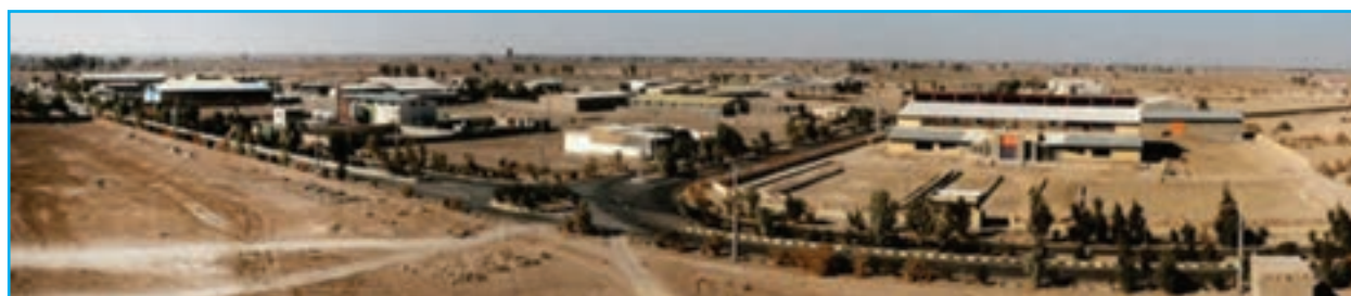
شکل ۵-۱۴- شهرک صنعتی محمدآباد زابل