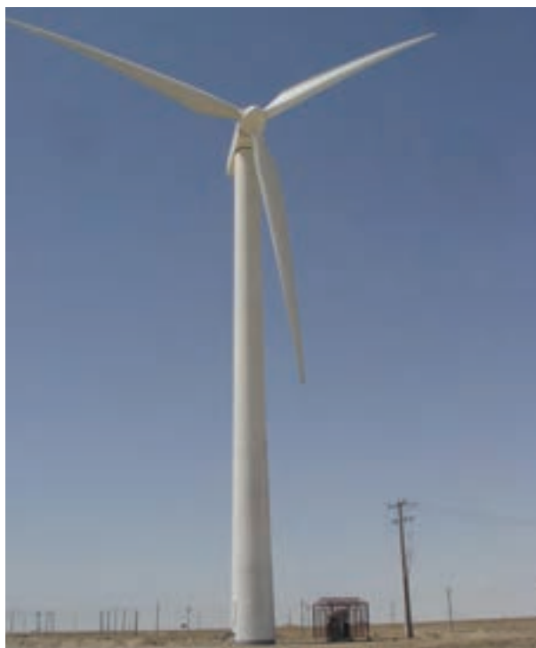
شکل ۸-۱۵- بهره‌گیری از انرژی‌های باد و خورشید