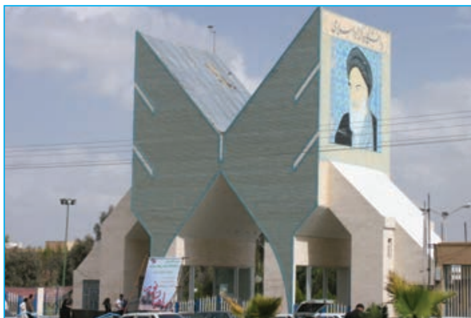
شکل ۵-۱۵- دانشگاه آزاد واحد زاهدان