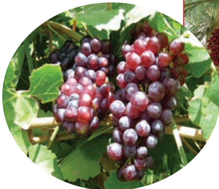
شکل ۷-۱۵- انگور سيستان