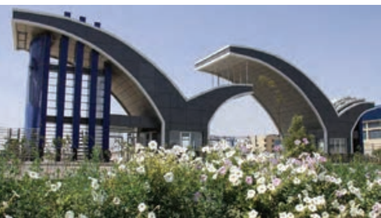
شکل ۱-۱۵- دانشگاه علوم پزشکی زاهدان

امید است در چشم انداز آینده، سیستان و بلوچستان، استانی توسعه یافته با نقش و جایگاه مناسب اقتصادی، اجتماعی، فرهنگی و سیاسی در سطح کشور، پیشرو در فعالیت‌های بازرگانی و فراملی با برخورداری در سلامت و رفاه به دور از فقر و بهره‌مند از امنیت و محیط زیست مطلوب باشد.