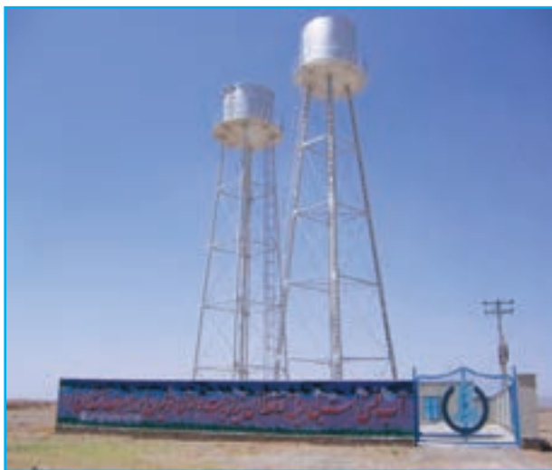
شکل ۱۰-۱۴- اجرای طرح آبرسانی بهداشتی روستایی