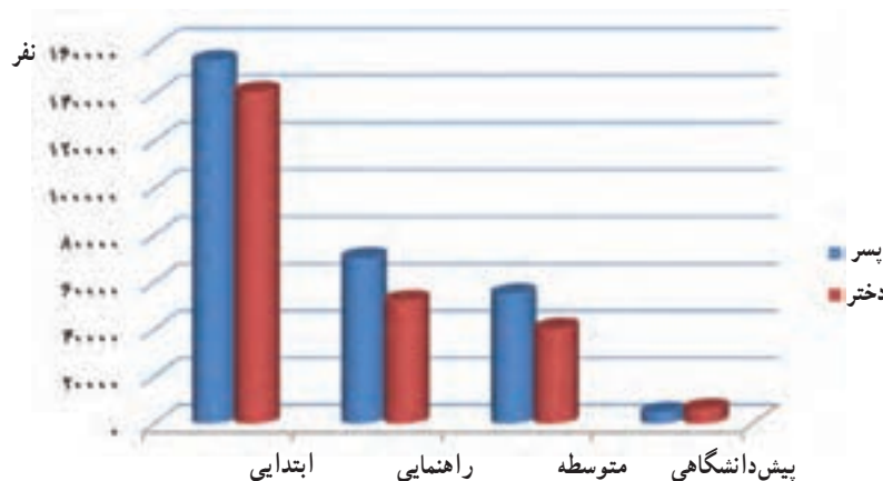
شکل ۱۶-۱۴- تعداد دانش آموزان استان به تفکیک مقاطع تحصیلی در سال تحصیلی ۱۳۸۷-۸۸

افزایش پوشش تحصیلی دوره ابتدایی، راهنمایی و متوسطه در بیشتر روستاهای استان که اغلب پراکنده و دور افتاده بودند و نیز ایجاد مدارس شبانه روزی، و خدمات دهی به دانش آموزان مناطق دور افتاده، در صدر برنامه های آموزش و پرورش استان بوده و می باشد.