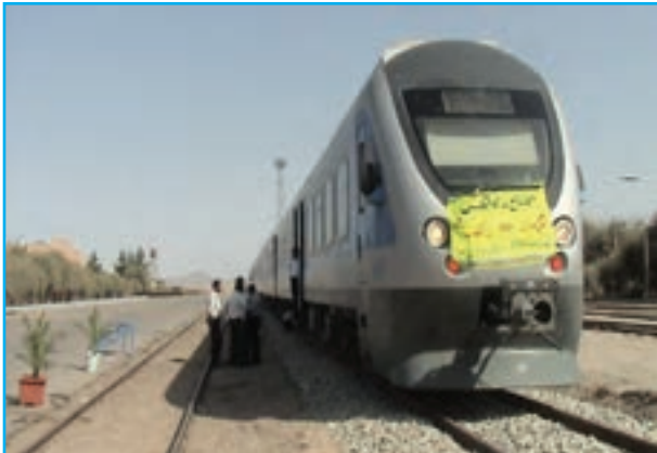
شکل ۱۳-۱۴- توسعه راه آهن و راه‌های استان