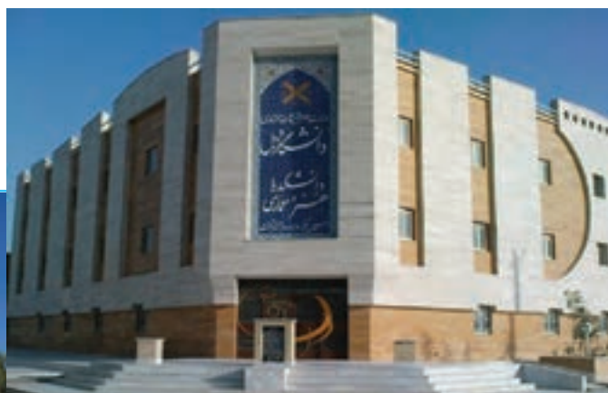
شکل ۲-۱۵- دانشگاه زاهد