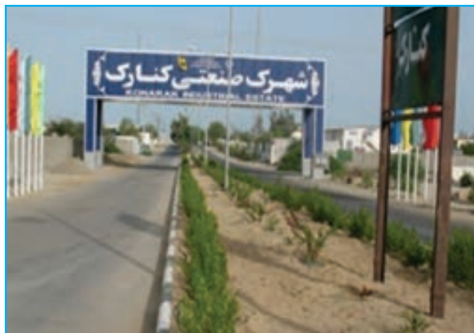
شکل ۳-۱۴- شهرک صنعتی کنارک

شرکت شهرک‌های صنعتی استان در دهم اسفندماه ۱۳۶۸ تأسیس شد و از اواخر نیمه نخست سال ۱۳۶۹ با پرسنل و امکانات محدودی تلاش گسترده‌ای را برای تحقق بخشیدن به یکی از هدف‌های استوار نظام اسلامی که همانا رشد و توسعه اقتصادی در جامعه است، آغاز کرد.