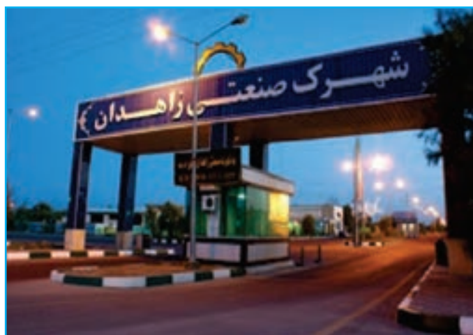
شکل ۴-۱۴- شهرک صنعتی زاهدان

و بلوچستان : تعداد کل پروانه‌های بهره‌برداری صنعتی در استان تا سال ۱۳۹۰، ۱۱۷۲ واحد است که از این میزان تعداد ۷۷۵ واحد به عبارتی ۶۶ درصد واحدهای فعال در شهرک‌ها و نواحی صنعتی و مابقی آن خارج از این محدوده قرار دارند.