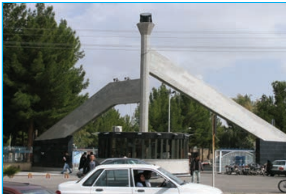
شکل ۴-۱۵- دانشگاه شهید نیکبخت