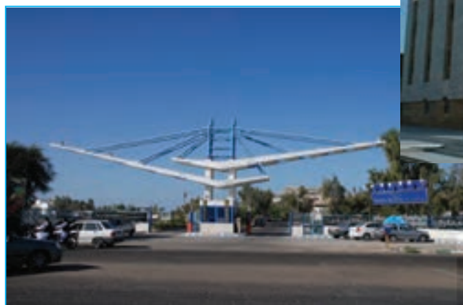
شکل ۳-۱۵- دانشگاه دریانوردی چابهار