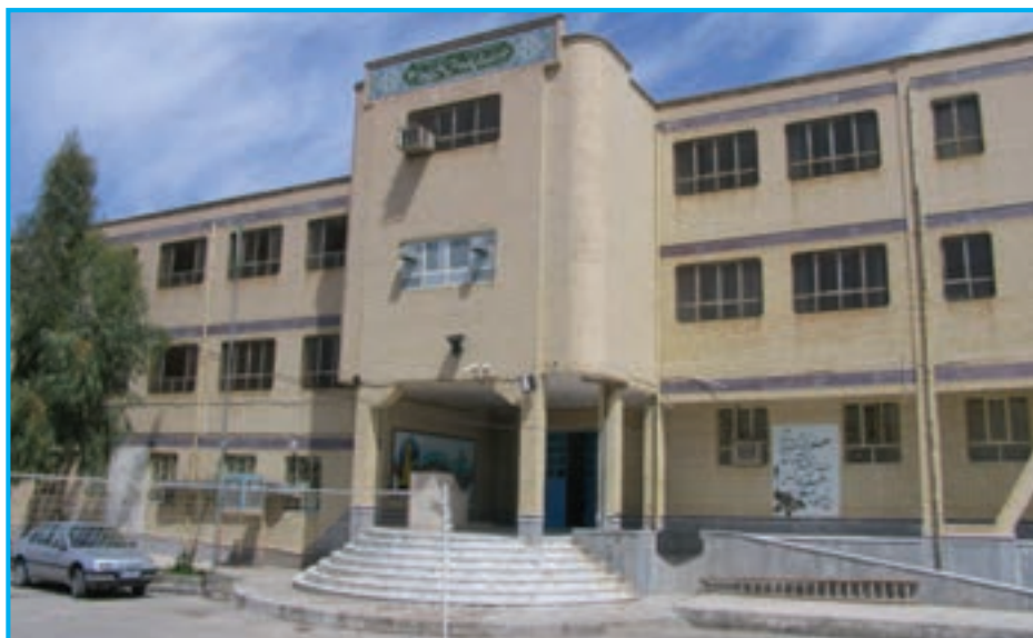
شکل ۱۴-۱۴- فضای آموزشی (هنرستان)

به تصاویر زیر نگاه کنید و بگویید انقلاب اسلامی در زمینه علمی – آموزشی چه دستاوردهایی برای استان سیستان و بلوچستان داشته است؟ همان‌طور که می‌دانید انقلاب اسلامی در زمینه‌های مختلف، جهت پیشرفت استان فعالیت‌های زیادی انجام داده که این اقدامات در زمینه علمی – آموزشی نیز چشمگیر است.