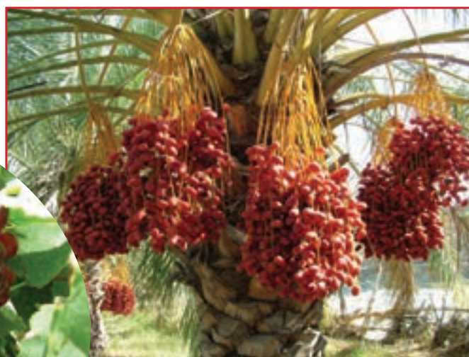
شکل ۶-۱۵- خرماي بلوچستان