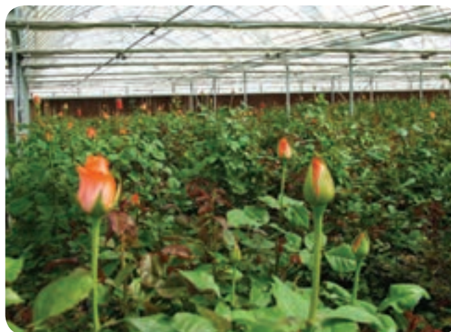
شکل ۹-۱۵- گلخانه