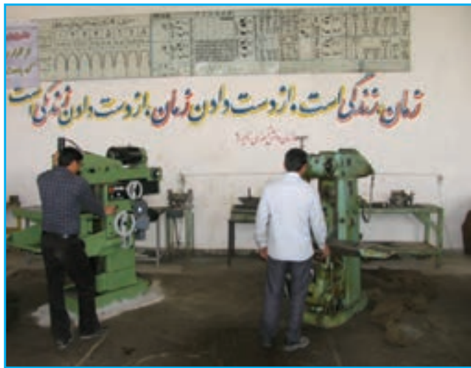
شکل ۱۵-۱۴- کارگاه‌های رایانه و ساخت و تولید (در هنرستان‌ها)