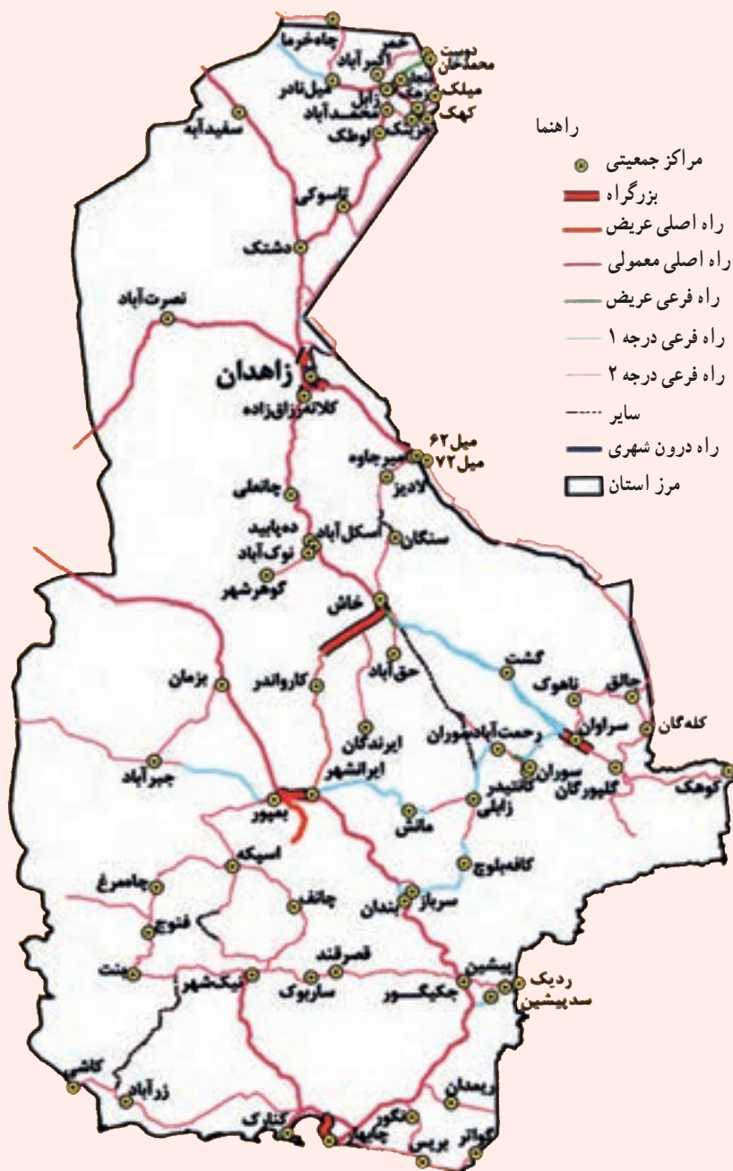
شکل ۱۰-۱۵ نقشه راه های استان