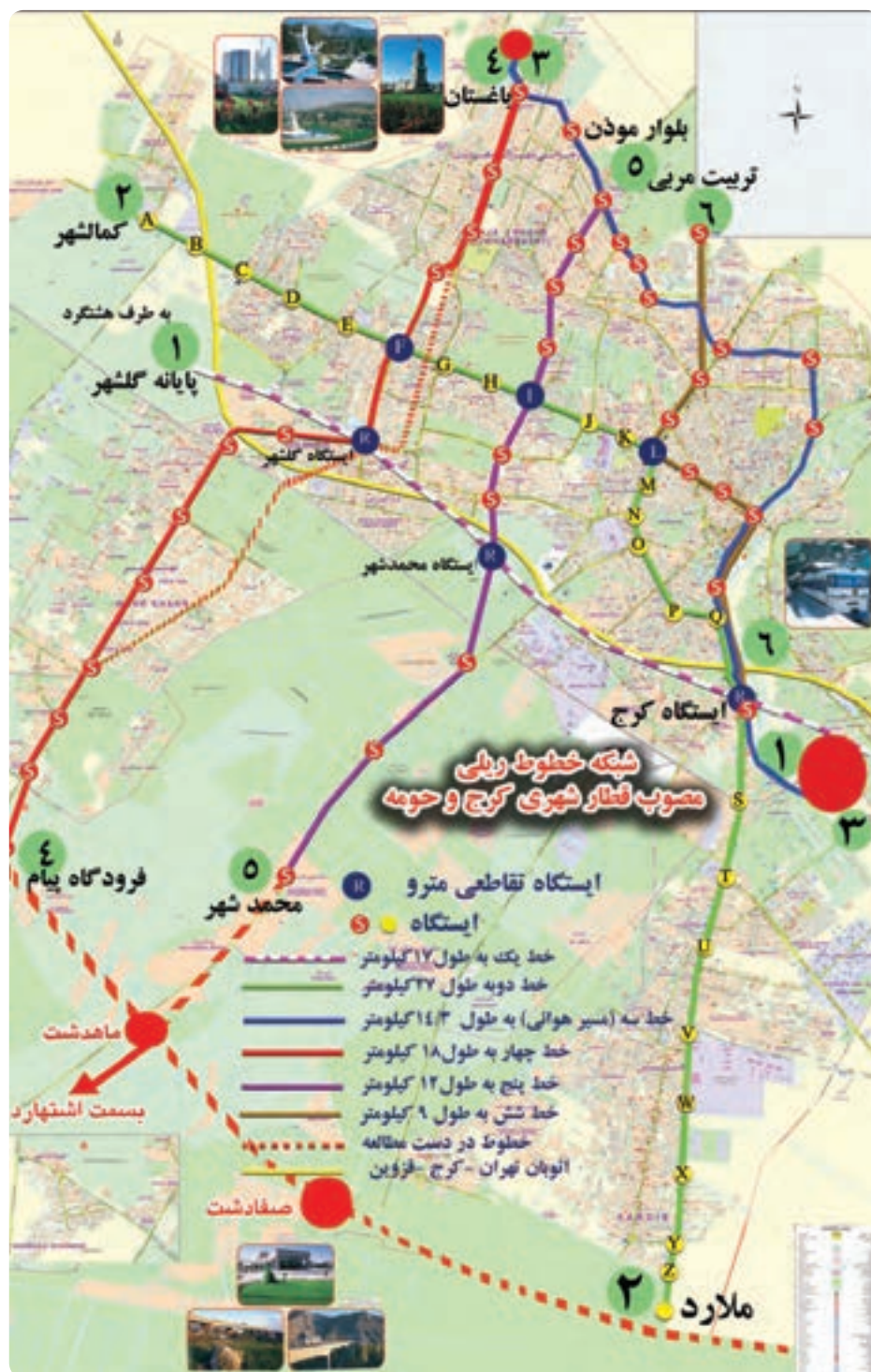
شکل ۹-۱۴ نقشه خطوط مترو کرج و حومه