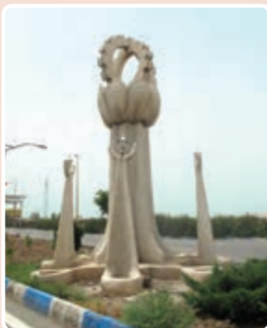
شکل ۳-۱۴- ورودی شهرک صنعتی اشتهارد

شهرک صنعتی اشتهارد : این شهرک به علت دسترسی به راه‌های ارتباطی و زمین‌های بایر و وسیع در مسیر جاده اشتهارد- بومین زهرا مکان‌یابی شد و در حال حاضر با داشتن ۵۲۵ واحد صنعتی فعال (فلزی - غذایی - شیمیایی و...) از اصلی‌ترین مناطق صنعتی کشور محسوب می‌شود.