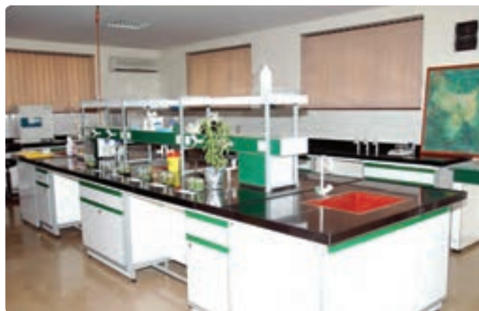
شکل ۱۲-۶- روش‌های جدید بیوتکنولوژی

افزایش بازدهی آبیاری و ازدیاد نرخ بهره‌وری از منابع آب : با استفاده بهینه از منابع آب و با بالابردن بازدهی آبیاری می‌توان کشاورزی استان را توسعه داد. در این زمینه، لازم است بین ارگان‌های مختلف برای استفاده صحیح و معقول از آب هماهنگی‌هایی صورت گیرد. ایجاد تأسیسات کوچک مهار آب‌های سطحی و بهره‌برداری بیشتر از آب‌های زیرزمینی به همراه استفاده از روش‌های جدید آبیاری، می‌تواند در افزایش تولید باغ‌های چای، زیتون، توت و کشتزارهای برنج مؤثر باشد.