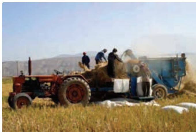
شکل ۱۱-۶- کشاورزی مکانیزه

— توسعه صنایع تبدیلی محصولات کشاورزی : تولید محصولات مختلف کشاورزی مثل زیتون، گیاهان دارویی، چوب، آبریان و ... در استان می‌تواند با توسعه صنایع تبدیلی به افزایش اشتغال، تأمین ارز، تأمین درآمد و سهم آن در افزایش تولید خالص ملی و برآورده کردن نیازهای مصرفی جمعیت کمک کند. — افزایش تولیدات گلخانه‌ای : کشت گلخانه‌ای در استان، زمینه را برای تولید بیش‌تر انواع مختلف محصولات کشاورزی فراهم می‌سازد و علاوه بر سوددهی بالا موجب می‌شود تا از این تولیدات در همه فصول سال استفاده کنیم.