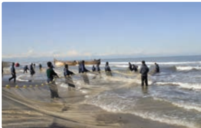
شکل ۳-۶- صید ماهی در دریای خزر