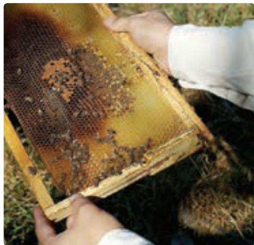
شکل ۱۰-۶- پرورش زنبور عسل

— یکپارچه‌سازی اراضی و مکانیزه کردن کشاورزی: سرانه زمین کشاورزی گیلان ۱/۱۳ هکتار است. وسعت کم زمین‌های کشاورزی و کوچک کردن هریک از قطعه‌ها باعث می‌شود تا سرمایه‌گذاری‌ها و مکانیزه کردن کشاورزی مقرون به صرفه نباشد و بازدهی تولید پایین بیاید.