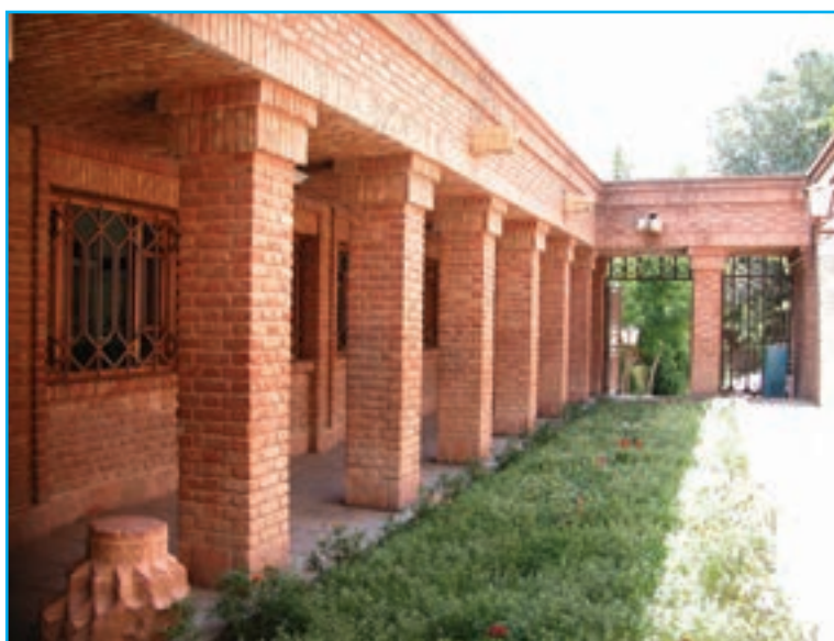
شکل ۱۸-۵- موزه مراغه