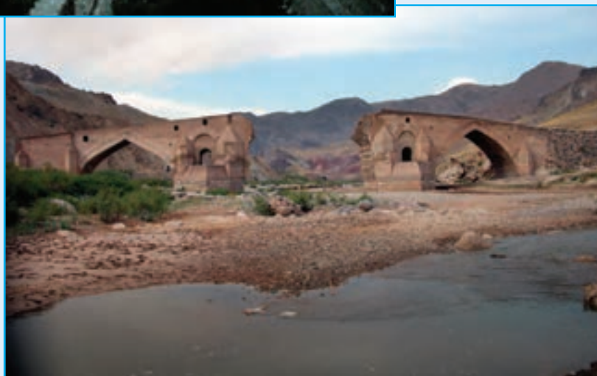
شکل ۵-۸- قیزکورپوسی میانه