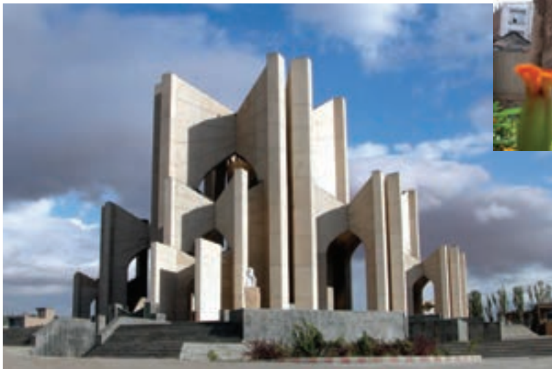
شکل ۱۶-۵- مقبره الشعرا در تبریز