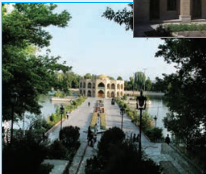
شکل ۵-۷- عمارت ایل‌گولی تبریز