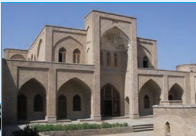
شکل ۵-۶- کاروانسرای پیام مرند