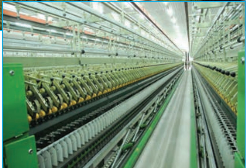
شکل ۲۸-۵- صنایع نساجی منطقه آزاد ارس