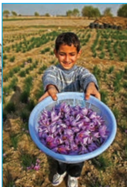
شکل ۲۵-۵- کشت زعفران و محصولات باغی در مرند