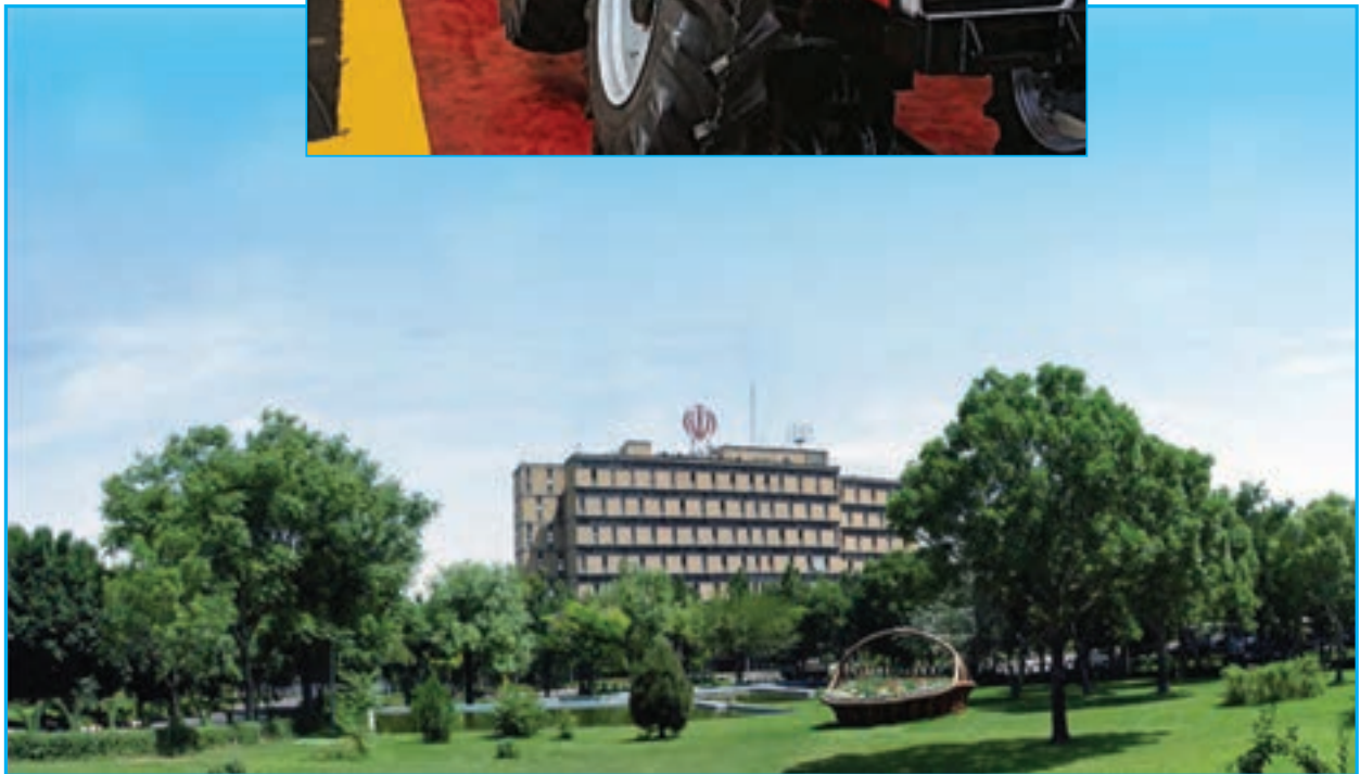
شکل ۲۹-۵- کارخانه تراکتورسازی تبریز