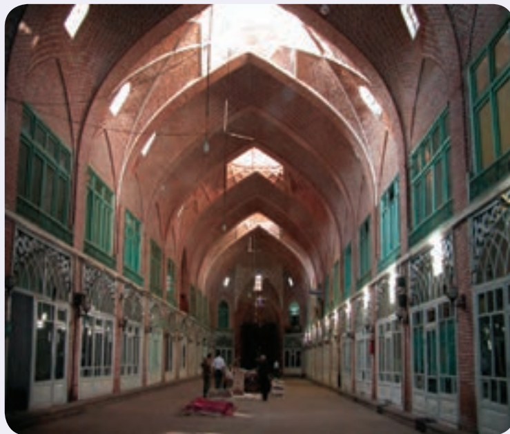
شکل ۲۱-۵- نمای یکی از تیمچه‌های بازار تبریز

اهمیت بازار در زندگی مردم قدیم تاحدی بوده که چهار دروازه از دروازه‌های شهر تبریز در محدوده بازار قرار داشته است و در نویر، در خیابان، در سرخاب و در باغمیشه که از دروازه‌های مهم شهر بوده‌اند، به دلیل اتصال این مجموعه با شاهراه ارتباطی ابریشم در بازار قرار داشته‌اند.