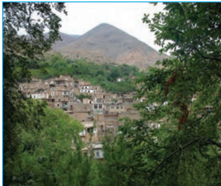
شکل ۲۰-۵- چشم‌اندازی از روستای اشتبین