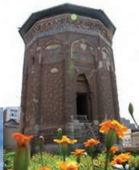
شکل ۱۵-۵- گنبد کیود در مراغه