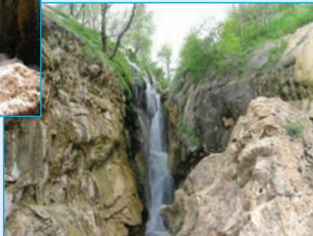
آبشار گل آختر - ورزقان

۲ - آبشارها : عیش آباد، سرکند دیزج، گل آختر، آسیاب خرابه از آبشارهای معروف استان اند که زیبایی خاصی را به طبیعت استان داده اند.