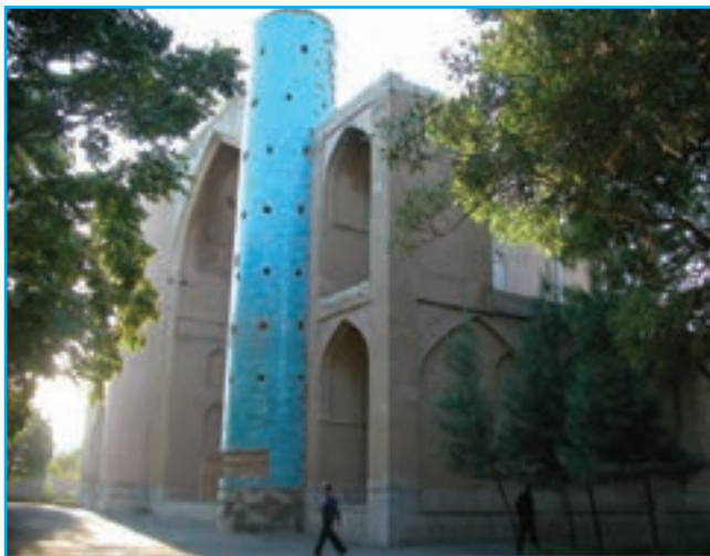
شکل ۱۴-۵- مقبره شهاب‌الدین اهری