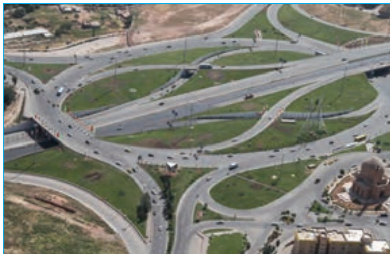
شکل ۳۲-۵- میدان شهید فهمیده تبریز

استان آذربایجان شرقی به دلیل موقعیت خاص استراتژیک، قابلیت‌های فراوانی در جهت گسترش بازرگانی خارجی دارد. وجود مبادی ورودی و خروجی در منطقه مرزی جلفا و نودوز، وجود گمرکات مهم سهلان تبریز و مراغه و نیز منطقه آزاد تجاری-صنعتی ارس و نمایشگاه بین‌المللی تبریز از جمله این قابلیت‌ها است. همچنین وجود راه آهن جلفا و جمهوری ارمنستان و نخجوان و فرودگاه بین‌المللی شهید مدنی تبریز از قابلیت‌هایی است که امکان حمل و نقل بین‌المللی را در زمینه صدور کالا فراهم می‌آورد. شبکه‌های دسترسی به خصوص شبکه جاده‌ای استان، در فرایند توسعه کشور از اهمیت فوق‌العاده‌ای برخوردارند و در توسعه روابط اجتماعی، تجاری و فرهنگی مناطق مختلف، نقش مهمی را ایفا می‌کنند. در استان ماز طول راه‌های اصلی ۱۰۲۹ کیلومتر و راه‌های فرعی ۱۷۴۴ کیلومتر است و حمل و نقل هوایی نقش ارزشمندی در جابه‌جایی کالا و مسافر ایفا می‌کند. در فرودگاه بین‌المللی شهید مدنی تبریز روزانه به‌طور متوسط ۵۱ پرواز انجام می‌شود. فرودگاه‌های شهید مدنی تبریز و سهند نقش مهمی در جابه‌جایی مسافر در استان آذربایجان شرقی دارد. راه آهن منطقه آذربایجان با ۴۶۸ کیلومتر طول در سال‌های اخیر، نقش مهمی در جابه‌جایی جمعیت و کالا ایفا می‌کند و سالانه بیش از ۱۱۸۰ هزار تن کالا و بیش از یک و نیم میلیون مسافر را جابه‌جا می‌کند.