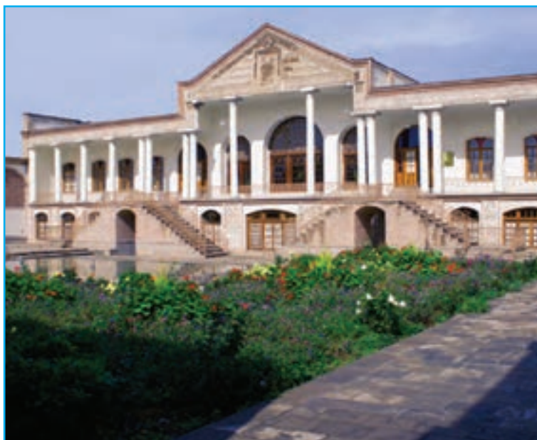
شکل ۱۷-۵- موزه قاجار تبریز

۳- موزه‌ها: موزه‌های مشروطه، سنجش، قاجار، قرآن و کتاب، سایت موزه عصر آهن تبریز، موزه تاریخ طبیعی، موزه ادبی شهریار، شهرداری، شهداء، استانداری، محرم و فرش در تبریز، موزه ادب عرفان در اهر، موزه عشایر آذربایجان در سراب، موزه مردم‌شناسی جنوب سهند در بناب، موزه ایلخانی و موزه سنگ نگاره‌ها در مراغه و موزه هدایا در شهر خامنه از جمله موزه‌های معروف استان ما می‌باشند.