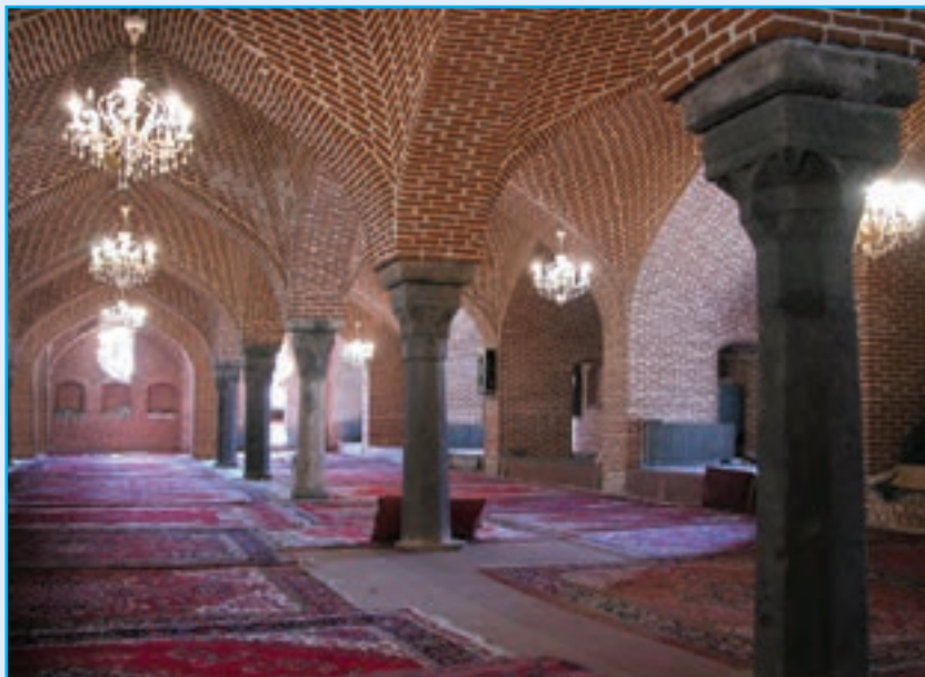
شکل ۱۲-۵- مسجد جامع تسوج

استان ما گنجینه‌ای از یادمان‌های مذهبی و زیارتی است که در دوران اسلامی شکل گرفته‌اند. وجود گنبد‌های نیلگون و فیروزه‌ای، مناره‌ها و برج‌ها، مقابر عرفا و منسوبان ائمه اطهار (ع) معنویت خاصی در کالبد جاذبه‌های گردشگری استان دمیده است؛ از آن جمله می‌توان به گوی مسجد یا مسجد کبود (فیروزه جهان اسلام)، مسجد ارک علیشاه (بزرگ‌ترین بنای اسلامی در قرن هشتم هجری)، مقبره الشعرا (مدفن بیش از ۳۰۰ عارف و شاعر و دانشمند)، مقبره دو کمال (کمال الدین بهزاد و کمال الدین خجندی)، مقبره شیخ شهاب‌الدین اهری در اهر و امامزاده‌های (سید محمد آقا در جلفا و سید حمزه در تبریز و...)، کلیساهای استان نظیر کلیسای سنت استپانوس در جلفا اشاره کرد.