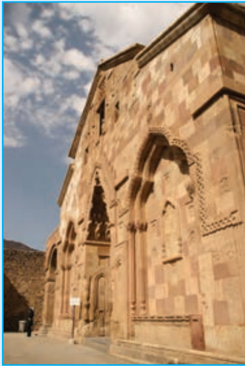
شکل ۱۱-۵- کلیسای سن استپانوس جلفا