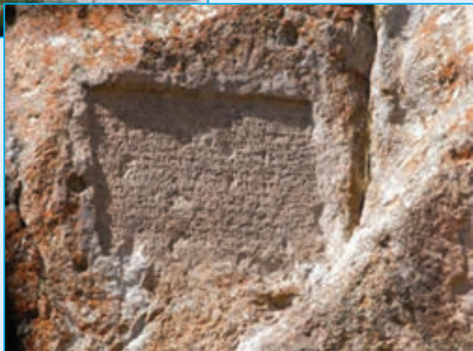
شکل ۱۰-۵- سنگ‌نشته رازلیق سراب