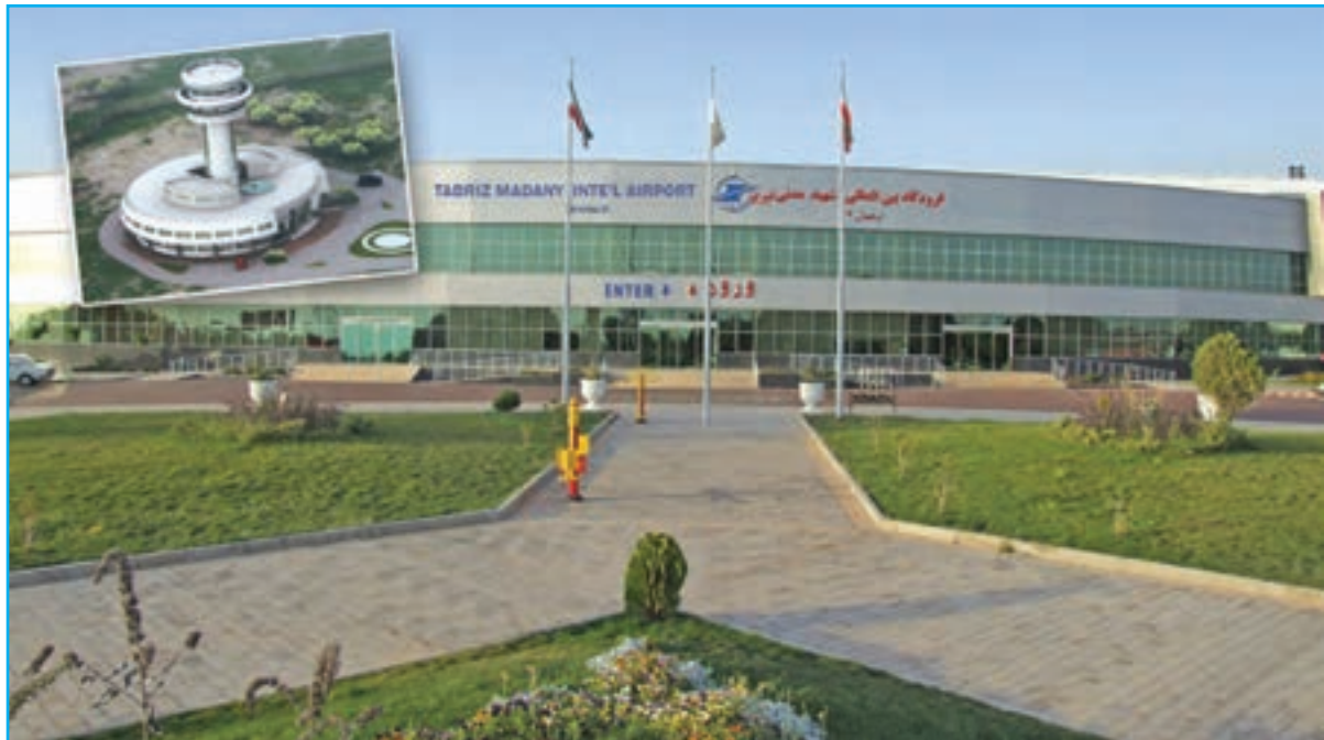
شکل ۳۳-۵- نمای از فرودگاه بین‌المللی شهید مدنی تبریز