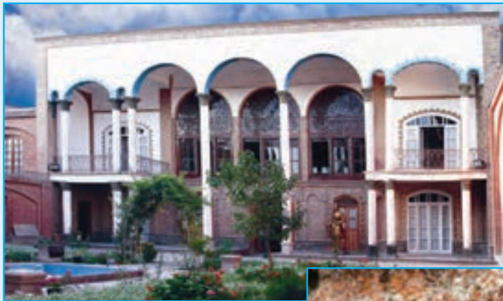
شکل ۹-۵- خانه مشروطه تبریز

— کاروان‌سراهای تاریخی: از کاروان‌سراهای به‌جا مانده استان ما گویجه بل اهر، الخلیج در تیکمه داش، جمال آباد میانه، خواجه نظر جلفا و پیام مرند را می‌توان نام برد.