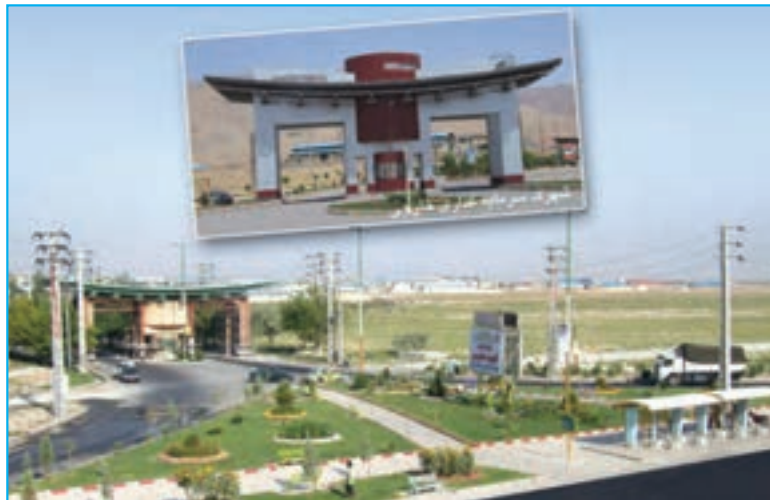
شکل ۳۰-۵- شهرک صنعتی شهید سلیمی