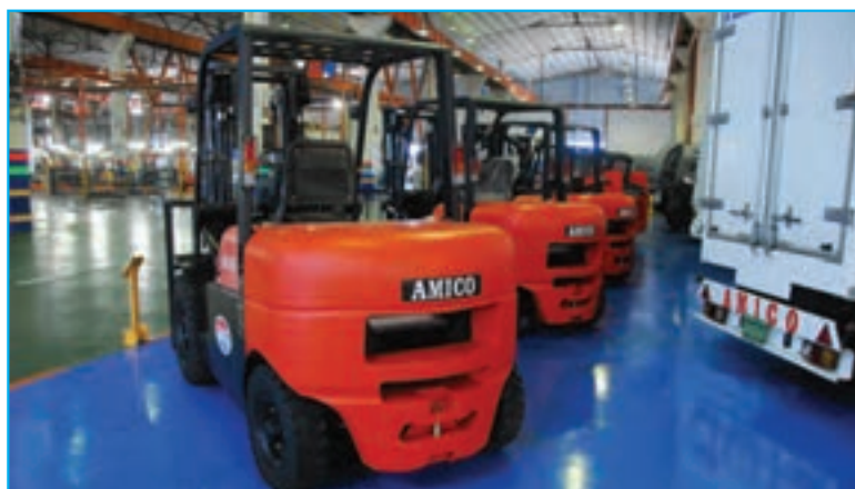
شکل ۳۱-۵- کارخانه لیفتراک سازی آمیکو جلفا