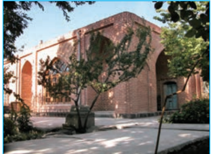
شکل ۱۳-۵- مقبره شیخ محمود شبستری