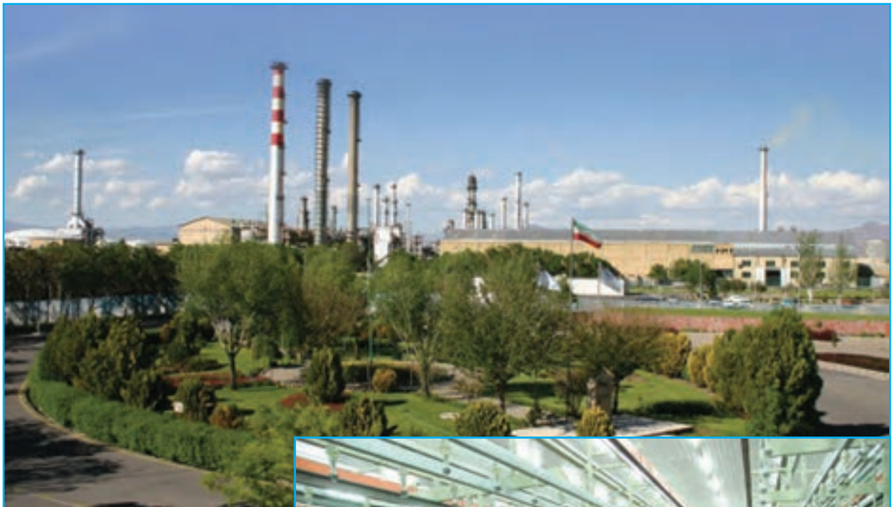
شکل ۲۷-۵- پتروشیمی تبریز

استقرار کارخانه‌های بزرگ صنعتی نظیر: ماشین‌سازی، تراکتور سازی، ایدم، بنیان دیزل، بلبرینگ‌سازی، پیستون‌سازی، لیفتراک‌سازی، پتروشیمی، پالایشگاه، فولادگستر سهند، فولاد میانه، فولاد شاهین بناب، مجتمع عظیم مس سونگون و ده‌ها کارخانه تولیدی بزرگ دیگر در استان ما، باعث شده است این استان موقعیت صنعتی مناسبی به‌ویژه در غرب و شمال غرب کشور بیابد.