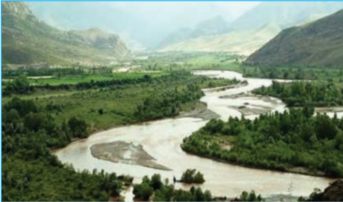
شکل ۲-۵- رود مرزی ارس