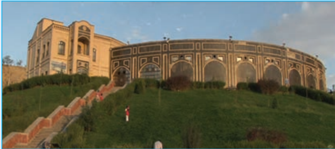
شکل ۴-۵- نمایی از آبگرم بستان آباد

۳- آب‌های معدنی و گرم: استان ما به دلیل شرایط زمین‌ساختی، از کانون‌های مهم آب معدنی و آب گرم محسوب می‌شود که در چهار منطقه عمده در اطراف کوه سهند، اطراف بزقوش، شمال شرقی کلیبر و اطراف میشوداغ تمرکز یافته‌اند.