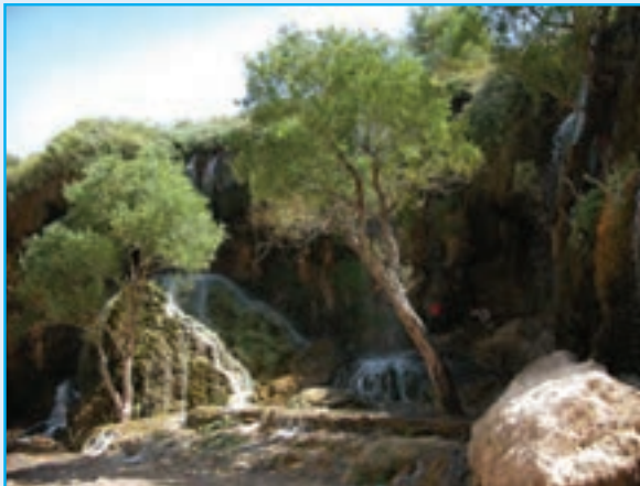
آبشار آسیاب خرابه - چلغا

۲ - آبشارها : عیش آباد، سرکند دیزج، گل آختر، آسیاب خرابه از آبشارهای معروف استان اند که زیبایی خاصی را به طبیعت استان داده اند.