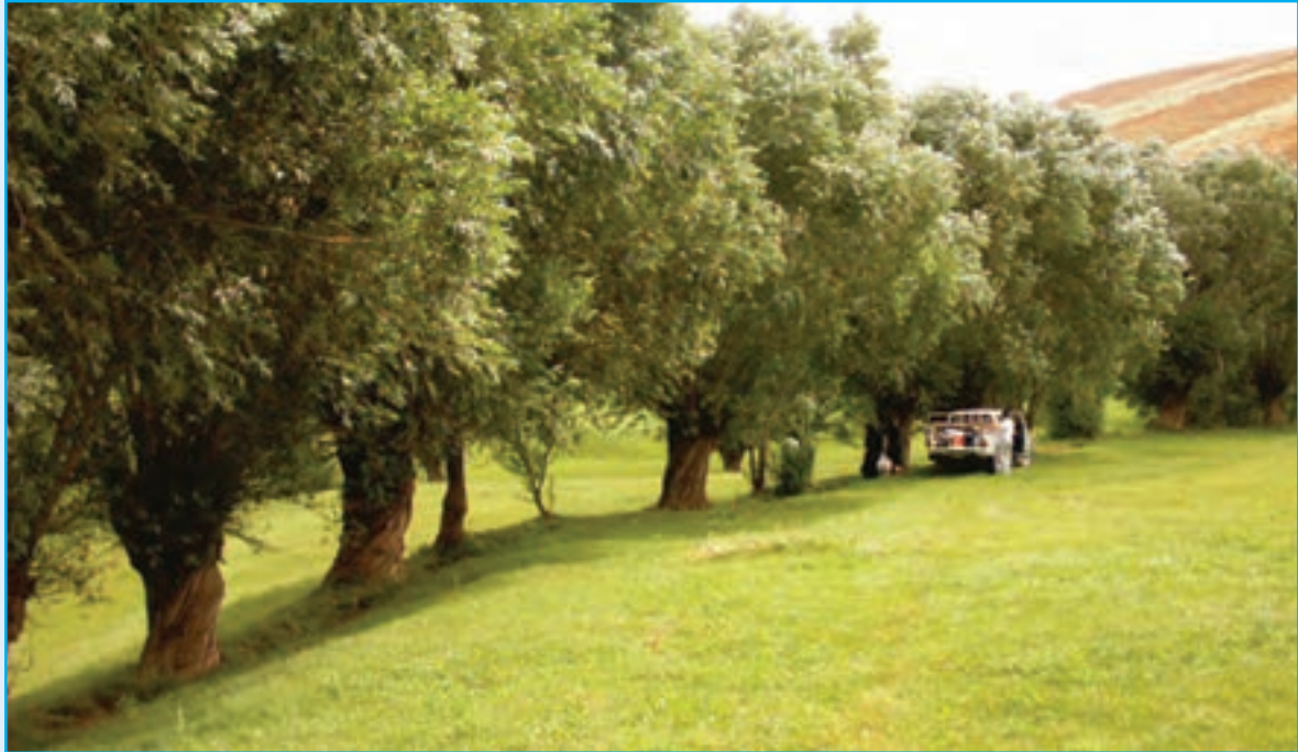
شکل ۵-۵- چشم انداز طبیعی از مناظر بیلاقی (چارویماق)

۸- غارها : غارهای هامپوئیل (کبوتر) در مراغه، آق بلاغ در هشترود، دوگیجان در مرند و اسکندر در سعیدآباد بستان آباد از جمله جاذبه‌های طبیعی اند که هر کدام چشم انداز خاصی در استان ما به وجود آورده‌اند.