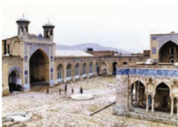
شکل ۲۰-۵- مسجد جامع عتیق - شیراز