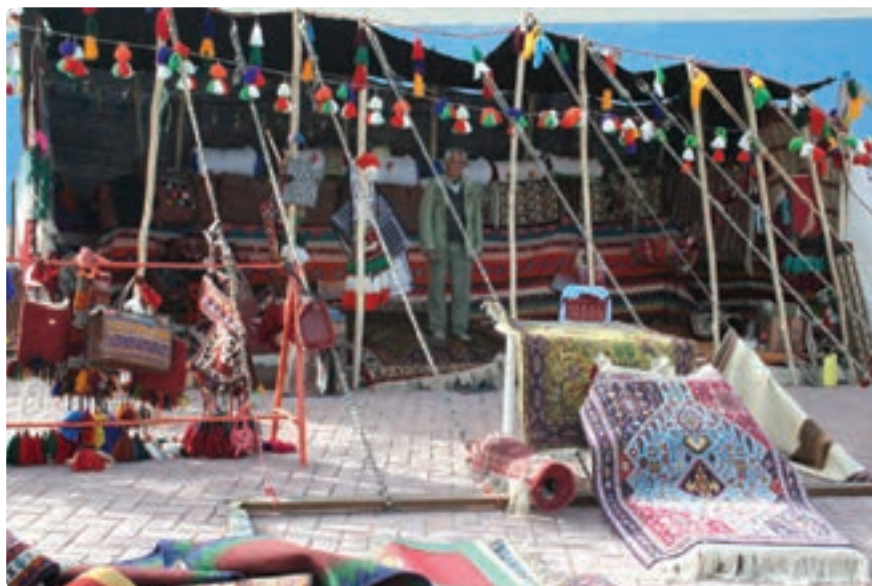
شکل ۱۷-۵- دست بافته های کوچ نشینان فارس