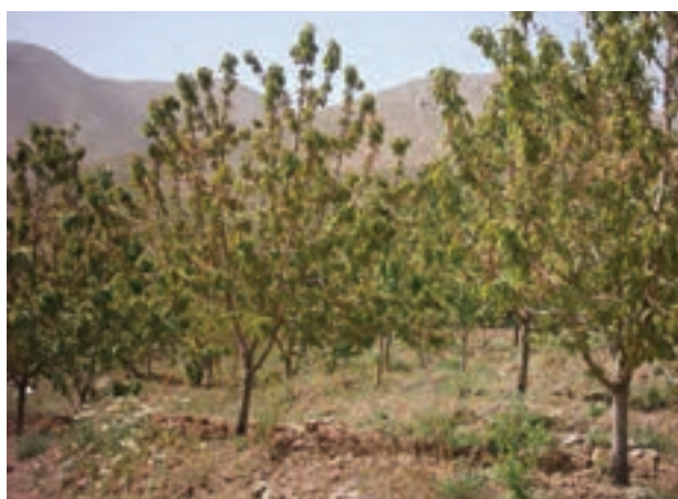
شکل ۲۸-۵- باغ‌های میوه (گیلاس) در جنوب استان