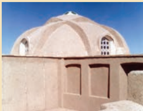
شکل ۱۳-۵- خانه ملاصدرا در کبهک (دوره صفویه)

ث) خانه‌های تاریخی: شامل خانه حضرت امام خمینی (ره)، آیت الله بروجردی، ملا صدرا، حاج علی خان زند، حاج قلی خان و ... است.