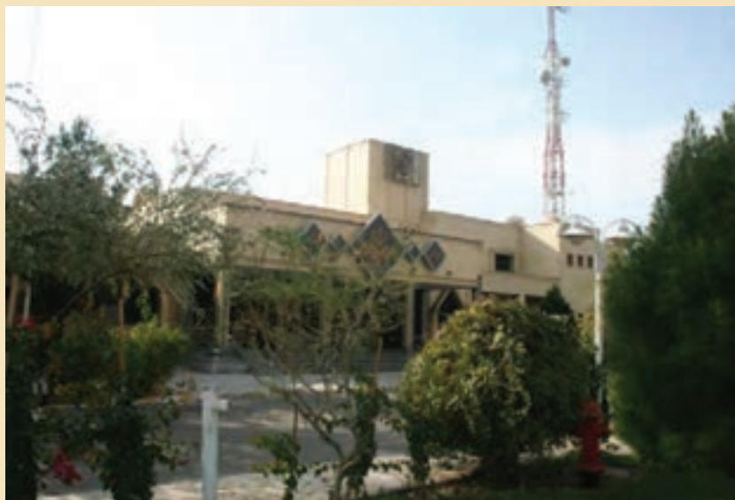
شکل ۳۷-۵- صدا و سیمای مرکز قم

ث) صدا و سیما: شهر مقدس قم به سبب آنکه مرکز معنوی جهان تشیع و خاستگاه انقلاب اسلامی ایران محسوب می‌شود و نیز به برکت بارگاه ملکوتی کریمه اهل بیت (س) و مسجد مقدس جمکران از جایگاه ممتاز معنوی و فرهنگی برخوردار است. از این رو صدا و سیمای مرکز قم باید در شأن این شهر مقدس باشد. نقش صدا و سیمای مرکز قم به مراتب فراتر از یک شبکه استانی است. در مرکز قم علاوه بر برنامه‌سازی برای بیش از یک میلیون و چهل هزار نفر جمعیت استان قم از چشمه جوشان اهل بیت (ع) در این شهر به نفع شبکه‌های ملی و فراملی استفاده کرده و برنامه‌های مورد نیاز صدا و سیما را در حوزه معارف دینی تولید می‌کند. این ویژگی صدا و سیمای مرکز قم، ویژگی منحصر به فردی است و هیچ‌یک از مراکز صدا و سیما این شرایط خاص را ندارد. رادیو سراسری معارف از این استان پخش می‌شود.