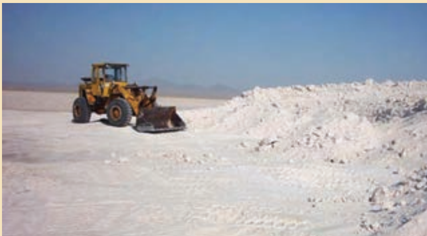
شکل ۳-۵- استخراج نمک از دریاچه حوض سلطان

معادن دریاچه نمک قم و حوض سلطان: دریاچه نمک قم به عنوان منبع عظیم و سرشار انواع املاح معدنی طی سالیان اخیر مورد توجه و مطالعه قرار گرفته است. نتایج طرح مطالعه، بیانگر وجود ۲۰ میلیون تن منیزیم در دریاچه است که کاربردی مؤثر در صنایع نسوز دارد. علاوه بر منیزیم از شورابه‌ها حدود ۱۲ کانی می‌توان به دست آورد، که کاربردهای متنوعی در صنایع گوناگون نظیر کودهای شیمیایی، کاغذ، عایق کاری لوله، ضد یخ و ... دارند. در دریاچه حوض سلطان نیز انواع نمک‌های خوراکی و صنعتی وجود دارد که هم‌اکنون استخراج می‌شود.