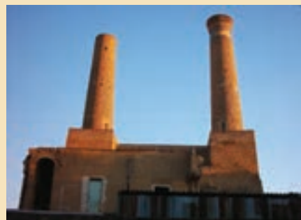
شکل ۱۶-۵- مناره های میدان کهنه