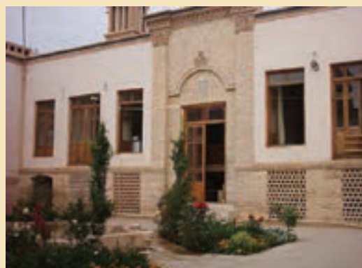
شکل ۱۲-۵- منزل حضرت امام خمینی (ره)

ج) قلعه‌ها: مانند قلعه قمروند، قلعه مظفرآباد و قلعه ملک آباد ج) کاروان‌سراها: مانند کاروان‌سرای حوض سلطان، دیر گچین، پل دلاک و پاسنگان ح) پل‌ها: مانند پل دلاک، حوض سلطان و طینوج خ) آب‌انبارها: مانند آب‌انبار چهل اختران، صدرآباد، لب‌چال، راهجرد و کوه سفید د) میل‌ها: مانند میل صفر علی و میل بابک ذ) آتشکده‌ها و تپه‌های تاریخی: مانند آتشکده نویس در منطقه خلجستان و تپه تاریخی صرم، قلی‌درویش و قره تپه قمروند که در درس دهم با آنها آشنا شدید. ر) آثار دیگر: مانند مناره‌های میدان کهنه که قبلاً سر در مدرسه علمیة غیاثیه بوده است و تک منار میدان کهنه که در خیابان آیت الله طالقانی (آذر) قرار دارد.