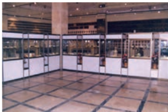
الف- موزه آستانه مقدسه حضرت معصومه (س)