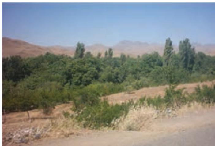
شکل ۲۷-۵- منطقه بیلاقی خلیجستان