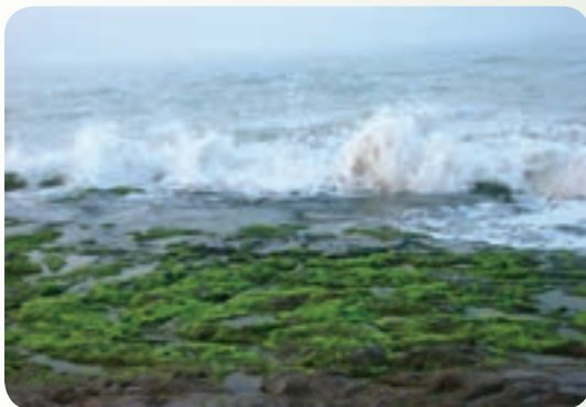
شکل ۲۹-۱۲ ساحل چابهار

منطقه جنگلی بیرگ زاбили : قسمت اعظم این منطقه در شهرستان زاбили واقع شده است. پوشش گیاهی منطقه شامل زیتون وحشی، بادام کوهی و بنه است و حیواناتی همچون سمور سنگی، خرس سیاه، قوچ، میش، کل و بز در این منطقه زندگی می‌کنند.