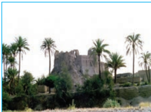
شکل ۹-۱۲- قلعه ایرندگان