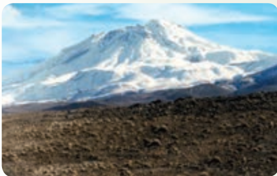
شکل ۲۵-۱۲: کوه تفتان

۲- درخت کهنسال روستای دهپایید : این درخت در نزدیکی شهرستان خاش و در روستای دهپایید قرار دارد. این سرو کهنسال ۱۲۰۰ سال قدمت دارد و دارای تنه ای پهن و شاخ و برگی انبوه است.