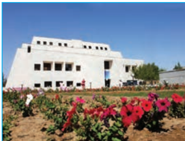
شکل ۶-۱۲- موزه بزرگ زاهدان

۳- تلگراف خانه حرمک : این اثر در روستای حرمک از توابع بخش مرکزی در شمال زاهدان واقع شده است.