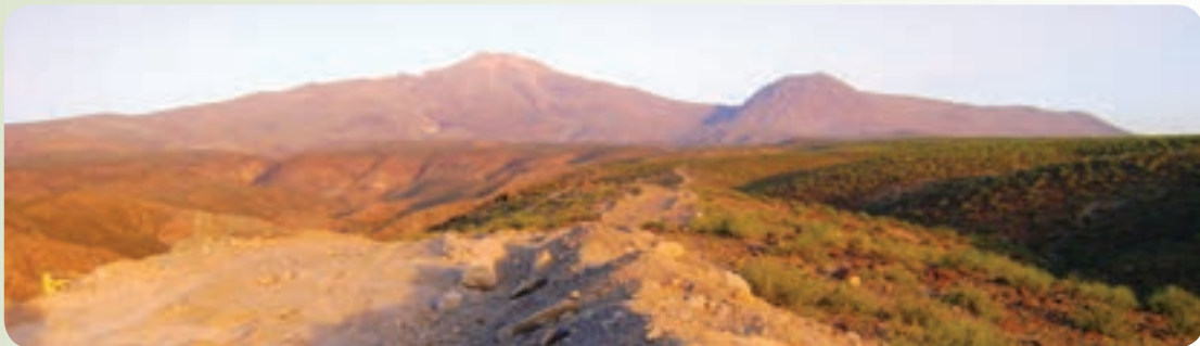
شکل ۲۶-۱۲- کوه بزمان

۱- کوه آتشفشانی (خاموش) بزمان معروف به کوه خضر : این کوه در شمال چالۀ جازموریان با ارتفاع ۳۵۰۳ متر از سطح دریا قرار گرفته است که چالۀ لوت را از چالۀ جازموریان جدا می‌کند. این کوه بعد از تفتان بزرگ‌ترین قله استان است.