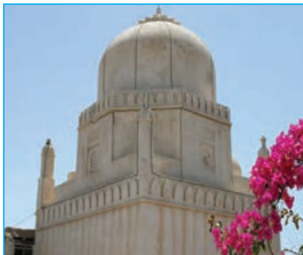
شکل ۲۰-۱۲- مقبره سید غلام رسول