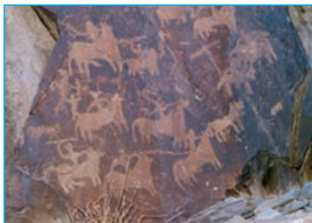
شکل ۱۵-۱۲- سنگ نگاره‌ها

۲- قلعه کنت : این قلعه در شهرستان سیب و سوران در دهستان کنت بخش هیدوچ واقع شده است.