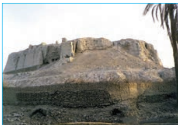
شکل ۱۹-۱۲- قلعه قصر قند