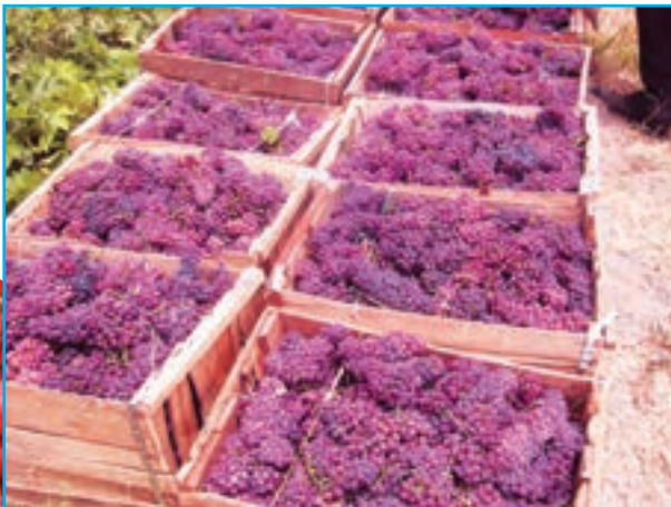
شکل ۳-۱۳- بعضی محصولات باغی استان

* برخی میوه های گرمسیری استان شامل پاپایا (خریزه درختی)، چیکو، کنار و انبه است.