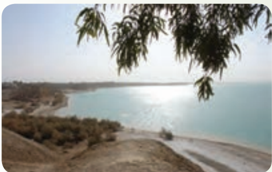
شکل ۲۴-۱۲: چاه نیمه ها

۳- چاه نیمه ها : در جنوب شرقی زابل در کنار روستای قلعه نو (شهرستان زهک) چاله های طبیعی بزرگی وجود دارد که آب رودخانه هیرمند به وسیله کانالی به آن سرریز می شود و به صورت دریاچه مصنوعی در آمده است.