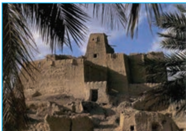
شکل ۱۴-۱۲- قلعه کنت