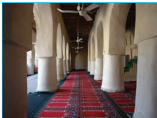
شکل ۱۷-۱۲- مسجد جامع دزک