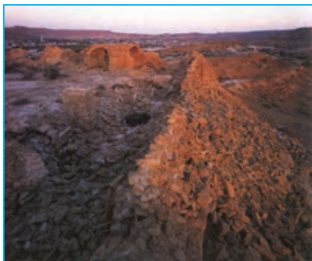
شکل ۲۱-۱۲- قلعه تاریخی تیس