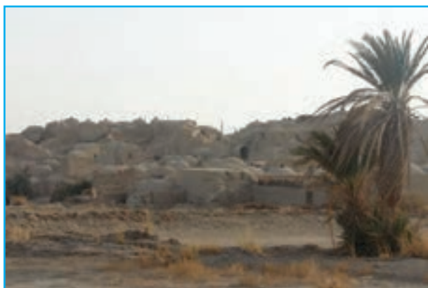
شکل ۴-۱۲- روستای قلعه نو

۲- ساختمان دادگستری : این بنا در مرکز شهر زاهدان و در دو طبقه ساخته شده است.