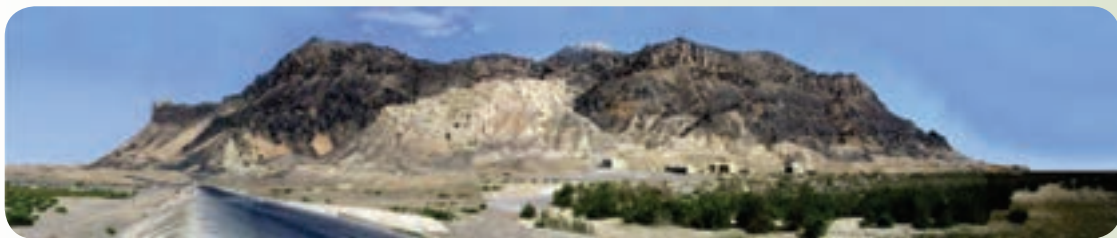
شکل ۲۳-۱۲: کوه خواجه زابل