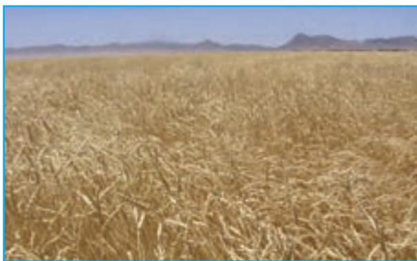
شکل ۱-۱۳- مزرعه گندم