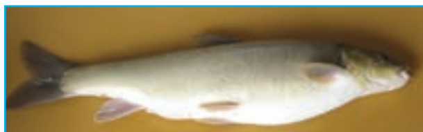
شکل ۸-۱۳ ماهی شیزوتراکس