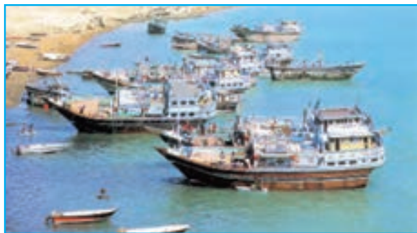
شکل ۱۰-۱۳ لنج‌های صیادی