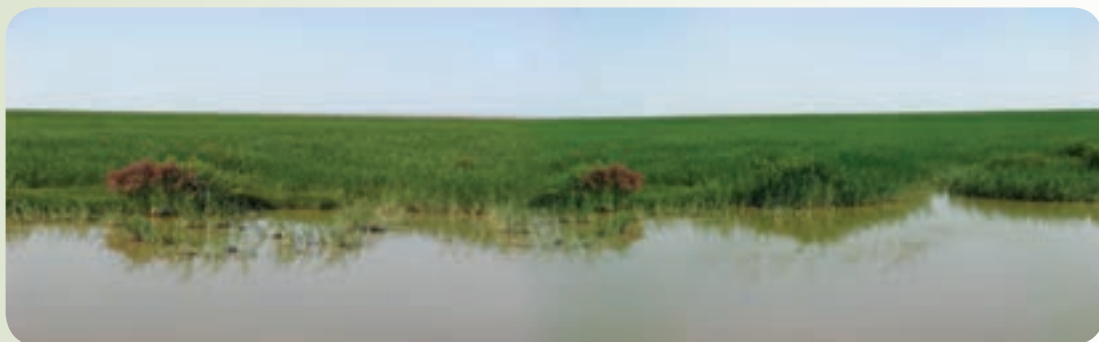
شکل ۲۲-۱۲- دریاچه هامون

۱- دریاچه هامون : بزرگ‌ترین پهنه آب شیرین ایران و زیستگاه انواع پرندگان مهاجر از جمله فلامینگو، پلیکان، درنا، کفچه، انواع اردک، غاز، قو، چنگر(چور) و طاووسک است.