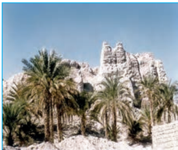
شکل ۱۸-۱۲- قلعه نیک‌شهر