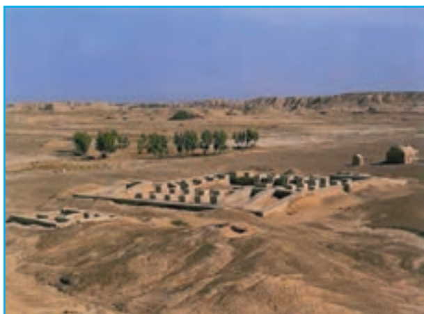
شکل ۵-۱۲- دهانه غلامان