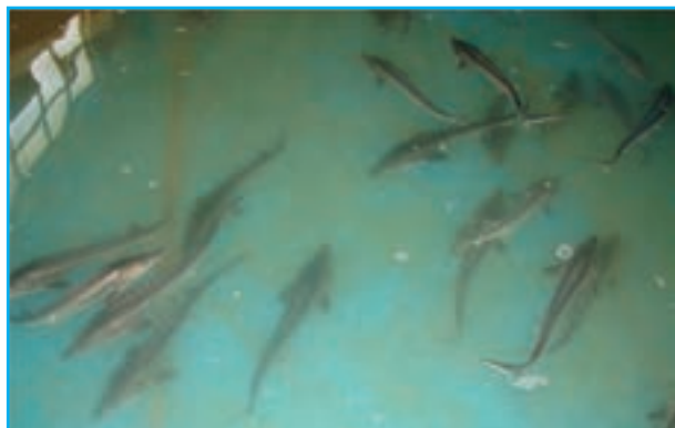
شکل ۷-۱۳ پرورش ماهی