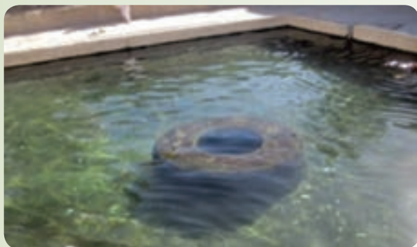
شکل ۲۷-۱۲- چشمۀ آب‌گرم بزمان