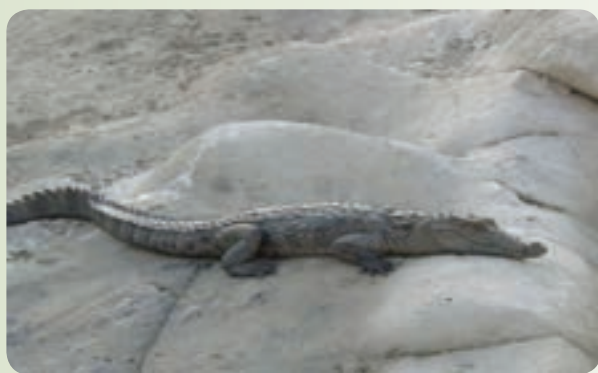
شکل ۲۸-۱۲- تمساح پوزه کوتاه

جانور باقی مانده‌ای از نسل کروکودیل‌هاست که مردم محلی به آن «گاندو» می‌گویند.