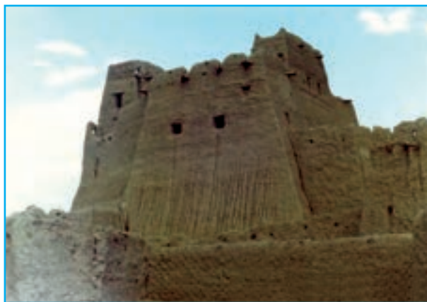
شکل ۱۳-۱۲- قلعه سب