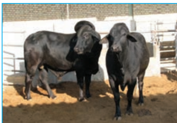
شکل ۵-۱۳- پرورش گاو سیستانی