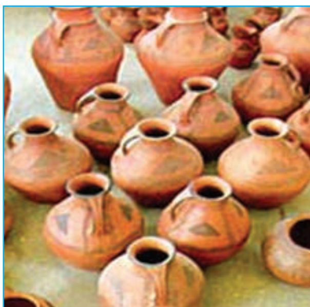
شکل ۱۶-۱۲- سفال کلپورگان

فاصله این شهرستان تا زاهدان حدود ۳۲۷ کیلومتر است. برخی از جاذبه‌های فرهنگی - تاریخی این شهرستان عبارت‌اند از: مسجد جامع دزک، سفال‌کلپورگان و سنگ‌نگاره‌ها در این شهرستان واقع شده است.