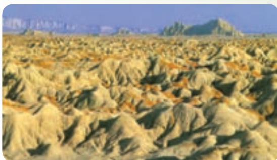
شکل ۳۰-۱۲ کوه‌های مینیاتوری (تپه‌های بدلدنی)

۳- تپه‌های مینیاتوری چابهار (تپه‌های بدلدنی): این تپه‌ها از دیدنی‌های حیرت‌انگیز چابهار است که به موازات ساحل از منطقه کچو تا نزدیک خلیج گوآتر امتداد دارد.