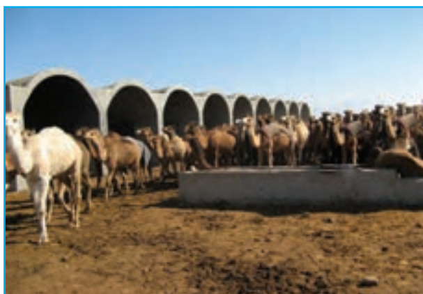
شکل ۶-۱۳- پرورش شتر

از عمده محصولات دامی استان می‌توان به تولید انواع گوشت قرمز، تخم مرغ، شیر و سایر تولیدات دامی اشاره کرد. این تولیدات در برخی صنایع دیگر نظیر واحدهای بسته‌بندی گوشت و سایر کارخانجات وابسته مورد استفاده قرار می‌گیرند.