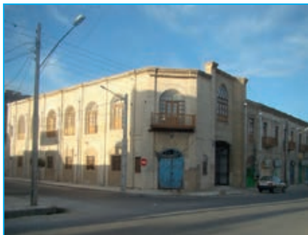
شکل ۷-۱۲- ساختمان دادگستری قدیم