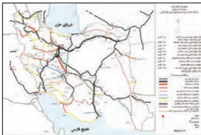
شکل ۱۳-۱۳- نقشه خطوط راه آهن

۲- راه آهن (پاکستان- زاهدان) و احداث راه آهن (چابهار- مشهد)