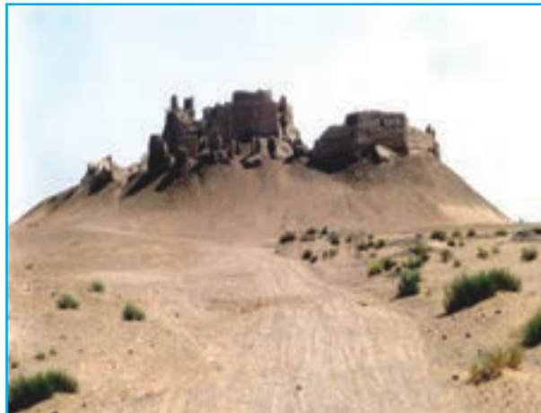
شکل ۱۱-۱۲- قلعه بمپور