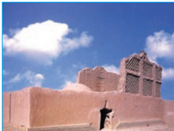
شکل ۳-۱۲- آسباد

۳- آسبادها : جنوب شهر زابل قرار دارد و مربوط به دوره صفوی - افشاری است.