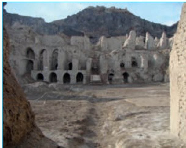
شکل ۲-۱۲- کوه خواجه