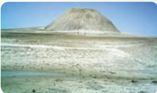
شکل ۳۱-۱۲ گل‌فشان

گل‌فشان‌ها معمولاً به صورت گنبد یا مخروطی شکل و در برخی جاها به صورت حوضچه‌های مملو از آب و گل مشاهده می‌شوند، ابعاد آنها متفاوت است. گل‌فشان‌ها به علت گازهای هیدروکربور یا بخار آب درجه حرارت زیادی دارند و از اعماق زمین به بالا می‌آیند.