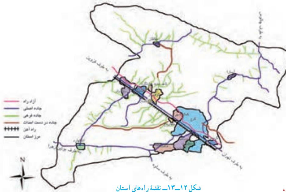
شکل ۱۲-۱۳ نقشه راه‌های استان