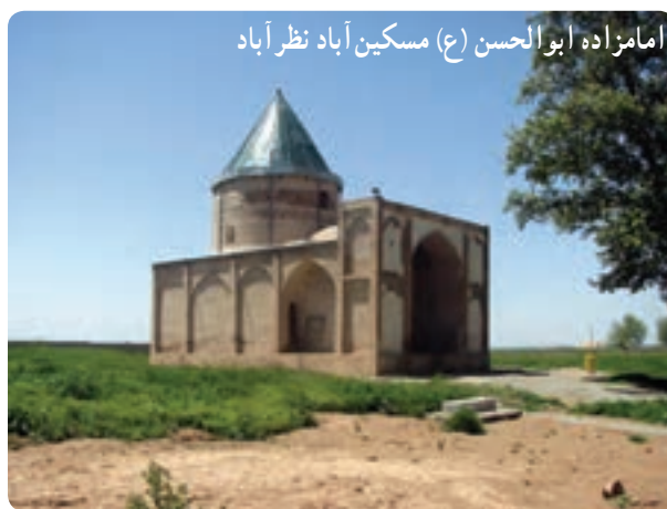
امامزاده ابوالحسن (ع) مسکین آباد نظر آباد