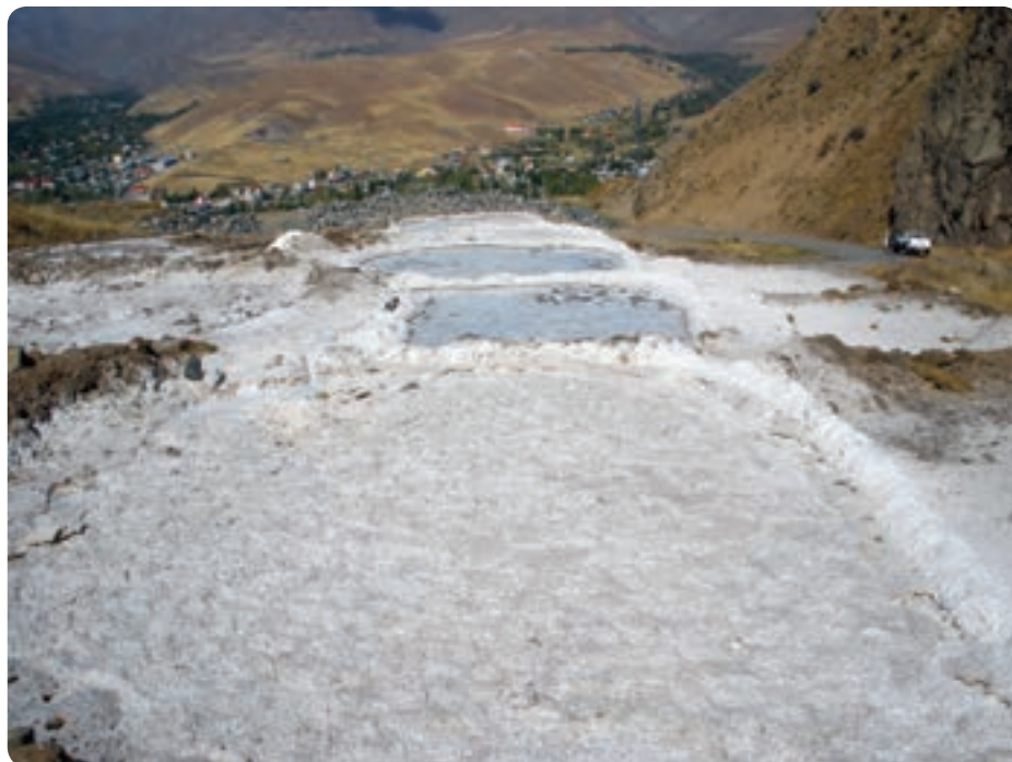
شکل ۱۱-۱۳- معدن نمک در طالقان

معادن: استان البرز وسعت چندان زیادی ندارد اما ۱۱۱ معدن دارای پروانه بهره‌برداری در شهرستان‌های آن فعال‌اند. وجود ۳۸ معدن غیر فعال و ۳ معدن در حال اکتشاف نیز از دیگر ظرفیت‌های استان است. معادن در حال بهره‌برداری بیشتر سنگ‌های ساختمانی، گچ و معدن زغال سنگ باریت، سنگ‌های تزئینی می‌باشند.