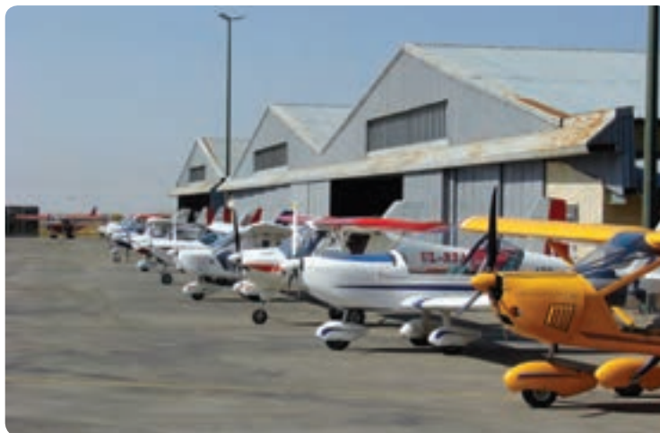
شکل ۹-۱۲- مرکز آموزش هوایی صالحیه نظرآباد

دریاچه سد کرج و طالقان، مرکز آموزش هوایی در صالحیه نظرآباد، پیست اسکی خور «در جاده چالوس» و ارتفاعات نورالشهدای عظیمیه از دیگر توان‌های استان برای گردشگری است.