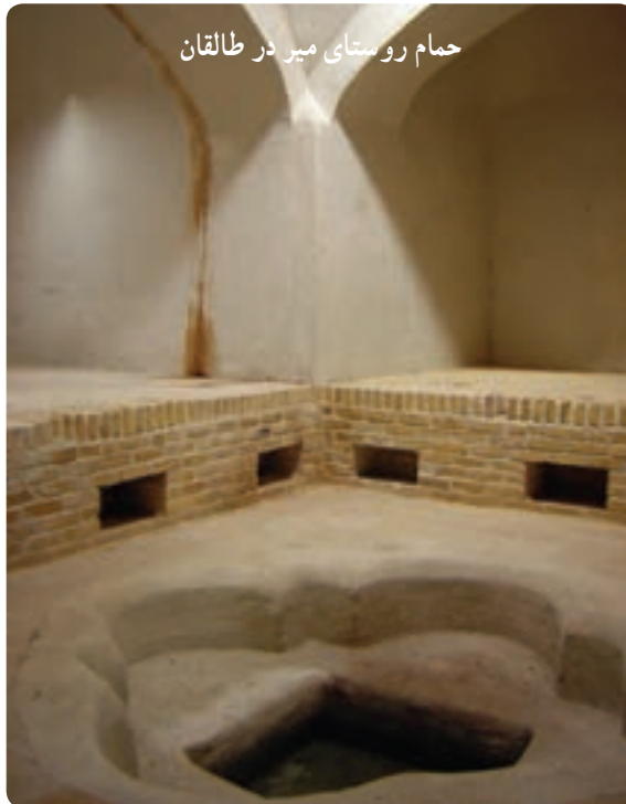
حمام روستای میر در طالقان

۲- بناهای تاریخی: این بناها شامل کاروانسراها، حمام‌های تاریخی، عمارت‌ها و کاخ‌های دوران پهلوی، پل‌ها، آسیاب‌ها و برج‌های تاریخی می‌باشند که گردشگران فرهنگی و تاریخی را به خود جذب می‌کنند. پل شاه‌عباسی، برج کردان، برج میدانک جاده چالوس، حمام مصباح کرج و شهرک طالقان، کاخ مروارید مهرشهر، آسیاب آبی مهدی آباد نظرآباد شاخص‌ترین این بناها محسوب می‌شوند.