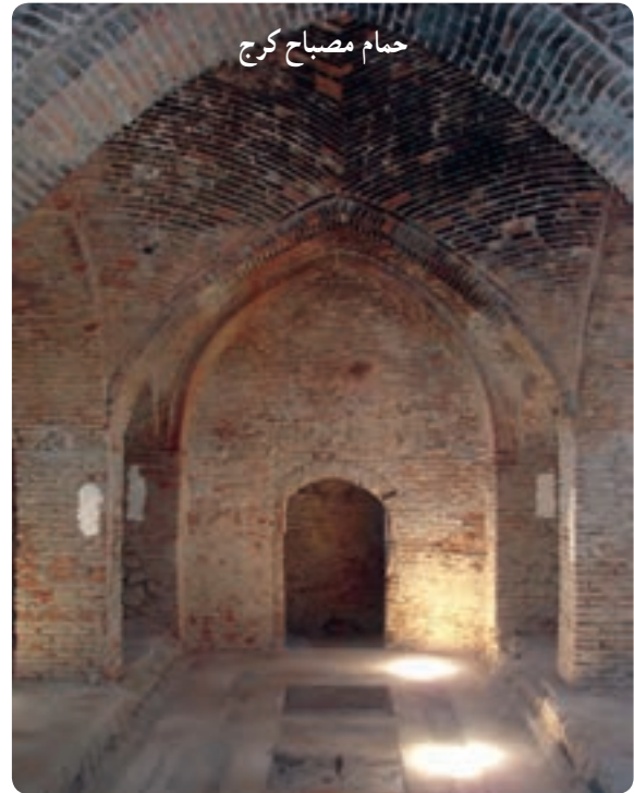
حمام مصباح کرج