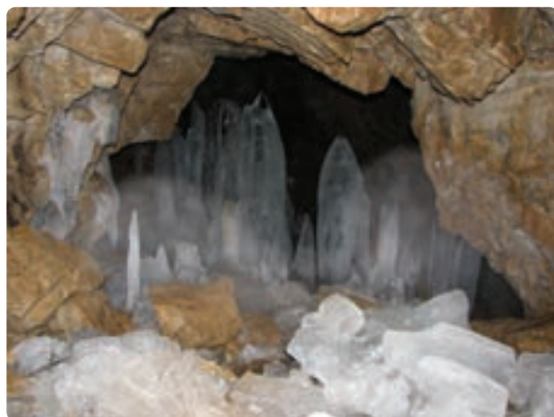
شکل ۳-۱۲- غار یخ مراد

۲- غارهای طبیعی : این غارها در اثر عوامل فرسایش ایجاد شده‌اند و مشاهده آن برای جغرافیدانان، زمین‌شناسان و دوستداران طبیعت لذت‌بخش است. از جمله این غارها یخ‌مراد در محور کرج - چالوس است که در دوره دوم زمین‌شناسی ایجاد شده و در اغلب اوقات سال دارای قندیل‌های یخی است. از دیگر غارهای طبیعی می‌توان به غار «وایسوار» در روستای هیو ساوجبلاغ اشاره کرد.