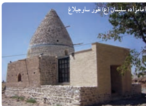
امامزاده سلیمان (ع) خور ساوجبلاغ

شکل ۵-۱۲- امامزاده‌ها اصلی‌ترین مکان‌های زیارتی استان