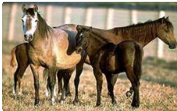
شکل ۶-۱۳ پرورش اسب و شترمرغ

موقعیت کوهستانی همراه با دامنه‌های سرسبز و سودآوری مناسب سبب شده که استان یکی از کانون‌های مهم فعالیت زنبورداری باشد. شهرستان طالقان و ارتفاعات چهار از مراکز اصلی تولید عسل محسوب می‌شوند.