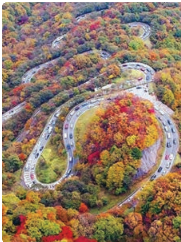
شکل ۷-۱۲- منظره طبیعی – تاریخی محور ارتباطی کرج، چالوس