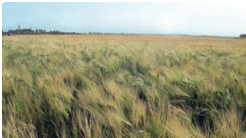
شکل ۲-۱۳- ذرت علوفه‌ای و گندم اصلی‌ترین محصولات کشاورزی دشت‌های استان