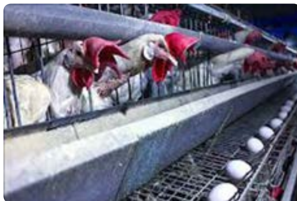
شکل ۵-۱۳- واحدهای مرغداری و گاوداری صنعتی

پرورش شتر، اسب، شترمرغ، بلدرچین و ... از دیگر فعالیت‌های دام و طیور است که در سال‌های اخیر مورد توجه قرار گرفته است.