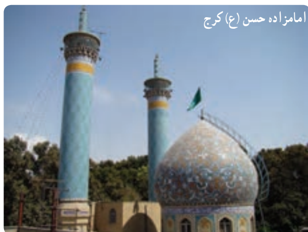
امامزاده حسن (ع) کرج