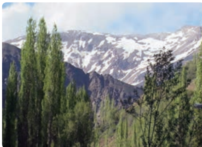
شکل ۲-۱۲ ارتفاعات شمال استان از مناطق عمده گردشگری