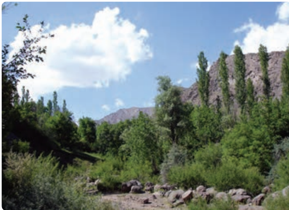
شکل ۱-۳- باغ‌های میوه در ناحیه کوهستانی

۱- ناحیه کوهستانی: این ناحیه به علت آب و هوای معتدل کوهستانی، وجود رودخانه‌های پر آب و زمین‌های ناهموار بیشتر به صورت باغ‌های میوه در امتداد دره‌های کوهستانی و رودخانه‌ها مورد استفاده قرار می‌گیرد.