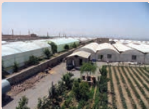
شکل ۴-۱۳- سایت گلخانه‌ای در شهر جدید هشتگرد