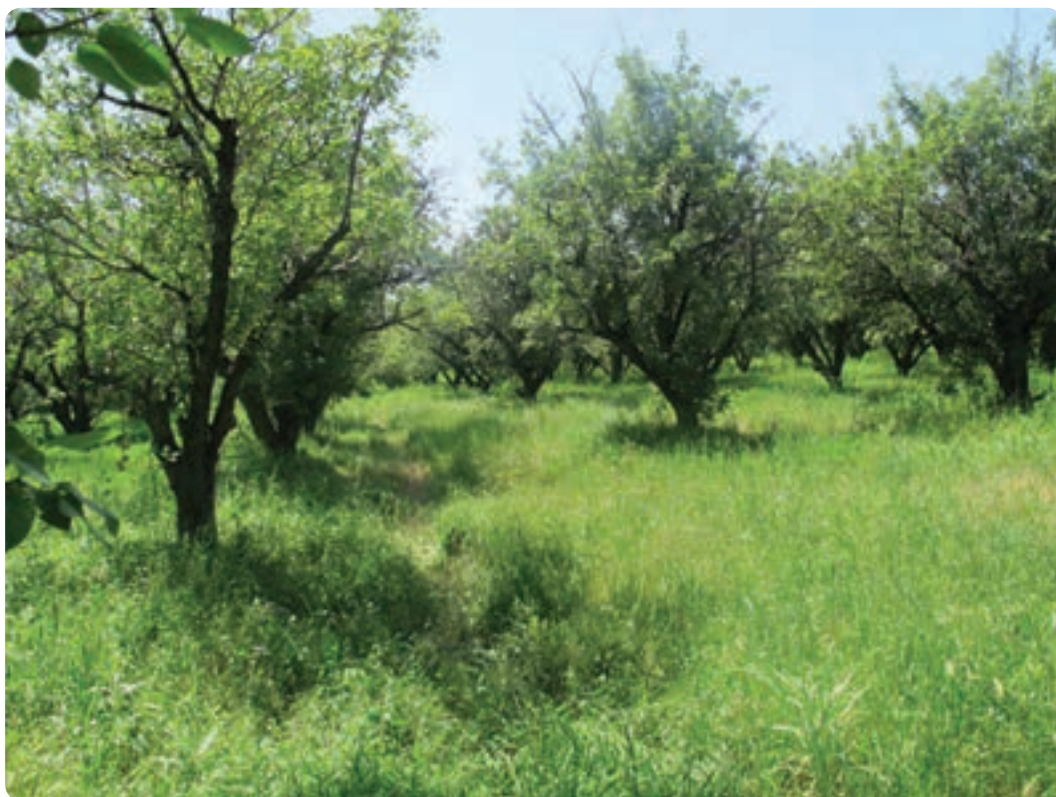
شکل ۳-۱۳- باغ‌های میوه در ناحیه دشت

شهرستان‌های ساوجبلاغ، کرج، اشتهارد و طالقان از نظر وسعت اراضی زراعی در رتبه‌های بعدی قرار دارند. بیشتر فعالیت‌های کشاورزی در این مناطق به صورت باغداری است.