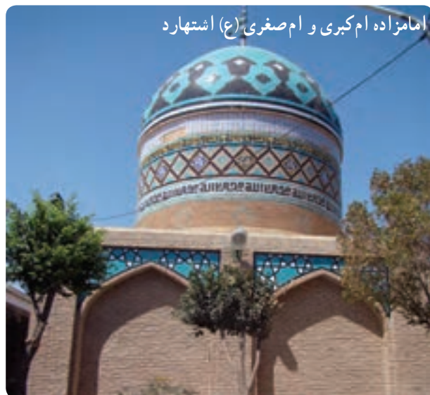
امامزاده ام کبری و ام صغری (ع) اشتهارد