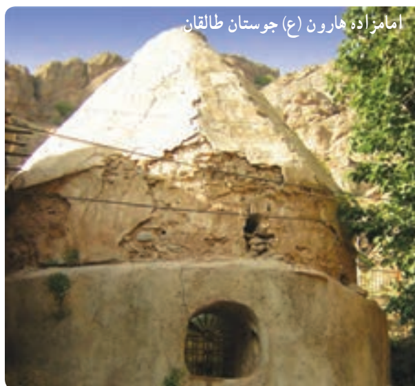
امامزاده هارون (ع) جویستان طالقان