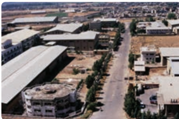
شکل ۹-۱۳- شهرک صنعتی در استان

استان البرز با هفت شهرک صنعتی فعال یکی از مراکز مهم صنعتی کشور محسوب می‌شود. صنایع غذایی، برق، الکترونیک، فلزی و سلولزی از مهم‌ترین واحدهای فعال آن به شمار می‌روند.