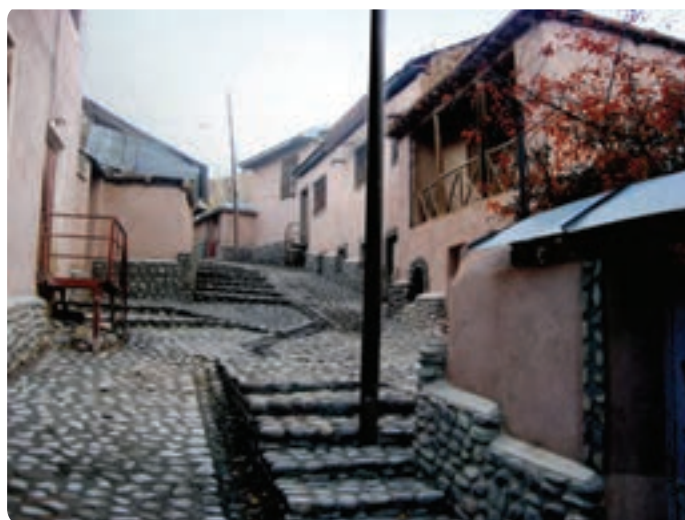
شکل ۱۱-۱۲ روستای نمونه (هدف) گردشگری گلیرد