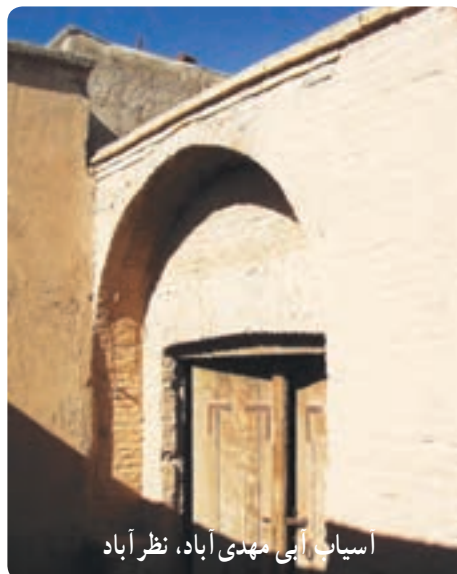
اسیاب آبی مهدی آباد، نظرآباد