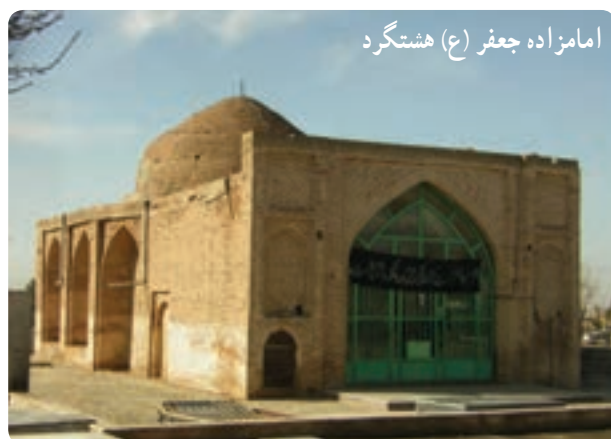
امامزاده جعفر (ع) هشتگرد