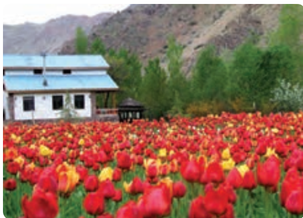
شکل ۱-۱۲- جاذبه‌های عمده گردشگری استان