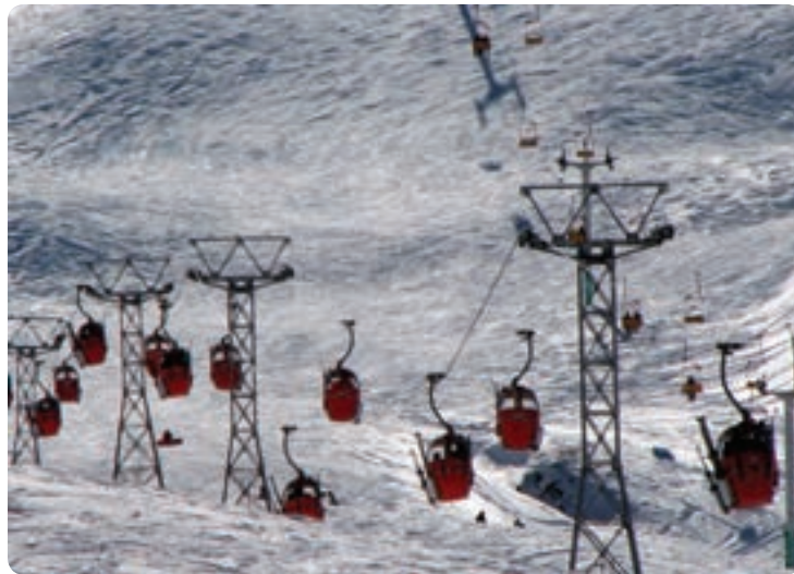
شکل ۸-۱۲- پیست دیزین

علاوه بر این مسیر جاده‌های کردان و جاده طالقان از دیگر محورهای گردشگری استان محسوب می‌شوند. پیست اسکی دیزین : این پیست از مهم‌ترین پیست‌های اسکی کشور است و به دلیل وجود امکانات رفاهی، تله‌کابین، تله اسکی، برگزاری مسابقات بین‌المللی، علاقه‌مندان ورزش‌های زمستانی را به خود جذب می‌کند. در فصل تابستان نیز علاوه بر اسکی روی چمن، ارتفاعات این پیست پوشیده از انواع گل‌های وحشی و گیاهان دارویی است. هوای مطبوع و مجموعه‌های آموزشی-رفاهی خانواده‌ها را به سوی خود می‌کشاند.