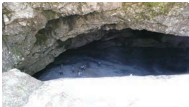
شکل ۵-۵- برفچال در کوه دلفک

پ) رودها: بستر رودهای گیلان عموماً در مسیر دره‌های کوهستانی که از جنگل‌های سرسبز و انبوه پوشیده شده‌اند، قرار دارد. این رودها از نظر ماهیگیری و صید قزل‌آلا اهمیت داشته، به دلیل جریان تند خود برای قایقرانی قابلیت دارند. ت) کوهستان‌ها و نواحی ییلاقی: نواحی ییلاقی گیلان به دلیل تلفیق جنگل، مرتع و رودهای جاری در آن از ییلاق‌های سایر قسمت‌های کشور ما متمایزند و علاوه بر آب و هوای مطبوع دارای چشمه‌های آب معدنی و قابل دسترسی هستند.