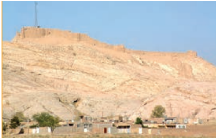
شکل ۱- ۴- قلعه دختر کرمان

الف) قبل از اسلام : کرمان در دوره هخامنشی یکی از ولایات مهم تابعه پارس محسوب می شده است. اردشیر بابکان که محل تولد و نشو و نماى او شهر بابک کرمان بود، در آبادانی این مملکت سعی فراوان داشت از جمله اینکه در شهر کرمان در جوار قلعه دختر، قلعه اردشیر را بنا نهاد و آن را گواشیر نامید و هنوز آثار خرابه‌های قلعه دختر و قلعه اردشیر بر فراز تپه‌ای در شرق کرمان پابرجاست.