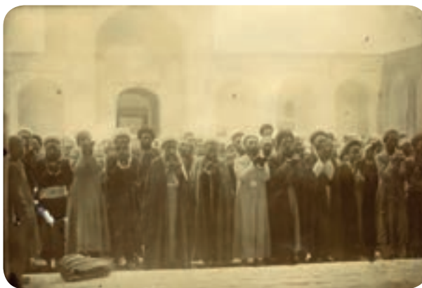
شکل ۶-۴- آیت الله حاج میرزا محمد رضا در مسجد جامع

ج) دوره معاصر: هم‌زمان با شروع انقلاب اسلامی مردم کرمان همچون گذشته با حضور فعال و شجاعانه خود در صحنه سیاسی و شرکت در راهپیمایی‌ها و تحصن‌ها و مبارزه با رژیم ستم شاهی پهلوی همگام با روحانیت مبارز گام‌های استواری در رسیدن به هدف که سقوط رژیم پهلوی و استقرار نظام مقدس جمهوری اسلامی بود برداشتند. مسجد جامع و مسجد امام (ملک) دو پایگاه اصلی مردم انقلابی در کرمان بود. حادثه‌ای که باعث تسریع حرکت انقلاب در کرمان شد، آتش کشیدن مسجد جامع توسط عمال مزدور رژیم در ۲۴ مهر ۱۳۵۷ بود.