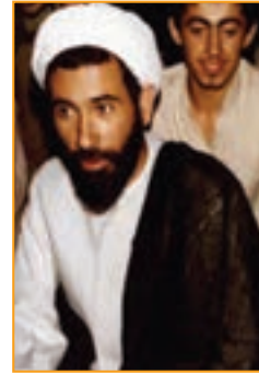
شکل ۱۲-۴- شهید دکتر محمد جواد باهنر