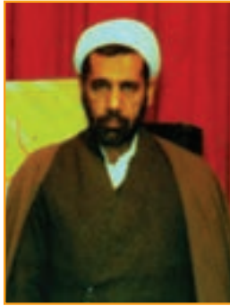
شکل ۱۴-۴- شهید حجت الاسلام علی ایرانمنش