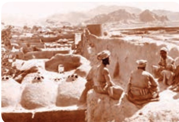
شکل ۵-۴. حصار و قسمتی از شهر قدیمی کرمان در عصر قاجار

پس از مرگ کریمخان در آغاز حکومت لطفعلی خان زند، آقا محمد خان قاجار جهت تسخیر شیراز به آنجا حمله نمود. لطفعلی خان از شیراز فرار کرده تا اینکه به پیشنهاد حاکم نرماشیر و بم به کرمان آمده و مردم کرمان از وی حمایت کردند، این خبر برای آقا محمد خان بسیار ناگوار بود. لذا برای فتح کرمان با سپاهی عظیم به سوی کرمان هجوم آورد و پس از ماه‌ها محاصره و سرانجام پس از فتح کرمان دست به کشتار عظیمی زد و هزاران نفر از مردم کرمان را کور کرد و شهر به ویرانه‌ای مبدل شد. در دوره قاجاریه، مردم کرمان در قضایای مشروطیت و آزادی خواهی ایرانیان نقش به سزایی داشتند. این ماجرا از تیر خوردن ناصرالدین شاه توسط میرزا رضای کرمانی در حرم حضرت عبدالعظیم شروع شد و سرنوشت ملت ایران را تغییر داد.