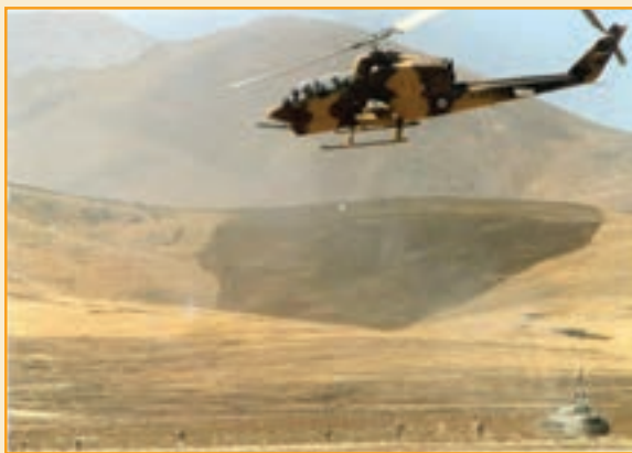
شکل ۲۷-۴: عملیات هلیکوپتر کبری در رزم با دشمن متخاصم

۲- پایگاه هوانیروز کرمان : از ابتدای جنگ تحمیلی تا پایان دفاع مقدس، ملت ایران در بسیاری از عملیات‌ها حضور داشتند. تیزپروازان هوانیروز با هلیکوپترهای کبری، ۲۱۴ و غیره از عملیات‌های پدافندی ایستگاه ذوالفقاری آبادان در آبان ۱۳۵۹ تا عملیات مرصاد در مرداد ۱۳۶۷ در عملیات‌های مهم ارتش و سپاه نقش‌آفرین بودند.