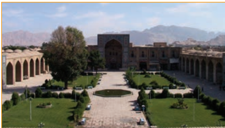
شکل ۲- ۴- مجموعه تاریخی گنجعلی خان کرمان

ب) دوران اسلامی : بنا به روایات تاریخی، کرمان در سال ۲۴ هجری توسط مسلمانان فتح شد. اما تا سال ۸۶ هجری زرتشتیان در کرمان بیشترین قدرت و قوت را دارا بودند. با به قدرت رسیدن صفاریان، کرمان تا حدودی روی آبادی را به خود دید و بناهای متعددی از جمله مسجدی عظیم در جیرفت بنا نهاده شد.