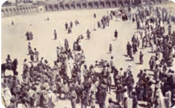
شکل ۳-۴. ارگ تاریخی کرمان (میدان ارگ فعلی)

در آستانه به قدرت رسیدن صفویان، کرمان از جمله مناطقی بود که در معرض حمله و غارت ازبکان قرار گرفت و شاه اسماعیل صفوی با شکست ازبکان، امنیت را برای کرمان به ارمغان آورد. حاکم مشهور کرمان در دوره صفویه گنجعلی خان بود. وی در طول سی سال حکومت خود بر کرمان به احداث آثار و بناهای متعدد از جمله کاروانسرا، بازار، حمام، مسجد، مدرسه و آب انبار پرداخت.