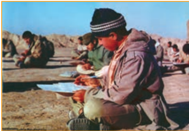
شکل ۳۰-۴ دانش آموزان رزمنده کرمانی در جبهه دفاع مقدس