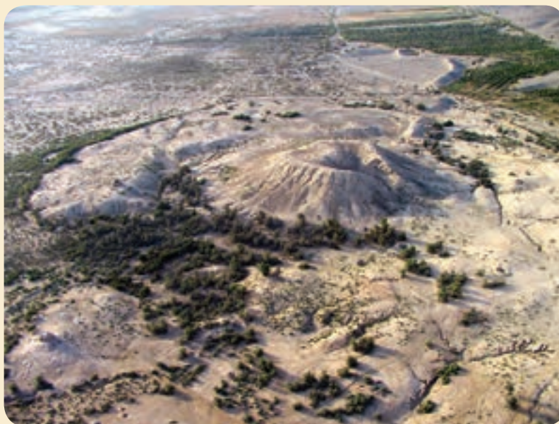
شکل ۸-۴- تپه تاریخی کنار صندل (تمدن حوزه هلیل)

وجود تپه‌های تاریخی فراوان در استان کرمان دلیل قدمت چندین هزار ساله تمدن آن است.