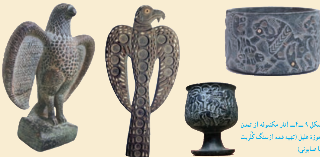
شکل ۹-۴- آثار مکشوفه از تمدن حوزه هلیل (تهیه شده از سنگ گلریت یا صابونی)

باستان شناسان یافته‌های کنار صندل (شمالی و جنوبی) را مربوط به نیمه دوم هزاره چهارم قبل از میلاد می‌دانند. و تاکنون بیش از ۳۰۰ اثر مهر از آن به دست آمده است. به نظر می‌رسد این اثر مهرها، در ارتباط با تأمین امنیت محتویات کیسه‌های کوچک، سبدهای کوچک و دیگر ظروف کوچک بوده‌اند. این مدارک مهرسازی، بر روابط تنگاتنگ این منطقه با فرهنگ‌های همزمان عصر مفرغ در میان رودان، دره سند و آسیای مرکزی اشاره دارند، تنوع موجود در هنر مهرسازی حکایت از این دارد که کنار صندل جنوبی در مرکز شبکه فعالی از تجارت راه دور قرار داشته است.