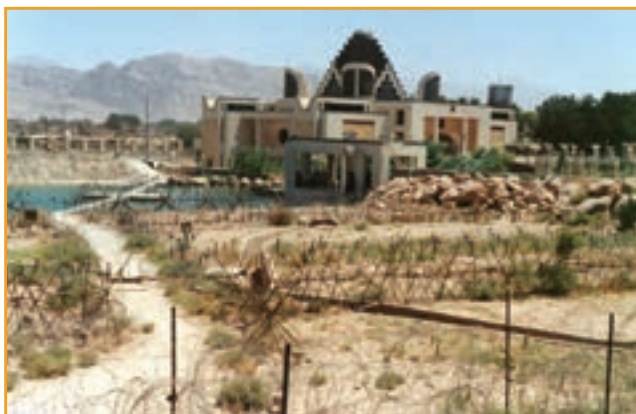
شکل ۳۲-۴ موزه دفاع مقدس استان کرمان

استان کرمان با ۸۱۸ گلزار شهید و ۲۷ حرم مطهر شهدای گمنام، یکی از استان های نمونه کشور است. همچنین موزه دفاع مقدس که در سال ۱۳۷۶ به هنگام برگزاری کنگره سرداران ۸۰۰۰ شهید استان های کرمان و سیستان و بلوچستان و هرمزگان به عنوان اولین موزه دفاع مقدس کشور افتتاح شد و ستاد معراج شهدا یادگار ۶۴۰۲ شهید و سرداران شهید استان، از جمله یادمان های دفاع مقدس استان به شمار می آیند. نصب تصاویر کاشی شهدا در سطح شهرهای استان و تندیس های دفاع مقدس در میادین شهرهای استان از دیگر یادمان های دفاع مقدس است.