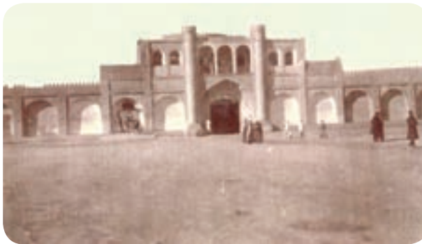
شکل ۴-۴. دروازه ناصری کرمان