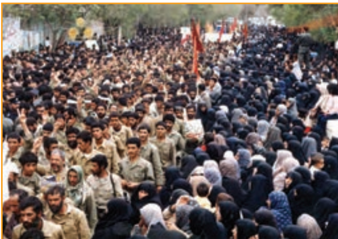
شکل ۳۳-۴ اعزام رزمندگان کرمانی به جبهه‌های حق علیه باطل

رزمندگان استان در طول ۸ سال دفاع مقدس به صورت متناوب به جبهه‌ها اعزام می‌کردند. بزرگ‌ترین اعزام استان، هم‌زمان با اعزام سراسری سپاهیان حضرت محمد (ص) در آذرماه ۱۳۶۵ بود. در این اعزام بیش از ۱۵ هزار نفر رزمنده به جبهه اعزام کردند. همچنین عملیات‌های والفجر ۸ با حضور ۵۴۴۰ نفر و کربلای ۵ با حضور ۹۱۲۶ نفر شاهد بیشترین حضور رزمندگان استان کرمان در عملیات‌ها بود.