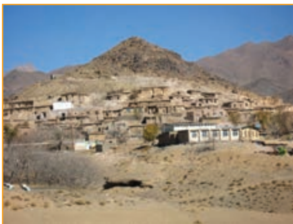
شکل ۲۶-۴- روستای شهید پرور گُنجان شهرستان رابر

«روستای گُنجان شهرستان رابر دومین روستای نمونه شهیدپرور کشور به لحاظ داشتن بیشترین تعداد شهید به نسبت جمعیت است.»