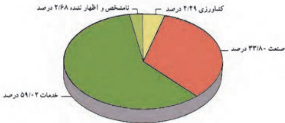
شکل ۵-۲۰ نمودار درصد شاغلان در بخش‌های مختلف اقتصادی استان

استان تهران یکی از قطب‌های اقتصادی کشور است. تجمع کانون‌های اقتصادی در این استان و موقعیت سیاسی و اداری و نیز مرکزیت آن باعث شده است که بخش عمده امکانات در محدوده آن متمرکز شود. نمودار زیر، شاغلان را در سه بخش کشاورزی، صنعت و خدمات در استان تهران نمایش می‌دهد.