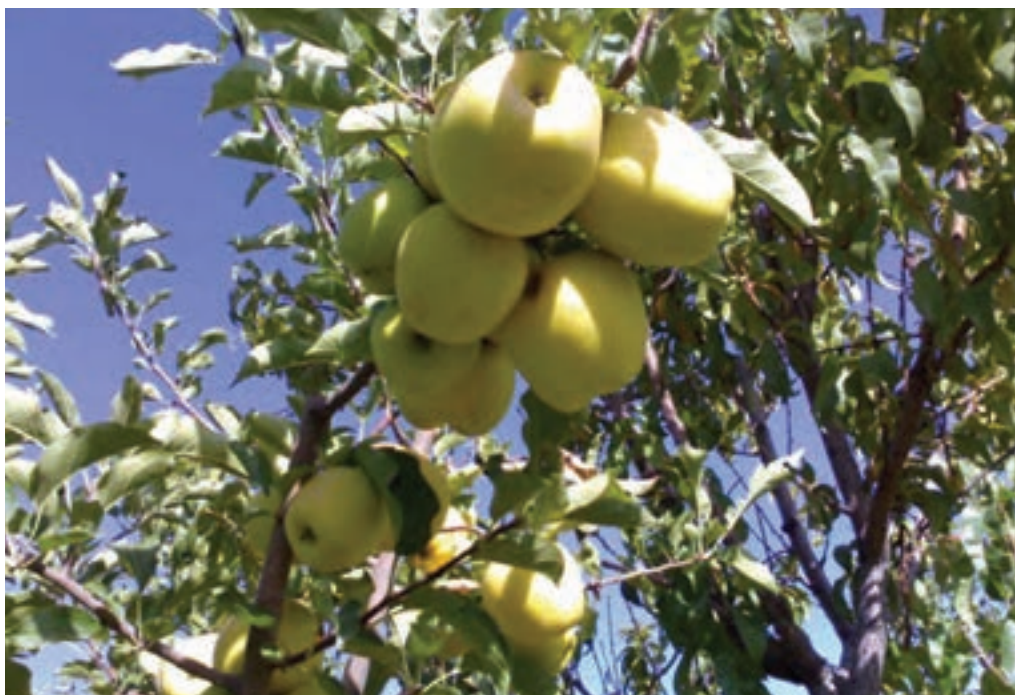
شکل ۲۱-۵. باغ سیب در شهرستان دماوند

۲- دشت‌ها و کوهپایه‌های جنوبی البرز؛ شامل ورامین، ری، شهریار و رباط کریم است. این بخش برای کشاورزی مساعد است؛ زیرا از منابع آب‌های سطحی و زیرزمینی برخوردار است اما زمین‌هایی که در نزدیکی شوره‌زارها واقع شده‌اند، برای کار کشاورزی مناسب نیستند.