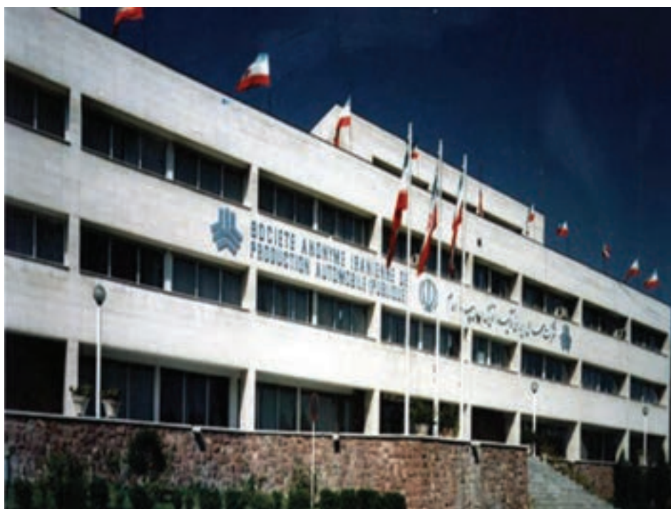
شکل ۲۵- شرکت خودروسازی سایپا