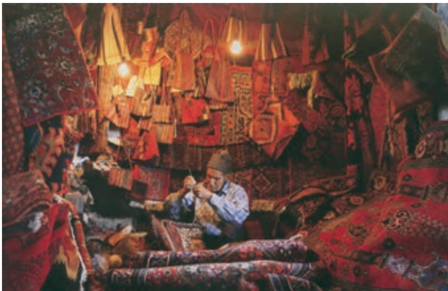
شکل ۲۷-۵- نمونه‌ای از بازار صنایع دستی تهران

۳- صنایع دستی عشایری : قدیمی‌ترین نوع صنایع دستی استان است که تولید آن عموماً به‌طور خانگی و فصلی انجام می‌پذیرد. این نوع از صنایع دستی، با توجه به ترکیب قومی منطقه، در میان صنایع دستی استان جایگاهی ویژه دارد و هم‌اینک یکی از نقاط برجسته و مثبت صنایع دستی استان محسوب می‌شود. دست‌اندرکاران این بخش از دست‌ساخته‌های ایرانی که بافت انواع قالی و قالیچه، جاجیم و گلیم، چننه ۱ ، رویه پشتی، جوال ۲ ، خورجین ۳ و نیز رنگرزی و ریسندگی پشم را در انحصار خود دارند، گروهی از عشایر لر، قشقایی، شاهسون و... هستند که در دهه‌های اخیر از زادگاه خود به تهران، ری، ورامین و کرج مهاجرت کرده‌اند.