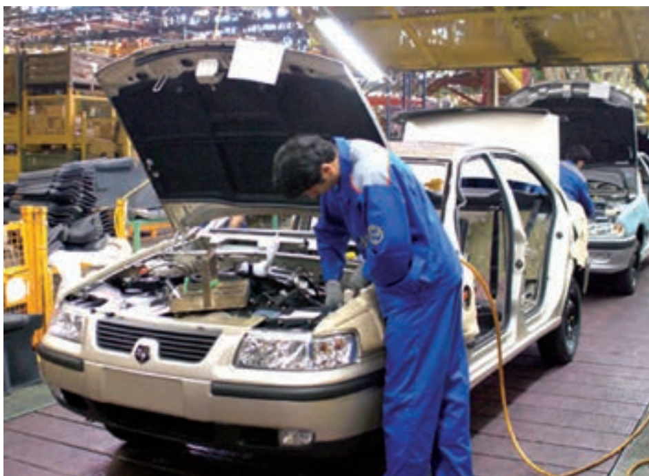
شکل ۲۶- تولید اتومبیل در کارخانه ایران خودرو