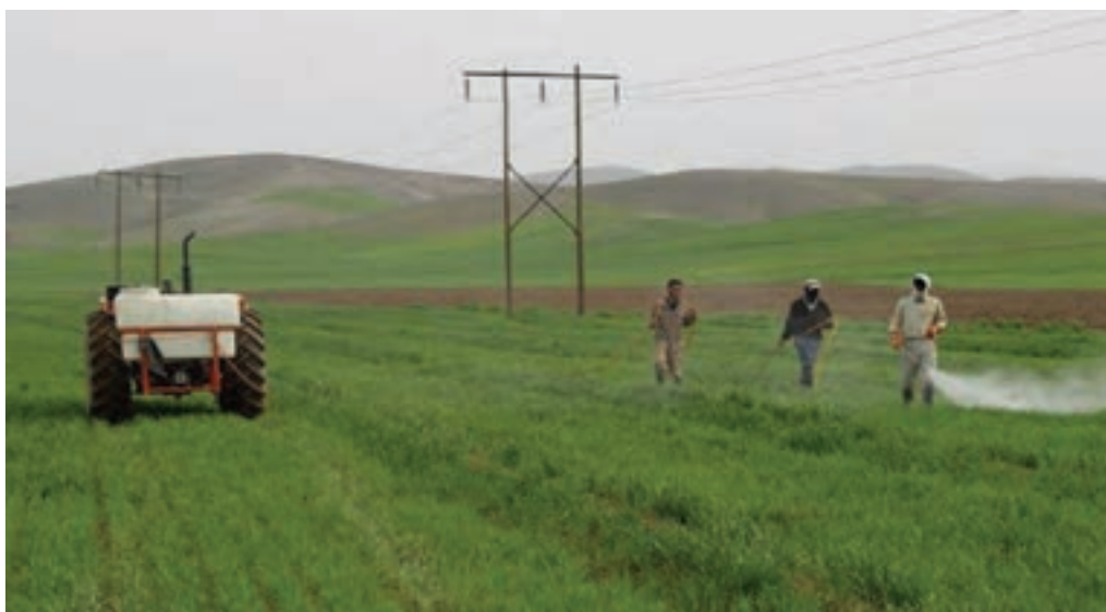
شکل ۲۲-۵. فعالیت‌های کشاورزی در اطراف شهر ری

۲- دشت‌ها و کوهپایه‌های جنوبی البرز؛ شامل ورامین، ری، شهریار و رباط کریم است. این بخش برای کشاورزی مساعد است؛ زیرا از منابع آب‌های سطحی و زیرزمینی برخوردار است اما زمین‌هایی که در نزدیکی شوره‌زارها واقع شده‌اند، برای کار کشاورزی مناسب نیستند.