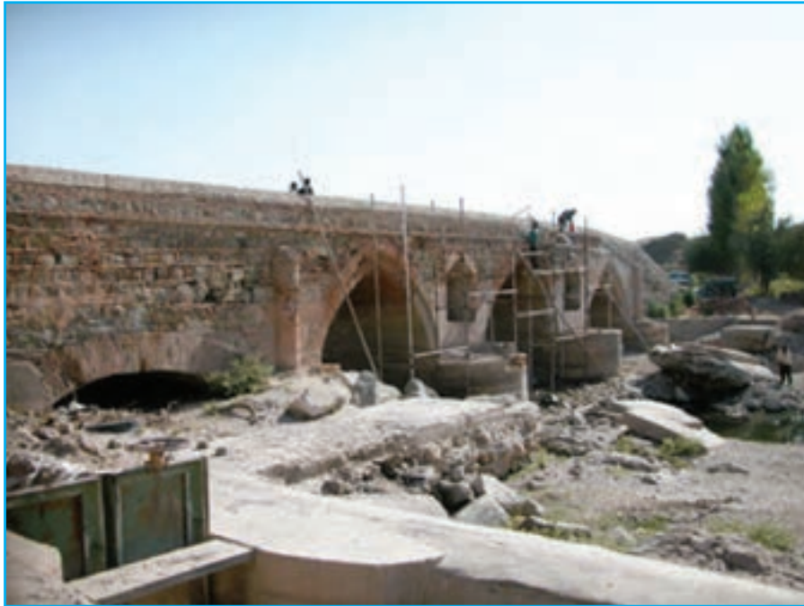
شکل ۱۱-۴- پل دختر- ملکان- دوره صفوی ۹۵۱ ه.ق