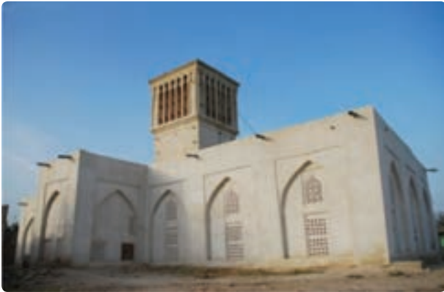
مسجد بردستان - یکی از قدیمی ترین مساجد جنوب ایران مربوط به قرن نهم هجری - دیر