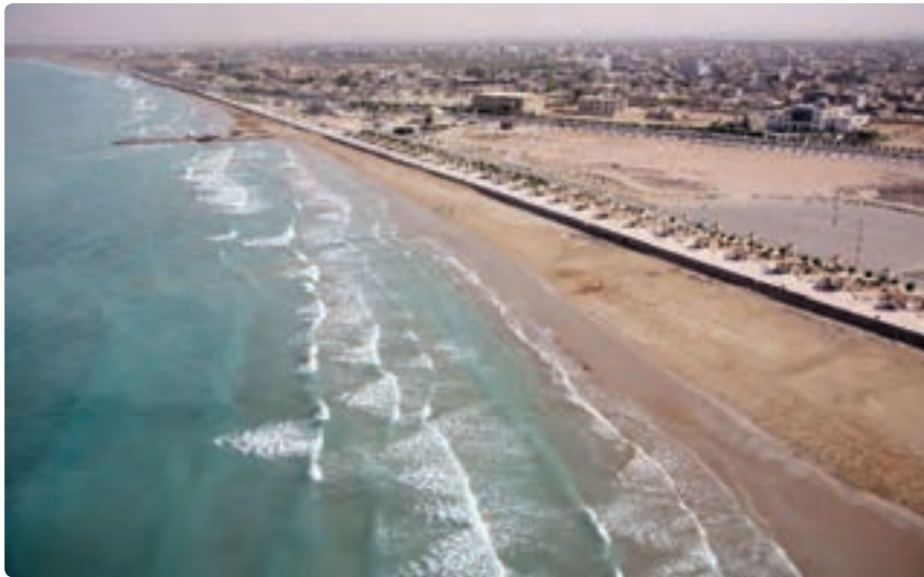
شکل ۳-۱۲- استفاده از پتانسیل سواحل و دریا برای توسعه گردشگری - (بندرگناوه)

۲- کوه‌ها : بخش اعظم نواحی شمال شرقی و شرق استان را کوه‌های کم ارتفاع و بلند در بر گرفته که امکانات متنوعی برای فعالیت‌های گردشگری و علمی فراهم نموده است. از آن میان می‌توان به کوه «نمک» یا گنبد نمکی در جاشک (حد فاصل شهرستان دیر و دشتی) اشاره نمود که به‌عنوان یک پدیده کم‌نظیر و فوق‌العاده زیبا و حیرت‌انگیز از شاهکار طبیعت که در آن غارها و چشمه‌های نمکی و قندیل‌های زیبا به فراوانی به چشم می‌خورد به‌همین جهت همه ساله تعداد زیادی گردشگر برای دیدن این پدیده طبیعی به منطقه سفر می‌کنند.