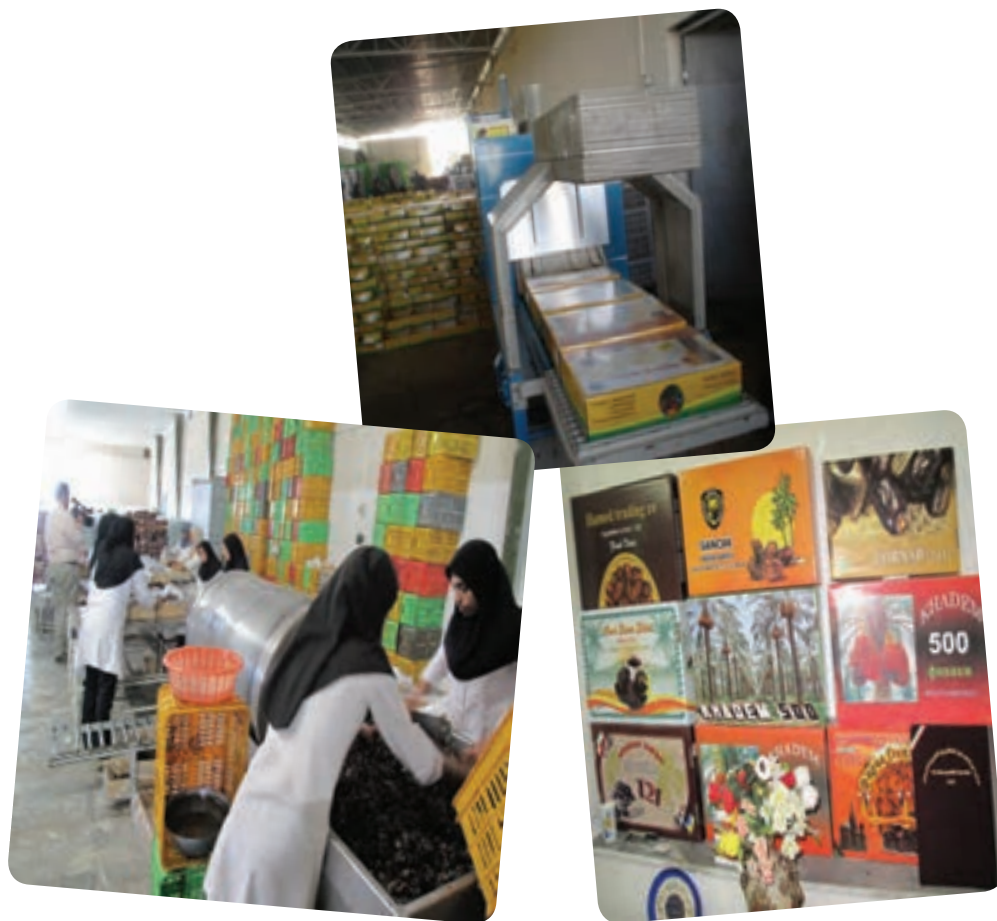
شکل ۱۳-۱۳- کارخانه بسته‌بندی خرما

علاوه بر صنایع موجود، شرایط و امکانات طبیعی و انسانی استان وجود کدام صنایع را ممکن می‌سازد؟ شهرستان محل زندگی شما در زمینه ایجاد کدام صنایع امکانات بالقوه دارد؟