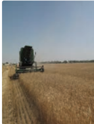
کشت و برداشت مکانیزه