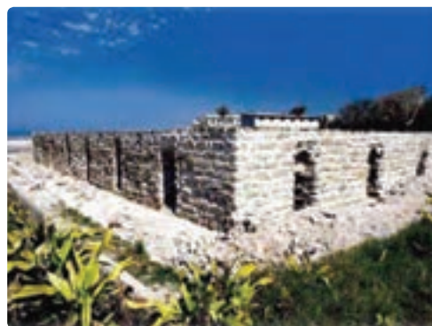
آب انبار قوام - بوشهر