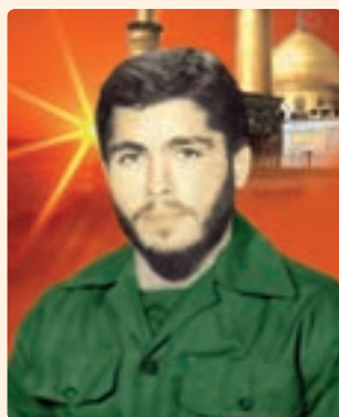
شکل ۱۷-۱۰- شهید نادر مهدوی