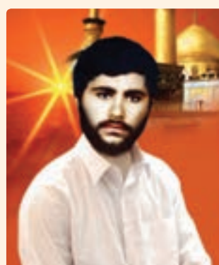
شکل ۱۶-۱۰- شهید بیژن گرد