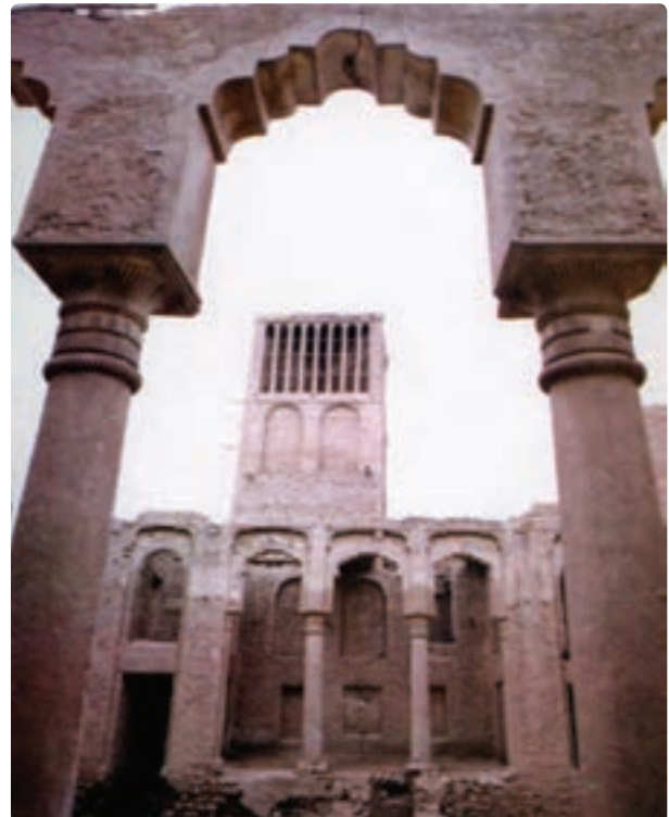
شکل ۱-۱۲- جاذبه‌های گردشگری استان