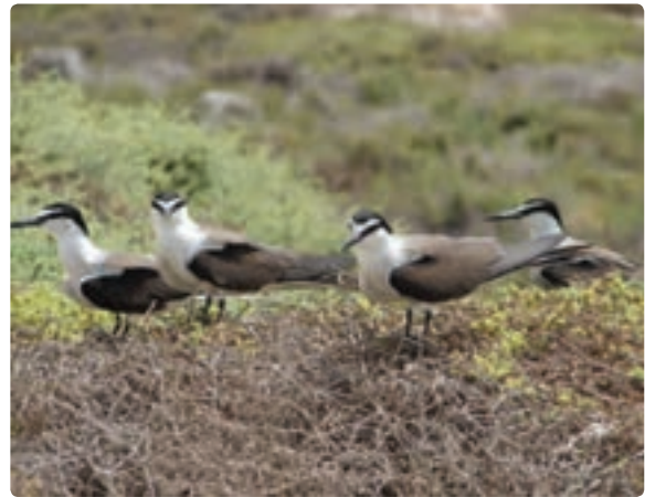
شکل ۱۲-۱۲- پرندگان و پوشش گیاهی منطقه حفاظت شده مند

(ب) جاذبه‌های انسانی: نواحی جنوبی ایران به خصوص استان‌های خوزستان و بوشهر، جزء نخستین زادگاه‌های تمدن بشری است، اما به دلیل شرایط اقلیمی (رطوبت و تبخیر زیاد و تأثیر فرسایش) تعداد کمی از میراث چند هزار ساله، از دولت‌های باستانی ایلام، هخامنشیان، اشکانیان، ساسانیان و دوره بعد از اسلام و قرون اخیر مخصوصاً افشاریه، زند، قاجار، پهلوی اول، باقی مانده که باعث شده استان بوشهر یکی از قطب‌های گردشگری در سطح ملی و جهانی تبدیل شود. از میان صدها اثر تاریخی استان بیش از ۲۷۲ اثر در فهرست ملی به ثبت رسیده است.