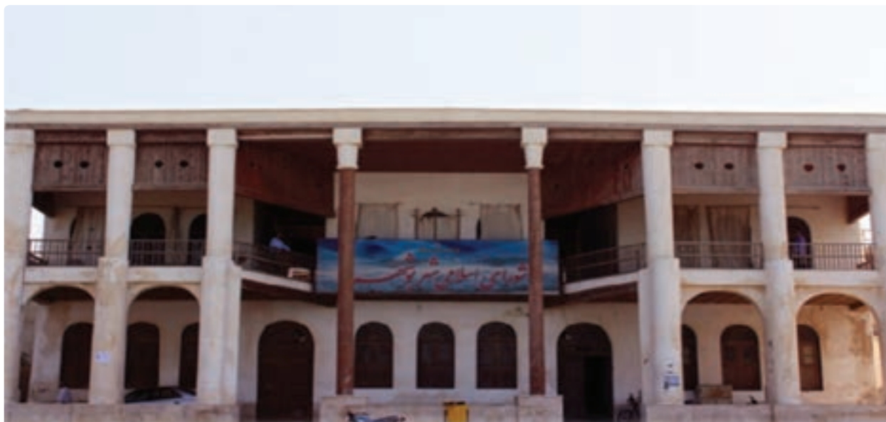
شکل ۱۳-۱۲- عمارت امیریه مربوط به دوره قاجار (شورای شهر کنونی) - بندر بوشهر