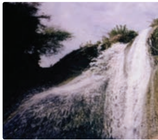
شکل ۱۲-۹- آبشار رود فاریاب - دشتستان