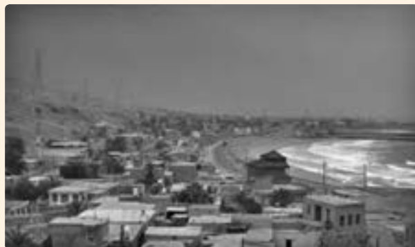
شکل ۱۷-۱۲- نمایی از بندر سیراف

این بندر عظیم در دو زلزله ای که در سال های ۳۶۷ و ۳۹۸ هجری رخ داد ویران شد و امروزه ویرانه های آن در کنار بندر کوچک سیراف (طاهری) مشاهده می شود.