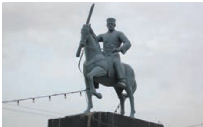
شکل ۱-۲- مجسمه شهید رئیس‌علی دلواری نماد مقاومت مردم بوشهر

جهانی اول در سال ۱۲۹۹ ه.ق/ ۱۲۵۹ ه.ش در قریه دلوار از توابع تنگستان ساحلی پا به عرصه حیات گذاشت. هنگامی که در