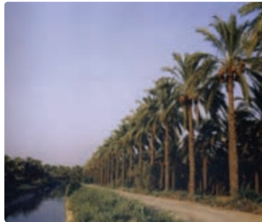
شکل ۱۲-۷- نخلستان های آبخس - دشتستان