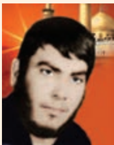
شکل ۱۴-۱۰- شهید خضر نامور

شهید خضر نامور فرزند حاج محمود، خواهرزاده شهید رئیس علی دلواری در سال ۱۳۴۱ خورشیدی متولد شد. در فاصله سال‌های ۱۳۶۰-۱۳۵۹ خورشیدی در مدرسه راهنمایی بوالخیر از توابع بخش دلواری در پست معلم امور تربیتی به کار مشغول شد. این شهید بزرگوار در تاریخ ۱۳۶۱/۱/۷ در عملیات غرورآفرین فتح‌المبین در منطقه شوش به شهادت رسید.