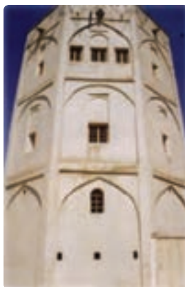
برج قلعه (قلعه محمدخان) خورموج - دشتی