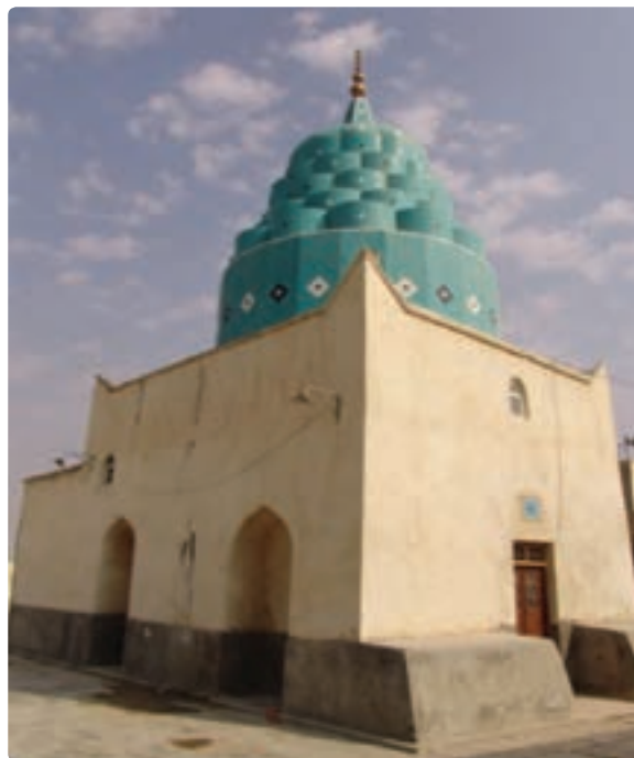
امام زاده سلیمان بن علی - گناوه

شکل ۱۹-۱۲- امامزاده‌ها اصلی‌ترین مکان‌های زیارتی استان