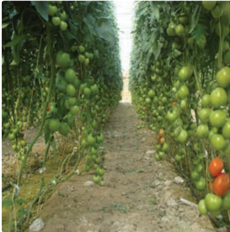
شکل ۲-۱۳- کشت گلخانه‌ای گوجه فرنگی

یکی از زمینه‌های جدید در بخش کشاورزی و استفاده بهینه از منابع آب و خاک، گسترش کشت گلخانه‌ای است. در سال‌های اخیر کشت گلخانه‌ای در استان گسترش یافته است.