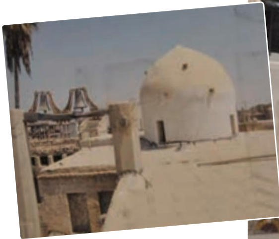
کلیسای آرامنه گریگوری بوشهر (تصاویر پس از بازسازی)