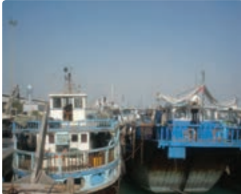
شناورهای سنتی (صیادی و تجاری)

میزان صید استان طی سال‌های ۱۳۷۹ تا ۱۳۸۴ کاهش چشمگیری یافته و از ۱۶ درصد کل کشور به ۱۱ درصد رسیده است. این در حالی است که سهم تعداد شناورها و تعداد صیادان استان به نسبت کل کشور بالاتر بوده و نشان از بهره‌وری پایین در استان است.