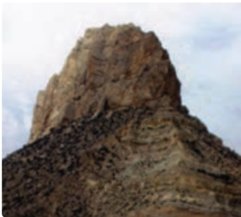
شکل ۱۲-۸- کوه پردیس - جم