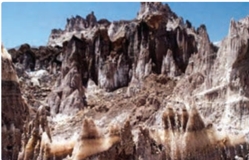
شکل ۴-۱۲- گنبد نمکی جاشک - شهرستان‌های (دیر - دشتی)

۲- کوه‌ها : بخش اعظم نواحی شمال شرقی و شرق استان را کوه‌های کم ارتفاع و بلند در بر گرفته که امکانات متنوعی برای فعالیت‌های گردشگری و علمی فراهم نموده است. از آن میان می‌توان به کوه «نمک» یا گنبد نمکی در جاشک (حد فاصل شهرستان دیر و دشتی) اشاره نمود که به‌عنوان یک پدیده کم‌نظیر و فوق‌العاده زیبا و حیرت‌انگیز از شاهکار طبیعت که در آن غارها و چشمه‌های نمکی و قندیل‌های زیبا به فراوانی به چشم می‌خورد به‌همین جهت همه ساله تعداد زیادی گردشگر برای دیدن این پدیده طبیعی به منطقه سفر می‌کنند.