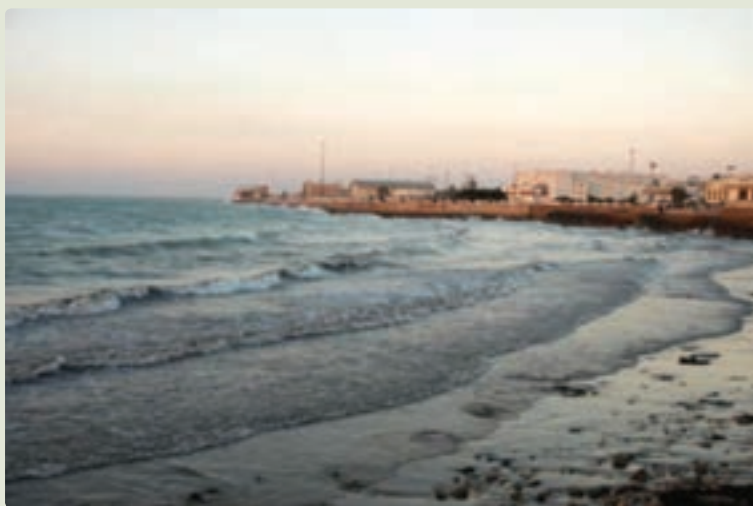
شکل ۳-۱۰- ساحل بوشهر

تاریخ جدید بوشهر، با پادشاهی نادر شاه افشار (۱۱۴۸-۱۱۶۰ ق/ ۱۷۳۶-۱۷۴۷ م) شروع می‌شود. نادر و سیاست دریایی او در مبارزه با عثمانی‌ها و گسترش قلمرو دریایی او در خلیج فارس سبب شد تا شهر بوشهر مورد توجه قرار گیرد. نادرشاه، بوشهر را که نام آن را به (بندر نادریه) تغییر داده بود، به صورت یک مرکز کشتی‌سازی و پادگان نظامی درآورد. با مرگ نادر، سپاه دریایی او میان حکام بوشهر و بندرعباس تقسیم شد. شیخ ناصر خان آل مذکور که ناخدا باشی کشتی‌های نادر بود، حکومت قدرتمندی با عنوان (خاندان آل مذکور) پدید آورد که صد سال بر بوشهر حکومت کردند. در دوران حاکمیت او و فرزندش شیخ نصر، بوشهر رو به عمران و آبادی گذاشت و روابط تجاری گسترده‌ای با انگلیسی‌ها و دیگر اروپائیان برقرار شد.