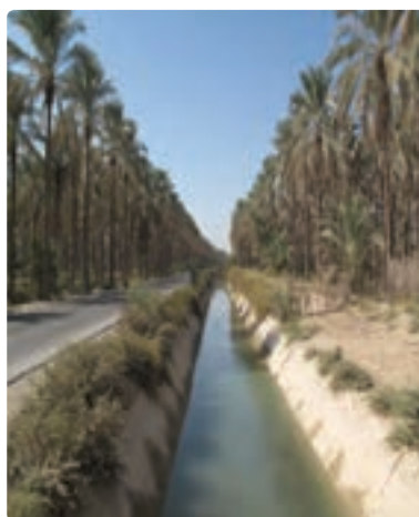
شکل ۳-۱۳- تصاویری از نخلستان‌های استان و برداشت محصول از آن