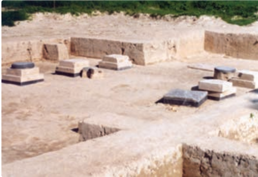
شکل ۲-۱۰- سرستون‌های کاخ کوروش در چرخاب برازجان

دوره اسلامی: یاقوت حموی، ابن خردادبه و بلاذری تصرف مناطقی چون توز، سینیز و راشهر را در کوره اردشیرخوره و شاپورخوره با اختلاف نظر بین سال‌های ۱۶ تا ۱۹ قمری ذکر کرده‌اند. بلاذری، تصرف ریشهر را به دست عثمان ابن ابی العاص در سال ۱۹ هـ. ق/۶۴۰ م ذکر می‌کند. سردار معروف ایرانی که در مقابل اعراب مسلمان مقاومت می‌کرد، شهرک نام داشت. برای تسخیر شهر، جنگ شدیدی در گرفت که شهرک و فرزندش به قتل رسیدند و ریشهر با تلفات زیادی تسلیم شد. بلاذری، این فتح را در دشواری و کثرت غنایمی که به دست مسلمانان افتاد، با فتح قادسیه مقایسه کرده است.