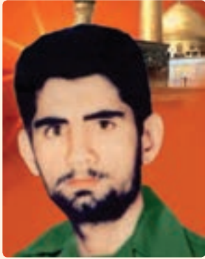
شکل ۲۰-۱۰- شهید غلامحسن توسلی