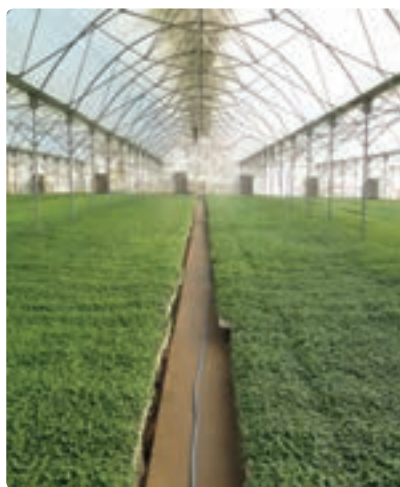
تولید نهال گلخانه‌ای