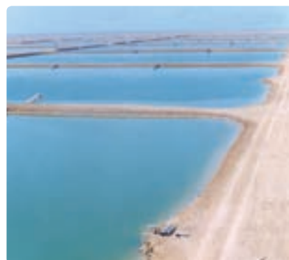
شکل ۶-۱۳- پرورش آبزیان در استان