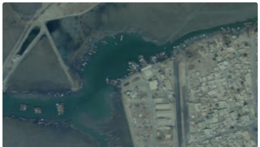
شکل ۱۶-۱۳- تصویر ماهواره ای از اسکله بندر دیلم