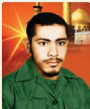
شکل ۱۸-۱۰- شهید مجید مبارکی