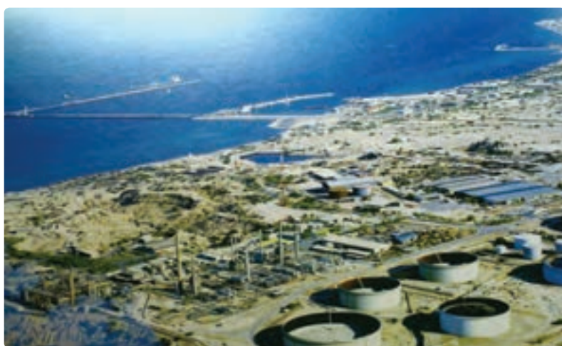
شکل ۱۰-۱۳- جزیره خارک