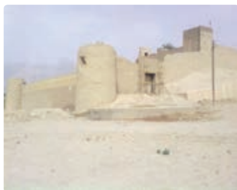
قلعه زایر خضرخان تنگستان - اهرم