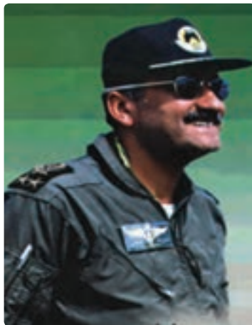
شکل ۱۰-۱- سرلشکر خلبان شهید سید علی‌رضا یاسینی

در تاریخ ۳۱ شهریورماه ۱۳۵۹ رژیم بعثی عراق به طور هماهنگ فرودگاه‌های مهم کشور را مورد تجاوز هوایی قرار داد که فرودگاه بوشهر نیز مقارن ساعت ۱۴ مورد حمله قرار گرفت و خساراتی به باند فرودگاه و منازل مسکونی مردم وارد آمد. مردم استان بوشهر از کوچک و بزرگ با تشکیل هسته‌های خودجوش و ایجاد سنگر در سواحل خلیج فارس آمادگی خود را برای دفاع از کشور به نمایش گذاشتند.