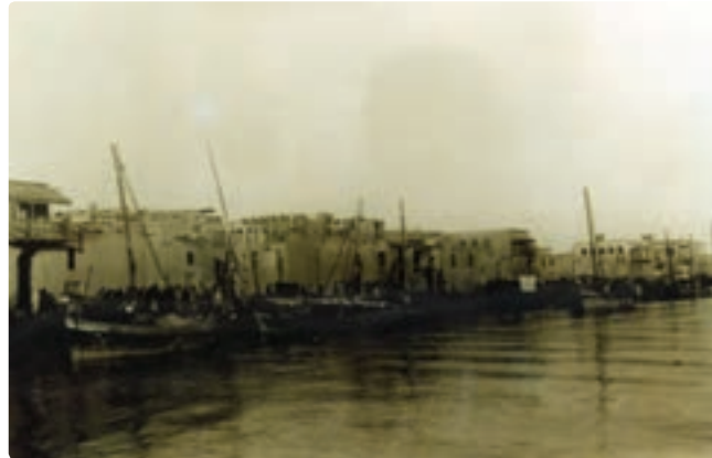
شکل ۱۱-۱۰ ساحل بوشهر

درباره مناطق تاریخی سیراف، سینیز، مهروبان، جتّابه، توز و پشت پر تحقیق و در کلاس گزارش نمایید.