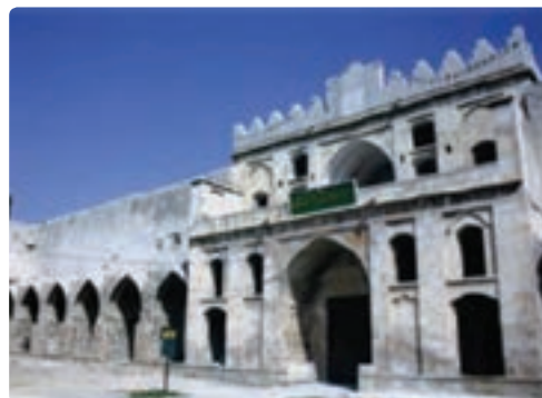
دژ، کاروان سرای مشیر الملک - برازجان