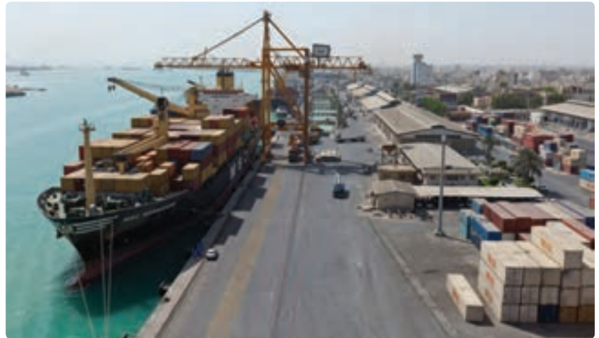
شکل ۱۴-۱۳- اسکله صادراتی بندر بوشهر