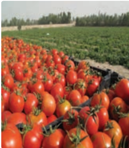
برداشت گوجه فرنگی از مزارع

از کل مساحت دشت‌ها و جلگه‌های استان که ۱/۸ میلیون هکتار است ۱۷ درصد به کشت انواع محصولات کشاورزی اختصاص یافته است. تأمین سرمایه کافی و آموزش‌های لازم و بهبود شیوه‌های بهره‌برداری از آب و خاک، می‌تواند سطح زیر کشت استان را افزایش دهد.