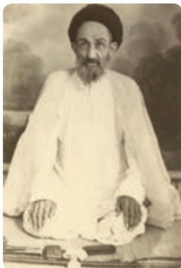
شکل ۱-۱- آیت‌الله سیدعبدالله مجتهد بلادی بوشهری

استان بوشهر در کنار آب‌های نیلگون خلیج فارس یکی از مراکز قدیمی تمدن ایران زمین است که در عرصه‌های گوناگون علمی، فرهنگی و مذهبی افتخارآفرین بوده است. در کنار مشاهیر و مفاخر ایران زمین، بوشهر هم مفتخر به بزرگانی است که در حیطه کاری، زندگی و آسایش خود را وقف بهتر زیستن هموعان کرده‌اند و در این راستا منشأ تحولات عمیق علمی، فرهنگی و مذهبی شده‌اند.