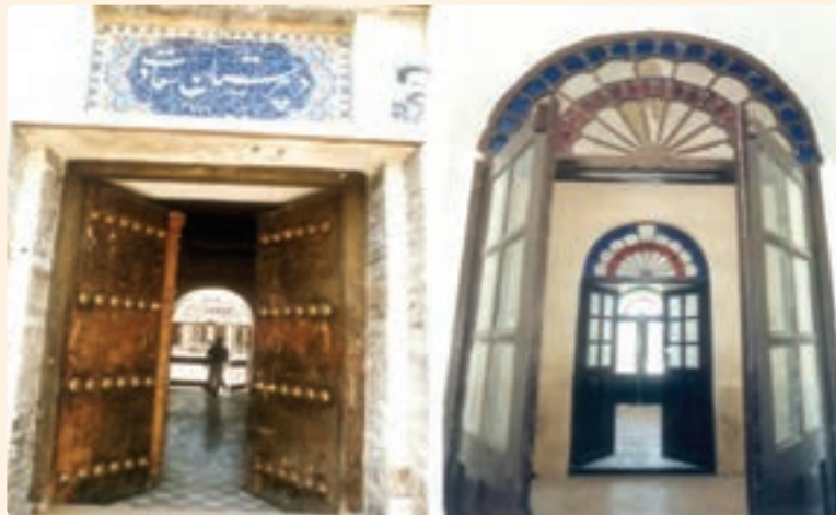
شکل ۲۱-۱۰- مدرسه سعادت بوشهر (تأسیس ۱۳۱۷ قمری)

مدرسه سعادت مظفری در سال ۱۳۱۷ ه.ق/۱۲۷۸ ه.ش در بندر بوشهر تأسیس شد. این مدرسه یکی از جدیدترین مؤسسات آموزشی ایران است که معلمان و شاگردان آن در سال‌های بعد در اهواز، خرمشهر، بندرعباس، بندر لنگه، آبادان، نجف اشرف و بحرین مدارس جدیدی ایجاد کردند و به همین دلیل به مادر مدارس جنوب ایران مشهور است.