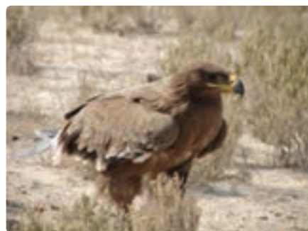
شکل ۱۱-۱۲- پوشش گیاهی و زندگی جانوری مناطق حفاظت شده مُند و خاییز