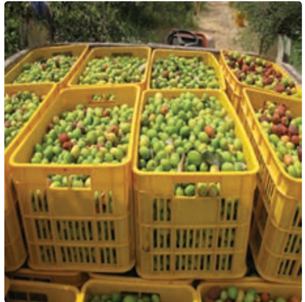
شکل ۴-۱۳- کنار پیوندی از محصولات صادراتی بخش کشاورزی استان بوشهر