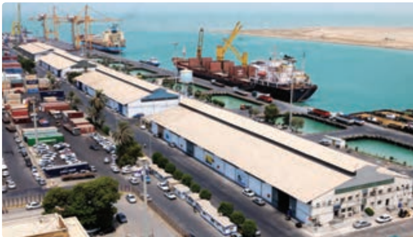
شکل ۱۵-۱۳- گمرک بندر بوشهر