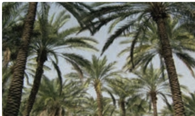
شکل ۵-۱۲- نخلستان‌های استان بوشهر (تنگستان)

۳- نخلستان‌ها : گرچه نخلستان‌ها یک پدیده کاملاً طبیعی نیستند، اما وجود نزدیک ۱۰ میلیون اصله درخت خرما و استقرار آنها در مسیر رودها و جاده‌ها مناظر فوق‌العاده زیبا و دیدنی را به وجود آورده است که نظیر آن از نظر تراکم و نحوه استقرارشان در هیچ جای ایران نمی‌توان مشاهده کرد، بیشتر این نخلستان‌ها در شهرستان دشتستان، تنگستان، جم و دشتی قرار دارد و به همین جهت استان بوشهر را سرزمین نخل و دریا می‌نامند.