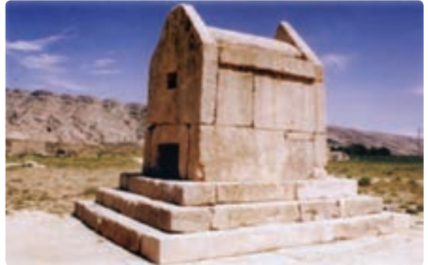
شکل ۱۴-۱۲- گور دختر مربوط به دوره هخامنشیان - دشتستان