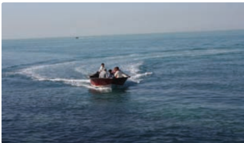
شکل ۲-۱۲ - قایقرانی یکی از جاذبه‌های ساحلی استان

در اختیار دارد، چنان‌که سواحل بندر بوشهر، گناوه، دیلم، ریگ، ماسه‌ای، سواحل سیراف (طاهری)، نای‌بند، عسلویه، صخره‌ای و سواحل جزیره خارک مرجانی از زیبایی خیره‌کننده برخوردارند. این سواحل در نیمه دوم سال با توجه به شرایط آب و هوایی مناسب از ظرفیت بالایی برای ورزش‌های آبی برخوردار است که می‌تواند پذیرای گردشگران زیادی باشد.