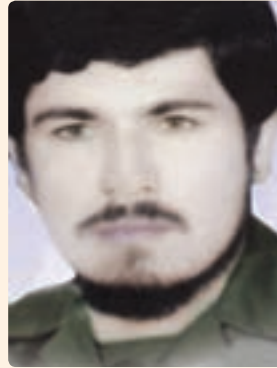
شکل ۱۹-۱۰- شهید نصرالله شفیعی