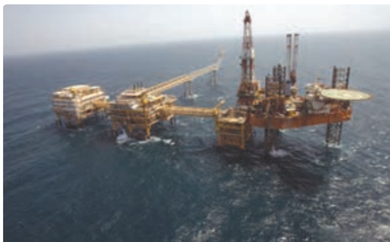
شکل ۱۱-۱۳- سکوه‌های نفتی فراساحلی (دریایی)