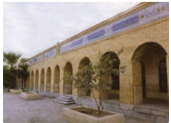
مدرسه سعادت بوشهر مربوط به دوره قاجار