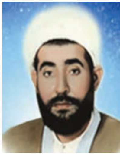
شکل ۵-۱- شهید ابوتراب عاشوری