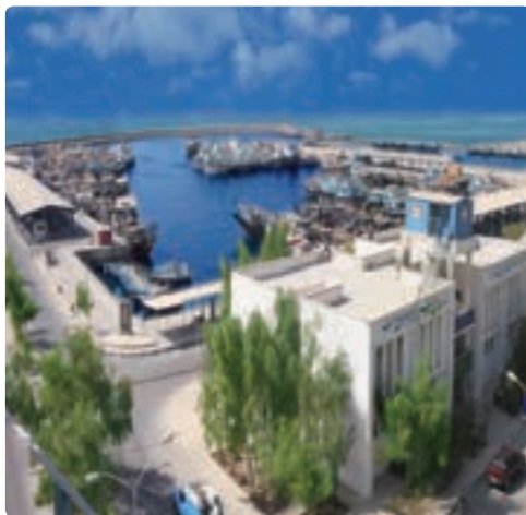
بندر صیادی دیر