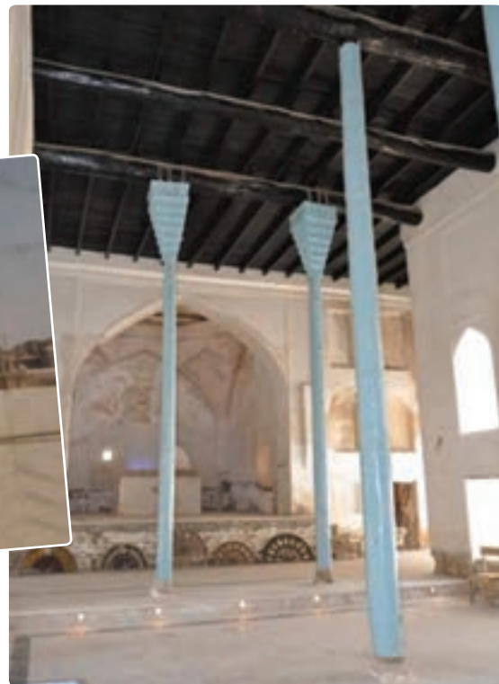
شکل ۲۰-۱۲- تصاویری از بناهای تاریخی فرهنگی استان

موزه‌ها: موزه شهید رئیس علی دلواری (در دلوار تنگستان) که آثار ارزنده‌ای از مبارزات ضد استعماری شهید رئیس علی دلواری و مردم استان بوشهر را به نمایش گذاشته است، موزه مردم‌شناسی، موزه دریانوردی ایران که در نوع خود کم نظیر است و موزه علمی و تاریخی مدرسه سعادت در بوشهر، همه ساله عده زیادی از گردشگران داخلی و خارجی را به خود جلب می کنند.