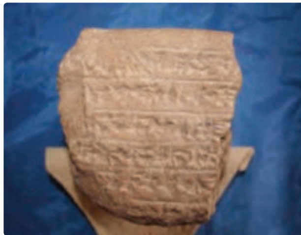
شکل ۱-۱۰ - خشت نبشته ایلامی (لیان)

بوشهر، از قدیمی‌ترین ایام تاکنون نام‌های گوناگون داشته است. در دوره ایلامی، آن را لیان می‌نامیدند. در زمان اردوکشی نئارخوس (نئارک) - دریاسالار اسکندر مقدونی - مسامبریا (Mesamberia)، و در روزگار حکمرانی سلوکیان بر ایران، انطاکیه پارس خوانده می‌شد. در منابع عصر ساسانی آن را بخت اردشیر و ریواردشیر Rivardshir می‌نامیدند. در دوره اسلامی نام آن به صورت ریشهر، راشهر، زبصهر، راکسل Raxel، بندر نادریه، ابوشهر و سرانجام بوشهر آمده است. گمان می‌رود یاقوت حموی، نخستین کسی باشد که از بوشهر قدیم نام برده است. برخی از صاحب‌نظران معتقدند که «بوشهر» دگرگون شده نام قدیم این شهر در دوره ساسانی «ریواردشیر» می‌باشد.