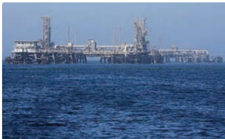
شکل ۹-۱۳- حوزه نفتی فلات قاره