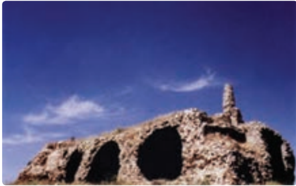
شکل ۱۵-۱۲- کوشک اردشیر مربوط به دوره ساسانی - دشتستان