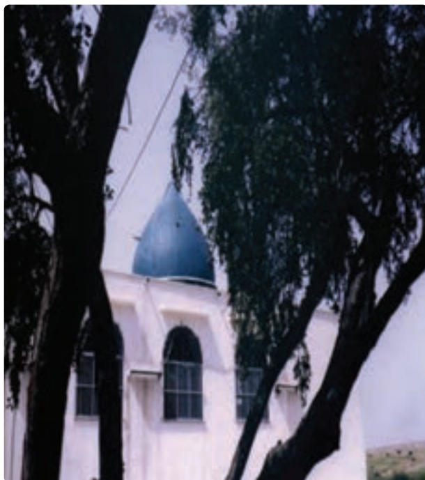
امام زاده شاهزاده ابراهیم - دشتستان