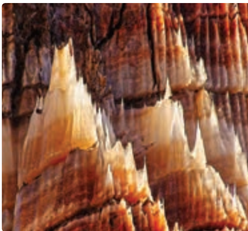
شکل ۱۲-۱۰- قندیل های گنبد نمکی جاشک (دیتر- دشتی)