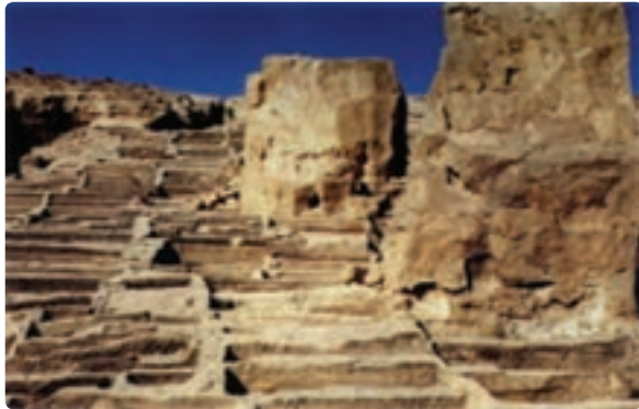
شکل ۱۶-۱۲- خرابه‌های بندر باستانی سیراف مربوط به دوره ساسانی - سیراف، شهرستان کنگان