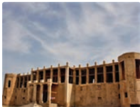
عمارت تاریخی «میلک» «میلک» التجار بوشهری - بوشهر