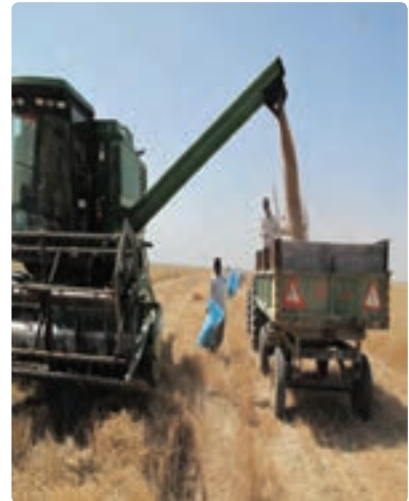
کشت و برداشت مکانیزه