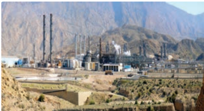
شکل ۱۲-۱۳- تأسیسات گازی پارس جنوبی