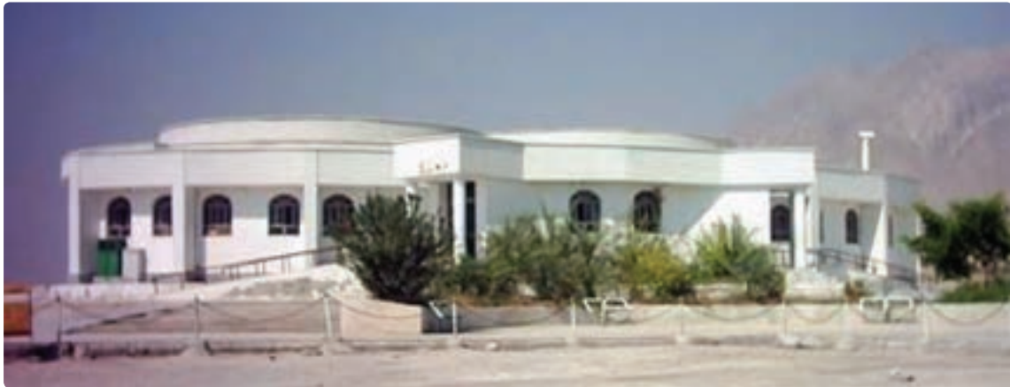
شکل ۱۲-۶- چشمه های آبگرم اهرم - تنگستان