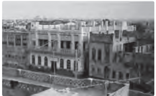
شکل ۴-۱- بافت قدیم بوشهر