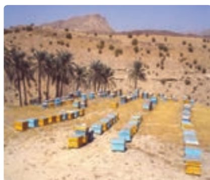
شکل ۷-۱۳- پرورش زنبور در استان

د) دامداری و دامپروری: دامداری در کنار زراعت و باغداری به عنوان حرفه‌ای اصلی یا تکمیلی در تمام طول تاریخ در روستاهای استان متداول بوده است. ضعف روزافزون مراتع استان، دامداری سنتی را با مشکل روبه‌رو کرده است. نیازهای پروتئینی استان از طریق توسعه دامپروری صنعتی فراهم شده است.