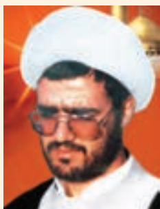
شکل ۱۵-۱۰- شهید صادق گنجی

شهید خضر نامور فرزند حاج محمود، خواهرزاده شهید رئیس علی دلواری در سال ۱۳۴۱ خورشیدی متولد شد. در فاصله سال‌های ۱۳۶۰-۱۳۵۹ خورشیدی در مدرسه راهنمایی بوالخیر از توابع بخش دلواری در پست معلم امور تربیتی به کار مشغول شد. این شهید بزرگوار در تاریخ ۱۳۶۱/۱/۷ در عملیات غرورآفرین فتح‌المبین در منطقه شوش به شهادت رسید.