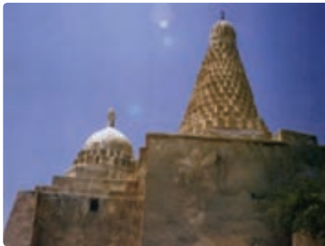
امام زاده محمد حنیفه - جزیره خارک