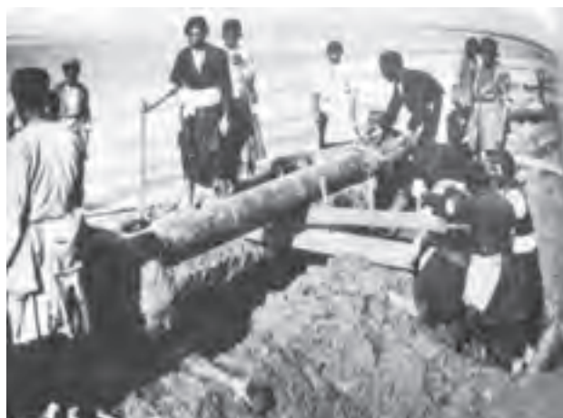
تصویر ۲۲-۱۰. بختیاری‌ها و نفت

از این پس خوانین بختیاری، موفق به دستیابی به مقامات و مناصب مهم دولتی و موقعیت‌های مناسب اجتماعی و اقتصادی شدند. حضور کمپانی «لینچ» در منطقه و قرارداد خوانین بختیاری با آنان برای احداث جاده‌ای کاروان رو که خوزستان را به اصفهان متصل می‌کرد؛ و نیز قرارداد انگلیسی‌ها در مورد نفت جنوب با خوانین بختیاری شرایط و موقعیت‌های مناسبی برای آنان فراهم آورد. کاخ قلعه‌های زیادی از این دوره در مناطق مختلف چهارمحال و بختیاری متعلق به خوانین بر جای مانده است.