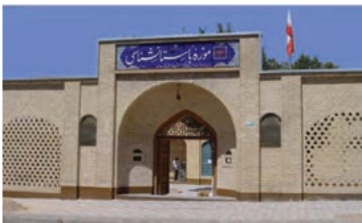
تصویر ۱-۱۰ موزه باستان‌شناسی شهرکرد

آیا می‌دانید استان چهارمحال و بختیاری، مانند دیگر نقاط کشور ما ایران دارای پیشینه غنی تمدنی و فرهنگی است؟ فکر می‌کنید پیشینه تاریخ و تمدن در استان به چه زمانی باز می‌گردد؟ شما در این درس با برخی از جنبه‌ها و آثار تاریخی و فرهنگی و میراث‌های ماندگار استان خود آشنا می‌شوید.