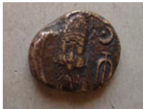
تصویر ۵-۱۰- سکه دوره الیمایی

احتمال می‌رود هم زمان با دولت سلوکیان، حکومت محلی «الیمایی» در بخش‌هایی از مناطق غربی منطقه با مرکزیت شهر ایزده تشکیل شده باشد. الیمایی‌ها با استفاده از نبود یک حکومت مرکزی مقتدر پس از سقوط هخامنشیان و نیز شیوه حکومت ملوک الطوائفی اشکانیان، بر قدرت خود افزودند؛ به‌طوری که نواحی جنوب خوزستان تا خلیج فارس را به اشغال خود در آورده و مستقلاً به ضرب سکه پرداختند. اگر چه با تشکیل دولت ساسانی به قدرت حکمرانان الیمایی پایان داده شد. نفوذ سیاسی - اجتماعی، تمدنی و فرهنگی ساسانیان در استان به قدری زیاد بوده که علاوه بر بقایای جاده‌ها و پل‌ها، تعداد زیادی اشیاء تاریخی از جمله سکه و مهر از این دوره بر جای مانده است. بردگوری‌ها نیز از دیرین آثار سنگی استان در دوران قبل از اسلام می‌باشند که در مناطق مختلف پراکنده‌اند.