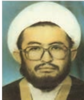
حجت الاسلام شهدید عیسی توسلی