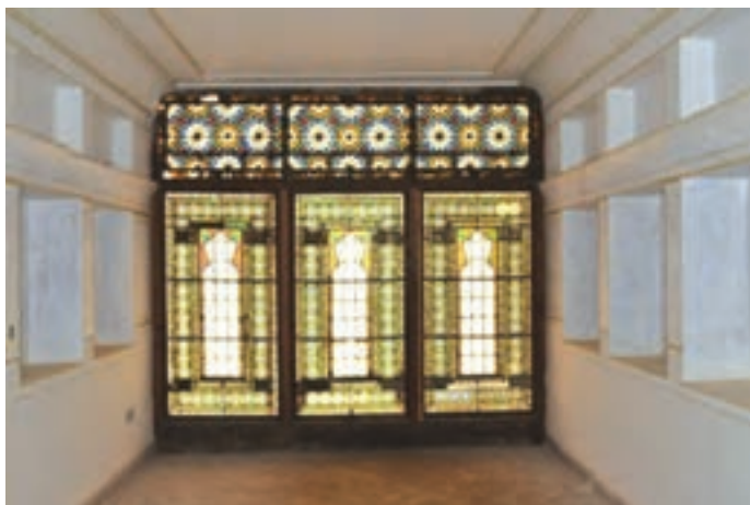
تصاویر ۱۶-۱۰- خانه آزاده چالستر