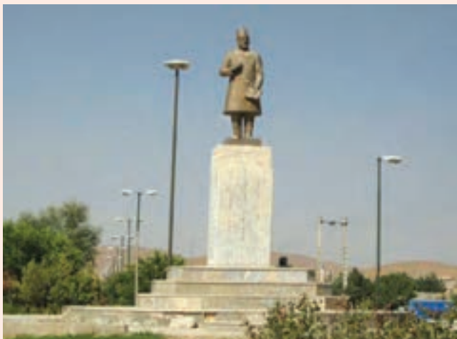
تصویر ۲۹-۱۰- تندیس یادبود میرزا حبیب دستان بنی در شهر بن

سال در تهران به فراگیری ادبیات و فقه و اصول پرداخت. او مدت کوتاهی بعد ناچار عازم استانبول در امپراتوری عثمانی آن روزگار شد و در مکاتب و مدارس مختلف به تحصیل و تدریس مشغول و مدتی از اعضای انجمن معارف آنجا بود. وی در استانبول با آزاد مردانی که برای بیداری ایرانیان کوشش می نمودند، همکاری می کرد. دستان در سال ۱۳۱۵ هـ. ق. در شهر بورسای عثمانی از دنیا رفت و در همان جا به خاک سپرده شد. از آثار این ادیب دانشمند و خوش