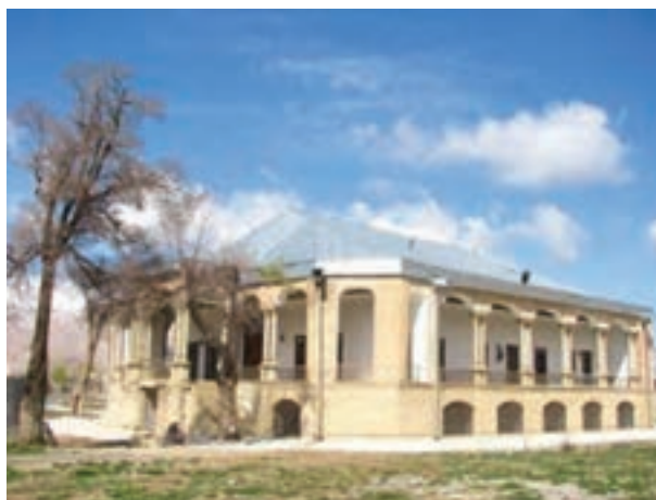
تصویر ۲۱-۱۰. قلعه سردار اسعد در جونقان