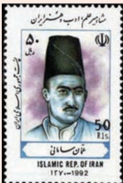
تصویر ۲۶-۱- تمیر یادبود میرزا نورالله عثمان سامانی

عثمان، شاعر شیعی سرود و عارف شهیر ایران در عصر قاجار، در سال ۱۲۵۸ ه.ق. در خانواده‌ای اهل شعر و ادب در قریه - شهر - سامان به دنیا آمد و پس از گذراندن دوره مقدماتی در چهارمحال، برای تکمیل علم و دانش عازم اصفهان گردید و علوم رایج در آن زمان چون فقه، اصول و منطق، حکمت، کلام و ادبیات عرب را نزد علما و اساتید برجسته آن زمان فرا گرفت. عثمان که به محافل و مجالس شعر و ادب اصفهان راه یافته بود پس از مدّت کوتاهی به شاعری توانا - به‌ویژه در شعر عاشورایی - تبدیل گردید. این شاعر و عارف برجسته در سال ۱۳۲۲ ه.ق. در زادگاهش سامان بدرود حیات گفته و بنابر وصیتش او را در نجف اشرف نزدیک قبر هود(ع) و صالح(ع) به خاک سپردند. از جمله مشهورترین آثار او به دیوان اشعار، منظومه گنجینه الاسرار، معراج نامه و تذکره مخزن الدرر می‌توان اشاره کرد.