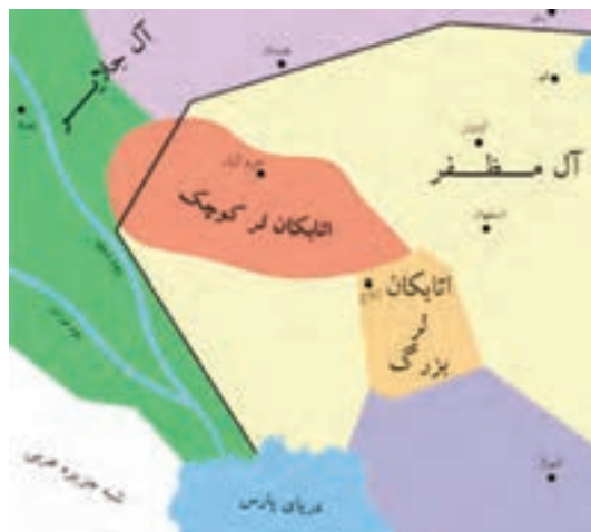
تصویر ۱۲-۱۰ محدوده حکومتی اتابکان لُر

استان در دوران صفویه: در دوره صفویه استان چهارمحال و بختیاری به دلیل نزدیکی به شهر اصفهان – پایتخت صفویان – نقش مهم ایلات و عشایر، وجود چراگاه ها و مراتع غنی و سرسبز، مورد توجه پادشاهان صفوی قرار گرفت. اولین بار در دوره صفویه بود که منطقه ای که قبلاً به نام «لُر بزرگ» خوانده می شد کم کم به «بختیاری» معروف گشت. از زمان شاه تهماسب با توجه به تلاش های وی برای انتقال آب کارون به زاینده رود، منطقه مورد توجه بیشتری قرار گرفت.