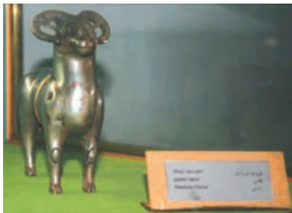
تصویر ۹-۱۰- مجسمه بازمانده از دوره ساسانی

احتمال می‌رود هم زمان با دولت سلوکیان، حکومت محلی «الیمایی» در بخش‌هایی از مناطق غربی منطقه با مرکزیت شهر ایزده تشکیل شده باشد. الیمایی‌ها با استفاده از نبود یک حکومت مرکزی مقتدر پس از سقوط هخامنشیان و نیز شیوه حکومت ملوک الطوائفی اشکانیان، بر قدرت خود افزودند؛ به‌طوری که نواحی جنوب خوزستان تا خلیج فارس را به اشغال خود در آورده و مستقلاً به ضرب سکه پرداختند. اگر چه با تشکیل دولت ساسانی به قدرت حکمرانان الیمایی پایان داده شد. نفوذ سیاسی - اجتماعی، تمدنی و فرهنگی ساسانیان در استان به قدری زیاد بوده که علاوه بر بقایای جاده‌ها و پل‌ها، تعداد زیادی اشیاء تاریخی از جمله سکه و مهر از این دوره بر جای مانده است. بردگوری‌ها نیز از دیرین آثار سنگی استان در دوران قبل از اسلام می‌باشند که در مناطق مختلف پراکنده‌اند.