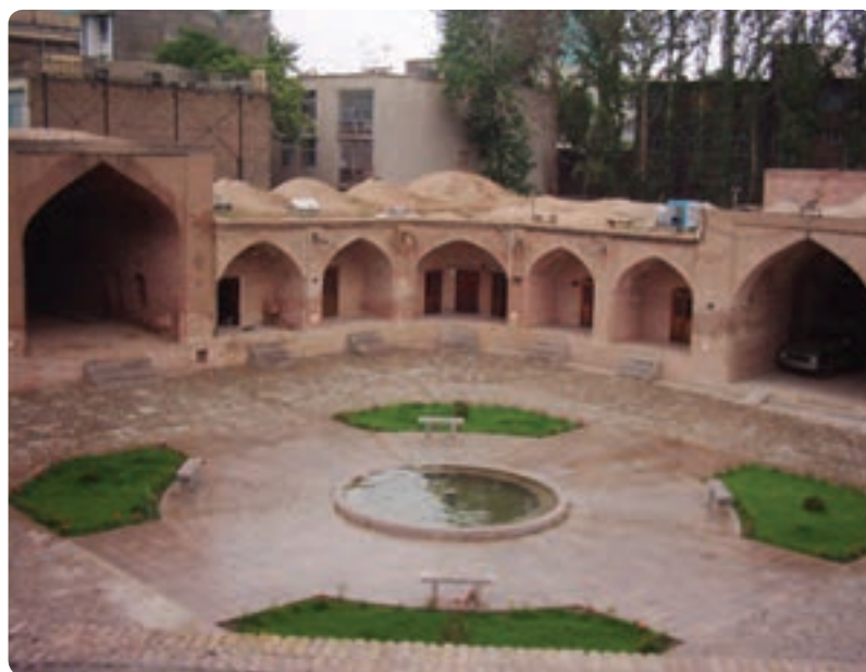
شکل ۵-۱۰- کاروان‌سرای شاه‌عباسی کرج