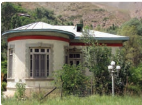
شکل ۹-۱۰ کاخ‌های دوره پهلوی