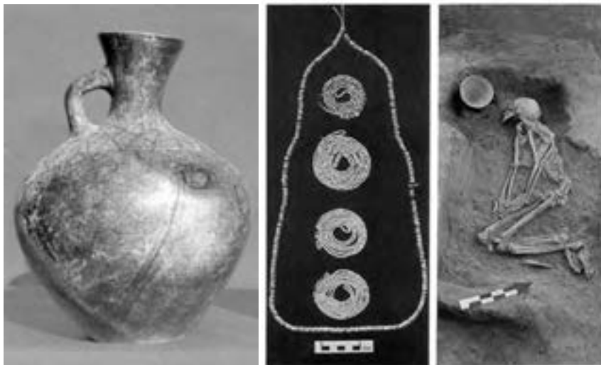
شکل ۱-۱۰ تعدادی از آثار کشف شده از محوطه ازبکی

محوطه ازبکی: این محوطه در غرب شهر نظرآباد واقع شده که آثار به دست آمده از آن مربوط به هزاره هفتم قبل از میلاد است. این محوطه شامل مجموعه‌ای از تپه‌های باستانی است که در حال حاضر شش تپه از آن به نام‌های یان تپه، جیران تپه، دوشان تپه، مارال تپه، گوموش تپه و تپه اصلی ازبکی است. تپه