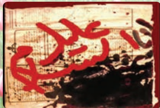
(ب) تصویر بازسازی شده