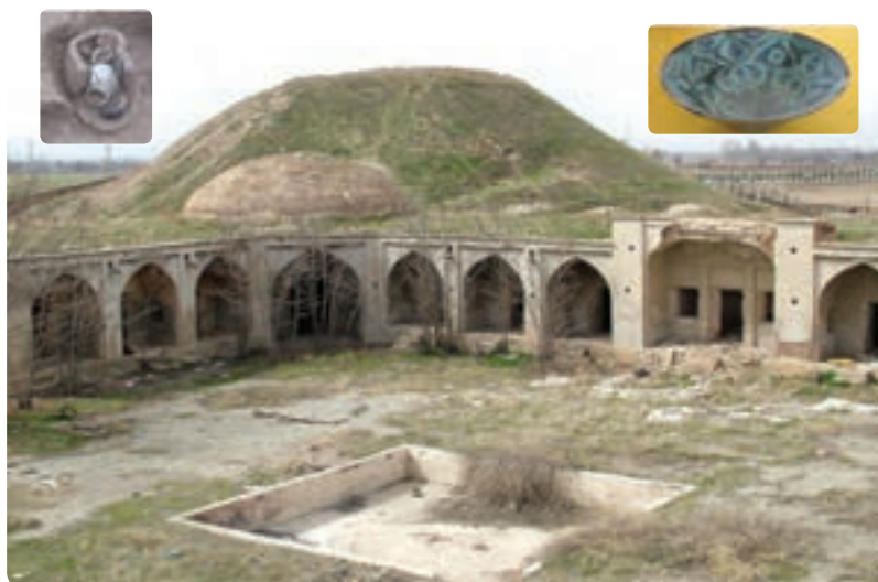
شکل ۴-۱۰- کاروان‌سرا و تپه ینگی امام ساوجبلاغ و آثار کشف شده از آن

استان در دوران صفویه : در دوره صفویه محدوده استان البرز به دلیل نزدیکی به شهر قزوین که پایتخت صفویه بود، مورد توجه قرار گرفت و صفویان اقدام به مرمت بنای امامزاده‌ها، احداث بناها، پل‌ها و کاروان‌سراها کردند؛ از آن جمله می‌توان به کاروان‌سرای شاه عباسی کرج و ینگی امام، پل‌های کرج و برغان و بناهای مذهبی چون، امامزاده سلیمان اشتهاارد و حسینیه اعظم برغان اشاره کرد. در این دوره شاهان صفویه از مناطق طالقان، ساوجبلاغ و شمال کرج به عنوان مناطق بیلاقی استفاده می‌کردند. با انتقال پایتخت از قزوین به اصفهان در زمان شاه عباس طرح‌های عمرانی منطقه متوقف شد.