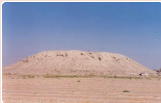
شکل ۲-۱۰- تپه مردآباد

محوطه باستانی آق تپه : این تپه در اراضی جنوب مهرشهر در محله‌ای به همین نام واقع شده است. آثار به دست آمده از این تپه مربوط به هزاره چهارم و سوم قبل از میلاد است همانند تپه مردآباد که آثار چهار دوره تاریخی در آن مشاهده می‌شود.