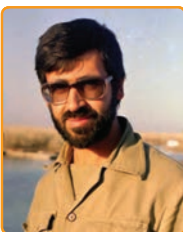
سردار شهید سیدحسین میررضی فرمانده عملیات لشکر ده حضرت سیدالشهداء (ع)