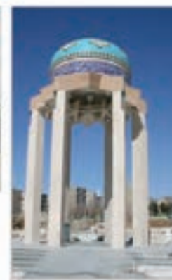
دانشگاه آزاد اسلامی کرج