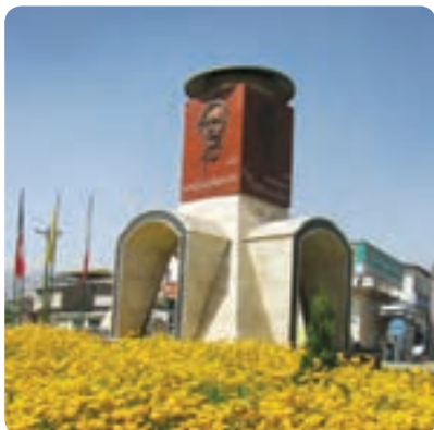
یادمان جلال آل‌احمد

آیت‌الله شیخ محمدتقی برغانی (شهید ثالث) : از فقیهان نامدار قرن سیزدهم هجری قمری بود که در دوره قاجار با فرقه‌های انحرافی مبارزه علمی و فرهنگی کرد. او در سال ۱۲۶۳ قمری هنگام نماز در محراب مسجد به شهادت رسید و در میان شیعیان به شهید ثالث معروف شد. کتاب فقهی منهج الاجتهاد در ۲۴ جلد اثر ماندگار اوست. جلال آل احمد : در ۱۱ آذر ۱۳۰۲ در خانواده‌ای مذهبی — روحانی به دنیا آمد. وی پسرعموی آیت‌الله طالقانی بود. پس از اخذ دیپلم وارد دانش‌سرای عالی تهران شد و در رشته ادبیات فارسی به تحصیل پرداخت. دو اثر تحلیلی معروف جلال آل احمد «غرب‌زدگی» و «خدمت و خیانت روشنفکران» تأثیر فراوانی در جامعه معاصر ایران به‌ویژه انقلاب اسلامی داشته است.