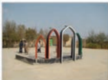
امامزاده سلیمان اشتهارد