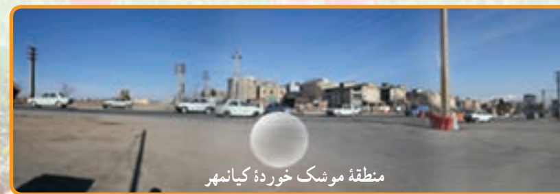
منطقه موشک خورده کیانمهر

شکل ۱۱-۲ مناطق موشک خورده کرج در دوران دفاع مقدس