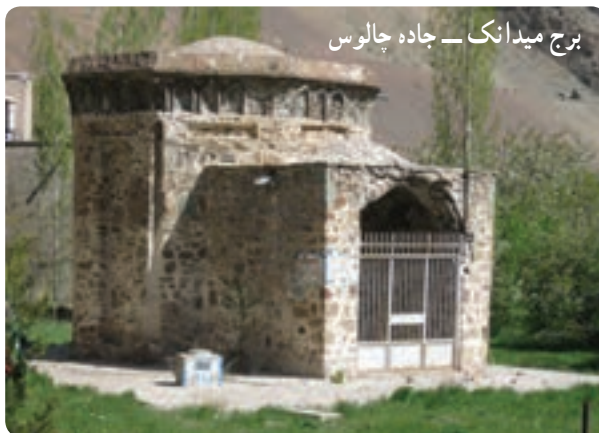
برج میدانک — جاده جالوس

هرچند در مورد گذشته استان یک نوع گسست تاریخی وجود دارد و نمی‌توان سیر مشخصی برای وقایع و تاریخ آن بیان کرد، اما بررسی آثار و بناهای تاریخی و اسلامی حکایت از تاریخ پرفراز و نشیب این سرزمین دارد؛ چرا که موقعیت گذرگاهی منطقه سبب شده است در طول دوره‌های بعد از اسلام تحت تأثیر لشکرکشی‌ها و تاخت و تازها قرار گیرد. نگاهی به محوطه‌های باستانی، بناهای تاریخی و امامزاده‌های مربوط به دوره‌های اسلامی نشان می‌دهد که تحولات این منطقه، از تاریخ سرزمین ایران به ویژه بخش‌های مرکزی جدا نبوده بلکه به شدت از آن تأثیر پذیرفته است. در کنار این عوامل، قرارگیری منطقه در حد فاصل شهرهای ری، قزوین و همدان موجب می‌شد که هیچ‌گاه حکومت مقتدر مرکزی در این منطقه شکل نگیرد و تنها به عنوان دروازه ورودی این شهرها تلقی گردد. آثار زیادی از دوره‌های سلجوقی، مغولی و تیموری در این سرزمین وجود دارد که از مهم‌ترین آن‌ها می‌توان به برج سلجوقی کردان، امامزاده زید و رحمان اشتهارد، برج میدانک و امامزاده چهل دختران نجم آباد اشاره کرد.