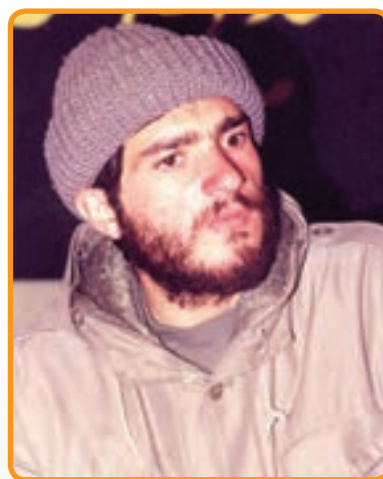
سردار شهید حمیدرضا گلکار فرمانده تیپ حبیب ابن مظاهر