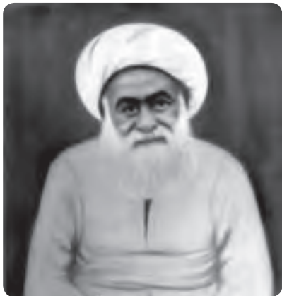
آیت‌الله شیخ هادی نجم‌آبادی

آیت‌الله سید محمود طالقانی : اولین امام جمعه تهران در سال ۱۲۸۹ هجری شمسی در خانواده‌ای اهل علم و در روستای گلیرد طالقان دیده به جهان گشود. پس از گذراندن دوره مقدماتی در زادگاهش، در مدارس رضویه و فیضیه قم تحصیل را تا درجه اجتهاد ادامه داد. طالقانی یکی از مخالفان فعال رژیم ستم‌شاهی بود و چندین بار دستگیر و روانه زندان شد. اولین مخالفت او با رژیم پهلوی مخالفت علنی با رویداد کشف حجاب بود که در پی آن دستگیر و زندانی شد و پس از آزادی با تشکیل گروه‌های سیاسی، مبارزه با رژیم را به طور رسمی آغاز کرد. با پیروزی انقلاب آیت‌الله طالقانی، ولایت‌مداری را سرلوحه امور خود قرار داد و حضرت امام او را ابوذر زمان نامید. سرانجام در سحرگاه ۱۹ شهریور ۱۳۵۸ این عالم مجاهد پس از سال‌ها فعالیت علمی مبارزات سیاسی در اثر سکته قلبی دار فانی را وداع گفت و به دیدار معبود شتافت.