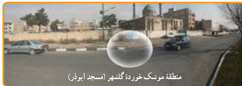
منطقه موشک خورده گلشهر (مسجد ابوذر)