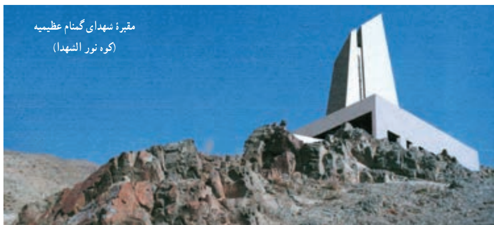
مقبره شهدای گمنام عظیمیه (کوه نور الشهداء)

در چهارده نقطه از شهرهای استان پیکر پاک ۶۴ شهید گمنام دفن شده که بنای یادبودی در این نقاط ایجاد شده است.