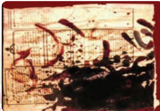
(الف) تصویر اصلی