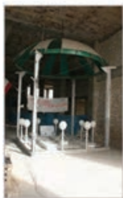
مسجد جمعه محمدشهر