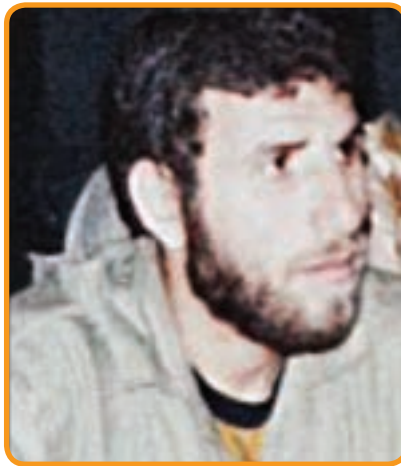
سردار شهید جمشید اصل دهقان