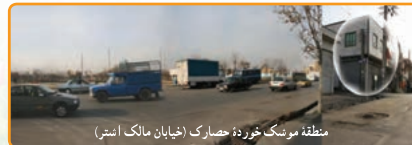
منطقه موشک خورده حصارک (خیابان مالک اشتر)