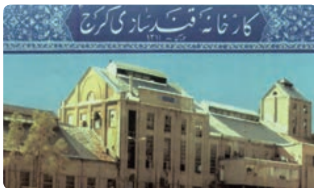
شکل ۸-۱۰ کارخانه قند کرج از اولین واحدهای صنعتی استان

مجموعه این تحولات موجب شد در مدت کوتاهی کرج با جذب مهاجرانی از سراسر کشور به دومین شهر پرجمعیت استان تهران تبدیل شود و سرانجام در سال ۱۳۸۹ به عنوان مرکز استان البرز انتخاب شد.