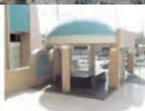
هیئت انصارالامام رزمندگان کرج