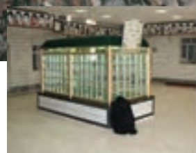
مسجد جامع المهدی کرج