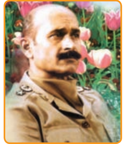
سردار شهید تیمسار ولی... فلاحی