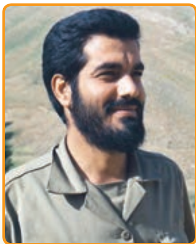
سردار شهید احمد آجرلو فرمانده سپاه کرج