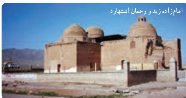
امامزاده زید و رحمان اشتهارد