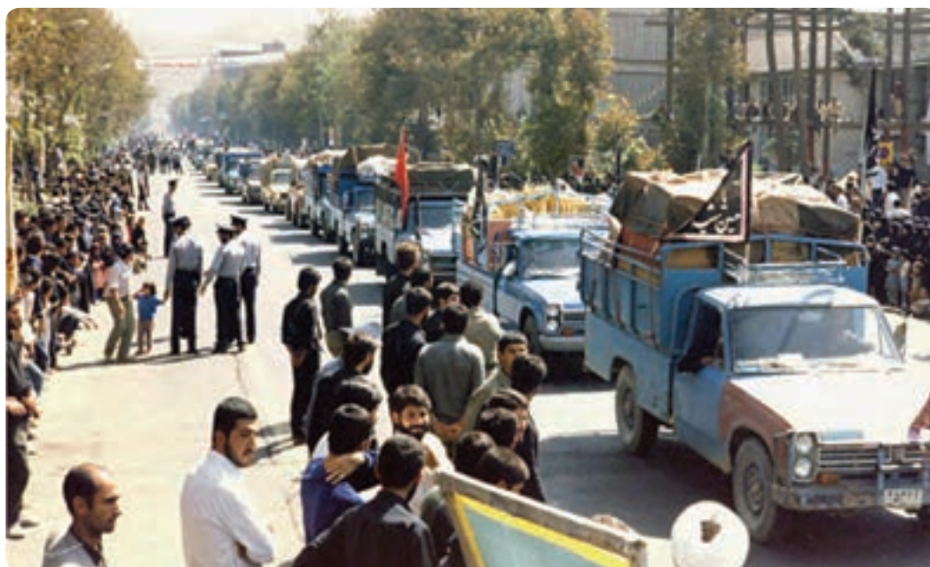
شکل ۱۱-۱- ارسال کمک‌های مردمی و اعزام رزمندگان به جبهه