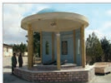
میدان صبحگاه لشکر عملیاتی حضرت سیدالشهداء (ع)