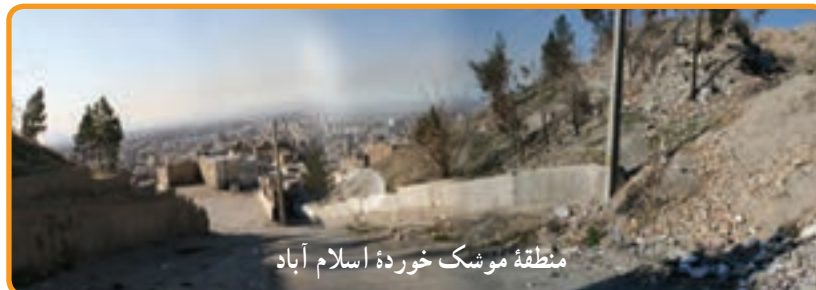
منطقه موشک خورده اسلام آباد

حمله موشکی عراق به شهرها : هنگامی که مقاومت و پیروزی رزمندگان اسلام در جبهه‌های جنگ نیروهای بعثی عراق را زمین گیر کرد، ارتش بعثی عراق به دستور صدام برای شکستن مقاومت رزمندگان حمله موشکی به شهرهای بی دفاع را در اواخر سال ۱۳۶۶ آغاز کرد. در این عملیات ناجوانمردانه شهر کرج نیز چهار بار مورد حمله موشکی قرار گرفت که در این حملات ۱۱۷ تن از هموطنان شهید و تعداد زیادی مجروح شدند.