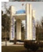
یادمان شهدای نظرآباد