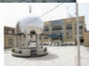
مسجد علی ابن ابی طالب شاهین ویلا