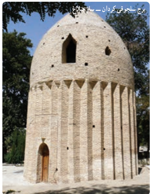
برج سلجوقی کردان — ساه جبالاغ