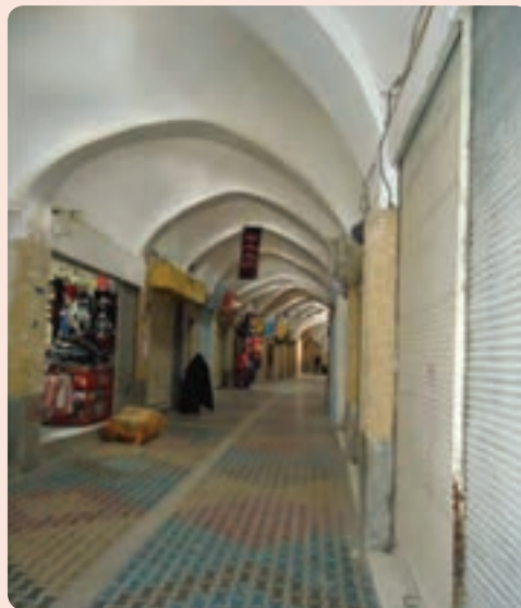
شکل ۵-۴. بازار سرپوشیده سمنان