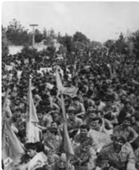
شکل ۶-۴- اعزام نیروهای مردمی از استان

روزنامه‌ها نوشتند: گروه کثیری از نیروهای تازه نفس رزمی طی یک اقدام سریع و فوق‌العاده از استان سمنان راهی جبهه‌های خون و شرف میهن اسلامی شدند.