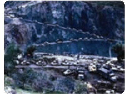
شکل ۷-۴- پشتیبانی جهاد سازندگی از جبهه‌های نبرد حق علیه باطل

احداث خاکریز، نصب پل، احداث جاده، بازسازی روستاها و شهرهای آسیب دیده به ویژه احداث جاده استراتژیک در عملیات طریق القدس در منطقه بستان و جاده سید الشهداء (ع) در جزیره مجنون از موارد مهم آن است. همچنین مدیریت قرارگاه حمزه سید الشهداء (ع) بر عهده جهاد استان بوده است که پذیرای ۱۲۰۰۰ نفر از رزمندگان جهادی استان و ۱۳۰۰۰ نفر از سایر استان‌ها بوده است. در مجموع تعداد ۱۱۳ نفر از رزمندگان جهاد سازندگی در طول ۸ سال دفاع مقدس به شهادت رسیدند.