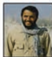
شهید سردار... امینیان مسئول جهادسازگی برای کلمه جهاد