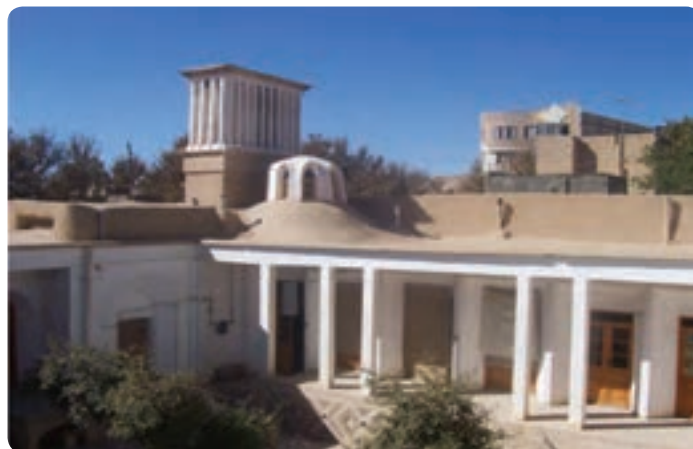
شکل ۳-۴- فضاهای زیستی اندرونی، سازگار با محیط و بادگیر در شاهرود