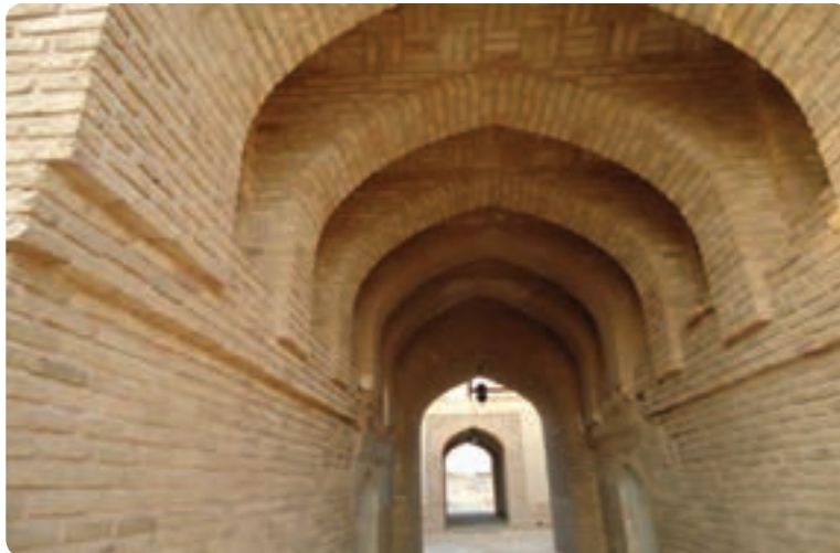
شکل ۲-۳- معماری سنتی (طاق‌های آجری) در سمنان

● معماری: به ساخت بنا و پرداختن به ظاهر و نمای ساختمانی هنر معماری می‌گویند که ریشه در فرهنگ هر قوم دارد. معماری استان سمنان نیز مانند معماری ایران آمیخته‌ای از فرهنگ باستانی و اسلامی است که در هر منطقه با توجه به شرایط محیطی و مصالح نمود پیدا می‌کند. از جمله می‌توان به نوع گنبدها، طاق‌ها و نقوش به کار رفته در بناهای تاریخی استان اشاره کرد که گویای سبک خاص معماری ایرانی و اسلامی است.