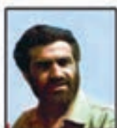
شهید حسن نوکند پور جانشین کسبک کل سیه