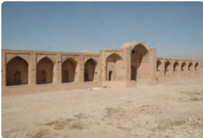
شکل ۴-۴- نمونه‌ای از کاروانسرای شاه عباسی ایوانکی در شهرستان گرمسار

شاه عباس صفوی (۱۰۳۸-۹۹۶) هجری قمری که از طریق اصفهان، جندق و قومس پیاده به مشهد مسافرت کرده بود برای ایجاد ارتباط بین شهرها و آبادی‌ها در سراسر کشور، فرمان‌هایی صادر کرد. در ایالت قومس نیز به دلیل قرار گرفتن در مسیر زیارتی مشهد مقدس دستور ساخت راه‌ها، کاروانسراها، آب‌انبارها، پل‌ها و بناهای عام‌المنفعه بسیاری را داد.