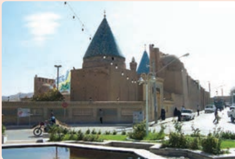
شکل ۱۱-۴- آرامگاه عارف بزرگ بایزید بسطامی، بسطام در شهرستان شاهرود

بایزید بسطامی : بایزید بسطامی ملقب به سلطان العارفين از جمله عرفای نامدار ایران است که در سال ۱۰۱ هجری قمری در خانواده‌ای مذهبی در بسطام دیده به جهان گشود. شخصیت وی چنان مورد توجه اهل دل و صاحبان قلم و اندیشه عرفانی بوده که از او به تعبیری مانند سلطان العارفين، برهان الموحدين، مراد السالکين، برهان المحققين، حجت الخلاق و مرشد السالکين یاد می‌شود. از نوشته‌های منتسب به ایشان کتاب‌های النور و دستورالجمهور است. بایزید در سال ۱۸۰ هجری قمری از دنیا رفت. آرامگاه ایشان در شهر بسطام در جوار مرقد امام زاده محمد بن صادق (ع) است.