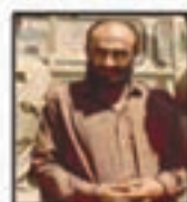
شهید حاج برنسی نائینی فرمانده پدافندی جنگ جبهه جنوب