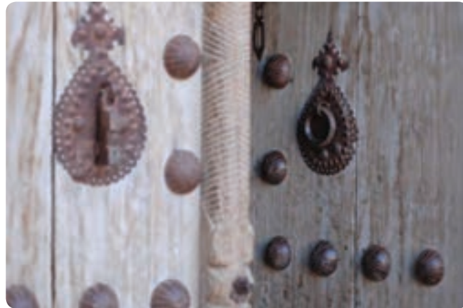
شکل ۳-۳- نقوش روی در و انواع کوبه

و رف‌های کوچک، اجرای انواع سقف به صورت گنبدی، مسطح، شیب‌دار و ... می‌توان برشمرد.