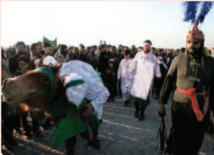
شکل ۱-۳- مراسم تعزیه خوانی ایام محرم در استان