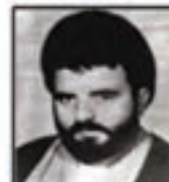
شهید سید احمد لوی فرمانده سیه پدافندی