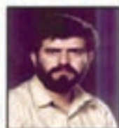
شهید سید حسن تکلیفانی نماینده مجلس و منطقه امام فر روزنامه کیهان