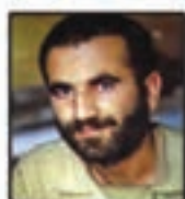
شهید حاج محمود انصاری مسئول مبارزات ۲۲ طی از ایستگاه ۱۰