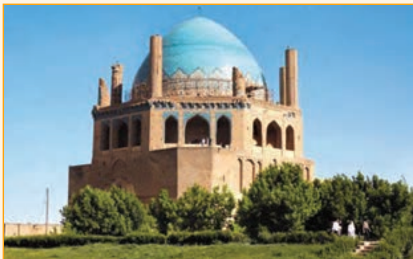
شکل ۱۳-۴- گنبد عظیم سلطانیه

در آن سرزمین وسیع در مدت ده سال بناهای سلطنتی و حکومتی، مساجد، خانقاه‌ها، داروخانه، حمام، کتابخانه، بازار، دکان‌ها و کارگاه‌های صنایع دستی و مراکز رفاهی چون کاروانسراها و آب‌انبارها و غیره را پدید آوردند. هر یک از بناها به گفته شاهدان به بهترین نوع هنری و ذوقی مزین به باغ‌ها و بوستان‌ها و چشمه‌ها و جویبارها در شهر جدید ایجاد شد.