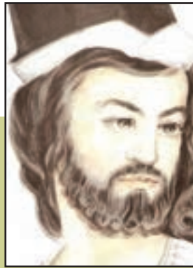
شکل ۱۷-۴- سهروردی (شیخ اشراق)