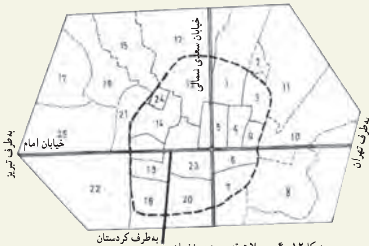
شکل ۱۲-۴- محلات قدیمی شهر زنجان