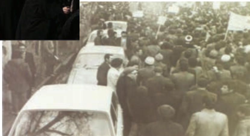
شکل ۱۱-۴- اولین تظاهرات علنی استان علیه رژیم