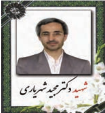
شکل ۱۵-۴- شهید دانشمند دکتر مجید شهبازی

آیا در محل زندگی خود شخصیت‌هایی را می‌شناسید که به جدول ۲-۴- اضافه نمایید؟