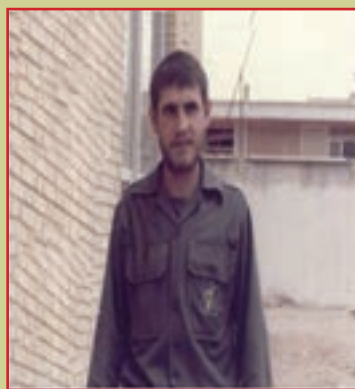
شهید قامت بیات فرمانده تیپ الهادی