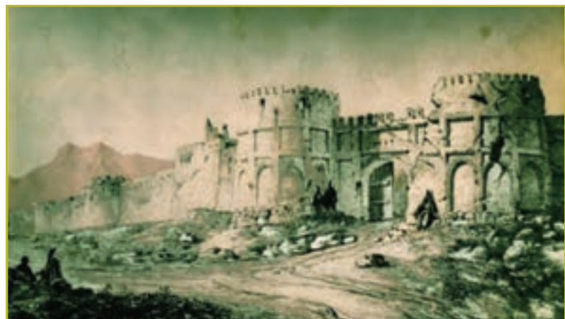
شکل ۷-۴- برج و باروی زنجان

همچنین در این دوره، این منطقه از نظر اقتصادی و فرهنگی و هنری دارای رونق چشمگیری بوده است. بیشتر آثار تاریخی و مذهبی استان زنجان، مانند: مساجد جامع قروه، سجاس، گلابر، کاروانسرای نیک بی، سرچم، آثار تاریخی سلطانیه، خدابنده و ابهر در این زمان ساخته شده اند.