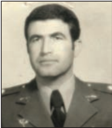
شکل ۲۶-۴- سرلشکر شهید مخبری