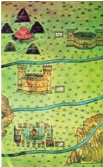
شکل ۶-۴- کاروان سرای سرچم

تا هنگام تسلط کامل سلجوقیان بر سرزمین ایران، زنجان نیز مانند دیگر شهرهای این منطقه، هرازگاهی در دست امیری بود، گاه زیدیان طبرستان و گاه آل بویه و گاه آل زیار بر آن حاکم می شدند.