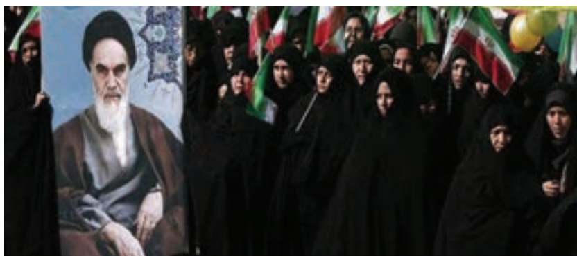
شکل ۱۰-۴- زنان در استان زنجان در پیروزی انقلاب نقش به‌سزایی داشتند