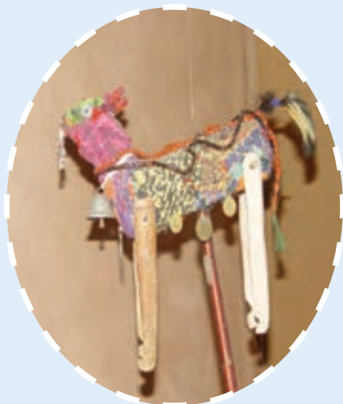
شکل ۹-۳- تصویری از «تکم» در روستا

نوروز یکی از مهم‌ترین اعیاد مردم آذربایجان شرقی است. مردم از فصل سبز و زاینده‌گی طبیعت با نام‌هایی چون: نوروز بایرامی، ایل بایرامی یاد می‌کنند. در گذشته نه چندان دور با آمدن بیک‌های نوروز، این مراسم آغاز می‌شد. پنجاه روز مانده به عید سفیران نوروزی با آوازخوانی و دست‌افشانی رفتن زمستان سرد و طولانی و آمدن بهار سرسبز را به مردم مژده می‌دادند. مردم آمدن آن‌ها را به فال نیک می‌گرفتند و اعتقاد داشتند که سالی که بیک‌های نوروزی به راه می‌افتند، برای آن‌ها سالی پر محصول خواهد بود. بیک‌های نوروزی چند دسته بودند که یک دسته از آن‌ها تکم چی‌ها بودند. تکم نام پادشاه بزه‌است و آن را از چوب و دانه‌های رنگین درست می‌کردند و دم خروس برایش می‌گذاشتند. بعد آن را سوار تخته‌ای می‌کردند و با تکان دادن اهرمی که به شکم تکم وصل بود، آن را می‌رقصانند و درباره‌ی خوشبختی‌ها و بدبختی‌های تکم شعر می‌خواندند.