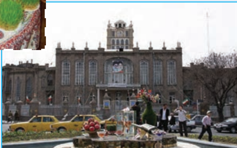
شکل ۱۰-۳- تصویری از مراسم عید نوروز در استان