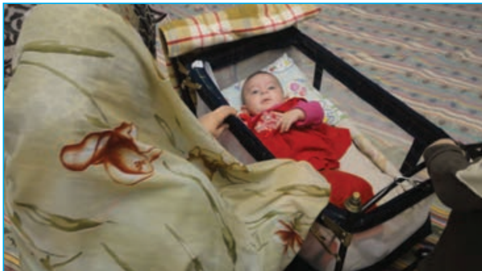
شکل ۶-۳- لالایی موجب آرامش جسم و روح مادر و کودک می‌شود.

لالایی‌ها بخش لطیفی از ادبیات شفاهی سرزمین ماست که به عنوان نخستین ارتباط کلامی مادر با کودک، مهر و محبت مادرانه را به طرز زیبایی در وجود کودکان جاری می‌سازد و موجب آرامش جسم و روح مادر و کودک می‌شود. از دیرباز در آذربایجان لالایی‌ها در فرهنگ عامیانه مردم جایگاه مهمی داشته است.