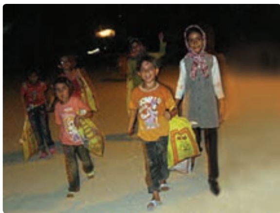
شکل ۱۱-۹- مراسم گره گشو در شهرستان دیر

به سبب آنکه این رسم در ماه مبارک رمضان صورت می گیرد می توان انجام آن را در اعتقادات مذهبی شیعیان جست و جو کرده و به روز تولد امام حسن مجتبی علیه السلام مربوط دانست.