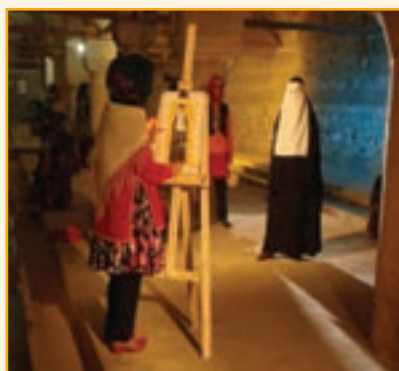
شکل ۳-۴- نمونه‌ای از لباس‌های محلی استان