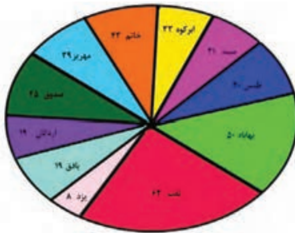
نمودار ۱-۲- جمعیت روستایی شهرستان‌های استان یزد به درصد، سال ۱۳۸۵