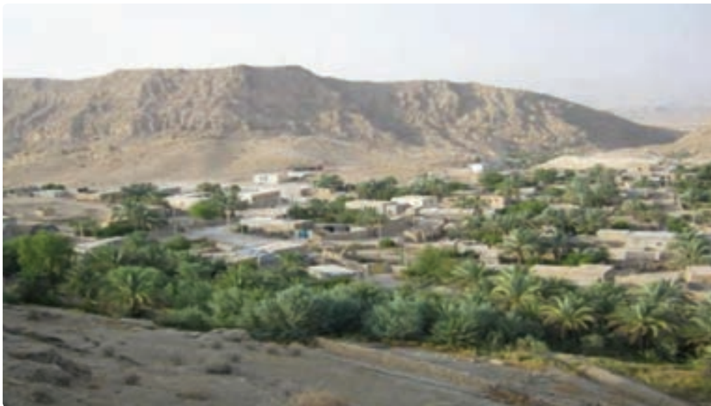
شکل ۵-۷- روستای کوهستانی سرمک

— خاک : وجود خاک‌های شور در بیشتر نقاط استان مانع جدی در استقرار روستاهای استان بوده است. دشت‌های دامنه‌ای به دلیل نداشتن محدودیت‌های خاک نواحی کوهستانی و دشت‌های پست از شرایط مساعد و مناسب طبیعی برخوردار و امکان استقرار جمعیت را فراهم آورده‌اند.