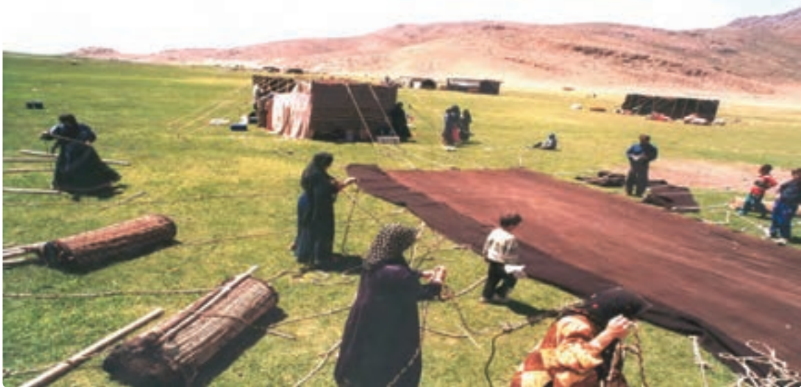
شکل ۴-۷- سیاه جادر از صنایع دستی عشایر قشقایی