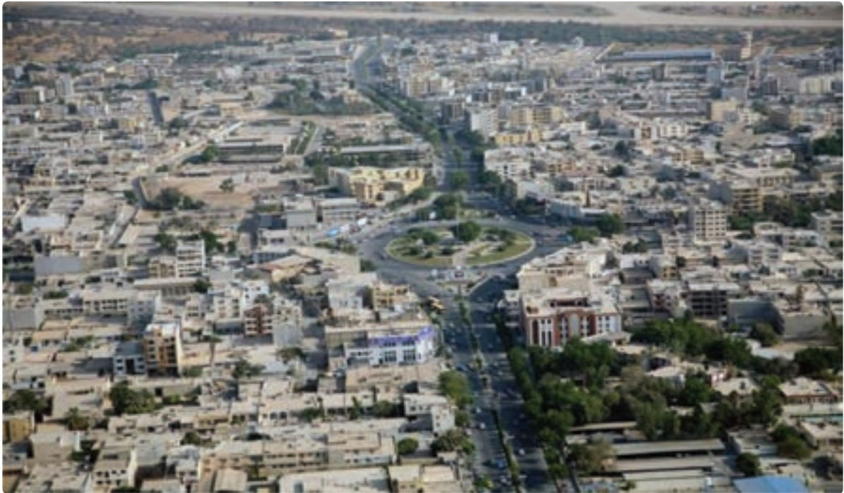
شکل ۷-۷- نمایی از شهر بوشهر

قدیمی‌ترین نشانه‌های به‌دست آمده از سکونت انسان در سرزمین بوشهر به دوران حکومت ایلامی‌ها و تمدن بین‌النهرین برمی‌گردد. منطقه تجاری بوشهر در آن زمان دهکده‌ای به نام لیان بود. از دوره هخامنشیان نیز آثار با ارزشی در شهرستان دشتستان کشف شده است. در زمان اردشیر بابکان شهر رام اردشیر در دو فرسنگی شهر بوشهر بنا گذاشته شد که اکنون به نام ریشهر معروف است. نحوه شکل‌گیری مراکز شهری استان بیانگر استقرار جمعیت و فعالیت‌های اقتصادی وابسته به منابع آب و فعالیت‌های مرتبط با دریا در ساحل می‌باشد. شکل‌گیری این مراکز از شمالی‌ترین نقطه استان تا جنوبی‌ترین آن که عمدتاً بر روی نوار ساحلی، دشت‌ها و کوهپایه‌ها بوده که نشانگر توزیع مناسب آنها از نظر استقرار و فاصله بین این مراکز است. شهر بوشهر به‌عنوان مرکز استان و دیگر شهرهای ساحلی از دیرباز مراکز تجارت و فعالیت‌های بندری بوده‌اند.