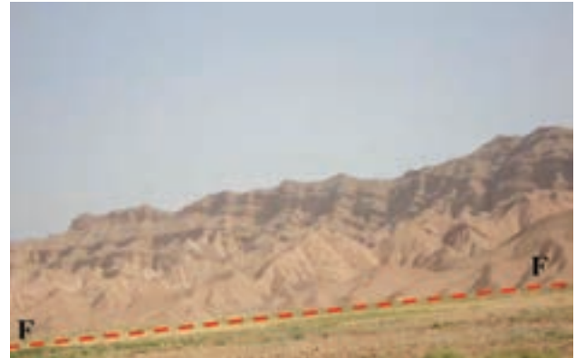
شکل ۶۲-۱ گسل امین آباد از گسل‌های فعال استان

سیل: بعد از زلزله، سیل مخرب‌ترین خطر طبیعی استان به حساب می‌آید. خراسان شمالی از نظر وقوع سیلاب در بین استان‌های کشور جایگاه دوم را دارد.