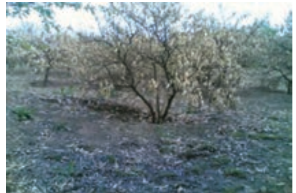
شکل ۶۹-۱- آمار سرمازدگی در باغات استان