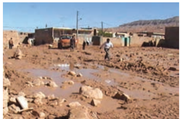
شکل ۶۴-۱ ورود سیلاب‌ها به مناطق مسکونی روستای فرتان اسفراین