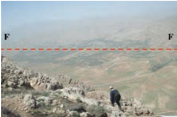
شکل ۶۳-۱ گسل سالوک از گسل‌های فعال استان

آخرین فعالیت گسل‌های استان مربوط به گسل امین آباد، در شمال غرب شهر اسفراین است که منجر به زمین لرزه‌ای با قدرت ۴/۵ درجه در مقیاس ریشتر شد. این زمین لرزه در نیمه شب جمعه ۱۸ آذرماه ۱۳۹۰ بر اثر فعال شدن قسمت شمال غربی این گسل رخ داد. این زلزله خسارات مالی و جانی نداشت ولی سبب ترس و وحشت مردم شد.