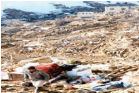
شکل ۶۰- روستای ناوه پس از زلزله

زلزله : زلزله مخرب‌ترین پدیده طبیعی است که همه ساله خسارت‌های جانی و مالی زیادی به انسان‌ها وارد می‌کند. خراسان شمالی از استان‌های زلزله خیز کشور است. به علت فراوانی و طول زیاد گسل‌ها و جوان بودن چین‌خوردگی‌ها در استان، تاکنون زلزله‌های بسیاری در این استان به وقوع پیوسته است. از مخرب‌ترین آنها می‌توان به زمین لرزه‌های سال ۱۳۵۲ دهنه اجاق در شهرستان اسفراین و زلزله ۱۹ بهمن سال ۱۳۷۵ روستای ناوه در شهرستان بجنورد اشاره نمود. هر چند، زلزله‌ها، سبب تخریب ساختمان‌ها می‌شوند ولی رعایت نکات ایمنی در ساختمان سازی می‌تواند تا حدودی از خسارات آن بکاهد. تأثیر این نکته را در مقایسه شکل‌های (۱-۵۹) و (۱-۶۰) می‌توانید به خوبی مشاهده کنید.