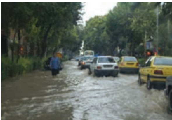
شکل ۶۵-۱ آبگرفتگی خیابان‌های شهر بجنورد در سیلاب سال ۱۳۸۷

علل وقوع سیلاب در استان منشأ طبیعی و انسانی دارد. از مهم‌ترین دلایل طبیعی آن می‌توان به ذوب ناگهانی برف و یخ در کوهستان‌ها، بارش‌های رگباری، کم شدن پوشش گیاهی و شیب زمین و از مهم‌ترین عوامل انسانی می‌توان به عدم اعمال مدیریت صحیح در حوضه‌های آبخیز، برداشت غیر اصولی مصالح رودخانه‌ای، تجاوز به حریم رودخانه‌ها، توسعه شهرها و روستاها در عرصه‌های سیل گیر اشاره نمود.