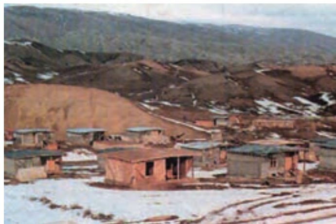
شکل ۶۱- بازسازی روستای زده توپ چنار شهرستان مانه و سملقان با استفاده از اسکلت زوگالی (چوبی)