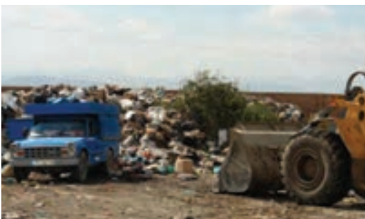
شکل ۷۳-۱- شیوه‌های نامناسب جمع‌آوری، انتقال و دفن زباله در استان