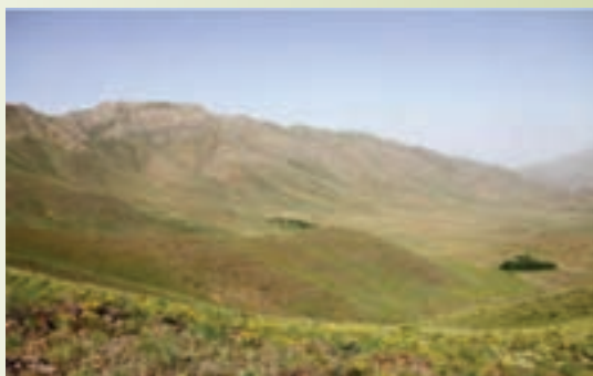
شکل ۱-۷۴- منطقه حفاظت شده لشگردر - ملایر

منطقه حفاظت شده لشگردر: این منطقه در جنوب شرقی شهر ملایر و در ۹۰ کیلومتری شهر همدان در محاصره ۱۴ روستای مجاور از جمله جوزان، مانیزان، فروز، ازناوله، زنگنه و احمد روغنی است و به لحاظ طبیعت مساعد از نظر آب، پوشش گیاهی و شرایط اقلیمی، همواره زیستگاه مناسبی برای جانوران و پرندگان است.