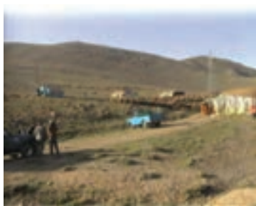
شکل ۱-۶۷- مدیریت و نظارت بر چرا