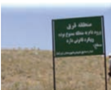
شکل ۱-۶۸- حفاظت و قرق مراتع